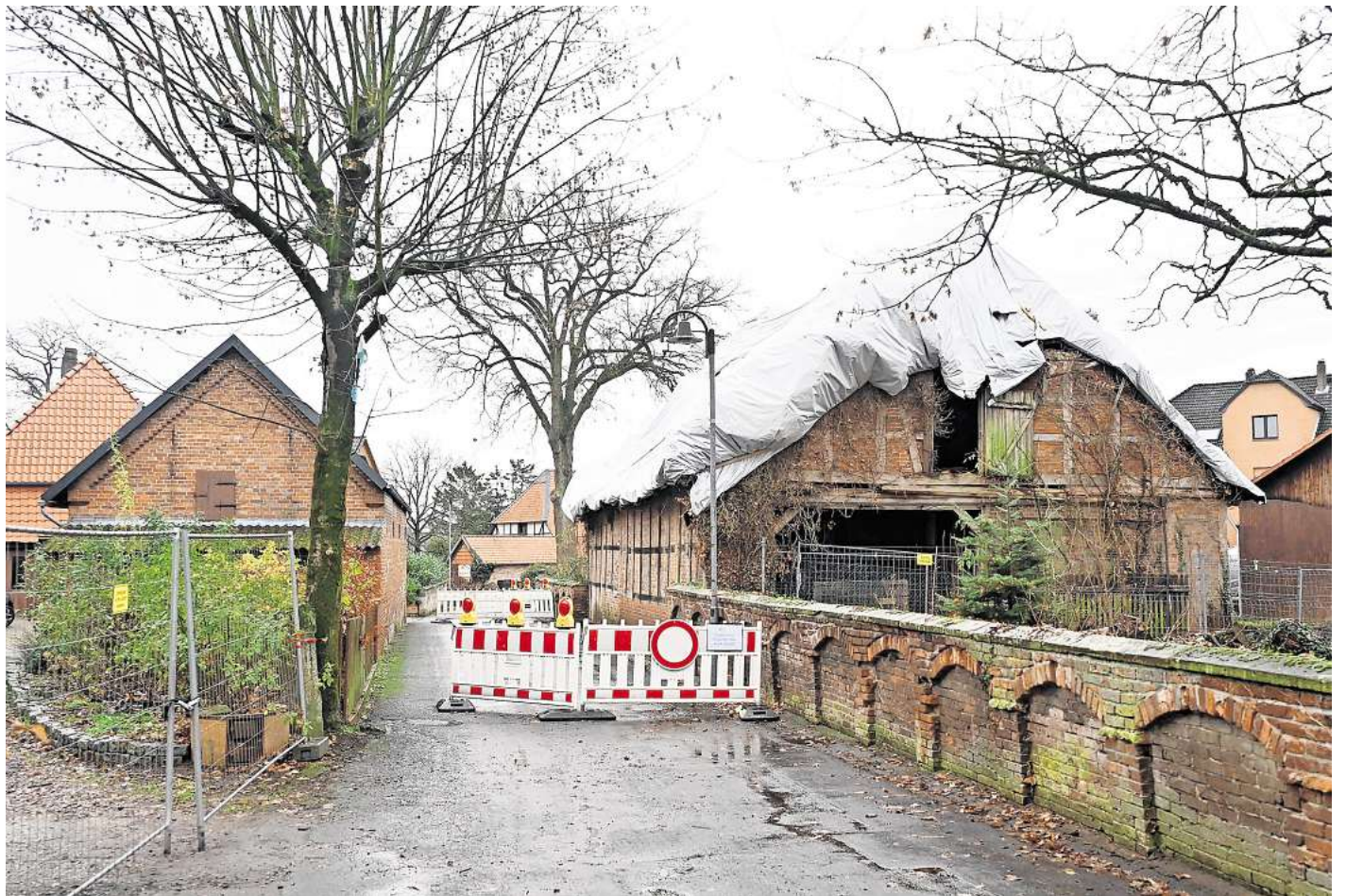
Sackgasse: Die Wipperstraße in Edemissen ist teilweise gesperrt, da eine Scheune als einsturzgefährdet gilt. Man könnte vermuten, das marode Gebäude gehört zum angrenzenden Hof auf der rechten Seite, das ist aber nicht so.

Seit zwei Monaten sind Teile der Wipperstraße nun schon gesperrt. Viele vermuten, die 1833 erbaute Scheune gehört zum unmittelbar angrenzenden Hof auf der gleichen Straßenseite, doch dem es nicht so. Das Gebäude gehört kurioserweise zu einem Grundstück auf der anderen Straßenseite. Die Lage scheint