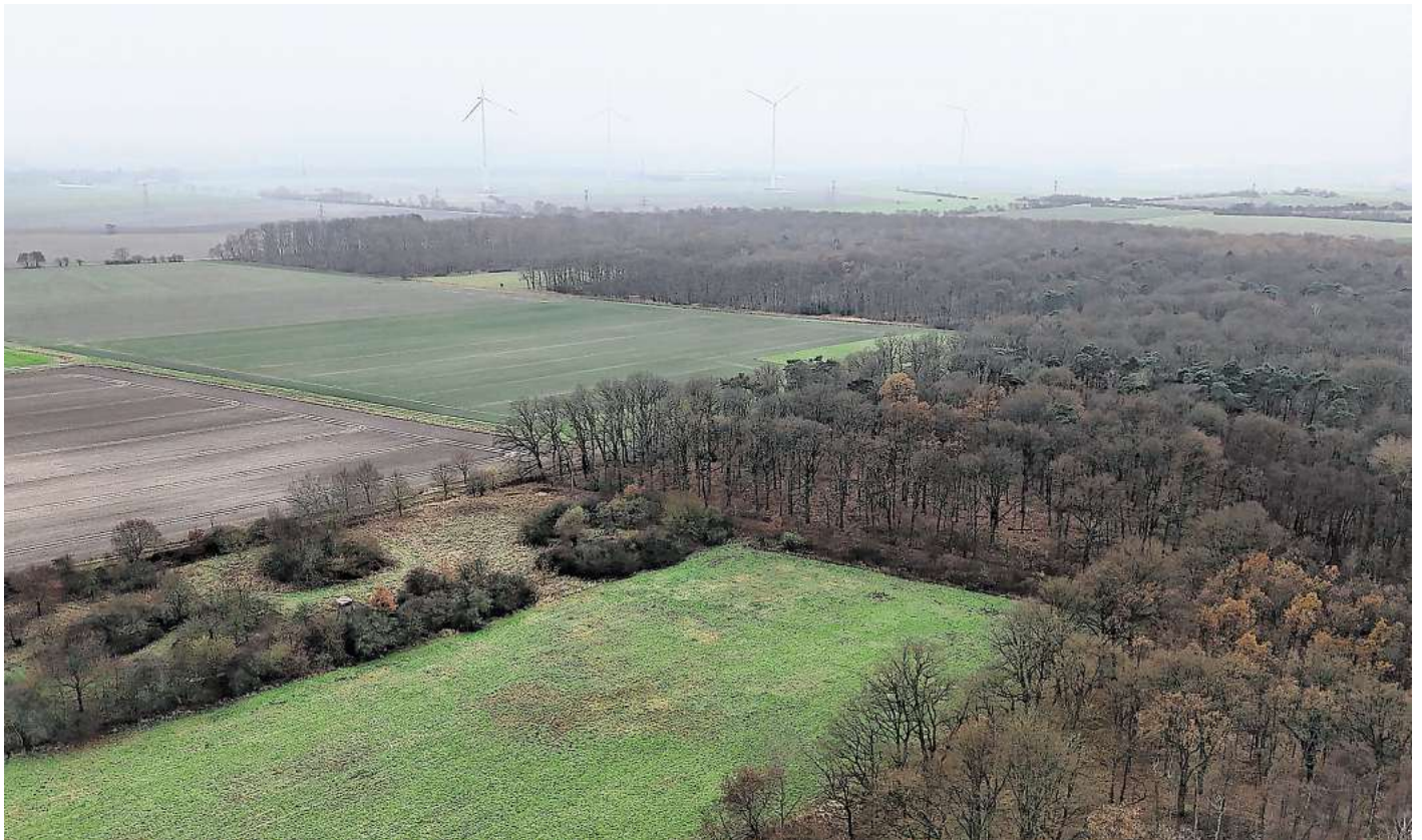
Blick auf den Hainwald: In einem abgelegenen Teil des Waldes entdeckte ein Jäger menschliche Überreste.

Die Polizei gibt dazu derzeit keine Informationen, bestätigt aber, dass „auch bislang ungeklärte Vermisstenfälle der Region im Rahmen der Ermittlungen berücksichtigt werden“. Es