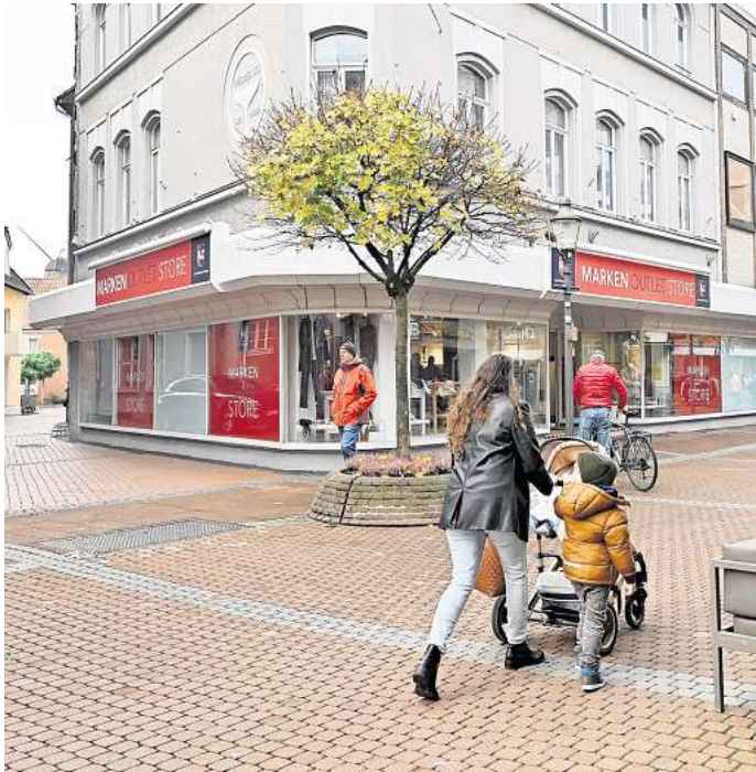
Geschäfte – wie der Marken-Outlet-Store – schließen, andere eröffnen neu: Die Peiner Innenstadt ist im Wandel.

Tedi bestätigt, Anfang 2026 eine dritte Peiner Filiale eröffnen zu wollen – allerdings im ersten Obergeschoss der Galerie. „Einen konkreten Neueröffnungstermin [...] können wir Ihnen zum jetzigen Zeitpunkt nicht nennen“, teilt eine Unternehmenssprecherin mit. Die be-