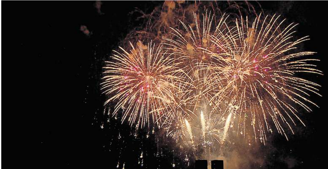
Bunte Raketen erhellen den Nachthimmel - doch die Debatte über ein Böllerverbot hält an.

Eine Silvester-Tradition, die immer wieder für hitzige Diskussionen sorgt, sind die lauten Böller oder das bunte Feuer-