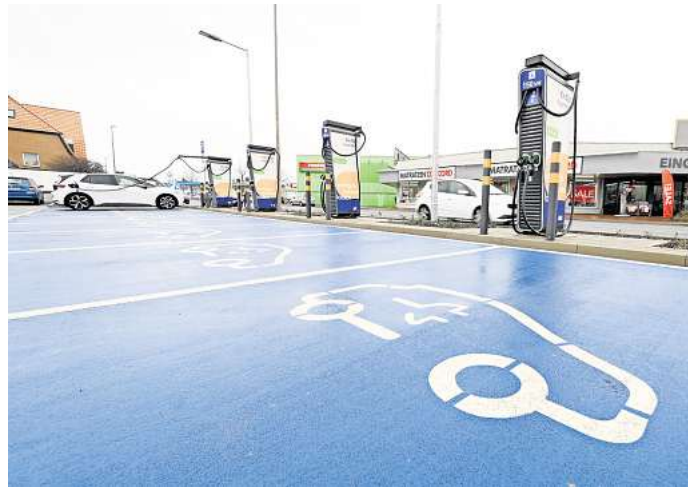
Es gibt sie, aber es sind noch zu wenig: Diese E-Ladesäulen befinden sich am Rewe-Markt an der Celler Straße.

Ziel sei es nun, private Investoren zu finden, die Ausbau und Betrieb der Ladesäulen übernehmen. Der Bund habe zu diesem Zweck Vorlagen zur Vergabe des Ladeinfrastruktur-Ausbaus als Ausschreibung oder Konzession durch Kommunen erarbeitet. Dabei sollen mehrere Standorte gebündelt werden, um auch wirtschaftlich vermeintlich unattraktive Standorte umset-