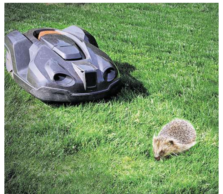
Weil durch den nächtlichen Einsatz von Mährobotern Igel getötet werden können, hat der Landkreis Peine nun auf einen Antrag der Peiner Bio AG reagiert.