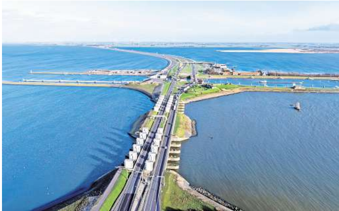
Kornwerderzand: Mehr Durchfahrtsort als Insel und doch ein Geheimtipp in den Niederlanden.

Kornwerderzand entstand in den 1920er-Jahren als Arbeitsinsel, von der aus der monumentale Deich Afsluitdijk gebaut wurde. Damals trennte er die salzige Nordsee-Bucht Zuiderzee vom zukünftigen IJsselmeer – ein Jahrhundertprojekt