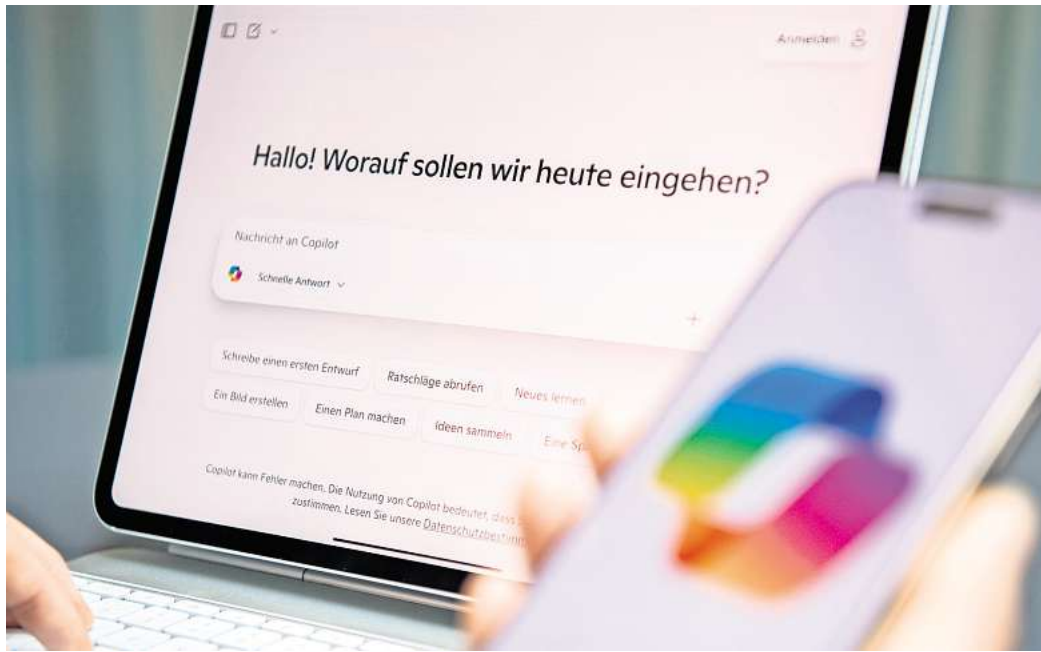
Ob zur Inspiration oder als Organisationshelfer: Wer Chatbots clever einsetzt, kann sich im Arbeitsalltag Erleichterung verschaffen.

KI Assistenten können jede Menge. Zum Beispiel: den Arbeitsalltag strukturieren,