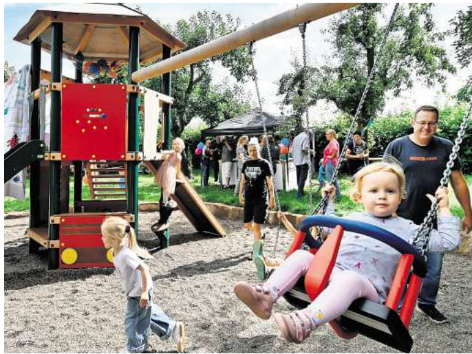
Im Landkreis Peine gibt es immer weniger Kinder: Müssen nun Kitas schließen?