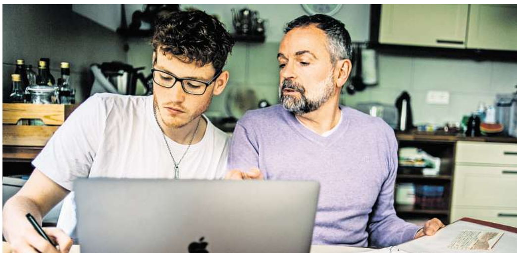
Notfallordner erstellt? Dann sollte Ihre Vertrauensperson auch wissen, wo dieser zu finden ist.

Vertrauensperson den Aufbewahrungsort der Mappe mitzuteilen, sofern sie ihr nicht ohnehin ein Duplikat aushändigen. (DPA)