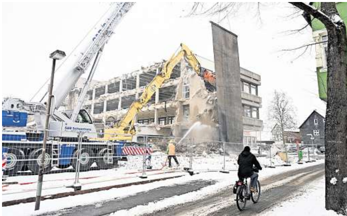
Abriss des alten Postgebäudes in Peine: Eine große Schutzplane wurde an einem Schwerlastkran aufgehängt.

Trotz Winterwetter- das Fachunternehmen versucht so zügig wie möglich weiterzuarbeiten, um weiterhin im Zeitplan zu bleiben. „Sobald das Gebäude zerlegt ist und die Abfälle getrennt wurden, erfolgt die Abfuhr – das soll noch im Januar 2026 erfolgen“, erläutert Christoph Wilhelm, Sprecher des Investors Cureus. Der Bauprojektentwickler aus Hamburg will auf dem riesigen Areal eine Seniorenresidenz mit 124 Pflege-