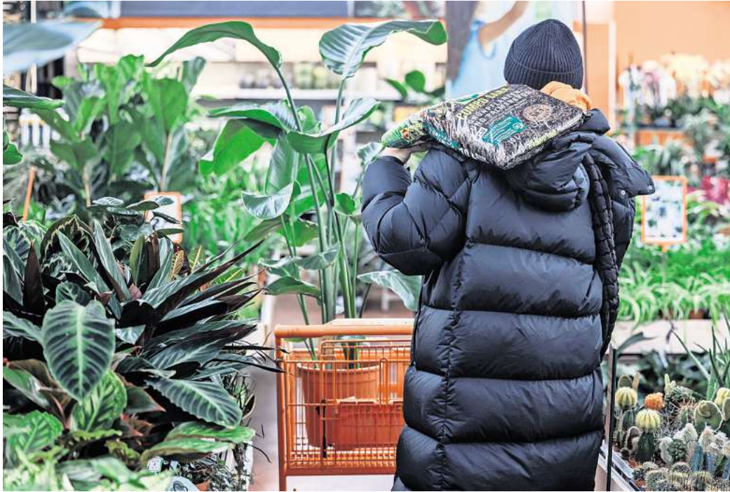
Neue Pflanzen fürs Zuhause: Bereits im Laden lohnt ein genauer Blick auf Topf und Blätter.