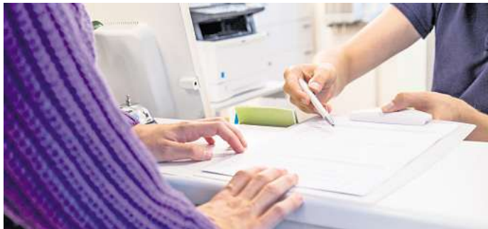
Wichtige Informationen sollten im Anamnesebogen angegeben werden.

Vorsicht ist bei zusätzlichen Formularen geboten, etwa zu Individuellen Gesundheitsleistungen (IGeL). Diese sind meist selbst zu zahlen. Über Nutzen, Risiken und Kosten müssen Patienten vorher mündlich aufgeklärt werden. (DPA)