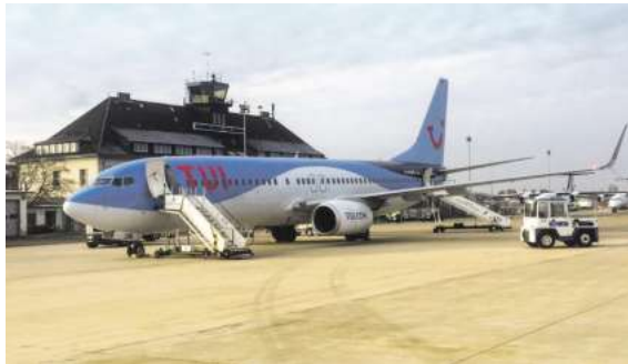
Ab Braunschweig direkt in die Sonne. Mit momento und TUIfly im Frühjahr/Sommer abheben.

Den Katalog, weitere Informationen und Buchungsmöglichkeiten dieser exklusiven Angebote erhalten Sie unter der kostenfreien Buchungshotline T. 08 00 / 38 300 38 (Mo-Fr. 9-18, Sa. 9-13 Uhr), in den FIRST Reisebüro Schmidt und weiteren Reisebüros der Region oder unter www.fliegen-ab-braunschweig.de .