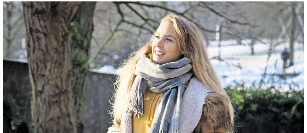
Mittagspause oder Feierabend heißen: Spaziergang. Feste Routinen erleichtern uns das Dranbleiben.