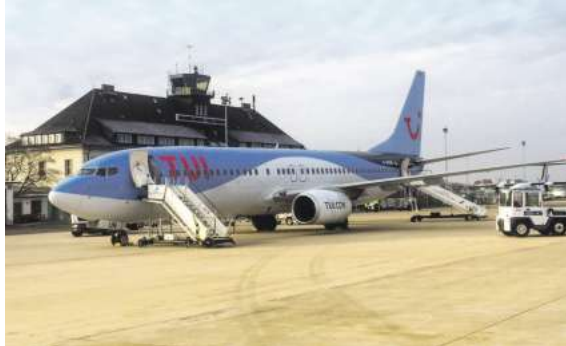
Ab Braunschweig direkt nach Bella Italia und zu anderen Zielen: exklusiv mit momento