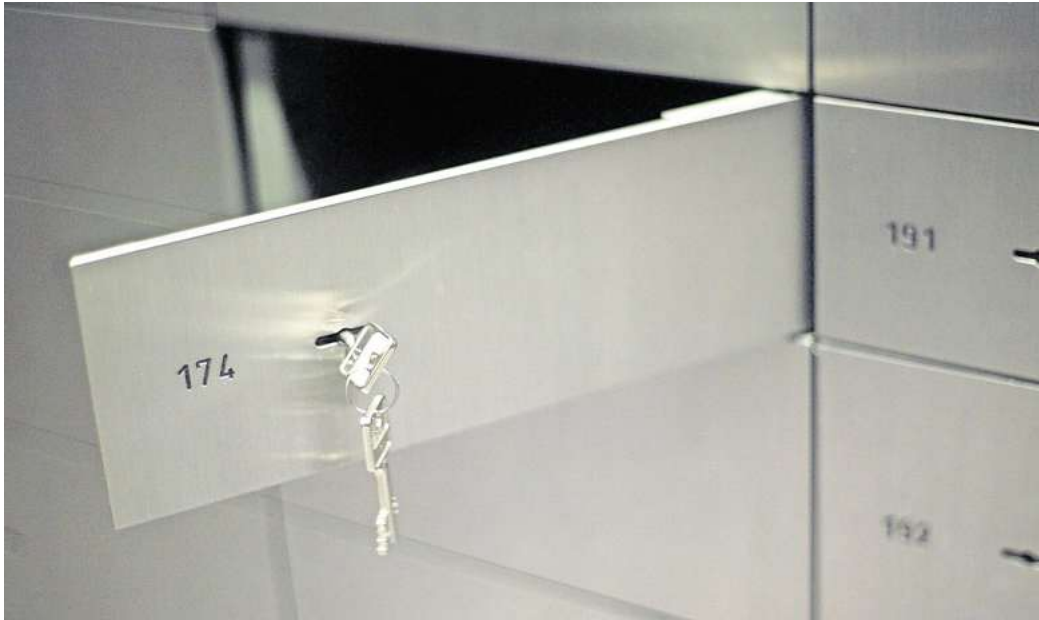
Die Versicherungssumme für Schließfachinhalte ist oft begrenzt: Ein Blick in die Vertragsunterlagen schafft Klarheit über den Schutzzumfang.