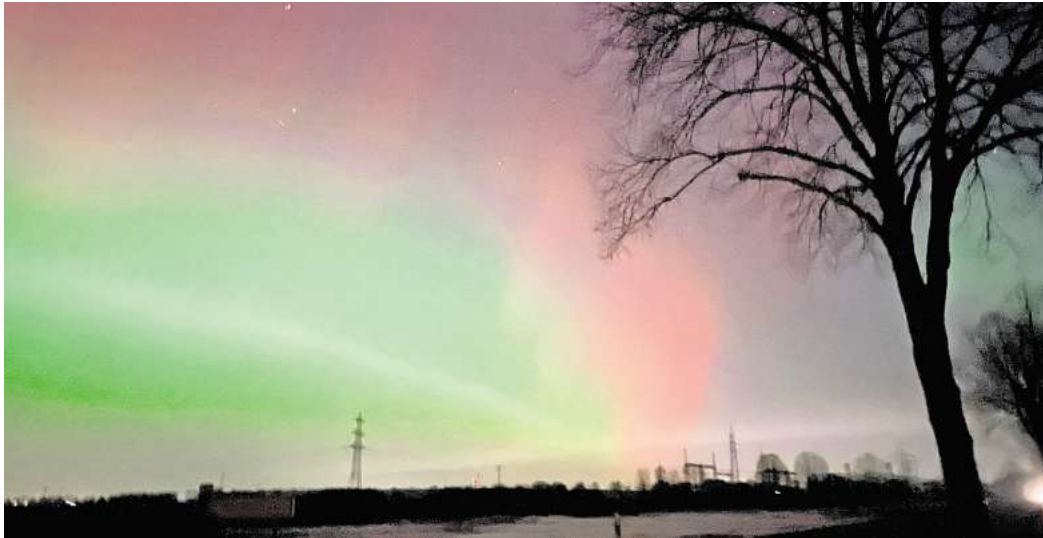
Eine Auswahl mit Polarlichtern von Bettina Hinz aus Sonnenberg/Vechelde.