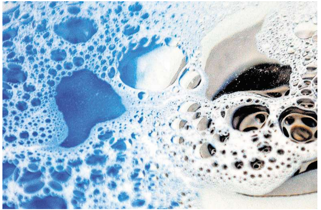
Hausmittel wie Natron, Essig und heißes Wasser helfen, leichte Verstopfungen im Abfluss zu beseitigen und sind eine umweltfreundliche Alternative zu chemischen Reinigern.

Gut zu wissen: Abflussverstopfungen beugt man am besten mit Abflusssieben vor. Sie verhindern, dass lange Haare oder Essensreste beim Spülen in die Abwasserleitungen gelangen. Die Verbraucherzentrale NRW rät zudem, einmal wöchentlich kochendes Wasser in die Abflüsse von Bad und Küche zu kippen. Dies hilft, Fett- und Seifenreste zu lösen und wegzuspülen. (DPA)