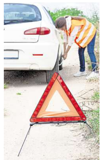
Die Unfallstelle absichern: Ein Warndreieck muss im Auto sein.

Notieren Sie sich: Amtliche Kennzeichen der beteiligten