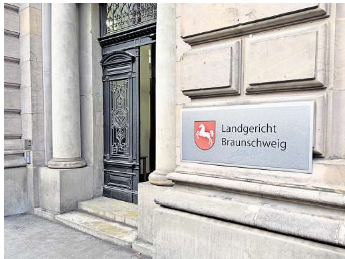
Das Landgericht Braunschweig: Hier wird der Fall verhandelt.

Das Geld landete nicht direkt auf dem Gemeinschaftskonto, sondern auf vielen Konten bei mindestens zehn unterschiedlichen Banken. „Bei diesen gab es auch immer wieder laufende Kredite“, sagte die Zeugin. Der Angeklagte und seine Frau hatten ein Haus abzubezahlen, „aber allein das kann es nicht gewesen sein“, meinte die Polizistin hinsichtlich der Geldabzweigung-