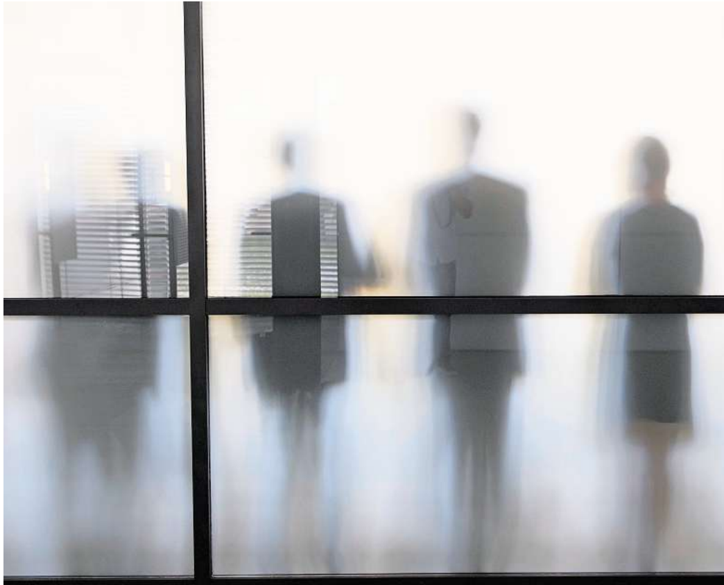
Kleine Notlügen im Job sind alltäglich: Oft geht es darum, sich selbst oder andere zu schützen.