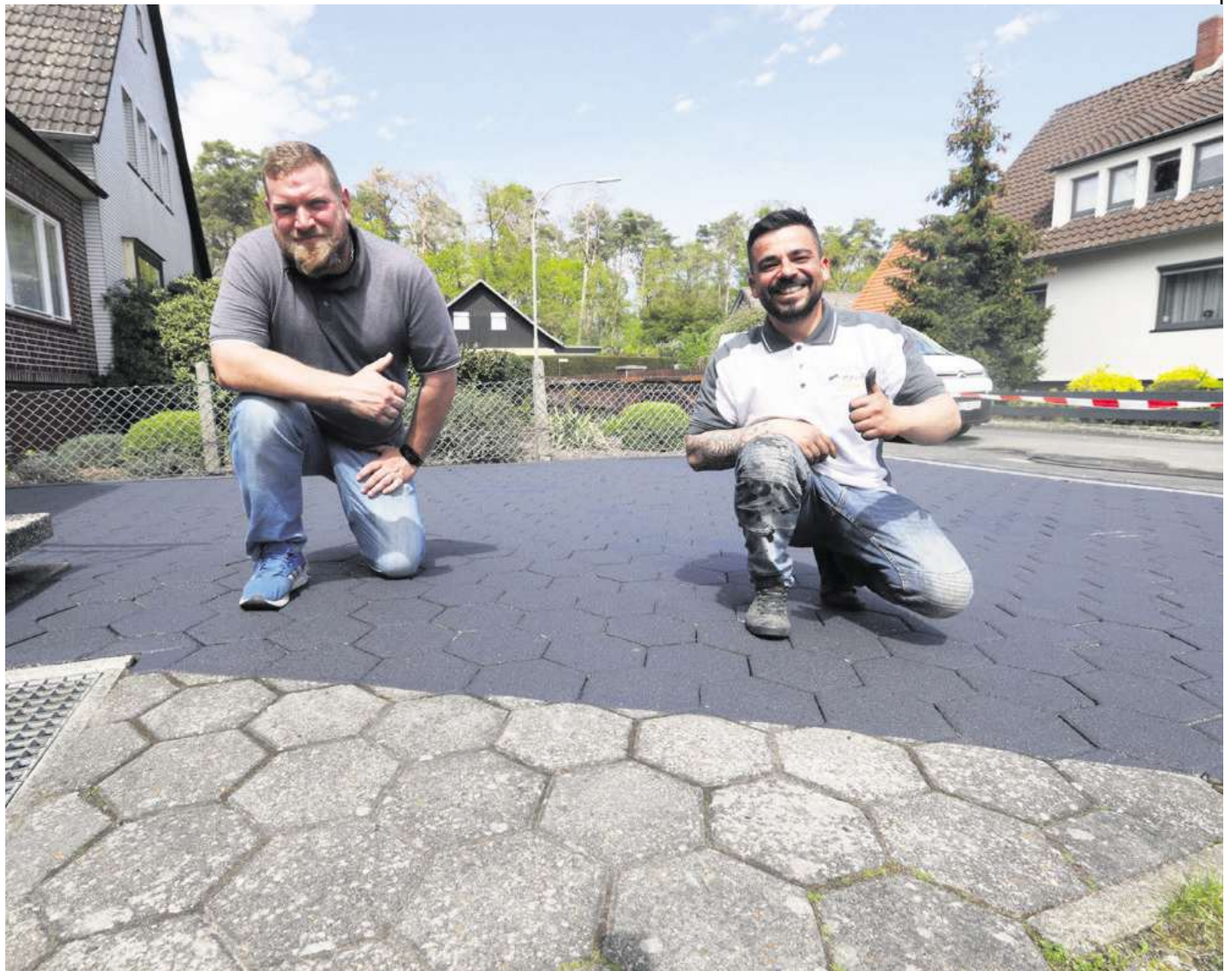
Eine mit dem ‚Steinfresh®‘-Verfahren sanierte Pflasterung. Das geniale Pflegesystem verhindert Flechten und Schwarzalgen.