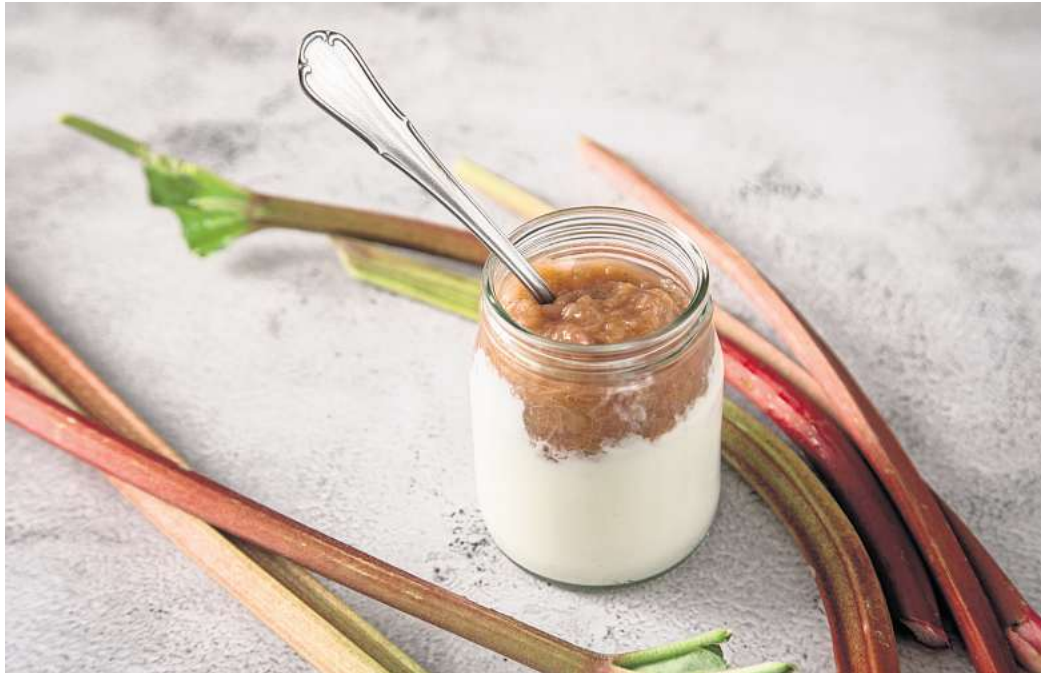
Mehrweg- oder Einwegglas? Geht es um die Nachhaltigkeit von Verpackungen, ist das eine wichtige Frage.

Geht es um die gesamte Ökobilanz von Verpackungen, reicht es Istel zufolge aber nicht, nur die Umweltauswirkungen der Materialproduktion zu betrachten. Wichtige Kriterien sind auch, wie viel Material man für die Verpackung benötigt, wie viel Treibhausgas und Schadstoffe durch den Transport ausgestoßen werden und wie gut sich das Material