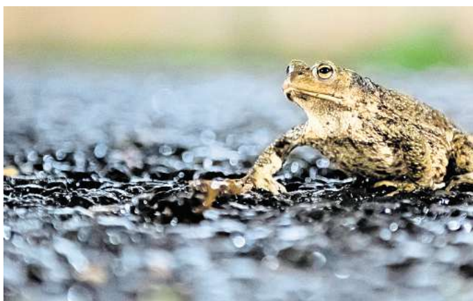
Gefährliche Reise: Jedes Jahr sterben Tausende Amphibien auf Straßen während ihrer Wanderung zu den Laichgewässern.