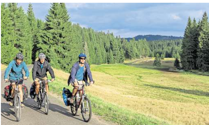
Bad Gottesgab auf der tschechischen Seite des Gebirges bietet sich für Wanderungen und Radtouren an.

Ebenfalls sehr empfehlenswert ist ein Besuch des Schlosses Augustusburg. Hoch über der Stadt gelegen, bietet das Renaissanceschloss nicht nur spannende Museen, sondern auch einen fantastischen Blick über das Erzgebirge. Der Ausflug lässt sich ideal mit einer Wanderung oder einem Spaziergang rund um das Schlossgelände verbinden.