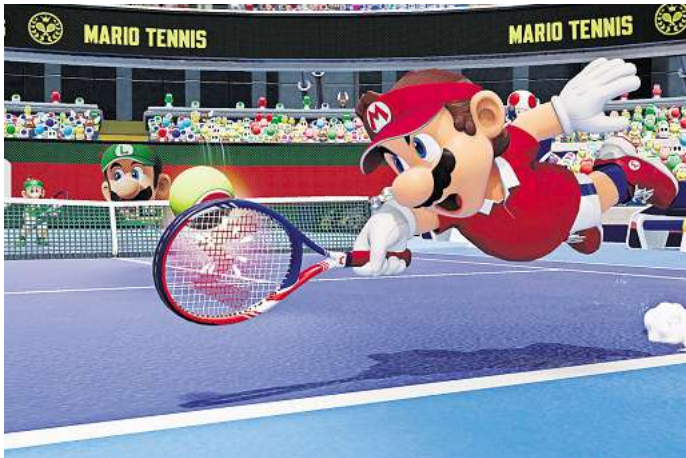
Super Mario! - Den Hechtsprung hätte auch Boris Becker nicht besser hinbekommen.

Das Interessante: Fever-Schlag-Bälle können teilweise auch zum Gegenspieler zurückgegeben werden. So wird der Ballwechsel noch intensiver, wenn es nicht nur um einen Punkterfolg geht, sondern auch darum, wer auf seiner Seite dem Schlamm ausweichen muss. Insbesondere bei einem Doppel kann das bei ver-