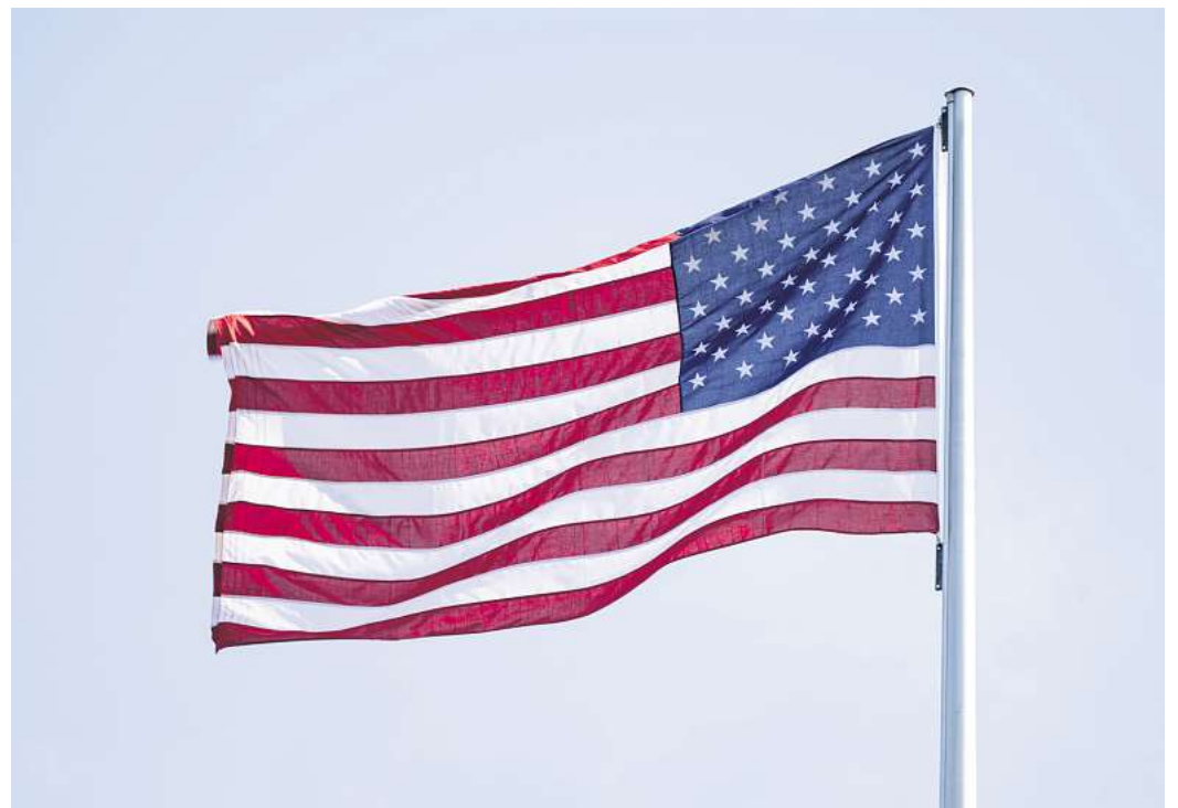
Die USA sind ein Traumziel für viele Menschen - doch aktuell herrscht Verunsicherung.