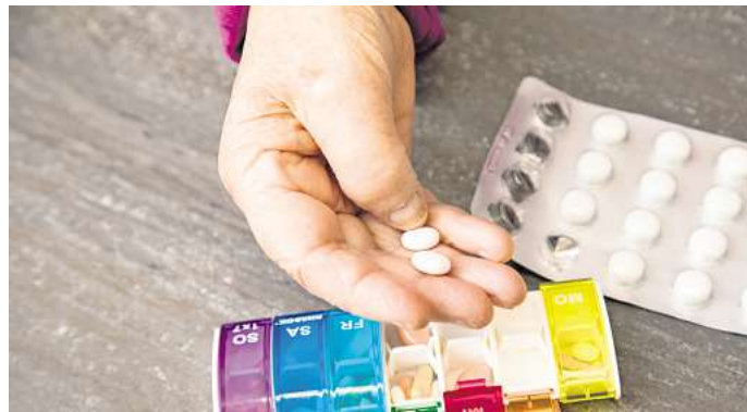
Die Einnahme von Medikamenten sollten Gläubige während des Fastenmonats Ramadan nicht eigenständig unterbrechen oder verändern.

Zu Problemen kann es mitunter bei entwässernden Medikamenten kommen. Wird beim Fasten tagsüber auf Getränke verzichtet, kann eine Anpas-