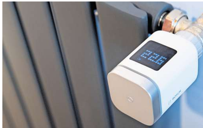
Wer Heizung und Haus clever modernisiert, kann langfristig richtig sparen.