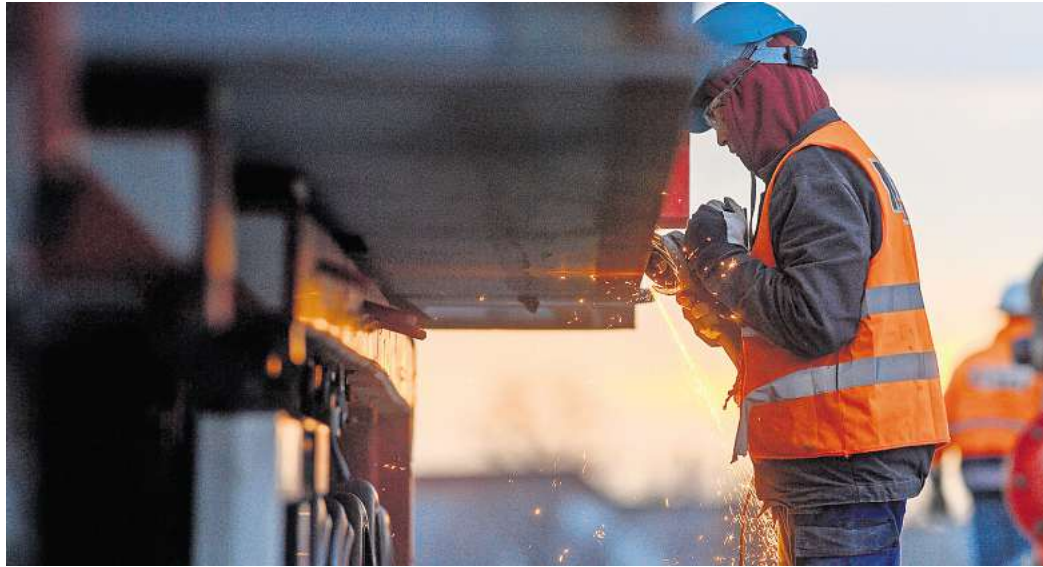
Arbeitsunfälle passieren schnell: Durch gezielte Prävention und die Anpassung von Arbeitsabläufen lassen sich Risiken effektiv minimieren und Unfälle vermeiden.

Nach einem Arbeits- oder Wegeunfall (Unfall auf dem Arbeitsweg), der behandlungsbedürftig ist, müssen Arbeitnehmer zu einem Durchgangsarzt. Der fungiert als Vertragsarzt der Berufsgenossenschaft, bei der Beschäftigte versichert sind.