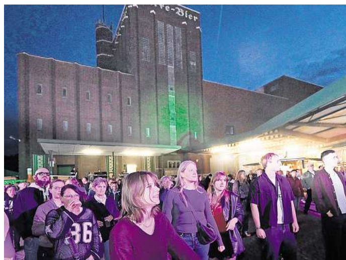
Das Härke-Hoffest ist abgesagt, das Bedauern unter den Peinern ist groß. Der Veranstalter spricht über die Gründe.

„Die Resonanz war einfach zu gering“, begründet Horneffer seine Entscheidung, das Fest Fortsetzung auf Seite 2