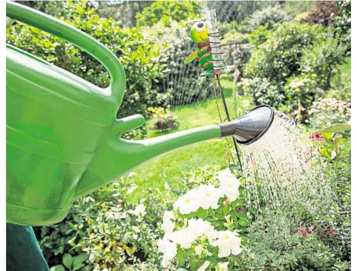
Feste Gießzeiten und eine kleine Runde durchs Grün - so bleibt man dran.

Nur wer seinen Garten regelmäßig beobachtet, lernt ihn besser kennen und erkennt sofort, wenn es ein Problem gibt. Es kann helfen, feste Abläufe einzuplanen - etwa regelmäßige Gießzeiten, die man mit einem kurzen Kontrollgang verbindet, so Lutz Popp. Dabei sieht man auch gleich, was sich im Garten getan hat. Das motiviert zusätzlich. (DPA)