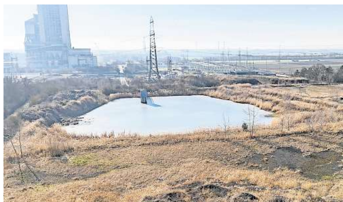
Ein Blick auf das Deponie-Areal von oben.

Ein Stück weit entfernt laufen unterdessen die Vorbereitungen für die nächste Sprengung auf dem Kraftwerk-Gelände. Im Frühjahr soll der große Denox-Katalysator an dem 130 Meter hohen Kesselhaus mit einem lauten Knall fallen. Vorgesehen ist, das Kesselhaus selbst dann im Sommer zu sprengen. Der 250 Meter hohe Kamin soll zum Schluss in sich zusammenstürzen, voraussichtlich zum kommenden Jahreswechsel. Die übrigen Gebäude werden auf konventionelle Weise dem Erdboden gleichgemacht, zum Beispiel mit einem Kettenbagger samt Abrissbirne.