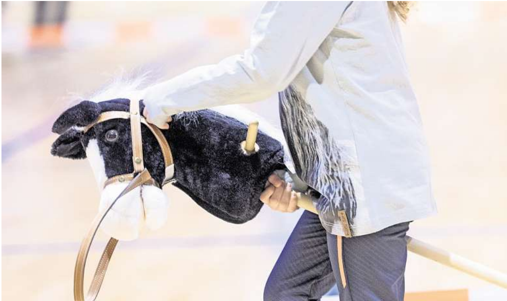
Spaß für alle Kita-Kinder: Hobby Horsing ist ein Programmpunkt bei der Osterrallye.