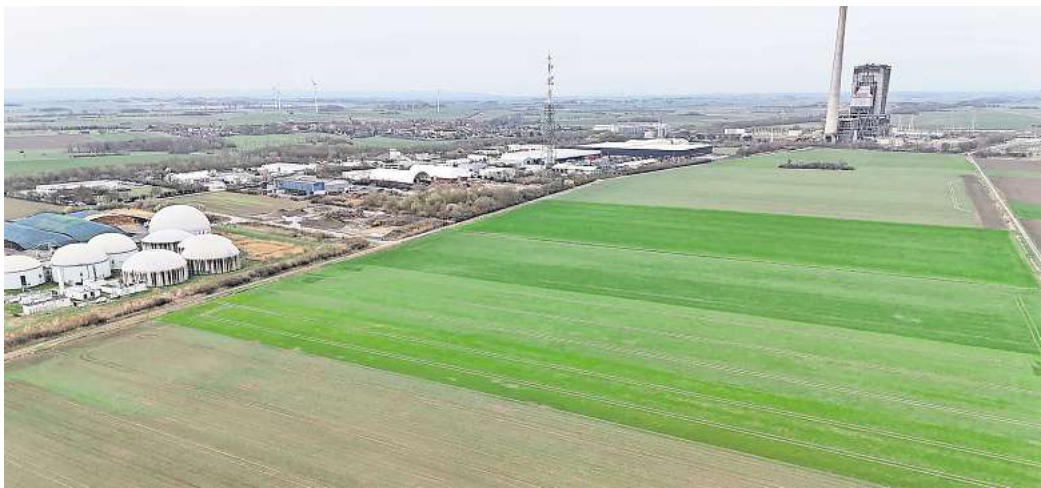
Die Planungen laufen: Auf dieser Fläche im Gewerbegebiet „Ackerköpfe“ soll die Serverfarm entstehen.

Von dem Projekt profitiert auch die Gemeinde Hohenhameln, schließlich werden an sie