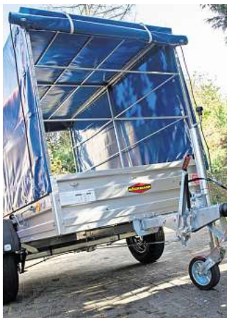
Welche Anhängelast ein E-Auto ziehen darf, steht im Fahrzeugschein.

Wenn grundsätzlich nachgerüstet werden darf, muss die Kupplung eine gültige Genehmigung haben und für den konkreten Fahrzeugtyp zugelassen sein. Der ACE rät zu einer professionellen Beratung und fachgerechten Montage.