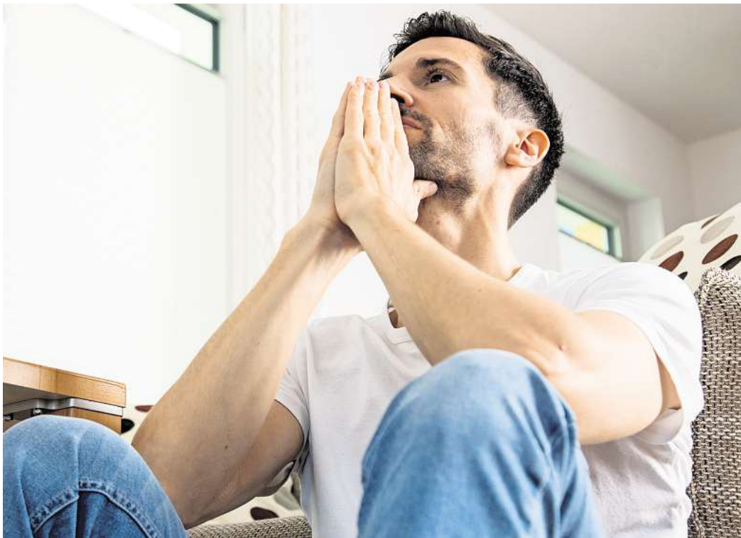
Erst mal den Kopf freibekommen: Wer innerhalb einer gewissen Zeitspanne viele Entscheidungen treffen musste, sollte dem Gehirn Ruhe gönnen.