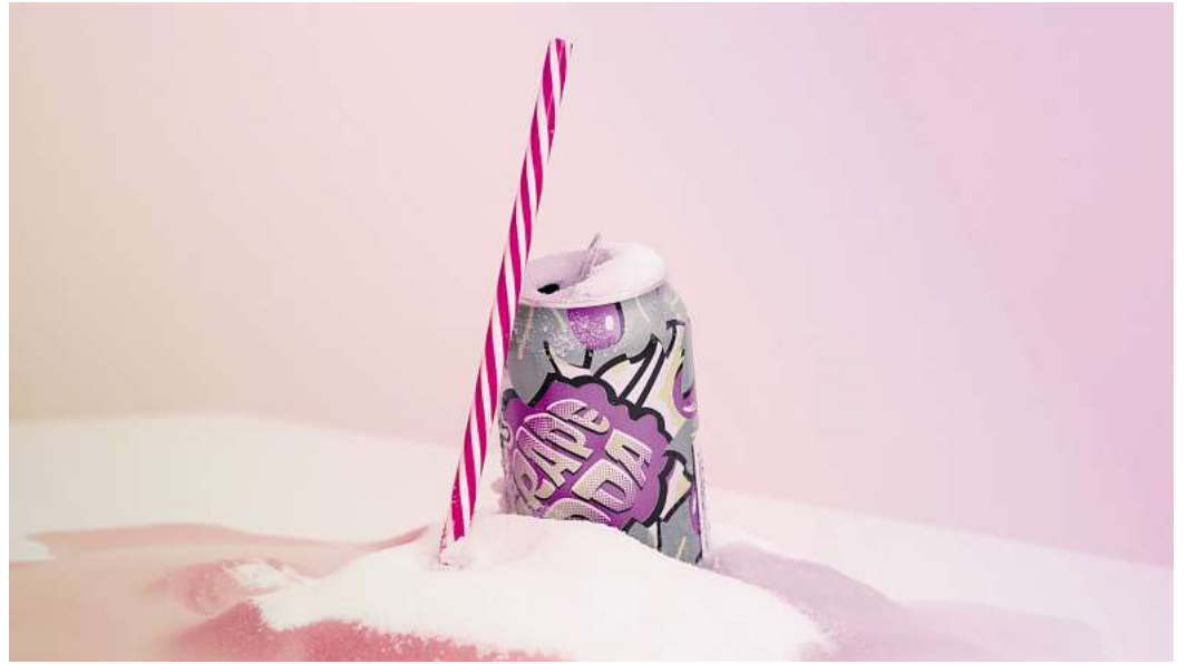
Zuckerhaltige Getränke belasten die Nieren: Fruchtzucker aus Softdrinks und Fertigprodukten kann langfristig Nierenschäden fördern.

Fruktose ist beispielsweise in Softdrinks, Energydrinks, Sportgetränken, Eistees und aromatisierten Wässern zu finden. Auch Fruchtjoghurt, Müs-