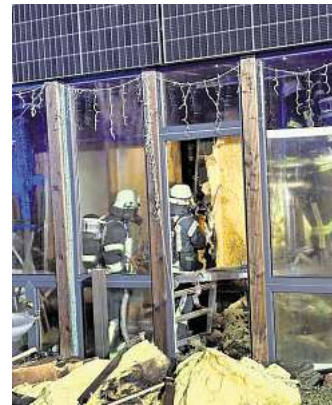
Einsatz mit Kettensäge.

Entsprechend konnte sich die Feuerwehr komplett auf das Löschen der Flammen konzentrieren. Die Kräfte rückten sowohl im Erd- als auch im Obergeschoss vor. Wegen des erhöhten Personalbedarfs wurden sukzessive immer mehr Wehren etwa