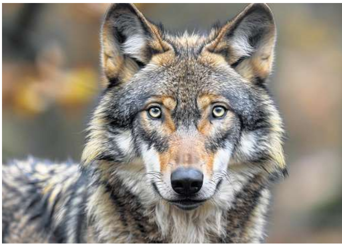
Stehen bleiben, ruhig bleiben: Was sollte ich tun, wenn ein Wolf vor mir steht?

In Hamburg wurde jetzt mitten in der City eine Frau von einem jungen Wolf gebissen. Kann das auch in Peine oder den Ortschaften des Landkreises passie-