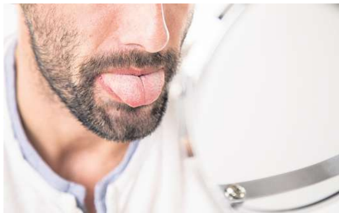
Wer sich regelmäßig gründlich die Zähne putzt und die Zunge mit einem speziellen Schaber reinigt, lässt schädlichen Ablagerungen kaum eine Chance.

Nicht zuletzt kann es an mangelnder Mundhygiene liegen, dass sich der Pilz ausbreitet. „Putze ich mir regelmäßig gründlich die Zähne und reinige zudem die Zunge mit einem speziellen Schaber, haben schädliche Ablagerungen kaum eine Chance“, sagt die Zahnärztin. Auch schlecht sitzende oder schlecht gesäuberte Zahnprothesen bieten Pilzen einen guten Nährboden. Die Prothesen daher am besten nach jedem Essen gründlich reinigen. (dpa)