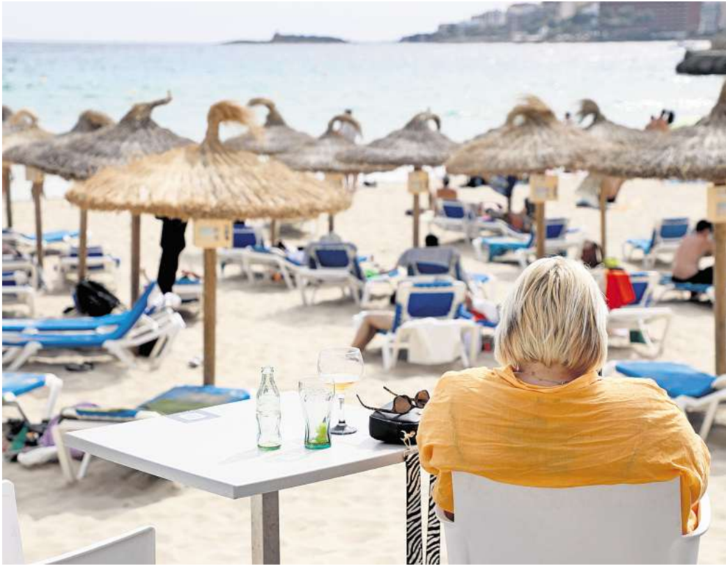
Gut gerüstet: Mit mehreren Karten und etwas Bargeld sind Urlauber flexibel und sicher unterwegs.