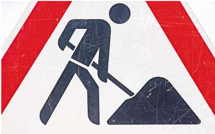
Der Wasserverband Peine meldet Bauarbeiten in Groß Ilsede.

Acht Hausanschlüsse werden an den neuen Leitungsverlauf ange-