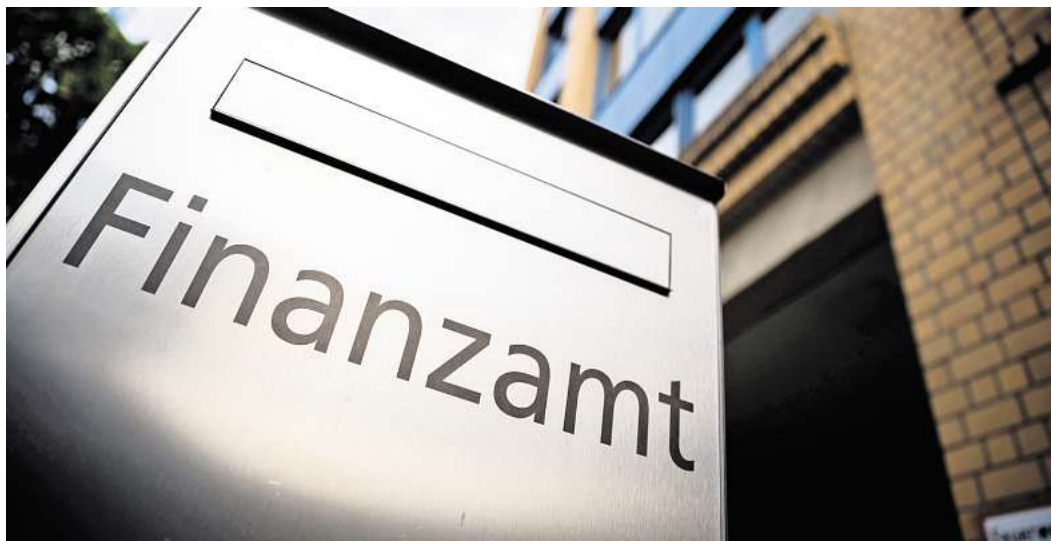
Darf das Finanzamt nicht: steuerlich beraten. Was es aber darf: steuerliche Sachverhalte auf Nachfrage erklären.

Der Bund der Steuerzahler Deutschland unterstützt seine Mitglieder bei solchen Fragestellungen mit praxisnahen Informationen und hilfreichen Tipps - damit aus einem unangenehmen Behördenbrief kein dauerhaftes Problem wird. (dpa)