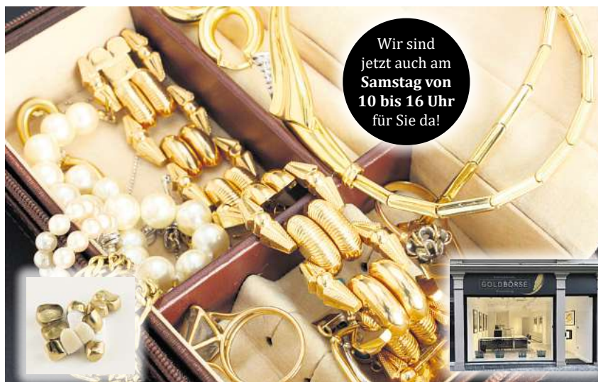
Originalbewertung von dieser Woche

Denn eines ist klar: Solche Marktphasen sind keine Selbstverständlichkeit. Wer heute über Altgold, Münzen oder alten Schmuck verfügt, hat die