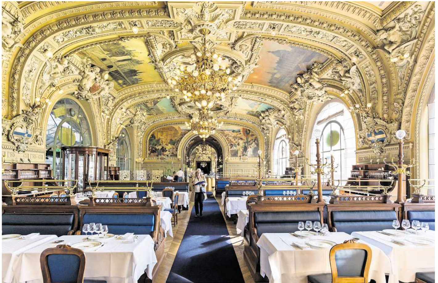
Ein Jugendstil-Traum: Das Bahnhofsrestaurant Le Train Bleu existiert seit 1901.