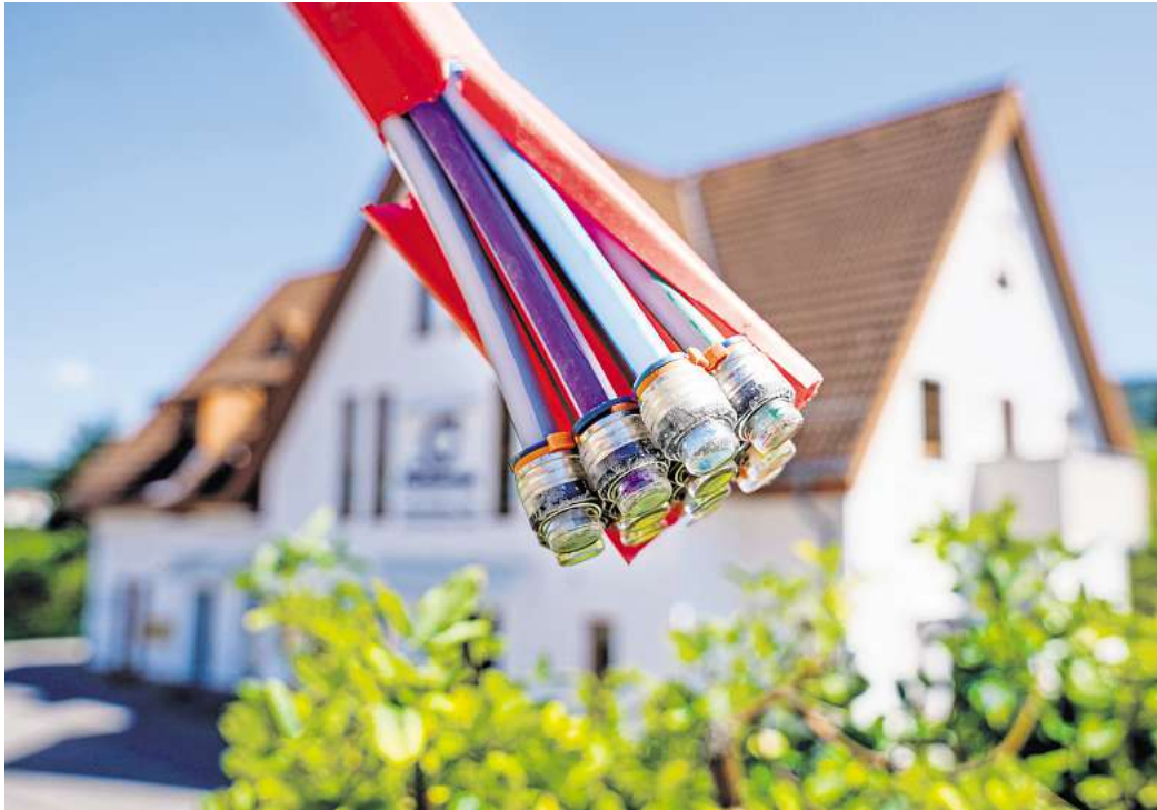
Sparpotential: Buchen Eigentümer beim ausbauenden Anbieter für Glasfaser einen Zweijahres-Vertrag dazu, bekommen sie den Anschluss in der Regel kostenlos.