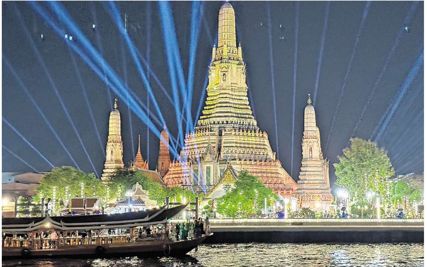
Vom Wasser aus und illuminiert am schönsten: die an sich schon imposante Anlage des Wat Arun.