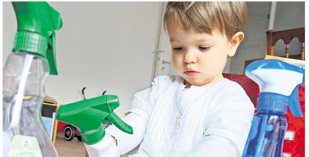
Hat das Kind Putzmittel zu sich genommen, ist ein Anruf beim Giftnotruf sinnvoll, um Profis die Situation einschätzen zu lassen.

wuchs in so einer Situation etwas isst, das den Schaum im Magen zusammenfallen lässt. Steindl zufolge eignen sich dafür ein dick beschmiertes Butterbrot oder ein Löffel Butter oder auch Nuss-Nougat-Creme. Das darin enthaltene Fett greift nämlich die Struktur des Schaums an, sodass er sich nicht länger halten kann.