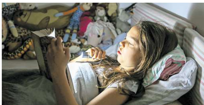
Keine langfristigen Schäden: Lesen bei schlechtem Licht verschlechtert weder die Sehkraft noch verursacht es Augenerkrankungen.