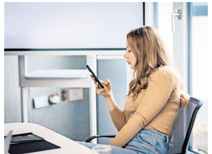
Das Handy ist am Arbeitsplatz ein leidiges Thema - ganz verboten darf der Arbeitgeber es aber nur mit gutem Grund.