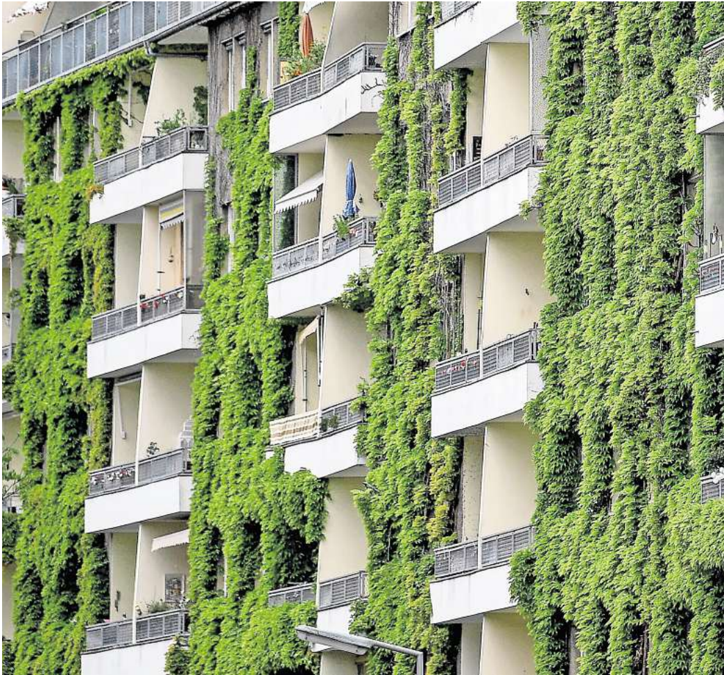
Pflanzen an der Fassade sorgen im Sommer für Schatten und im Winter für zusätzliche Dämmung.