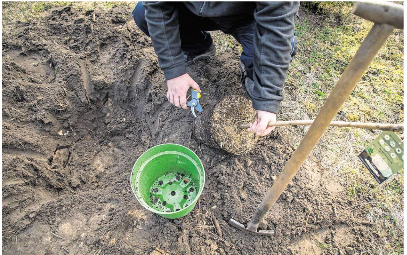
Der Start ins Baumleben: Pflanzloch ausheben, Hauptwurzeln abschneiden, Baum gerade einsetzen.

Auch das Alter der Bäume kann bei der Wahl eine Rolle spielen. Junge Bäume wachsen in der Regel besser an. Ältere Exemplare tragen dagegen früher Früchte, sind aber teurer. Wer nur einen Baum pflanzt, sollte