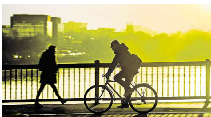
Hin, zurück, hin, zurück: Split Shifts sind in manchen Branchen üblich, müssen aber geregelt sein – meist per Tarifvertrag.