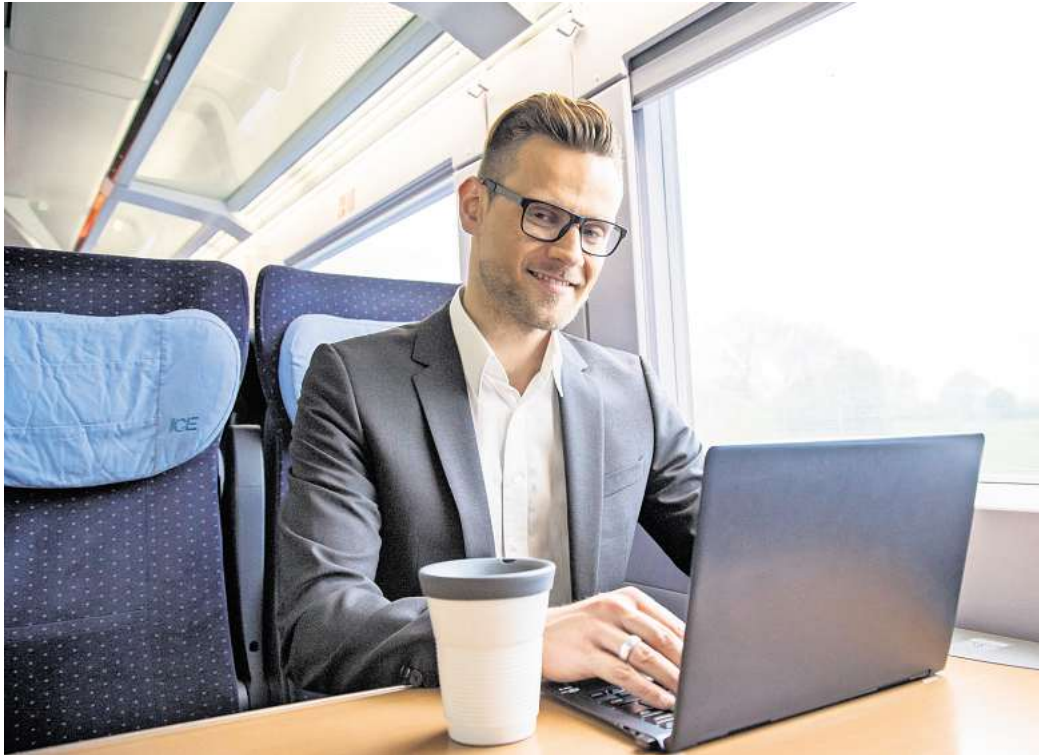
IEgal, ob Zug oder im Café: Rechtlich gesehen darf der Bildschirm beim mobilen Arbeiten nicht einsehbar sein.

Wer mobil in der Öffentlichkeit arbeitet, ist verpflichtet, auch unterwegs darauf zu achten, dass die Verschwiegenheitspflicht nicht verletzt wird. Sind Dokumente oder Informationen auf