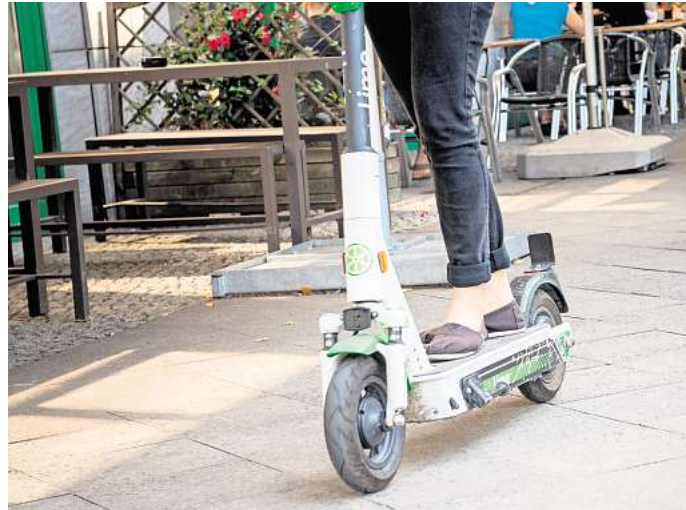
Urbane Mobilität? Zur Realität gehört, dass sich so einige auf dem E-Scooter nicht ans Gesetz halten.

Grund dafür: der gravierende Verstoß des E-Scooter-Fahrers. Nach Auffassung des Gerichts traf ihn ein so starkes Eigenverschulden, dass sogar die eigent-