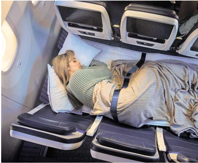
Wer im Flieger schon immer quer liegen wollte: United plant ab 2027 Relax Rows in der Economy. Andere Airlines bieten das zum Teil auch an.

Die „United Relax Row“ soll Fluggästen in der Sitzklasse United Economy angeboten werden - in der Basis Economy gibt es sie nicht. Pro Maschine soll es bis zu zwölf Relax Rows geben, bis 2030 sollen mehr als 200 United-Jets entsprechend ausgestattet sein. Wie viel Aufpreis die Aufbettung in der Economy kosten soll, sagte United noch nicht.