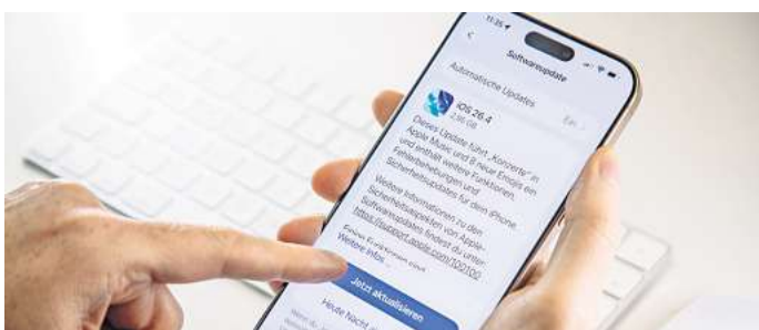
Für iPhone 11 bis iPhone 17: Das neue iOS 26.4 bringt neue Funktionen aufs iPhone - plus wichtige Sicherheitsupdates.

Außerdem gibt Apple an, die Eingabegenauigkeit der virtuellen Tastatur verbessert zu haben. Das bedeutet, dass darauf künftig auch schnelle Eingaben korrekt erfasst werden sollen.