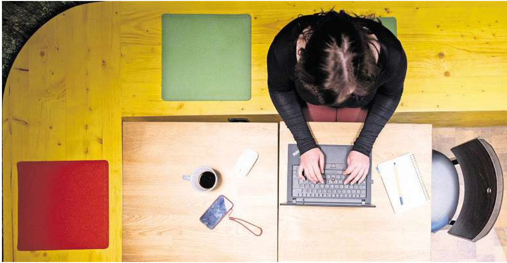
Virtuelle Kaffeetreffen, Gespräche über Hobbys: Ein privater Austausch unter Kollegen fördert die Karriere.