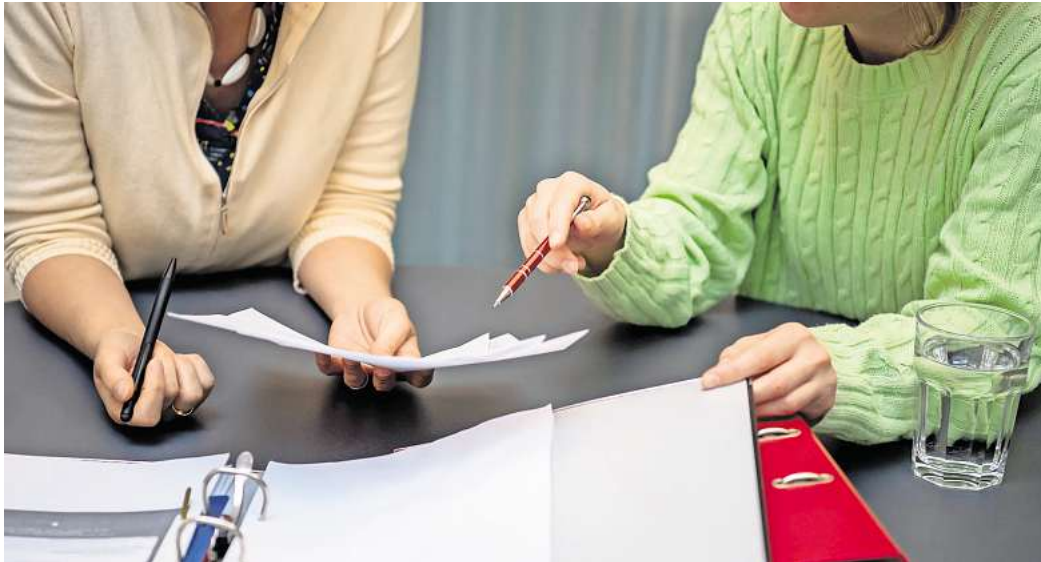
Details zählen: Gute BU-Tarife zahlen, wenn der zuletzt ausgeübte Job zu mindestens 50 Prozent nicht mehr möglich ist.