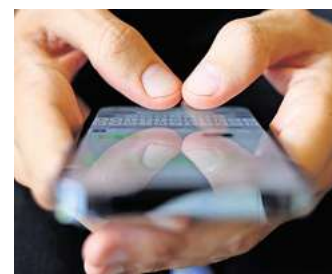
Bei Problemen die KI fragen?

Koss ist davon überzeugt, dass sich die Ergebnisse seines KI-Praxistests eins zu eins auf die Realität übertragen lassen. Auch bei der Erstellung der eigenen Steuererklärung sollten Verbraucherinnen und Verbraucher sich daher keineswegs blind auf eine KI verlassen. (dpa)