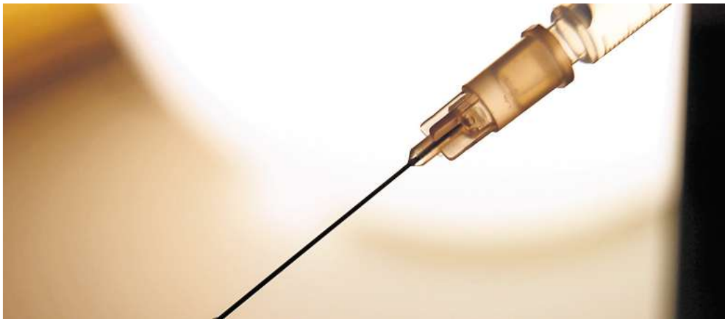
Impfen statt ärgern: Hepatitis-Viren sind in vielen Reiseländern ein Risiko – mit Impfung und Hygiene lässt sich viel abfangen.

Außerdem können sich Haut und Bindehaut gelb verfärben, weshalb Hepatitis A auch Reisegebsucht genannt wird. Der