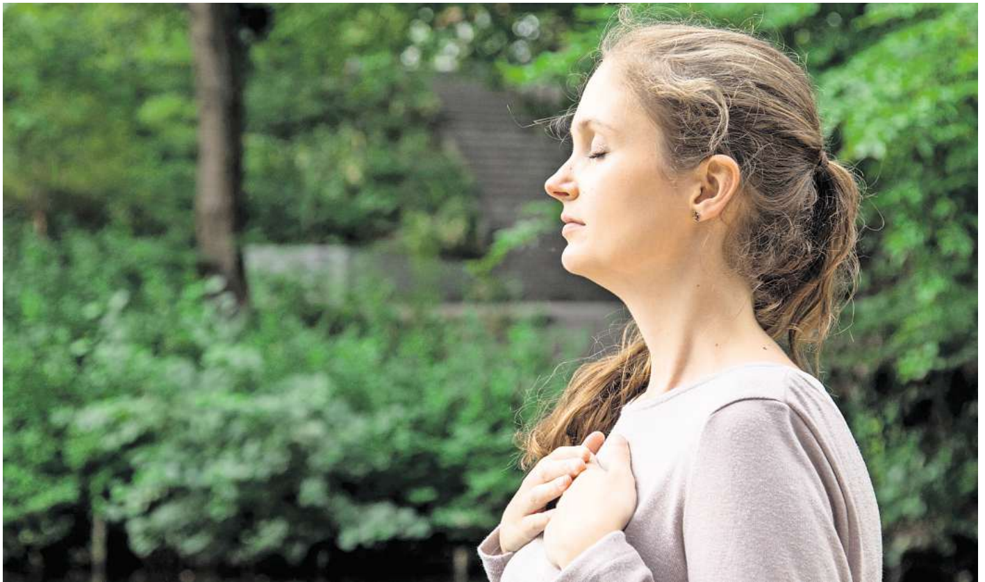
Durchatmen: Kurze Entspannungsübungen können in akuten Momenten Sicherheit geben.

Viele Betroffene versuchen häufig, angstauslösende Situationen zu vermeiden: Sie sagen Treffen ab, verändern Wege oder meiden bestimmte Orte ganz. „Der eigene Aktionsradius schrumpft gewaltig“, so Steffen Häfner, Facharzt für Psychosomatische Medizin und Psychotherapie. In extremen Fällen ziehen sich Betroffene ganz zurück, schreibt die Stiftung Gesundheitswissen.