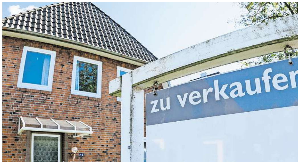
In 2025 vermittelte die Sparkasse Hildesheim Goslar Peine mehr Wohnobjekte als im Vorjahr.

„Ein Großteil der Erlöse fließt an die Bürgerstiftung Peine und das Projekt Ein Essen für jedes Kind“, teilt der Verein mit. „Darüber hinaus werden weitere lokale Einrichtungen sowie nationale Initiativen des Ladies Circle unterstützt.“ In den vergangenen Jahren kamen so bereits „deutlich mehr als 100.000 Euro für den guten Zweck“ zusammen, heißt es weiter. Eine Übersicht aller Verkaufsstellen ist über die Seite www.peine.ladiescircle.de zu finden.