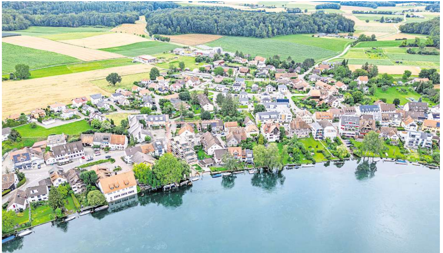
Büsingen ist eine deutsche Stadt mitten in der Schweiz.

Büsingen am Hochrhein ist ein Ort, der schon auf der Landkarte neugierig macht – und spätestens bei der Anreise beginnt das kleine geografische Abenteuer. Denn wer in das deutsche Dorf reist, überquert ganz selbstverständlich zweimal eine Landesgrenze. Die Geschichte dieses ungewöhnlichen Fleckens Erde