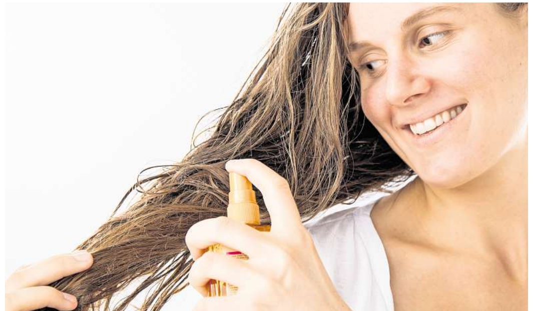
Schnell gestylt, länger drauf: Leave-in verspricht Pflege ohne Aufwand – aber nicht jedes Haarpflegeprodukt ist auch gut für Haut und Haar.

Ein Leave-in-Conditioner rasselt dann auch als „ungenügend“ durch, drei sind „mangelhaft“. Ein Produkt bewerten die Öko-Tester mit „ausreichend“. Doch es gibt auch bessere Ergebnisse: Drei der getesteten Pflegeprodukte fürs Haar sind „befriedigend“, drei „gut“. „Sehr gut“ schneiden acht der Leave-in-Sprüh-Conditioner ab, darunter alle vier Naturkosmetikprodukte im Test.