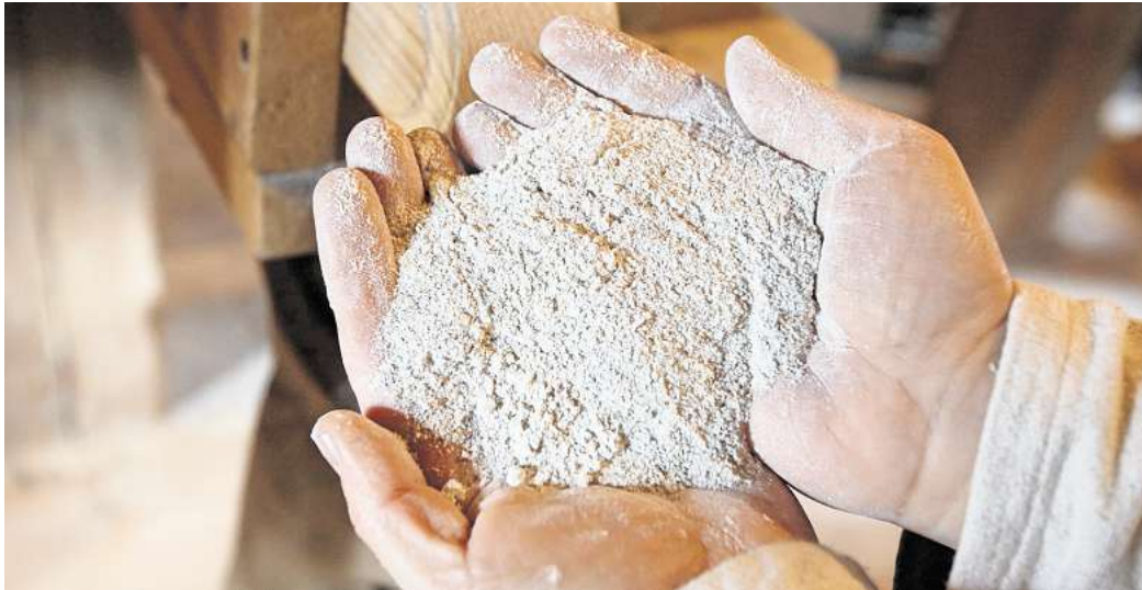
„Öko-Test“ hat 50 Vollkornvarianten von Weizen-, Dinkel- und Roggenmehlen untersucht.

Während Pestizide kaum eine Rolle spielten, wies das Labor Verunreinigungen mit kritischen Mineralölbestandteilen bei einem Mehl nach, bei weiteren