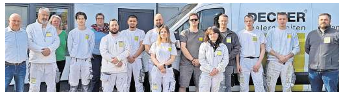
Freut sich über die nachhaltig positive Entwicklung der letzten Jahre: das Team der DECKER malerarbeiten GmbH.