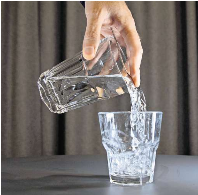
Schritt 2: Flüssigkeit mit Schwung in das leere Glas gießen.

Und so geht's: Einen Löffel waagrecht auf das volle Glas legen - der gewölbte Teil des Löffels zeigt nach unten und ragt über den Glasrand hinaus. Das Glas mit einer Hand umfassen und den Löffel mit dem Zeigefinger fixieren. Die Flüssigkeit