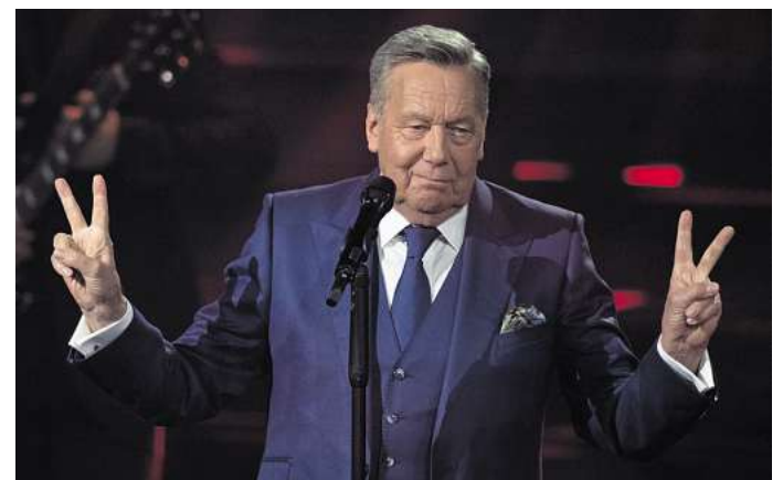
Der deutsche Schlagersänger Roland Kaiser steht in der Fernsehshow "Das große Schlagerjubiläum 2022" in Leipzig auf der Bühne. Kaiser ist nun auch in einem Film zu sehen.

Der Sänger war erst im vergangenen Jahr in den Kinos zu sehen mit dem Konzertfilm „50 Jahre Roland Kaiser - Ein Leben für die Musik“. In der Dokumentation gab Kaiser Einblicke in sein Leben und den Touralltag. (dpa)