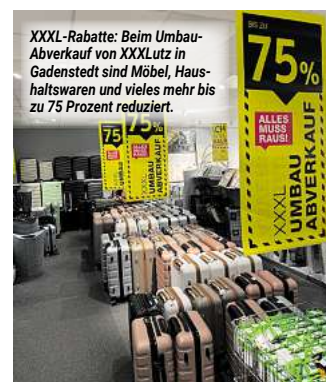
XXXL-Rabatte: Beim Umbau-Abverkauf von XXXLutz in Gadenstedt sind Möbel, Haushaltswaren und vieles mehr bis zu 75 Prozent reduziert.