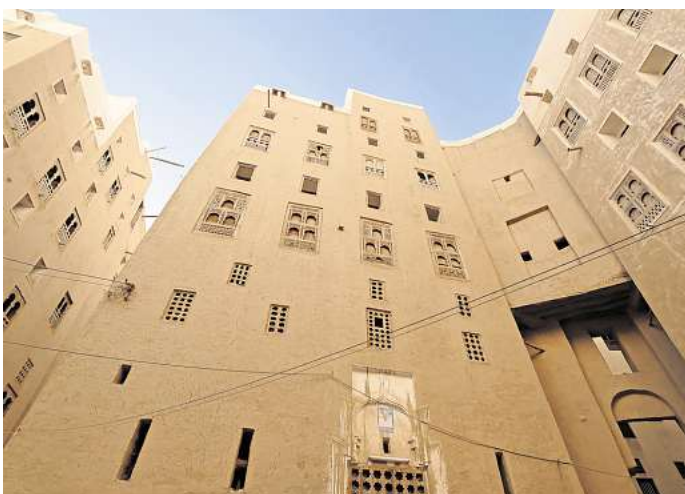
Wohnhäuser in der Altstadt von Schibam.

Ohne kontinuierliche Pflege droht das „Manhattan der Wüste“ langsam zu verschwinden.