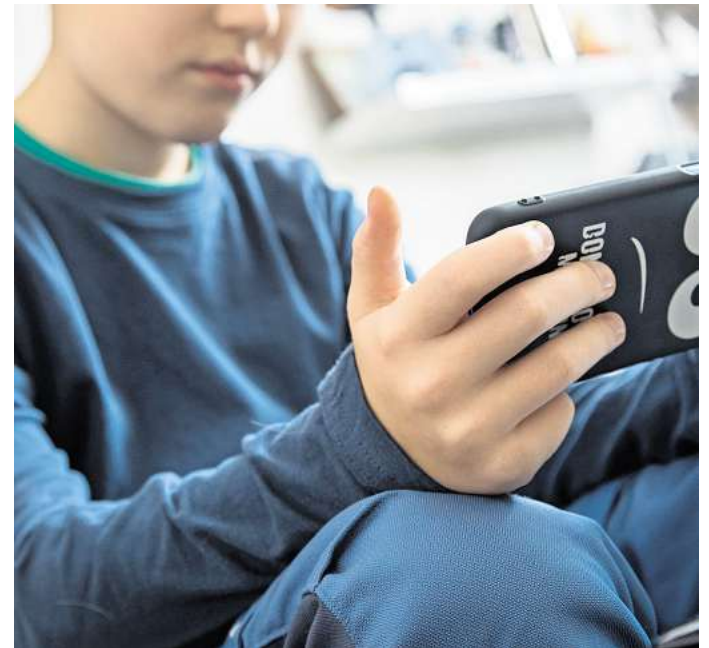
Ein Handyverbot kann bei Kindern zu einem abrupten Abfall des Dopamin- und Adrenalinspiegels führen.

Wenn Eltern diese Anspannung durch einen Medienentzug oder Verbot digitaler Medien ganz plötzlich kappen, kommt es bei Kindern oder Jugendlichen zu einem abrupten Abfall des Dopamin- und Adrenalinspie-