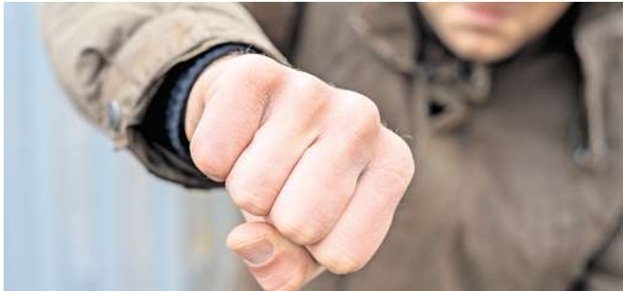
Symbolfoto: Wer hat wen auf dem Schützenfest Groß Bülden im Jahr 2023 geschlagen?

Peine. Die Ereignisse, die jetzt vor dem Peiner Amtsgericht eine Rolle spielten, haben sich vor drei Jahren zugetragen. Im September 2023 wurde in Groß Bülden Volksfest gefeiert. Mit dabei waren auch zwei Männer aus Peine. Die beiden Arbeitskollegen waren dort mit zwei Auszubildenden. Vor Gericht ging es darum, zu klären, welche Rolle die beiden 34 und 39 Jahre alten Männer bei einer Schlägerei hatten. Die Anklage lautete auf gefährliche Körperverletzung, die Rede war auch von einem Gegenstand, mit dem sie auf den Geschädigten eingeschlagen haben sollen. Am Ende wurden beide frei gesprochen, weil nicht klar war, ob oder wie sie beteiligt waren.