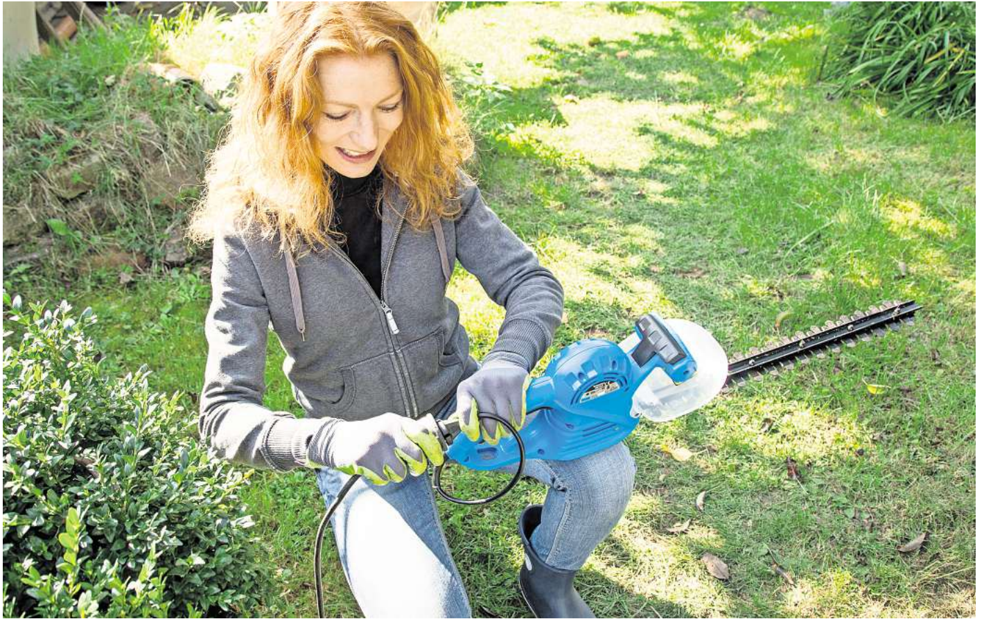
Sicher mähen und schneiden: Elektrogeräte im Garten sollten nur bei trockenen Bedingungen verwendet werden.

Für draußen wäre laut DSH etwa die Schutzklasse IP 44 geeignet.