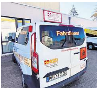
Die Tagespflege am Berkumer Weg in Horst: Der ASB holt die Senioren und Seniorinnen ab und bringt sie wieder nach Hause.

mer Weg verbindet dieses Ziel mit einem strukturierten und zugleich abwechslungsreichen Alltag. Die Gäste werden morgens abgeholt und am späten Nachmittag oder Abend zurückgebracht. Während des Tages erleben sie Gemeinschaft, Aktivität und individuelle Betreuung. Die Pflegeversicherung übernimmt, abhängig vom jeweiligen Pflegegrad, einen Großteil der Kosten. Wer mehr wissen möchte, kann sich im Internet über die Seite www.asb-peine.de informieren.