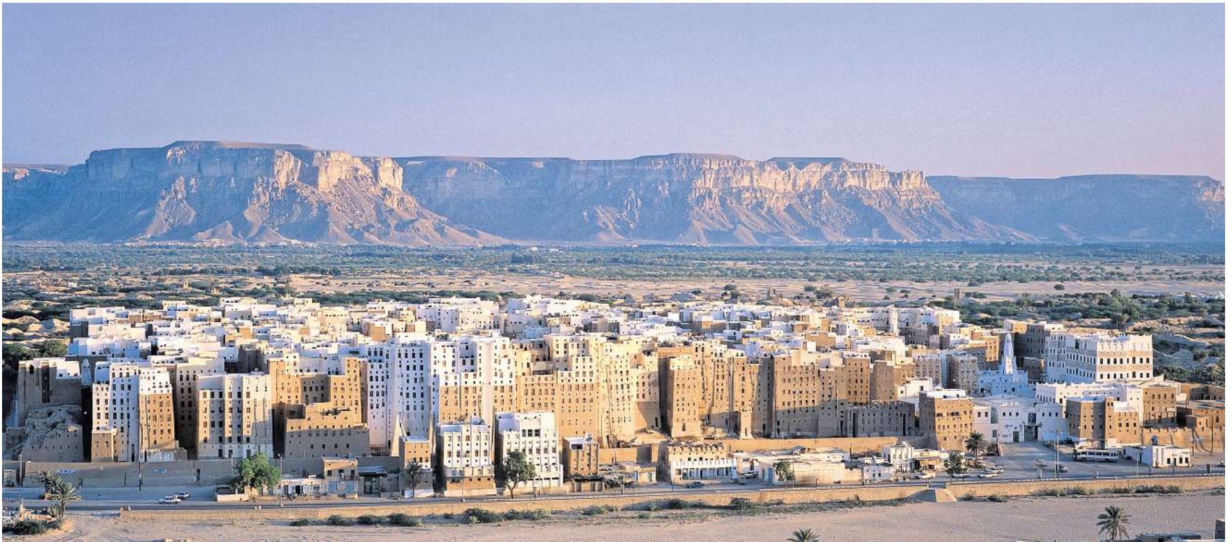
Schibam ist die historische Hauptstadt der Region Hadramaut im Jemen.

Seit 1982 gelten die Hochhäuser von Schibam als Unesco-Weltkulturerbe