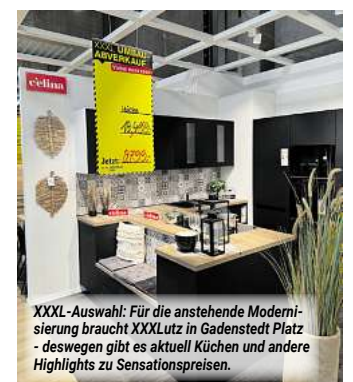
XXXL-Auswahl: Für die anstehende Modernisierung braucht XXXLutz in Gadenstedt Platz – deswegen gibt es aktuell Küchen und andere Highlights zu Sensationspreisen.

XXXLutz Gadenstedt An der Bundesstr. 2 31246 Gadenstedt