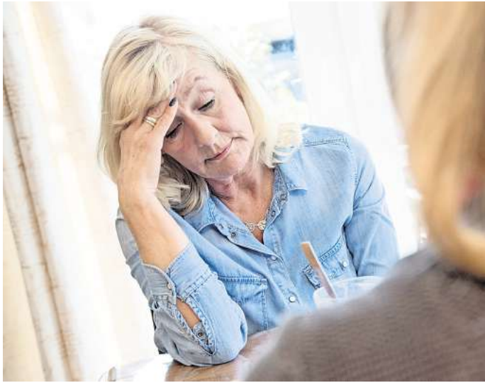
Ein Schlaganfall hinterlässt Folgen, von denen längst nicht alle sichtbar sind.

Der eine kann sich nur wenige Minuten auf ein Gespräch konzentrieren und steigt dann aus. Die andere verbummelt Verabredungen und kann nur schwer Aufgaben zu Ende bringen. Und viele kennen den Satz: „Du bist nicht mehr wie früher, ich kenn dich doch ganz anders!“