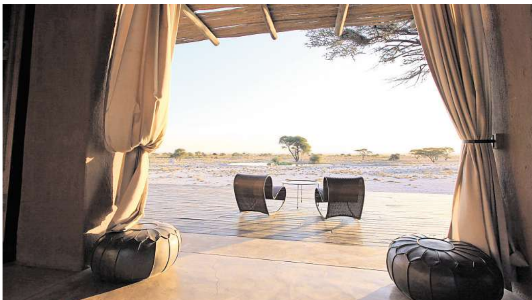
Schön hier – und mückenfreundlich. In Namibia nehmen Malaria-Fälle deutlich zu. Lange Kleidung, Mückenspray und Moskitonetz können den Urlaub retten.

Bei unklaren fiebrigen Infekten nach der Heimkehr sollte man die zurückliegende Tropenreise beim Arzt erwähnen – Malaria kann auch Wochen oder Monate nach dem Stich der Mücke noch ausbrechen. Die Erkrankung kann lebensbedrohlich sein. Wird sie früh erkannt und behandelt, heilt sie aber in aller Regel folgenlos aus. (dpa)