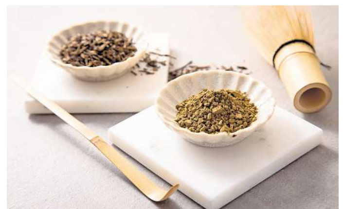
Hojicha-Pulver ist eine pulverisierte Form von Hojicha-Tee, einer traditionellen Sorte aus Japan, die aus gerösteten Grünteeblättern hergestellt wird.