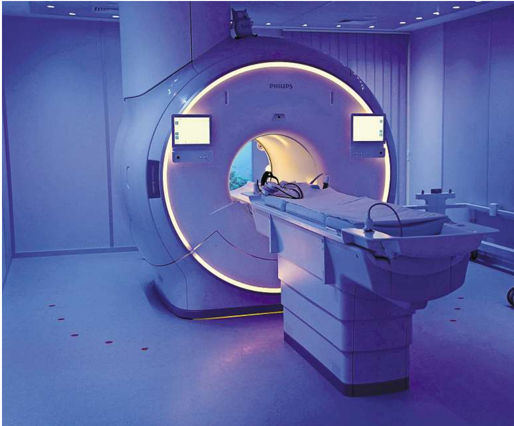
Auch Menschen mit einer Angststörung können eine MRT-Untersuchung «schaffen» - vor allem, wenn sie vorher mit therapeutischer Hilfe Bewältigungsstrategien geübt haben.