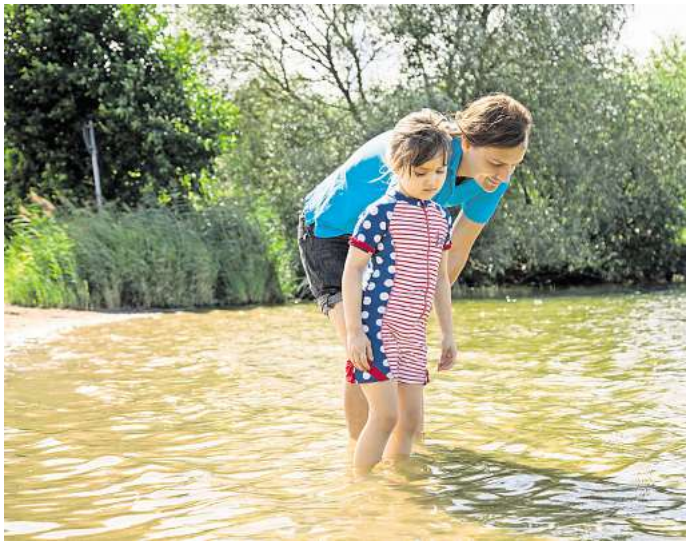
Schützt der Secondhand-UV-Einteiler noch? Das Siegel «UV-Standard 801» ist dann ein wichtiger Indikator.

Eltern sollten deshalb nicht allein auf den UV-Schutzfaktor