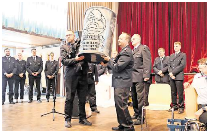
Zum Jubiläum gab es für die Feuerwehr Vöhrum eine besondere Feuertonne.