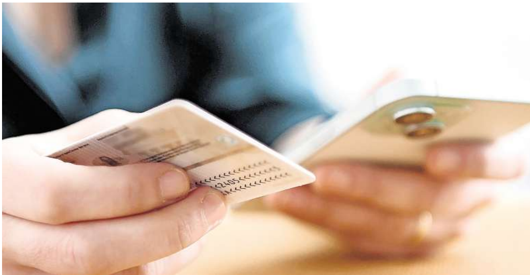
Ausweiskopien nur im Ausnahmefall: Kopien von Personalausweisen sollten bloß angefertigt werden, wenn es wirklich notwendig ist, um Missbrauch und Datenschutzrisiken zu vermeiden.

Stimmt der Ausweisinhaberin oder die Ausweisinhaberin zu, darf auch eine andere Person eine Ausweiskopie anfertigen, diese aber nicht an Dritte weiter-