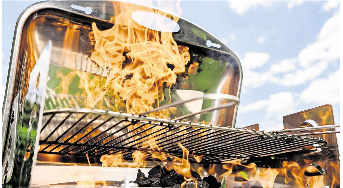
Spiritus und andere flüssige Brandbeschleuniger können hohe Flammen verursachen - und damit auch starke Verbrennungen.

Kleinere Verbrennung sollten man kurzzeitig kühlen, rät Hir-