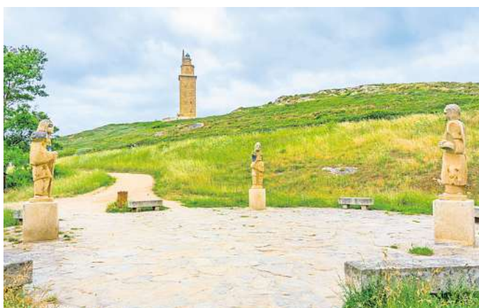
Zum Leuchtturm gehört ein großer Skulpturenpark.

Eine Reise zum ältesten noch aktiven Leuchtturm der Welt lohnt sich – wer kann schon behaupten, dass er auf einen Weltrekord geklettert ist?