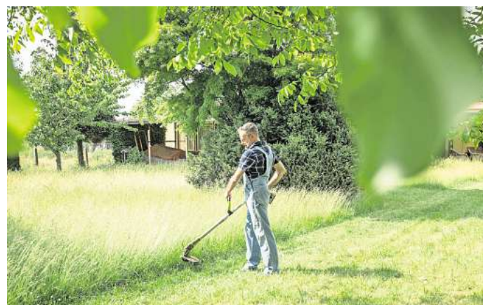
Beim Mähen gilt: Weniger ist oft mehr - längere Mähintervalle fördern die Artenvielfalt und stärken den Rasen.

Wer den Rasen für einen bestimmten Zweck braucht - etwa eine Feier oder zum Fußballspielen - kann auch einfach kleine