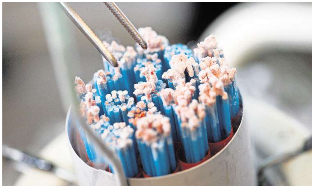
Kühlbehälter, heiß diskutiert: Wie viele Zusatzinfos zur Nutzung einer Samenspende stehen Gezeugten zu?

Auch für ihre persönliche Entwicklung seien die zusätzlichen Angaben nicht entscheidend, da sie bereits wisse, unter welchen Umständen sie gezeugt worden sei und dass es laut ihrer eigenen Recherche vermutlich 33 weitere Kinder gebe.