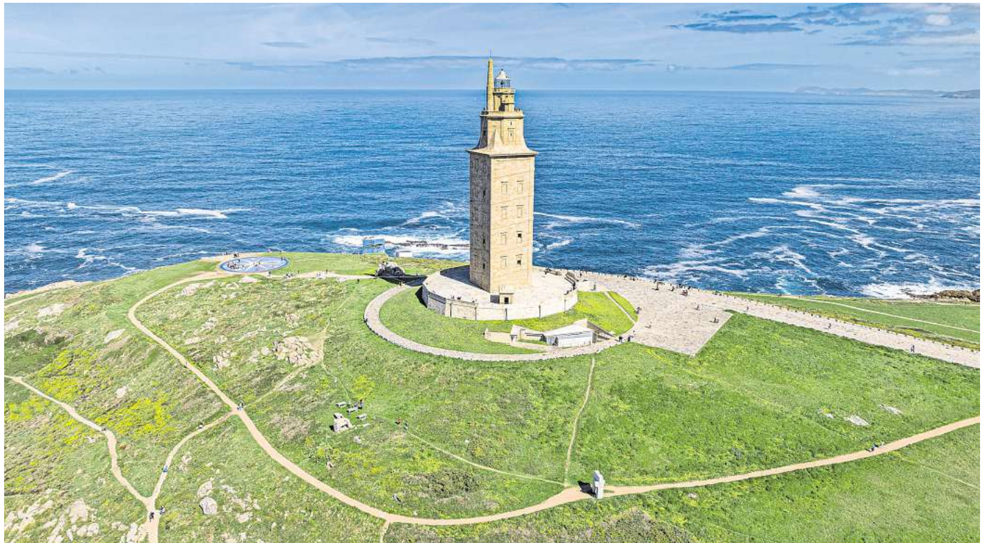
Der älteste noch aktive Leuchtturm der Welt: Der Torre de Hércules in Galizien.

Gebaut wurde er Ende des ersten Jahrhunderts nach Christus, im 18. Jahrhundert wurde er restauriert. Und trotz seines Alters ist der Torre de Hércules noch immer nicht in Rente. Bis heute ist sein Leuchtfeuer in Betrieb und weist Schiffe vor der galizischen Küste den sicheren Weg.