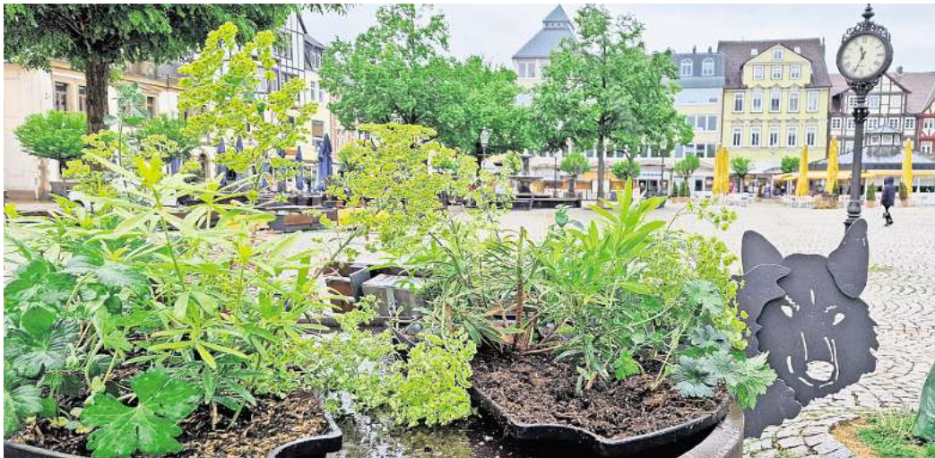
Die City blüht auf: Die Pflanzinseln für die Peiner Innenstadt sind mit besonders insektenfreundlichen Blumen bestückt.

Bepflanzt sind die Gefäße mit Prachtkerze, Wolfsmilch, Berg-