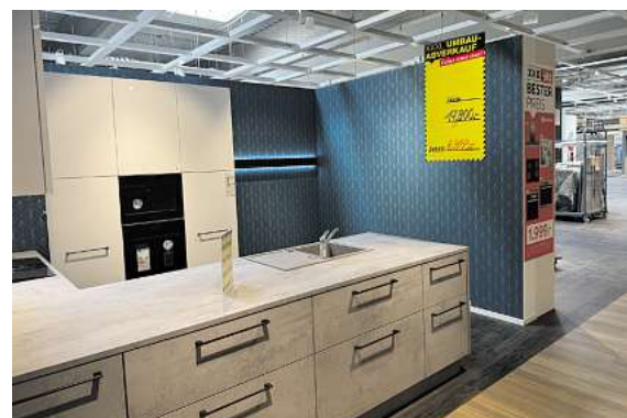
„Küchenabverkauf“: Einige Küchen wurden noch einmal weiter reduziert, um für den Umbau weiter Platz zu schaffen.