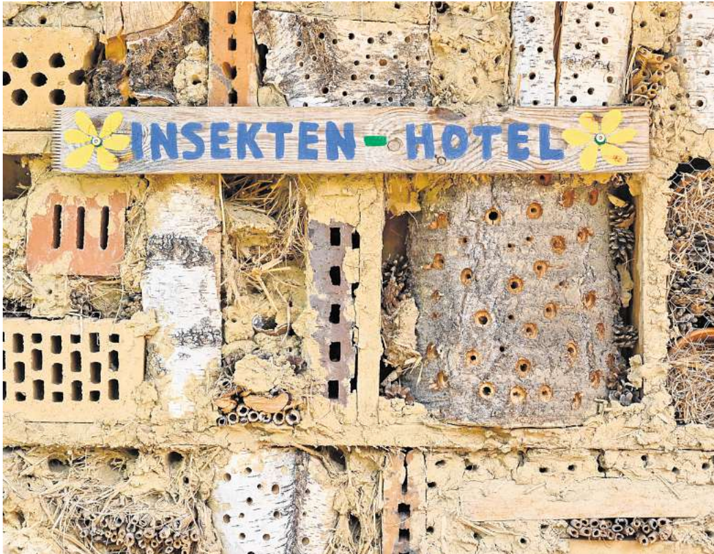
Insektenhotels sollten natürliche Materialien und eine Vielzahl von Röhren mit unterschiedlichen Durchmessern aufweisen.

Dem Nabu Berlin zufolge kommt es vor allem darauf an,