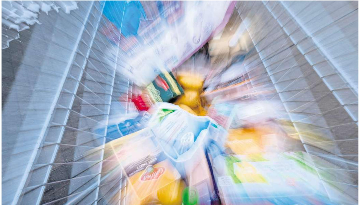
Wird ein Lebensmittel als «fettreduziert» beworben, so muss es mindestens 30 Prozent weniger Fett enthalten als vergleichbare Produkte.

Das gelte auch für Produkte, die als „energiereduziert“ oder