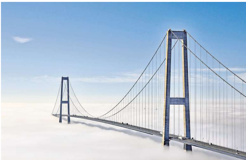
Günstiger und schneller: Von der neuen Online-Ticketoption sollen insbesondere ausländische Reisende profitieren

Das Ticket ist ans Nummernschild geknüpft, das bei der Durchfahrt über die grünen Expressspuren automatisch registriert wird. Es wird ab dem Kaufdatum 30 Tage gültig und kann innerhalb dieser Zeit auch zurückerstattet werden, wenn man es doch nicht benötigt.