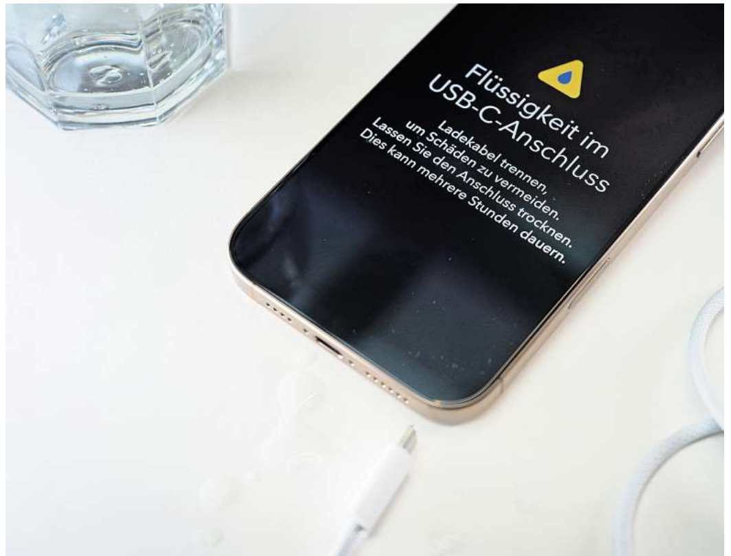
Keine Panik: Erscheint so eine Warnung, ist Geduld gefragt. Denn der Ladeanschluss lässt sich erst wieder nutzen, wenn er vollständig getrocknet ist.

Ist ein Tag vergangen und der Warnhinweis taucht immer noch auf, beziehungsweise die Entwarnung bleibt aus? Dann ist es sinnvoll, nach weiteren hersteller- und modellspezifischen Support-Hinweisen Ausschau zu halten oder gleich den Hersteller-Support zu kontaktieren.