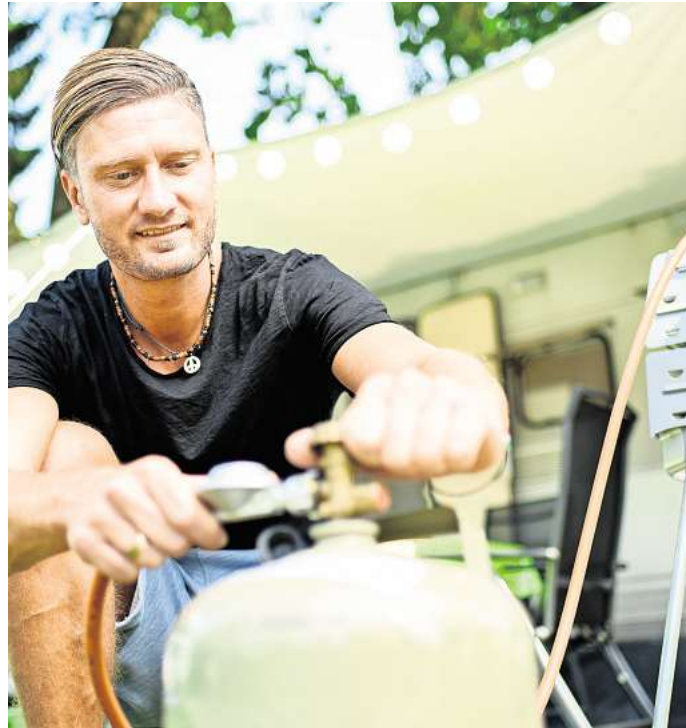
Bevor gebrutzelt wird, erst der Sicherheitscheck: Vor dem Angrillen Schlauch, Druckregler und Ventile prüfen – bei Rissen oder Porosität sofort tauschen.