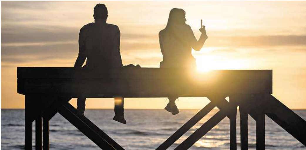
Menschen mit Bindungsangst verspüren oft eine große Sehnsucht nach Verbindung - und fliehen gleichzeitig davor.