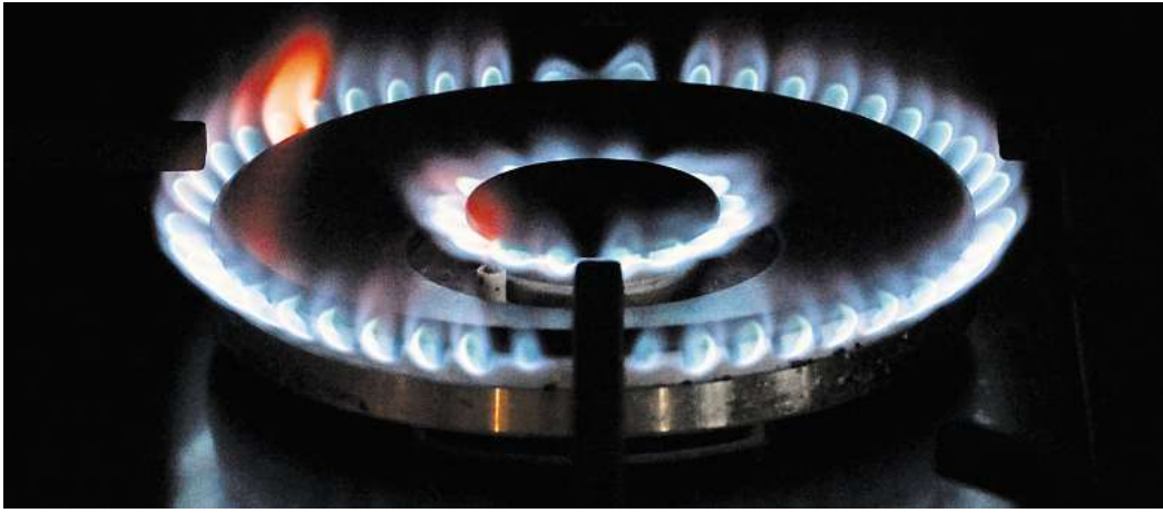
Gasleitungen sollten alle zwölf Jahre von Fachleuten und zusätzlich jährlich selbst per Sichtprüfung kontrolliert werden.