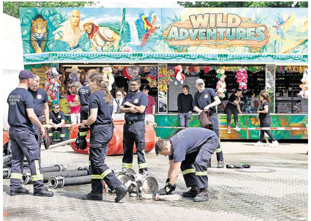
Die Feuerwehren zeigten Ausschnitte aus ihrem Spektrum.

Und die Stadtwache im Peiner Bahnhof? Warum war die am betreffenden Sonntag nicht besetzt? „Der kommunale Ordnungsaussendienst gestaltet gemeinsam mit der Polizei die personelle Besetzung der Stadtwache aus“, so die Stadt. Zurzeit seien dort vier Mitarbeitende der Stadt Schichtdienst im Einsatz. Samstags werde anlassbezogen Dienst geschoben. Sonntags nie. Und dann folgt noch dieser Satz in der Antwort der Stadt: „Der personelle Einsatz orientiert sich an vom Rat der Stadt Peine zur Verfügung gestellten personellen Ressourcen.“ Heißt: Mehr Sicherheit kostet mehr Geld.