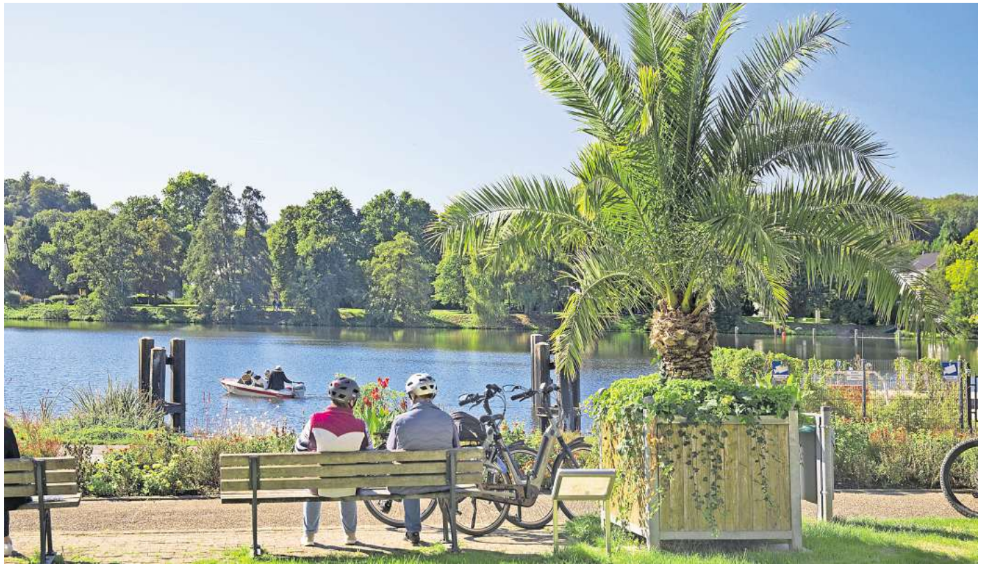
Der Kettwiger Stausee ist ein toller Geheimtipp im Ruhrgebiet.

Mit seiner Länge von 5,2 Kilometern ist der Kettwiger See ein beliebtes Ausflugsziel für einen Spaziergang, insbesondere am Nordufer, zum Picknicken auf den Uferwiesen oder für Fahrradtouren. Dafür bietet sich unter anderem eine Etappe auf dem Ruhrtalradweg an, der auch durch Kettwig und am See entlang führt. Wer Lust auf eine längere Wandertour hat, findet in