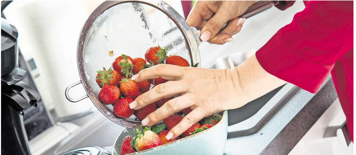
Bleibt der Strunk beim Waschen der Erdbeeren dran, wird der Geschmack nicht verwässert.

Wer seine Erdbeeren ohne Kelch gewaschen hat, greift meist zu reichlich Zucker, um den verwässerten Geschmack