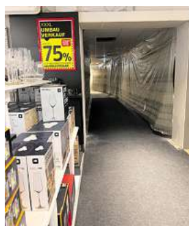
„Staubschutzfolie“: Während der Umbauarbeiten sind einzelne Zonen mit Staubschutzfolie verkleidet, der Verkauf läuft parallel weiter und hält viele Rabatte bereit.