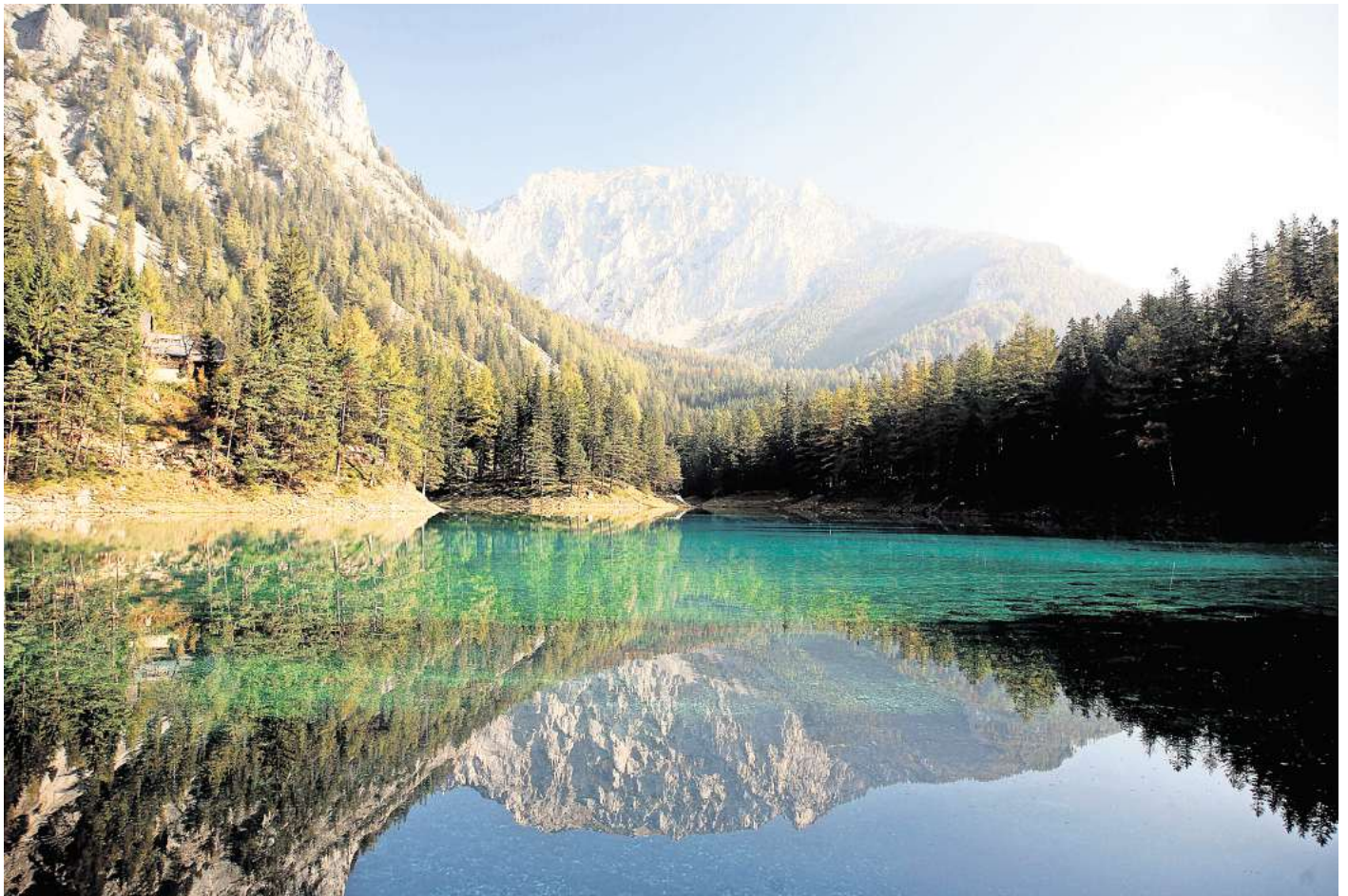
Der Grüne See begeistert mit seiner smaragdgrünen Farbe.

Dabei wird eine ganze Landschaft überflutet. Wiesen, Wanderwege, kleine Brücken und eben auch die Parkbänke verschwinden zeitweise unter Wasser. Der Pegel kann dabei um