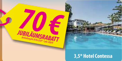
3,5* Hotel Contessa