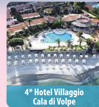
4* Hotel Villaggio Cala di Volpe