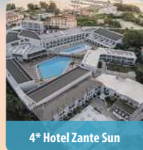
4* Hotel Zante Sun