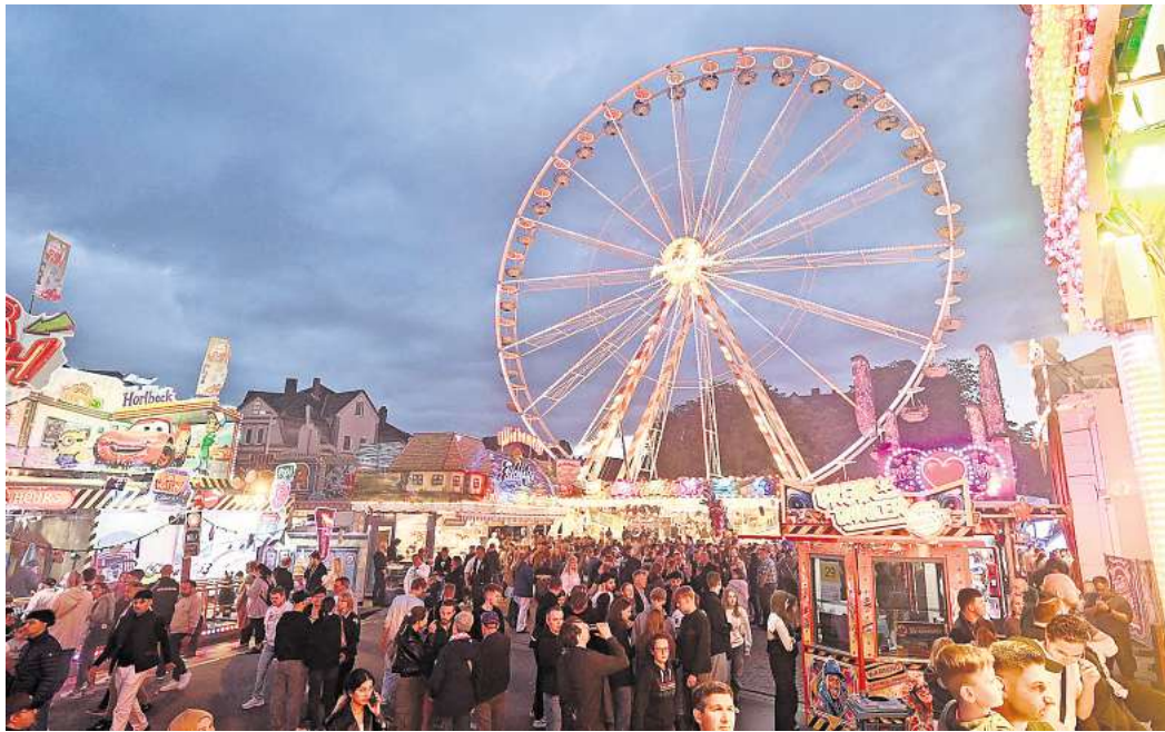
Hoch hinaus geht es in diesem Jahr beim Peiner Freischießen.