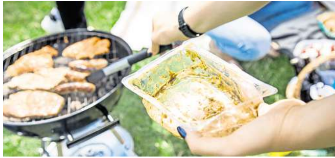
Nach dem Grillen kommt die Trennung: Nicht alles, was nach Verpackung aussieht, landet automatisch im gleichen Müll.

Der abgeknabberte Maiskolben hat seinen Platz hingegen im Biomüll - neben Brotresten, Salatabfällen und Fleisch- und Fischresten.