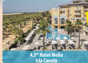
4,5* Hotel Melia Isla Canela

70€ JUBILÄUMSRABATT Bei Buchung bis 30.06.2026 - Code: JUBI70