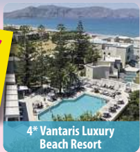
4* Vantaris Luxury Beach Resort

70€ JUBILÄUMSRABATT Bei Buchung bis 30.06.2026 - Code: JUBI70