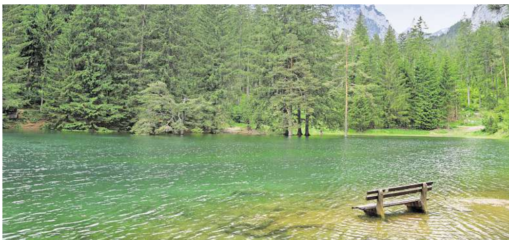
Eine Parkbank unter Wasser – im Grünen See in Österreich ist das Wirklichkeit.

Auch Schwimmen ist nicht gestattet. Besucherinnen und Besucher können das Naturschauspiel heute ausschließlich vom Ufer und den ausgewiesenen Wegen aus bewundern – was dem beeindruckenden Anblick aber definitiv keinen Abbruch tut.