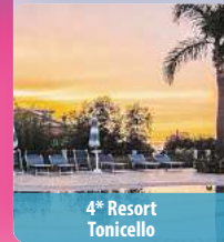
4* Resort Tonicello