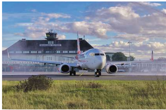
Einzigtägiger Urlaub ab Haustür: Fliegen ab Braunschweig mit momento by DER SCHMIDT

Und daran denken: Code JUBI70 angeben und € 70,- sparen.