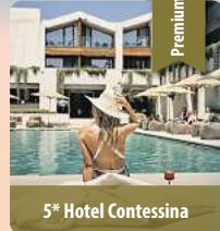
5* Hotel Contessina