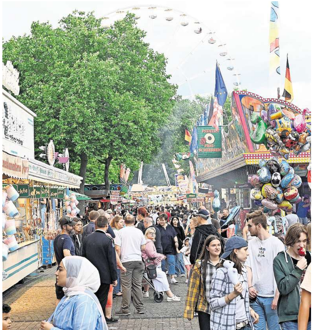
röhliche Menschen feiern in Peine die 5. Jahreszeit.