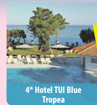
4* Hotel TUI Blue Tropea

70€ JUBILÄUMSRABATT Bei Buchung bis 30.06.2026 - Code: JUBI70