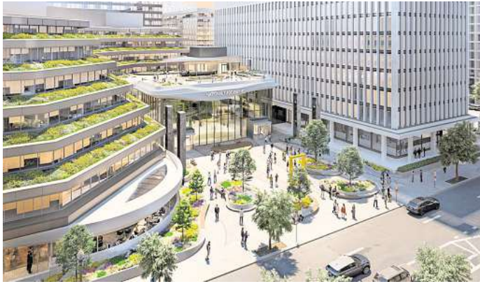
Neues Ziel in Washington: Das National Geographic Museum of Exploration öffnet am 26. Juni – unweit des Weißen Hauses.

Das Museum auf dem Campus der Gesellschaft unweit des Weißen Hauses im Herzen der US-Hauptstadt wurde laut der National Geographic Society für mehr als 300 Millionen US-Dollar komplett neugestaltet – mit dem Ziel, „in jedem Besucher einen Entdecker zu wecken“.