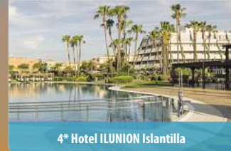
4* Hotel ILUNION Islantilla