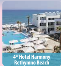
4* Hotel Harmony Rethymno Beach