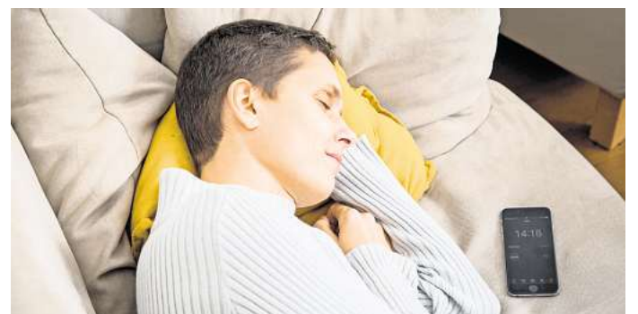
Kurzer Schlaf, große Wirkung: Ein Powernap kann das Wohlbefin- den steigern und die geistige Leistungsfähigkeit verbessern.

Denn: Ein Nickerchen tags- über könne den Schlafdruck ab- bauen und das abendliche Ein- schlafen erschweren, heißt es in dem Beitrag. Insbesondere Men- schen mit Schlafstörungen soll- ten deshalb keine Powernaps nach 15 Uhr einlegen, manche verzichten besser ganz. (dpa)