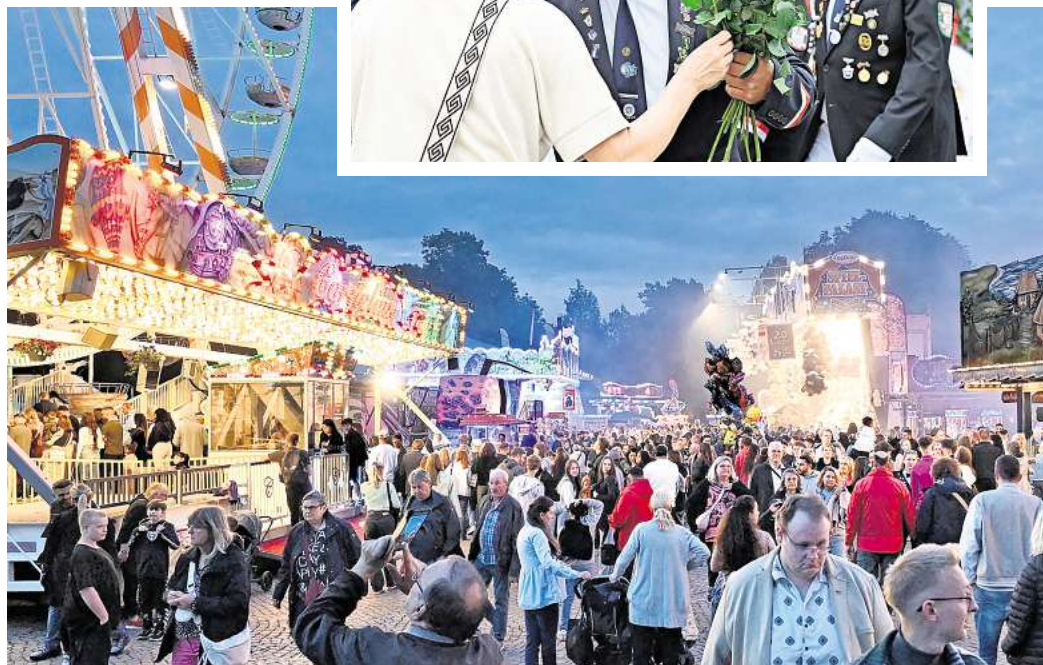
Auf dem Festplatz gibt es für die Besucherinnen und Besucher noch bis Dienstag viel zu erleben. oben: Zum großen Umzug am Eröffnungssonntag gibt es rote Rosen für die Aktiven.

Von 14.30 bis 18 Uhr ziehen die traditionellen „Bunten Umzüge“ durch die Peiner Innenstadt.