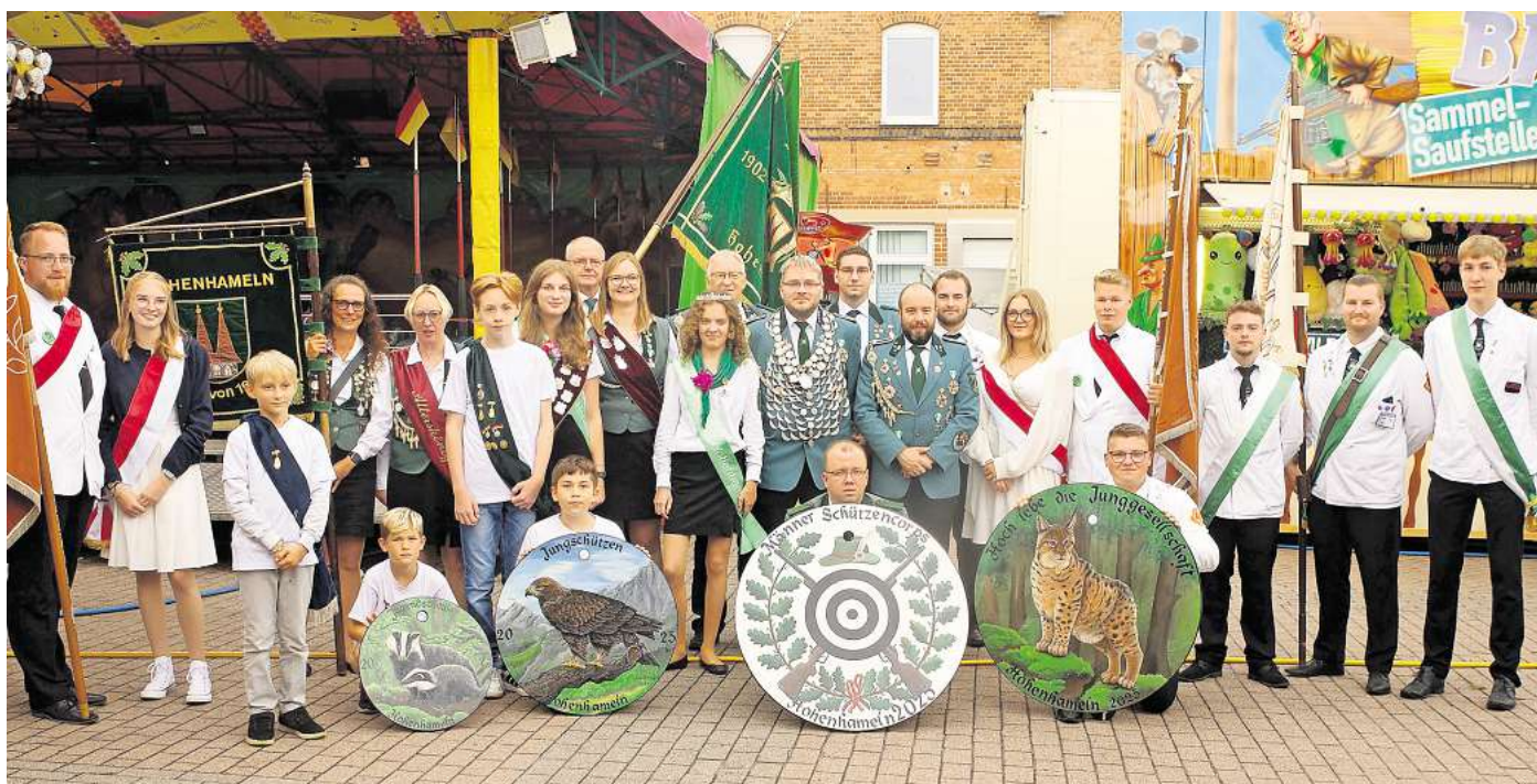
Königinnen, Könige und ihr Gefolge freuen sich auf tolle Schützenfesttage.

Eine liebevoll gewonnene Tradition ist es, dass sich um 18 Uhr alle Abteilungen des Männerschützencorps Hohenhameln und der Junggesellschaft im Festzelt treffen und um 18.30 Uhr die Proklamation aller Könige vornehmen. Diese werden direkt im Anschluss gebührend und von hoffentlich vielen Gäs-