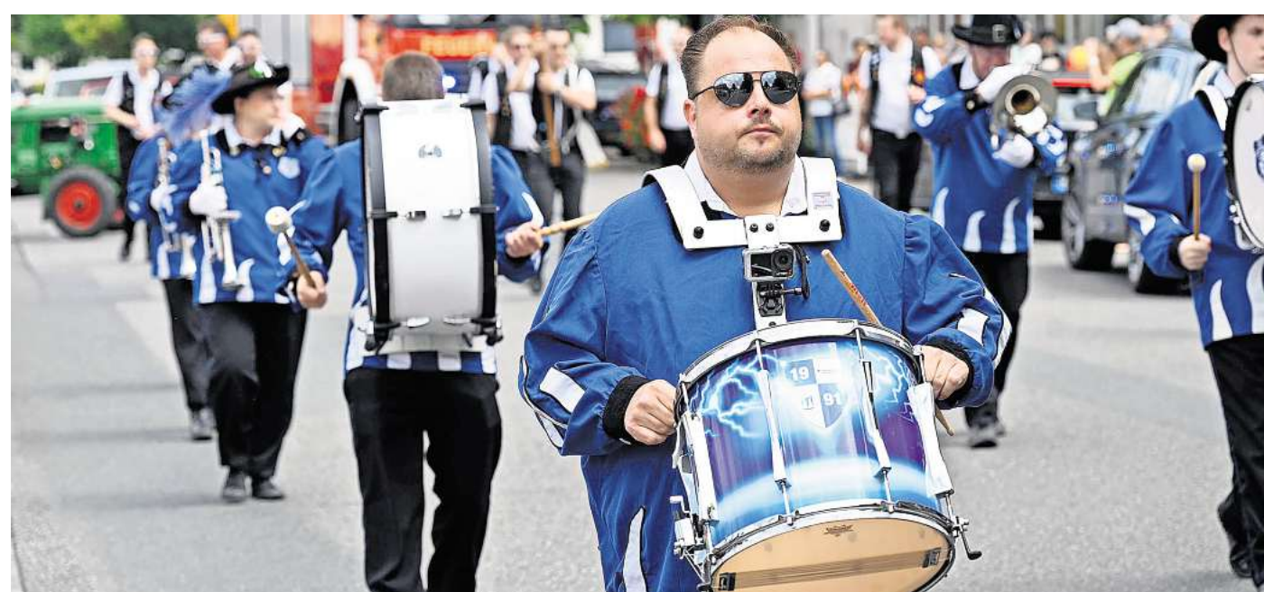
Trommler und Traditionen haben beim Festumzug durch den Ort Vorfahrt.