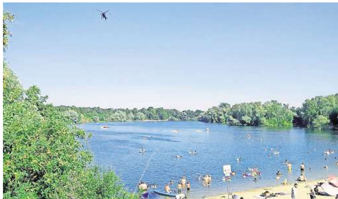
Mit Hubschrauber und Spürhunden suchten Polizei und DLRG am Eixer See nach dem vermissten 17-Jährigen, der später tot aufgefunden wurde.

PEINE. Die Suche nach einem 17-jährigen Jugendlichen, der am Sonntag in den frühen Nachmittagsstunden am Eixer See von Familienangehörigen als vermisst gemeldet wurde, hat am Abend ein trauriges Ende gefunden: Der junge Mann wurde leblos aufgefunden. Jetzt wird auf Hochtouren ermittelt.