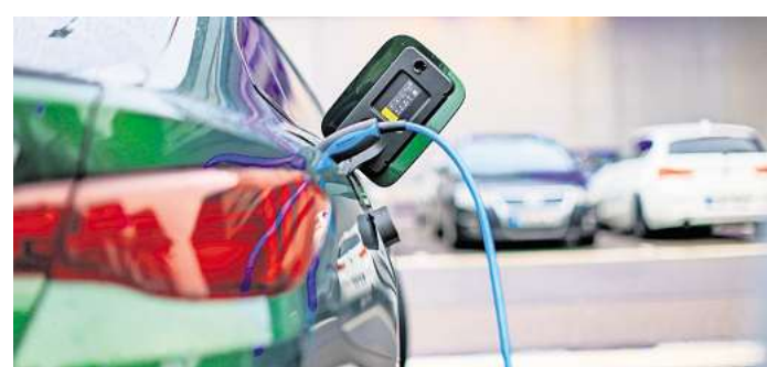
Liegt die tatsächliche Reichweite eines E-Autos deutlich unter der vom Hersteller angegebenen Reichweite, kann dies zum Rücktritt vom Kaufvertrag berechtigen.

Die Konsequenz: Nach einem längeren Rechtsstreit konnte der Käufer aufgrund der Gerichtsentscheidung schließlich das Fahrzeug zurückgeben. Der Kaufpreis plus Zinsen wurde ihm