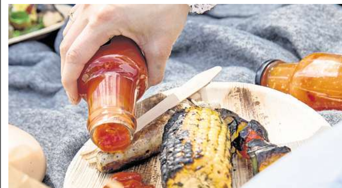
19 BBQ-Saucen hat die Zeitschrift «Öko-Test» untersucht.

Und warum haben die Tester bei einigen Produkten die Noten „mangelhaft“ und „ungenügend“ vergeben? Diese Bewertung bekamen einige BBQ-Saucen unter anderem wegen ihrer Schadstoffbelastung. Sie enthielten etwa Pestizide sowie Schimmelpilze wie Alternariol (AOH) oder Tenuazonensäure (TeA). (dpa)