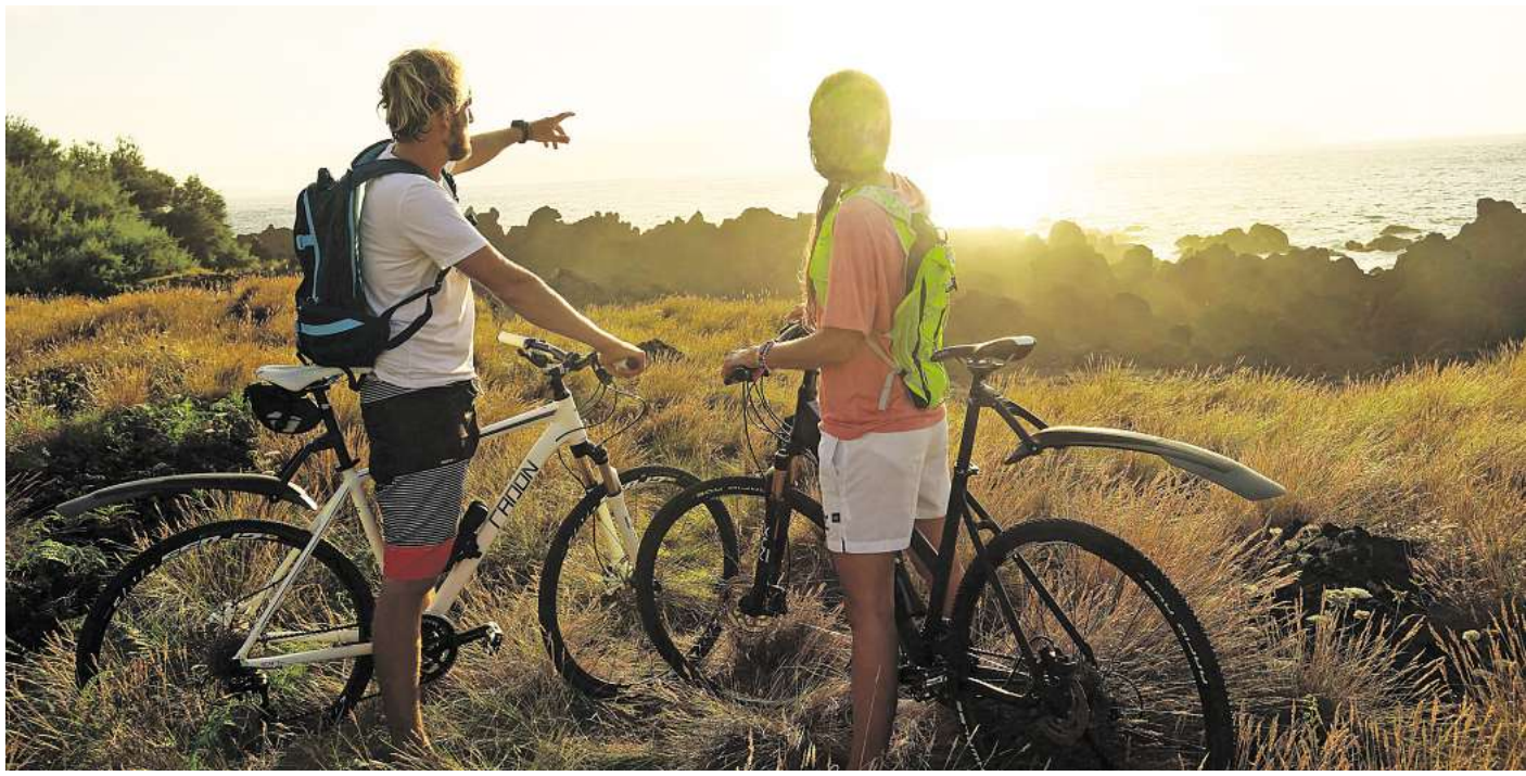
Vor allem Aktivurlauber sollten prüfen, ob und in welchem Umfang Sportarten wie Bergsteigen oder Mountainbiken in der Auslands-Krankenversicherung mitversichert sind.