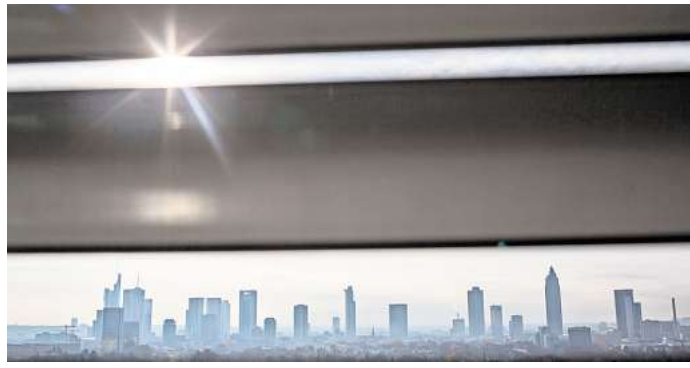
Im Büro helfen helle Jalousien, Vorhänge oder UV-Schutzfolien.