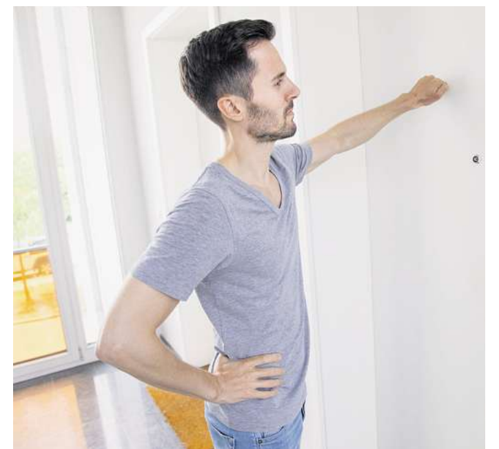
Probleme mit Ihrem Mieter? Eine Mietausfallversicherung kann bei der Bewältigung helfen.

Noch wichtiger als eine Mietausfallversicherung darum: die sorgfältige Auswahl der Mietpartei. Vermieter sollten bereits