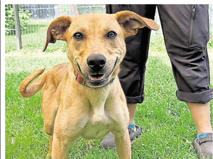
Lebhaft und etwas wild: Die junge Mischlingshündin Neapel aus Rumänien braucht eine liebevolle und geduldige Erziehung.

Interessierte können sich im Tierheim Peine anmelden und einen Besuchstermin vereinbaren. Die Kontakttelefonnummer lautet 05171 52558. Neben Neapel vermittelt das Tierheim Peine auch Hunde, Katzen, Kaninchen und weitere Tiere. Spenden von Futter für Kleintiere, Hunde und Katzen werden gerne entgegengenommen.