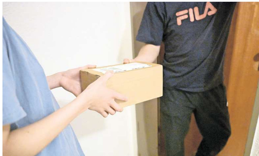
Kleine Gesten in der Nachbarschaft können Anlässe sein, ins Gespräch zu kommen.

Kommunikation über Messenger wie WhatsApp oder Social Media könnten echte Nähe nicht ersetzen, finden gut 83 Prozent. Gleichzeitig wäre es gut