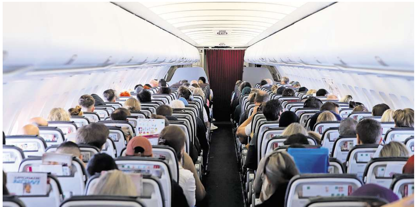
Bloßes Unwohlsein, Kreislaufbeschwerden oder Kopfschmerzen reichen rechtlich nicht aus, um bei einer überhitzten Kabine Anspruch auf Schmerzensgeld gegenüber der Airline geltend machen zu können.

Wichtig zu wissen: Wenn Urlauber eine Reisepreiserminderung des Veranstalters bekommen, kann dieser Betrag in bestimmten Fällen mit der Ausgleichszahlung der Airline verrechnet werden. (dpa)