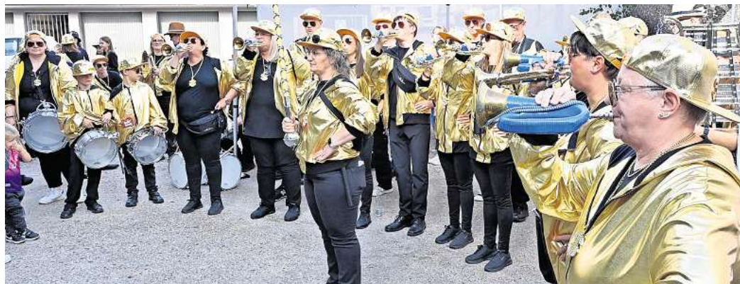
Am Dienstag sorgt der „Bunte Umzug“ für Musik und Freude in der Stadt.