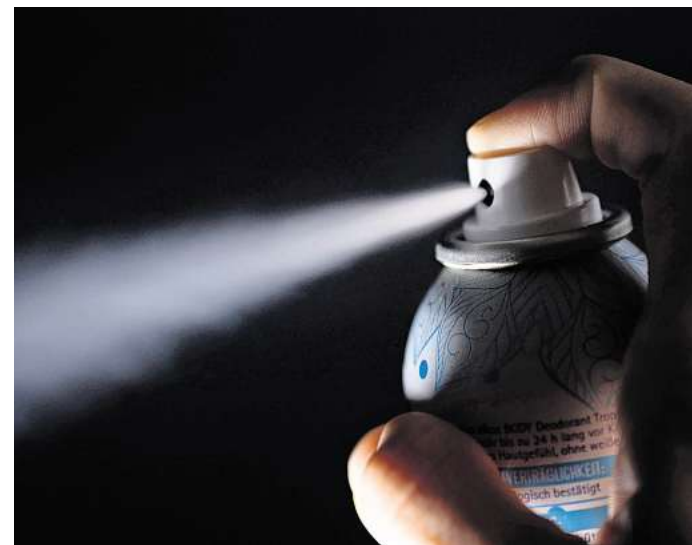
Wie viel Frische-Schutz bieten Deos? «Öko-Test» hat dafür 30 Deodorants unter die Lupe genommen und Herstellerangaben überprüft.

Um die zu ermitteln, sind in der Kosmetikindustrie so ge-