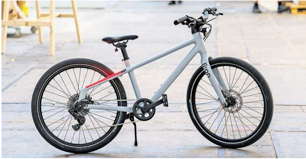
Das Modell «Light 24» vom Hersteller Li:on hat einen Rahmen aus Polyamid und recycelten Carbonfasern und kann durch einen dreistufig verstellbaren Steuersatz «mitwachsen».