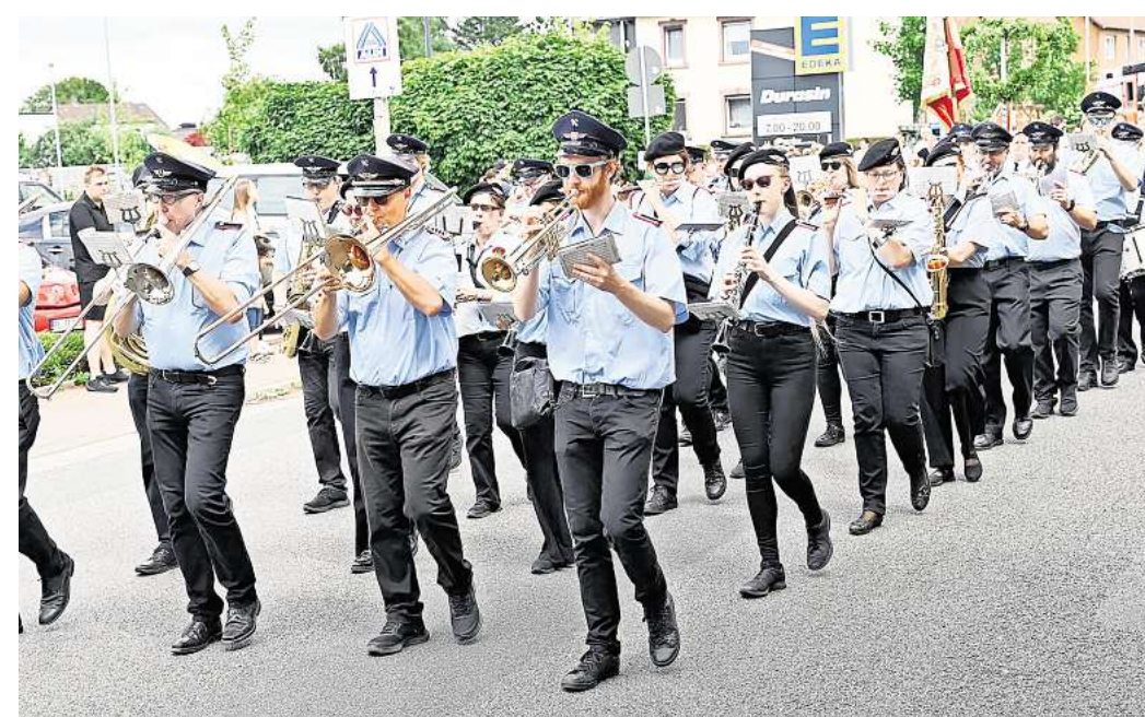
Hochstimmung herrscht auf den Straßen, wenn die Spielleute musizieren.