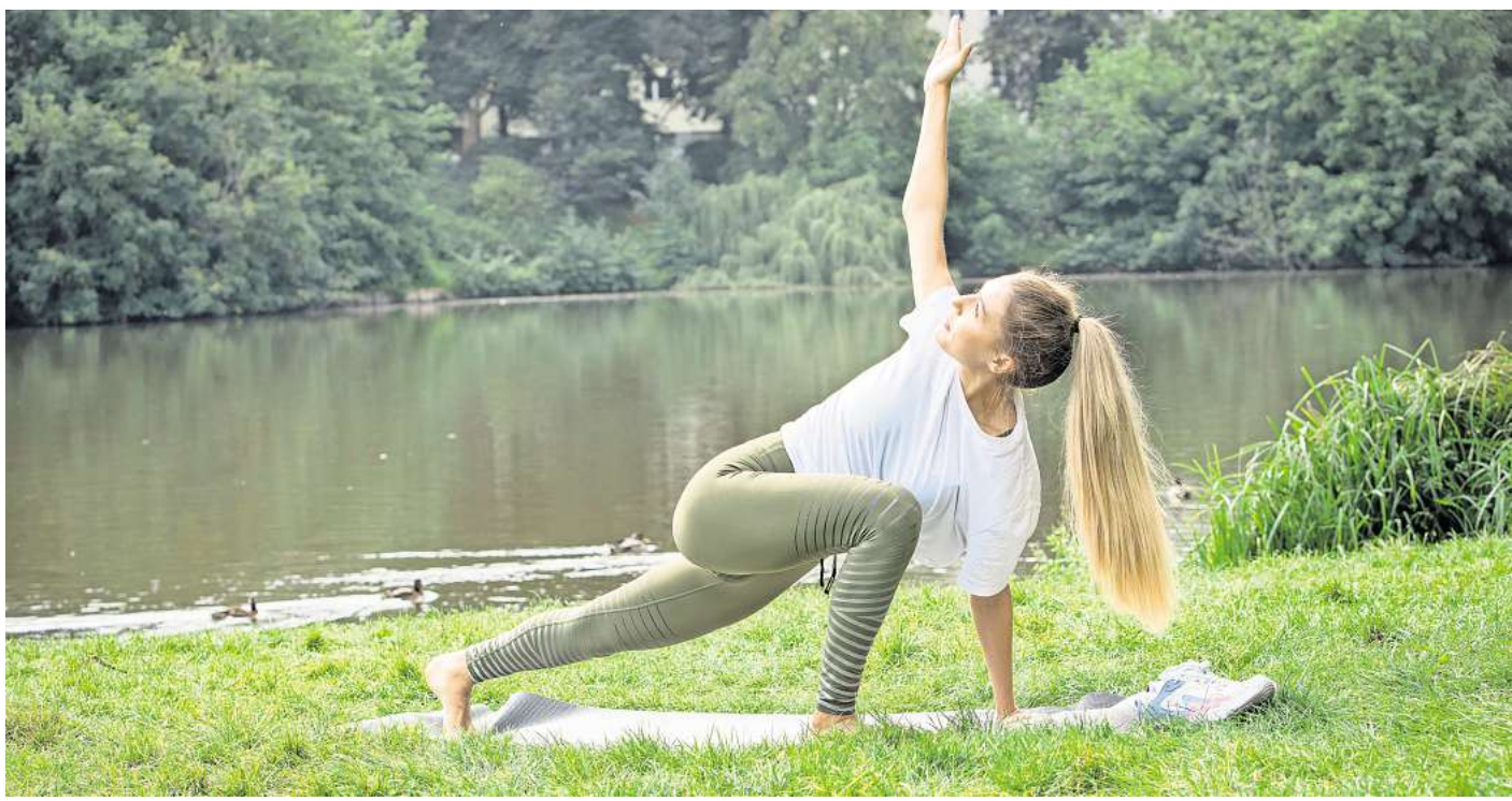
Gar nicht so einfach, wie es aussieht: Bei Yoga (hier: Low lunge twist) kommt es auf Koordination und Balance an - das sind bei ADHS oft Herausforderungen, auch aufgrund der speziellen Struktur im Hinteren Kleinhirn