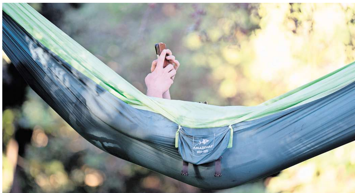
Lieber luftig in der Hängematte als heiß im Handschuhfach: Auch das Smartphone mag's entspannt im Sommer.

Sonne nehmen, Hülle entfernen und wenn möglich ausschalten. ▶ Zum Abkühlen Geräte an