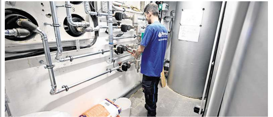
Alle Fördermittel für den Umstieg auf eine klimafreundliche Heizung abzugreifen, kann für eine WEG durchaus kompliziert sein. Die einzelnen Haushalte haben separate Möglichkeiten.

„Gerade bei größeren Sanierungsprojekten lohnt es sich, die Fördermöglichkeiten genau zu prüfen“, sagt Sandra Duy, „Finanztip“-Expertin für energetische Sanierung. Ihr Rat: Schon vor dem Beschluss zum Heizungstausch die persönlichen Fördervoraussetzungen prüfen und die Unterlagen bereitlegen. Dazu gehören insbesondere Meldebestätigung, Grundbuchauszug und bei Beantragung des Einkommensbonus die relevanten Einkommensteuerbescheide. Ferner sollten Eigentümer ihre Verwaltung frühzeitig um die Angaben aus dem WEG-Basisantrag bitten, damit sie den Zusatzantrag fristgerecht stellen können. (dpa)