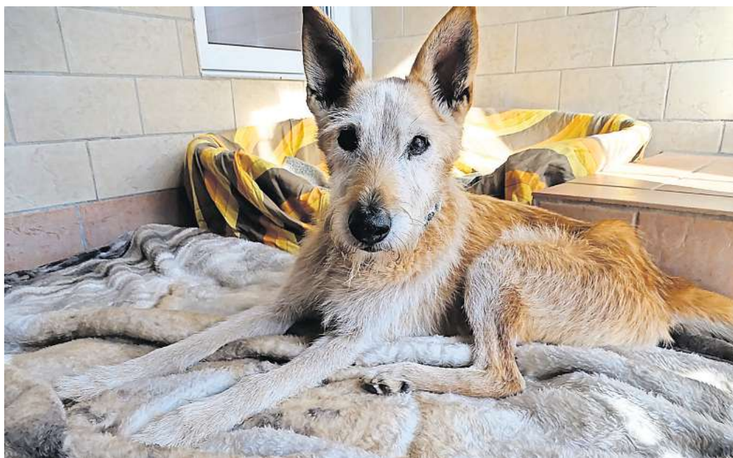
Möchten nicht herumgereicht werden: Gerade Hunde binden sich eng an ihre Halter und Halterinnen und sind daher als Miethaustier nicht geeignet. Dogsharing könnte eine Alternative sein.

Direkt zur Umfrage: Scannen Sie den QR-Code mit dem Smartphone.