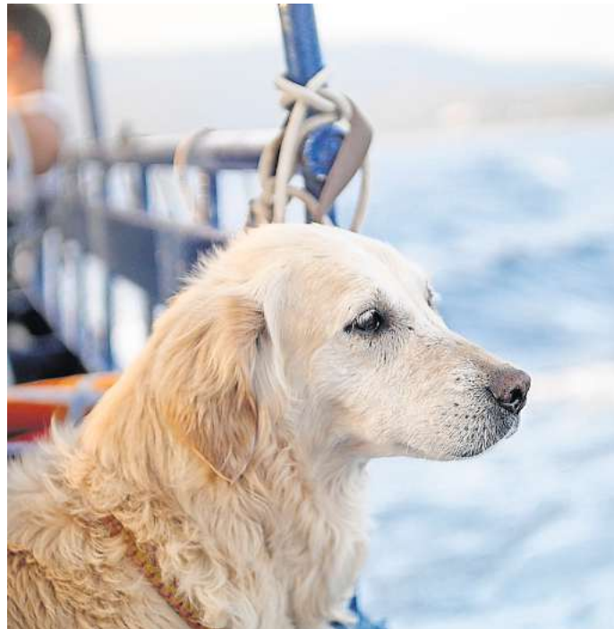
Ein Labrador auf hoher See.

„Joska ist das erste Diensttier, das diesen erhabenen Status erreicht hat, und wir wollten sie mit einer Veranstaltung ehren,