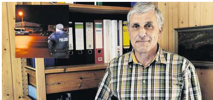
Der ehemalige Strafrichter Ulrich Pohl aus Hohenhameln fällt das Urteil im Ampelmord-Prozess. Ein Mitglied einer Hildesheimer Clanfamilie war zu lebenslanger Haft verurteilt worden.

Und das scheint ein großes Problem bei der Ermittlungsarbeit im Clan-Milieu zu sein. Kaum einer spricht. „Sie sagen nichts, sie lügen und im Gerichtsverfahren wird sich lustig gemacht“, berichtet der ehemalige Richter. Das mache die Sache extrem schwierig. „Und wer redet, muss Repressalien befürchten“, weiß Pohl.