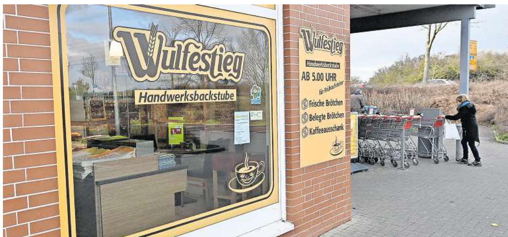
Die Bäckerei und Konditorei Wulfestieg aus Essinghausen hat Insolvenz angemeldet.

Wulfestieg betreibt zehn Filialen in Peine, Essinghausen, Steverdorf, Vöhrum, Bünten, Groß Lafferde, Vechelde, Hämeler-