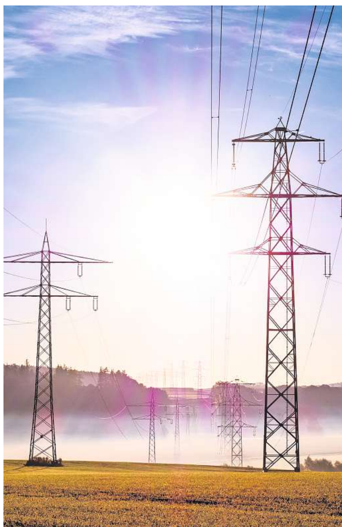
Stromtrasse: Am späten Sonntagabend war es zu einem großflächiger Stromausfall gekommen. Wie bereitet sich der Kreis Peine auf solche Schadenslagen vor?

Die nächste Kreistagssitzung findet am Mittwoch, 15. März statt. Der Fachausschuss tagt am Montag, 6. März.