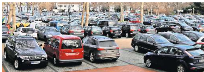
Schützenplatz in Peine: Tagesparkscheine dort kosten künftig 4,20 Euro (bisher 3,50 Euro).

Peine. Autofahrer müssen fürs Parken in der City ab 1. April tiefer in die Tasche greifen: Innenstadtnahe Parken am Echternplatz (Tarifzone 1) soll künftig 1,70 Euro je angefangene halbe Stunde kosten (vorher: 1,40). Das Abstellen eines Autos in der Tarifzone 2, beispielsweise am Werderpark oder Bahnhofplatz, wird um 15 auf 50 Cent je 30 Minuten angehoben. Tagesparkscheine in Tarifzone 2, etwa am Schloßwall oder am Schützenplatz, kosten künftig 4,20 (bisher 3,50) Euro. Für den 3-Stunden-Parkschein sind 2,60 (2,10) Euro zu zahlen.