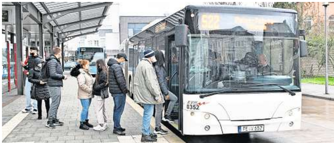
Keine Masken mehr in Peines Bussen: Die Pflicht wurde abgeschafft.