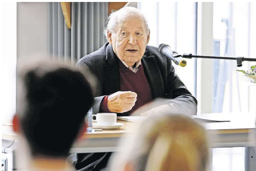
Der gebürtige Peiner Salomon „Sally“ Perel ist gestorben.