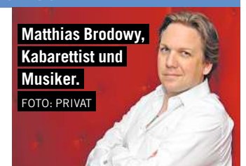
Matthias Brodowy, Kabarettist und Musiker.

Es fällt manchmal sehr schwer, zwischen all den düsteren und traurigen Meldungen einer Woche mal einen Lichtblick zu erhaschen, eine positive Nachricht, irgendetwas Hoffnung stiftendes. Aber wer sucht, der findet. Und ich bin auf einer Baustelle in Bamberg fündig geworden. Bamberg hat nicht nur einen wunderschönen romanischen Dom in dem sich der berühmte „Bamberger Reiter“ befindet, sondern auch eine zauberhafte Altstadt. Natürlich haben Sie, wenn Sie in einem dieser jahrhundertealten, ungedämmten Häuser wohnen, eine nicht unbedeutende Rechnung Ihres Energieversorgers. Alternativ dazu entstehen dort an Regnitz und Main jetzt 1400 Wohnungen in umweltfreundlichstem Standard. Nicht Gas, nicht Kohle sorgen dort dafür, dass es wohl warm wird, sondern Mutter Erde und wir selbst. Fangen wir mit der Erde an. Erdkollektoren und Sonden sorgen mit Hilfe