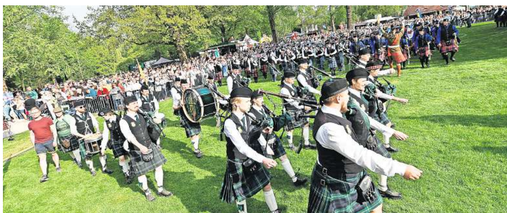
Das beliebte Highland Gathering startet an diesem Wochenende im Stadtpark.

Das Highland Gathering in Peine ist das größte Treffen dieser Art auf dem europäischen Festland. Nicht umsonst haben sich für dieses Jahr allein bei den Pipern 150 Solo-Teilnehmer angemeldet. Hinzu kommen 17 Piper-Bands aus ganz Deutschland, Dänemark, Holland, Belgien und der Schweiz, die heute in 33 Durchgängen bei den musikalischen Wettbewerben auf der Bühne im Stadtpark stehen werden. Die Bands treten an zu „The Peine International Pipe Band Championships“. Dabei