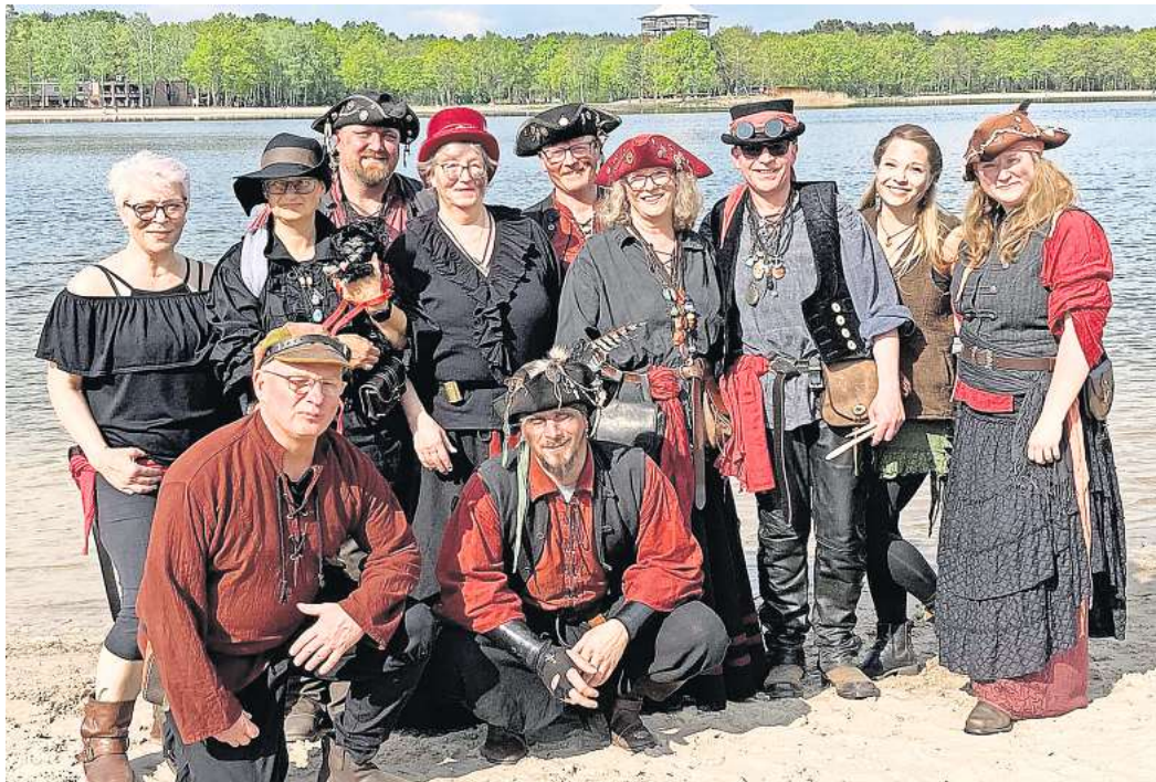
„Das Piratenpack“ bringt am Sonntag musikalisch Schwung ins Festzelt.

ab 16 Uhr: Kaffee und Kuchen im Festzelt, für tolle Stimmung sorgt „Das Piratenpack“