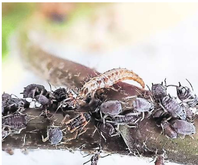
Den Blattläusen geht es an den Kragen: Nützlinge helfen bei der Schädlingsbekämpfung.

Besonders praktisch: Es fliegen auch Nützlinge, wie zum Beispiel Marienkäfer einfach zu. Oder Nebe bestellt sie bei Spezialfirmen, die sich auf Nützlingsproduktion für Gärtnereien, aber auch zum privaten Gebrauch, spezialisiert haben. In einer Kartusche sind etwa 1000 Schlupfwespen für 500 Quadrat-