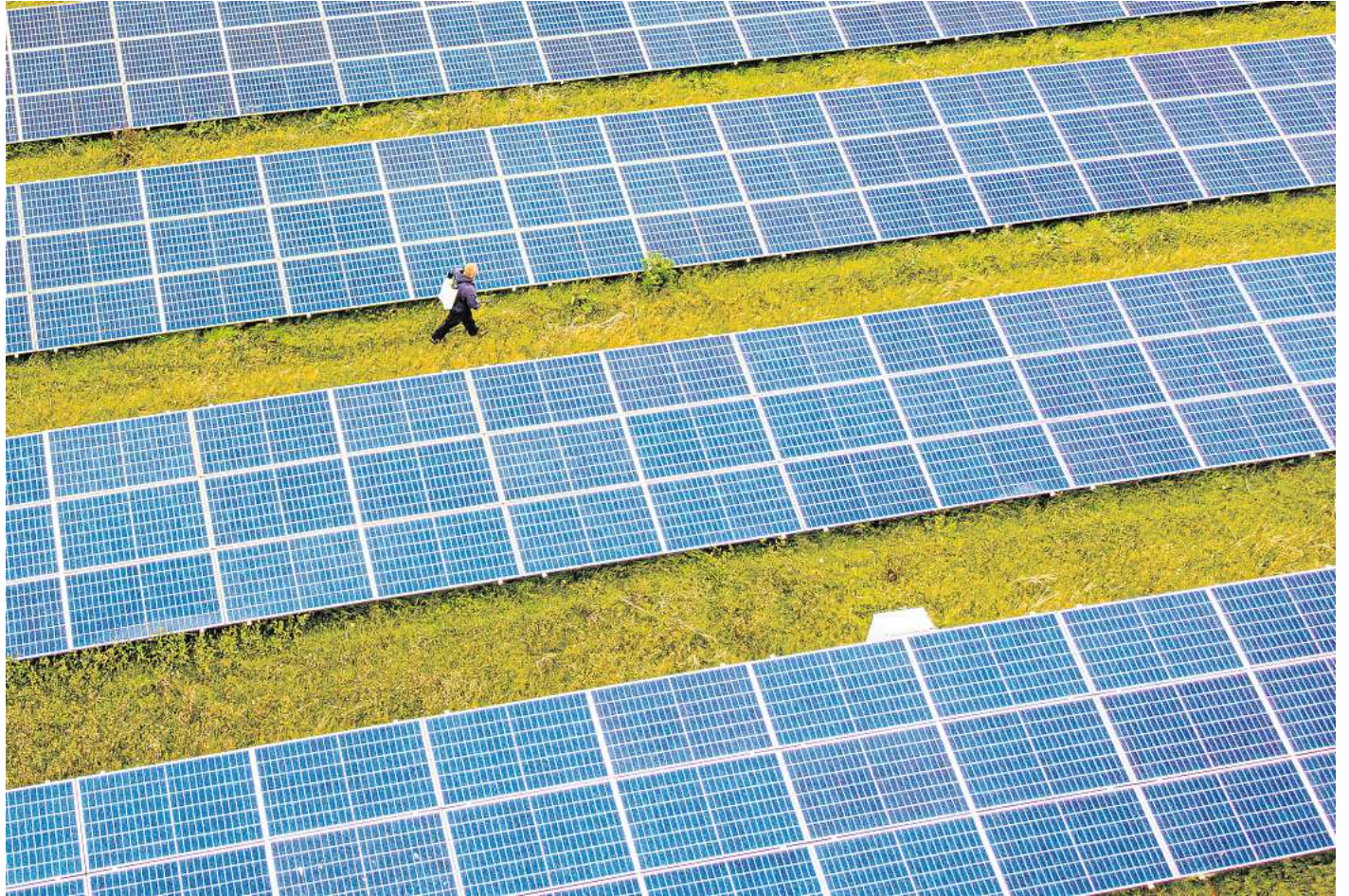
Auf der Fläche zwischen Berkumer Weg und Mittellandkanal soll ein Photovoltaik-Park entstehen.

Die Stadt Peine ist allerdings gar nicht Eigentümerin des Areals: Es handele sich um eine