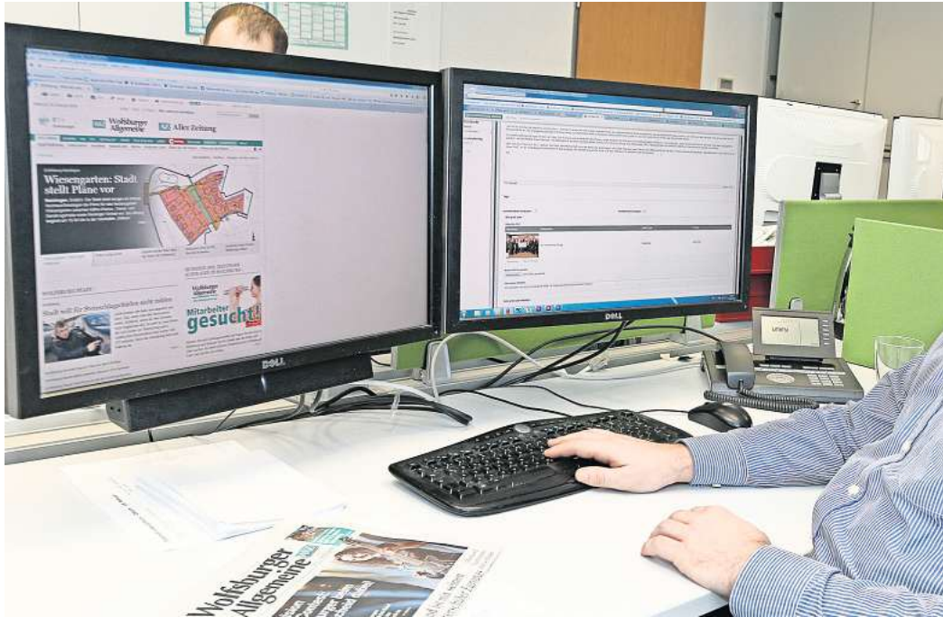
Würden Sie gerne in einer Vier-Tage-Woche arbeiten?