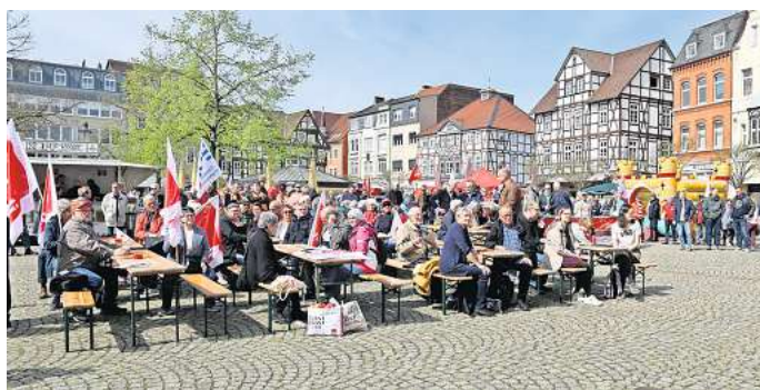
Großes Interesse: Rund 250 Menschen nahmen an der 1. Mai-Kundgebung des DGB auf dem Marktplatz teil.

Ohne die Gewerkschaften hätte es die drei Entlastungspakete der Bundesregierung zur Abfederung der hohen Energiekosten und der hohen Lebenshaltungskosten nicht gegeben. Staatliche Hilfen seien aber nur ein Notnagel, erklärte Runge. Voraussetzung für wirtschaftlichen Aufschwung seien stabile Reallöhne und eine stabile Kaufkraft. Die Erhöhung des Mindestlohns auf zwölf Euro verbessere die Situation von mehr als sechs Millionen Menschen. Allerdings fresse