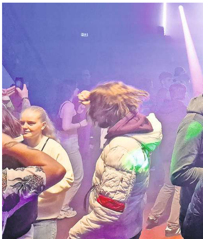
Premiere: In der Event Hall veranstaltete fand die "Heart Pre-Party" statt.