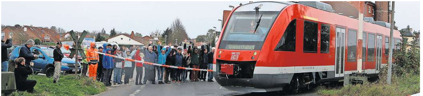
Testfahrten gab es auf der Strecke Braunschweig – Harvesse bereits.

Harvesse. Gute Nachrichten für den Kreis Peine: Die Reaktivierung der Bahnstrecke Braunschweig – Harvesse – im Volksmund häufig „Spargelexpress“ genannt – soll zügig fortgesetzt werden. Das ist das Ergebnis der zweiten Sitzung des „Parlamentarischen Lenkungs-Kreises Streckenaktivierung“. „Wir haben das Ziel, so viele Strecken wie möglich zu reaktivieren. Dabei halten wir das Tempo hoch: Heute haben wir bereits konkrete Projekte benannt“, sagte der niedersäch-