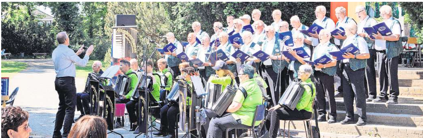
Sorgten wieder für beste Stimmung: Die Dungelbecker Pisserdohlen gaben gemeinsam mit dem Akkordeonorchester Wendeburg/Vechelde ein Freiluft-Konzert im Peiner Stadtpark.

Mit dem Lied „Tulpen aus Amsterdam“ begann eine musikalische Reise, die mit „Griechischem Wein“ und der „Schwarzwaldmarie“ fortgeführt wurde. Aber auch ernste Töne hatten die Musiker mitgebracht: „Gebt den Kindern eine Welt aus Geborgenheit und Frieden“ mahnten sie. Dass das Publikum recht textsicher ist, bewies es einmal mehr bei den schmissigen Schlagern. So zählten sie nicht nur täglich ihre