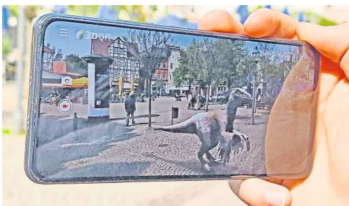
Zum Jubiläumsfest lässt moderne Technik die Dinos wieder auf- erstehen.