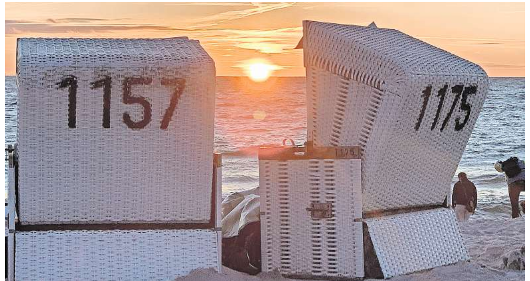
Sonnenuntergang am Strand von Westerland auf Sylt: Dieses Foto hat PAZ-Leser Axel Rothes in seinem vergangenen Sommerurlaub geschossen.

Machen Sie mit: Es gibt zehn Jahresabos von PAZ+ zu gewinnen