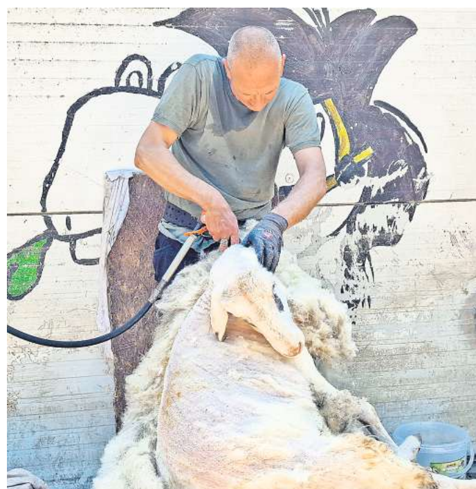
Rund 800 Besucher lernten jetzt Wissenswertes rund um das Thema Tiere und deren Haltung.