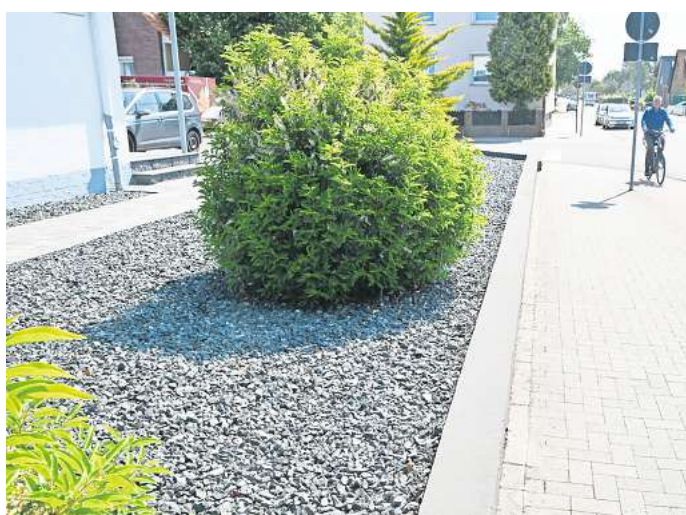
Die Anzahl von Schottergärten soll reduziert werden.

Das Verbot für Schottergärten gelte nicht nur im Peiner Land,