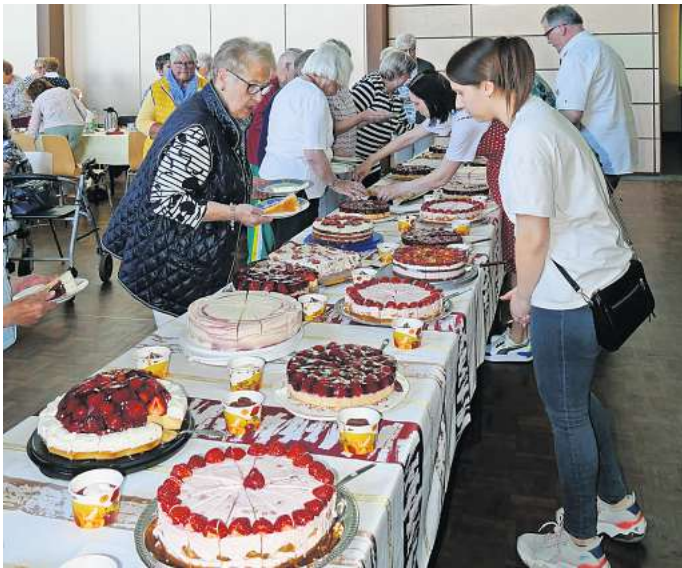
Erdbeerfest in Vöhrum: Mehr als 30 Erdbeerkuchen wurden im Dorfgemeinschaftshaus angeboten.