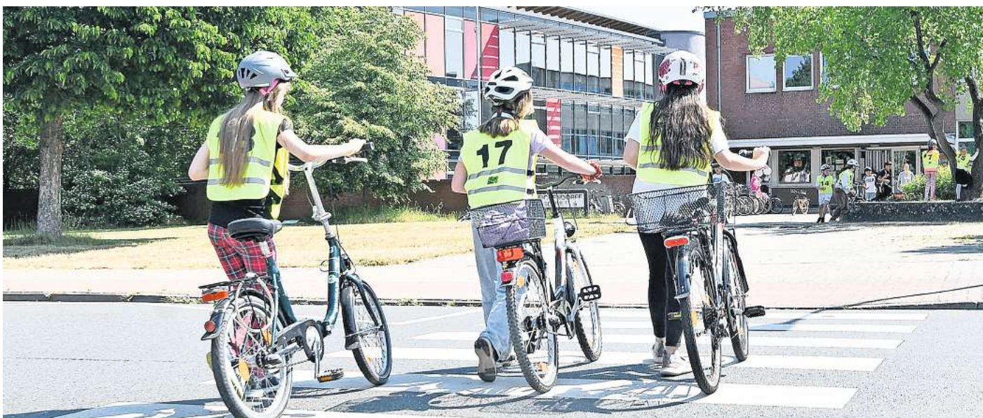
Radfahrprüfung der Eichendorffschule: Der Zebrastreifen war bei der Strecke die letzte „Hürde“ für die Kinder. Denn sie mussten daran denken, vom Rad abzustiegen und zu schieben.