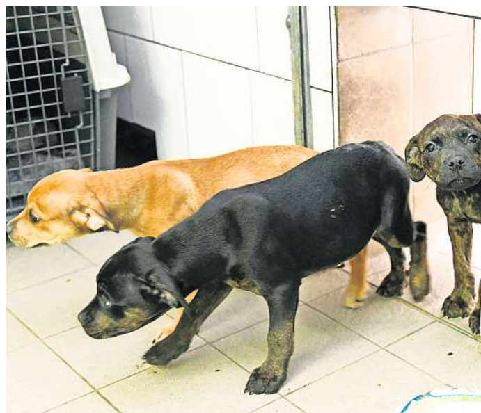
Diese Welpen wurden vor dem Peiner Tierheim ausgesetzt. Das Tierheim stellte nun Strafanzeige.

Zudem kann nach Paragraph 20 auch ein befristetes oder dauerhaftes Tierhalteverbot gegen den Besitzer ausgesprochen werden.