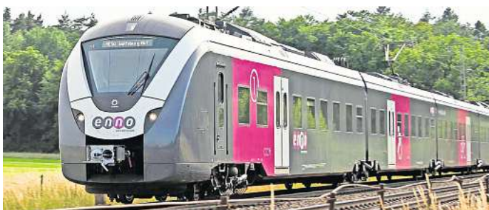
Der Enno auf der Fahrt nach Wolfsburg über Broistedt und Woltwiesche.

Der Schnellbus zwischen Wolfsburg und Braunschweig hält an der Hafenstraße in Fallersleben und Braunschweig, Petzvalstraße, mit Übergang zur Stadtbahnlinie 3 Richtung Innenstadt. Der Expressbus verkehrt ohne Zwischenhalt zwischen den Hauptbahnhöfen in Wolfsburg und Braunschweig. Zur besseren Orientierung seien die einzelnen Buslinien farblich unterschiedlich gekennzeichnet. Auch in den