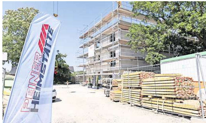
So sieht der Rohbau des neuen Gebäudes in Telgte aus.

Derzeit sei in der Stadt Peine ein hoher Bedarf an preiswertem Wohnraum festzustellen. „Mit dem Neubau des barrierearmen und energieeffizienten Wohnhauses leisten wir einen weiteren Beitrag zur Entspannung auf dem Wohnungsmarkt in Peine“, so Gottschalk. Der Neubau sieht die Errichtung von vier Zweizimmer-Wohnungen und zwei Vier-Zimmer-Wohnungen vor. Die übrigen sechs Wohneinheiten seien für eine Belegung mit jeweils drei Personen geeignet. Die Vier-Zimmer-Wohnungen sollen im Maisonetten-Stil ge-