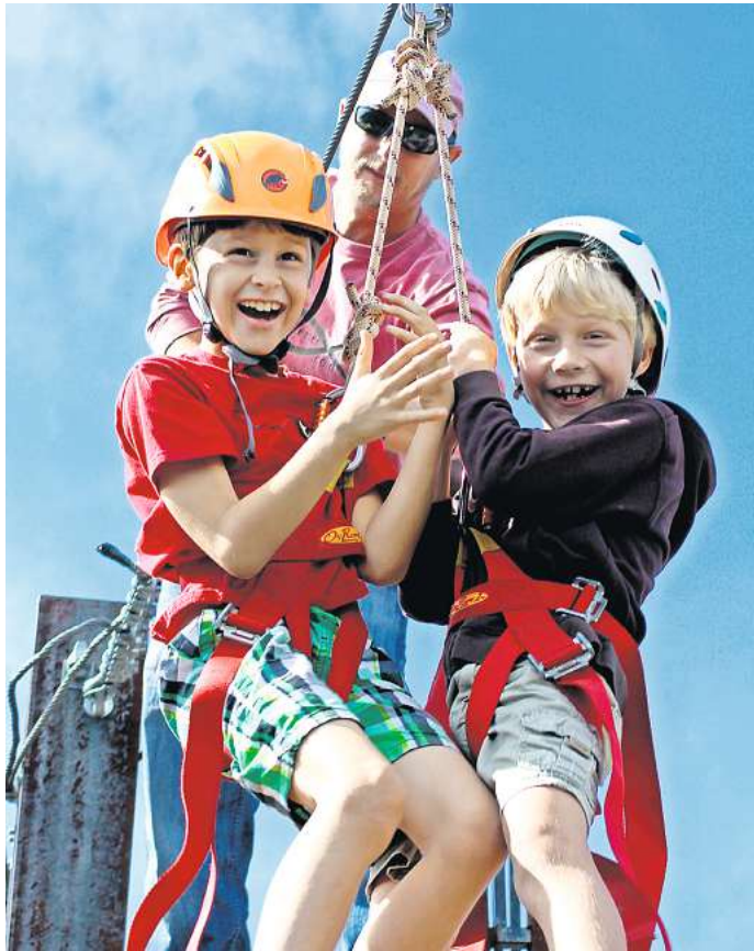
Der Ferien-Countdown sorgt für spannende Momente.

Mundstock. Damit gibt es Zugang zu allen exklusiven Inhalten von der Peiner Allgemeinen Zeitung wie zum Beispiel Hintergrundberichte, Eilmeldungen, Bildergalerien, Podcasts sowie Veranstaltungs- und Freizeittipps auf www.paz-online.de .