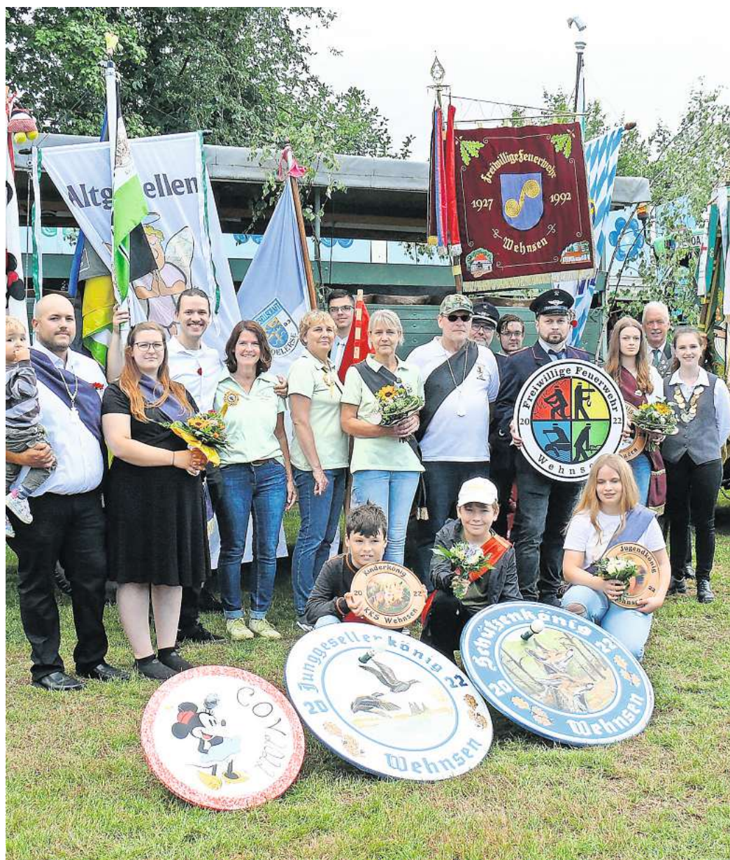
Auch die Schützenköniginnen und Schützenkönige vom vergangenen Jahr freuen sich schon aufs Schützenfest.

Alle weiteren Infos gibt es unter www.wehnsen.de