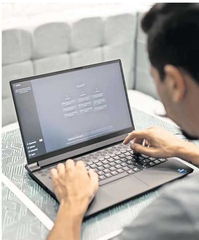
ChatGPT gehört zu den am schnellsten wachsenden Internetanwendungen aller Zeiten.

Zugleich zeigte sich Brantner optimistisch, vielen der Sorgen angesichts künstlicher Intelligenz begegnen zu können. Das gilt auch für den Arbeitsmarkt: Im Moment ringe Deutschland vor allem mit einem Arbeitskräftemangel, Roboter und KI-Lösungen könnten da Abhilfe bieten. Auch betonte sie, dass Automatisierung etwa in der Industrie nichts Neues sei – ohne Robotereinsatz könnten viele Unternehmen ohnehin nicht im vergleichsweise teuren Deutschland produzieren. „Insofern kann KI sogar dabei helfen, Standorte und damit Arbeitsplätze zu sichern.“