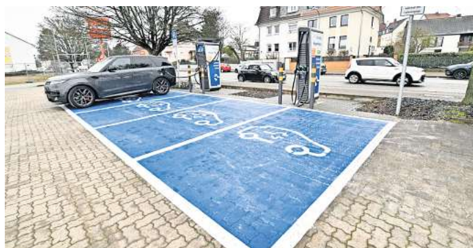
Mehr Ladestationen könnten E-Autos im Landkreis Peine attraktiver machen.

Und dann sei da noch die „German Reichweitenangst“. Bei einem Benziner habe wohl kein Autofahrer jemals Sorge gehabt, ihn nicht tanken zu können. So müsse das auch bei den E-Autos werden.