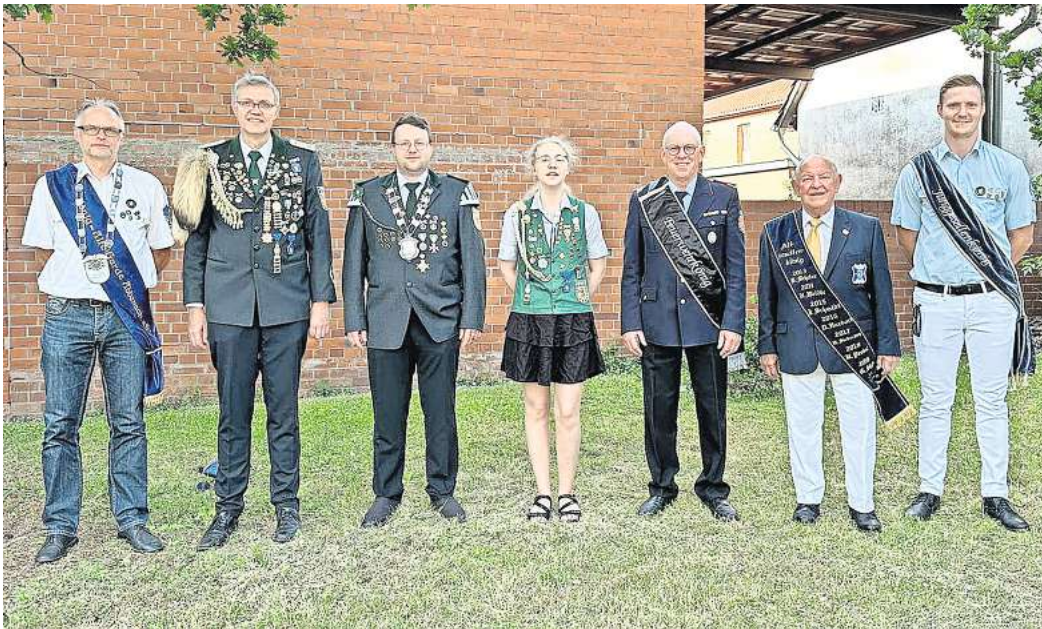
Auch die Könige aus dem vergangenen Jahr sind schon gespannt aufs Schützenfest.