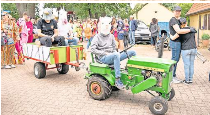
Immer wieder ein großer Spaß: Der bunte Umzug beim Schützenfest in Abbensen.