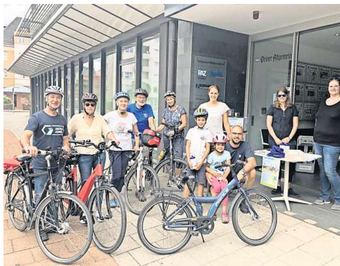
Auch bei der PAZ können Radelnde auch dieses Jahr wieder fleißig stempeln.

02861 890 60 902 deutsche-glasfaser.de/schnelles-internet