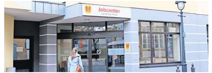
Jobcenter in Peine: Bürgergeldempfänger sollen ab Juli noch besser bei ihrer Weiterbildung unterstützt werden.

Mit der Eingliederungsvereinbarung legten Arbeitsamt und Arbeitssuchende bisher in einem Gespräch fest, was beide Seiten tun müssen, damit die Betroffenen wieder eine Arbeitsstelle finden. Während Hartz IV galt hier der „Vermittlungsvorrang“, bei dem Arbeitssuchende möglichst schnell in oft prekäre Jobs vermittelt wurden. „Beim Kooperationsplan wird dieser Plan auch schriftlich festgehalten und es gilt: Die Weiterbildung geht vor“, weiß Rose. So können sich die Betroffenen dann beispielsweise über drei Jahre hinweg einen berufsqualifizierenden Abschluss