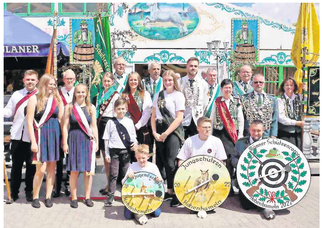
Die Königinnen und Könige des vergangenen Jahres freuen sich schon aufs Schützenfest.