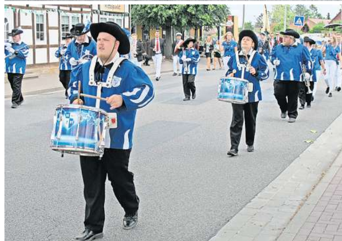
Schützenfest: Der große Umzug in Hohenhameln findet am 9. Juli statt.