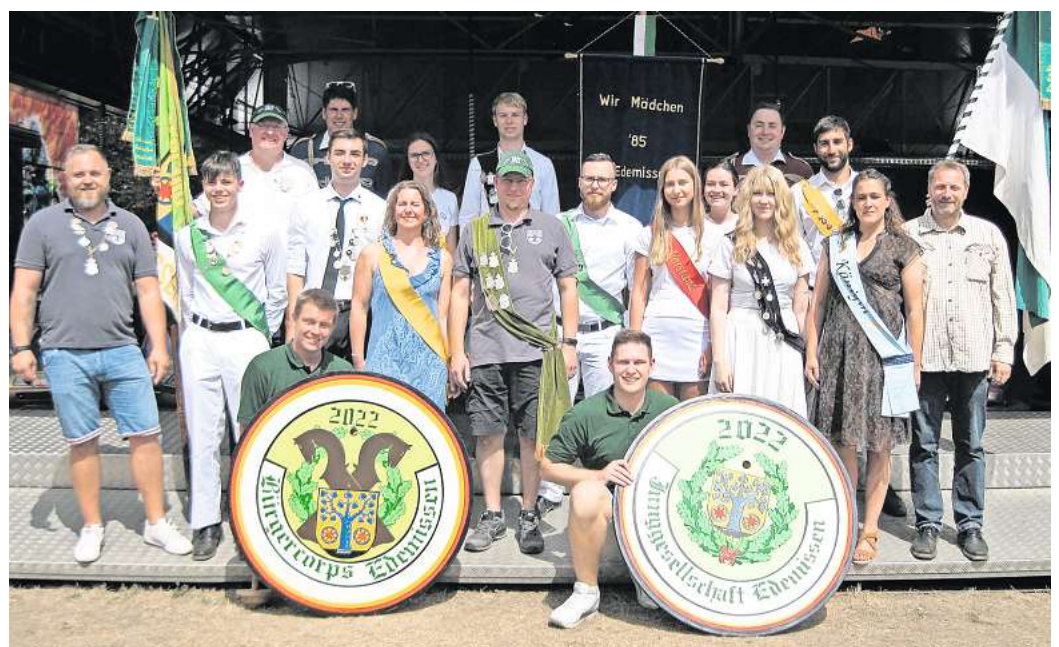
Aufs Schützenfest freuen sich auch die Königinnen und Könige des vergangenen Jahres.

Ein weiteres Highlight: der Festumzug am Sonntag, 23. Juli. „Wir bitten um rege Beteiligung und das Schmücken der Häuser“, hofft er auf eine tatkräftige Unterstützung der Dorfgemeinschaft.