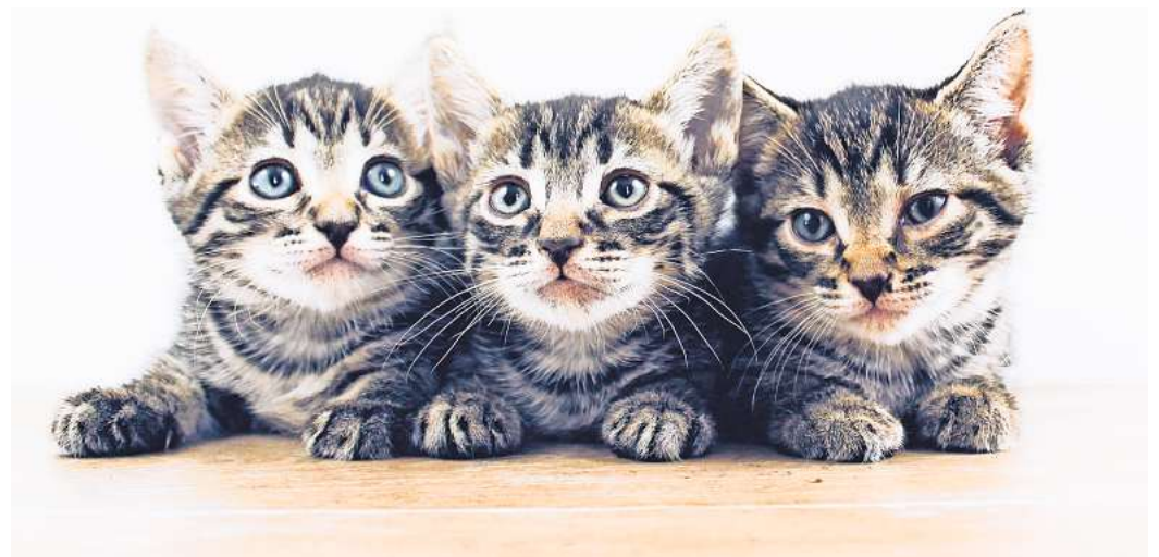
Das Verfahren stellt sicher, dass die Identität der Anbieter von Katzen überprüft wird.

Dank dieses Systems können Käufer nun sicher sein, dass die Katzen-Anbieter auf DeineTierwelt vertrauenswürdig sind. Das Verfahren stellt sicher, dass die Identität der Anbieter überprüft wird. Diese Maßnahme ist ein großer Schritt, um die Anonymität beim Online-Handel vor allem mit Kitten zu verringern und potenzielle Betrugsfälle zu verhindern. Denn illegale Tierhändler verkaufen skrupellos Jungtieren an Tierliebhaber, in-