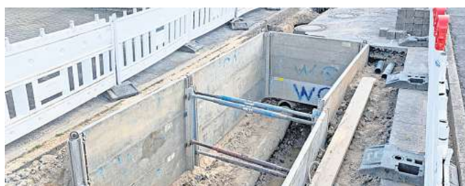
Auf einer Fläche von rund fünf mal drei Metern ist der mögliche Tagesbruch freigelegt und gesichert worden.

Dadurch, dass der mögliche Tagesbruch nur auf der Straße gefallen ist, seien umliegende Grundstücke von den Senkungserscheinungen augenscheinlich