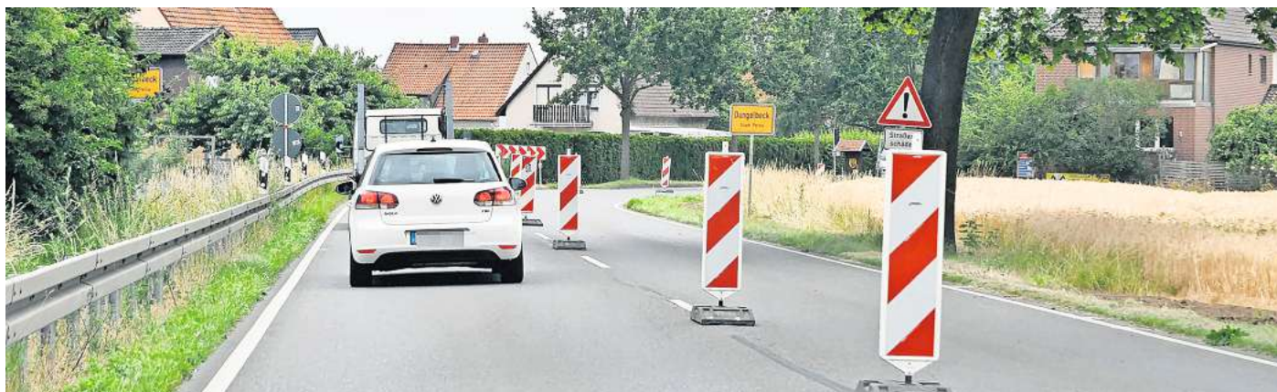
Die B 65 zwischen Peine und Sierße wird saniert. In Dungelbeck gibt es deswegen schon seit Ende Juni Verkehrsbehinderungen.

Gesperrt ist die Ortsdurchfahrt in Dungelbeck bereits, die Vorbereitungen für den zweiten Bauabschnitt laufen. Darum stehen entlang der Bundesstraße, die durch den Ort führt, Absperungen. Schon öfter hätten