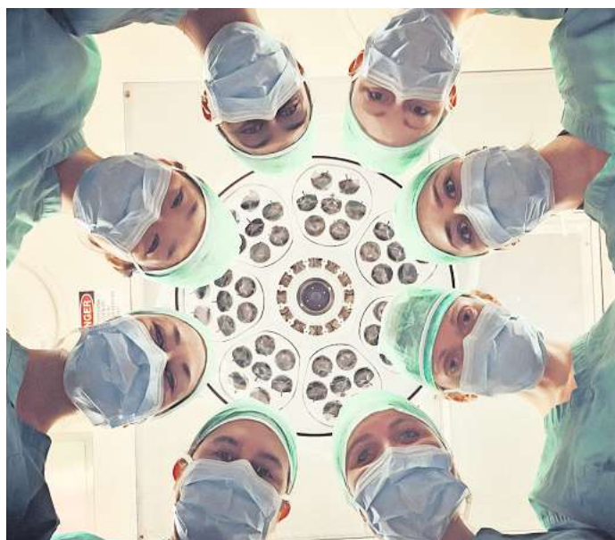
Eine optimale Behandlung ist laut einer Untersuchung nicht Standard in Deutschland.

der haben eine tolle Sprache. Sie erinnern sich bestimmt auch noch an den Vulkan Eyjafjallajökull. Nicht nur das Aussprechen fällt schwer, auch das Schreiben. Die Isländer pflegen ihre Sprache sehr und haben seit 60 Jahren eine Kommission, die neue Wörter ins Isländische übersetzt. Wenn z.B. eine ‚Drohne‘ über einen Vulkan fliegt, um nach dem Rechten zu sehen, handelt es sich um eine ‚fjarfluga‘, eine ‚Fernfliege‘. Im Land der Elfen ist ein Computer eine ‚Rechenhexe‘, auf Isländisch ‚Tölva‘. Ich mag so etwas. Deshalb sage ich zu meinem Handy schon seit langer Zeit gut norddeutsch: ‚Ackerschnacker‘. Auf Isländisch wäre es übrigens ‚farsíma‘. Matthias Brodowy