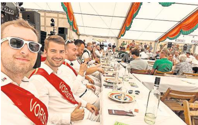
Jungesellschaft und Bürgercorps setzen auf ein geselliges Zusammensein beim Schützenfest.