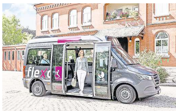
Die Pilotphase für den Flexo-Bus wird in Regelangebot umgewandelt.

In der App geben die Fahrgäste ihren Startpunkt ein – entweder über eine Karte oder über eine Liste der Flexo-Stops –, danach das Ziel und gewünschte Abfahrts- oder Ankunftszeit. Die Software errechnet Weg, Abfahrts- und Ankunftszeit am Zielpunkt. Die Nutzer werden informiert, dass sie eine oder mehrere Fahrten gebucht haben und kurz vor der Abfahrt noch einmal erinnert.