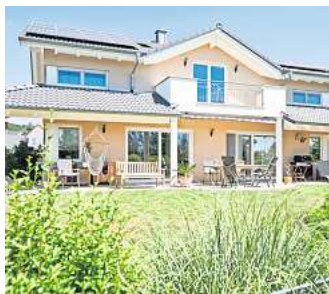
Eine gute Wärmedämmung von Dach und Fassade in Kombination mit Sonnenschutz für die Fenster erspart den Einbau einer energieintensiven Klimaanlage.

Regelmäßig vermeldet der Deutsche Wetterdienst neue Temperaturrekorde. Unter Klimaschutzaspekten sind Klimaanlagen aber keine optimale Lösung, um auch an heißen Hundstagen kühlen Kopf in den eigenen vier Wänden zu bewahren. Sie treiben die Energiekos-