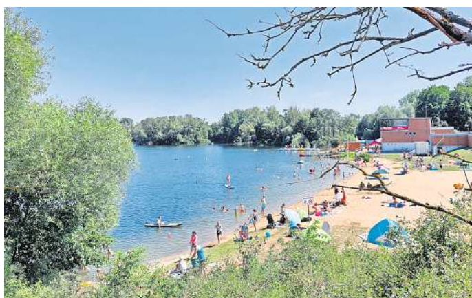
Der Eixer See: Er punktet bei den Badegästen mit guter Wasserqualität, einer Badeaufsicht, dem gastronomischen Angebot und Sanitäranlagen.