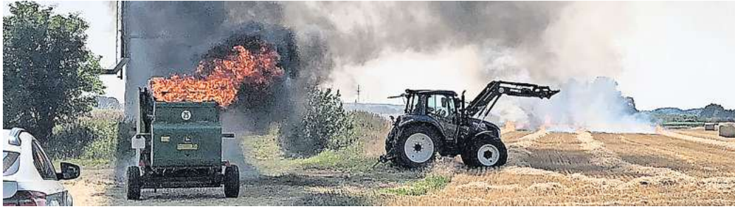
Zwischen Mödesse und Meerdorf hat am Samstagnachmittag eine Heuballenmaschine Feuer gefangen.

„Das Feuer konnte zügig gelöscht werden“, sagte eine Sprecherin der Peiner Polizei. So