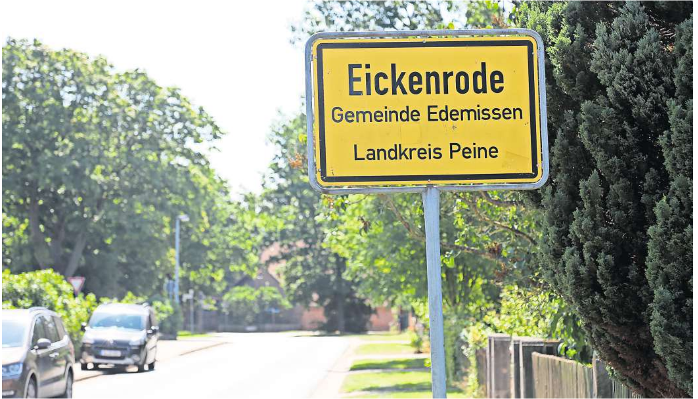
Der Mann, der am 17. Juni am Peiner Bahnhof mit einer Armbrust wahllos um sich geschossen hat, stammt aus Eickenrode. Dort durchsuchte die Polizei am Dienstagmorgen einen landwirtschaftlichen Betrieb.