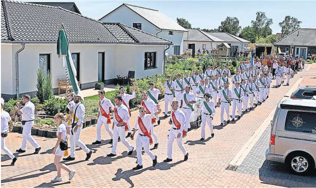
Der traditionelle Festumzug startet am Sonntag, 23. Juli.