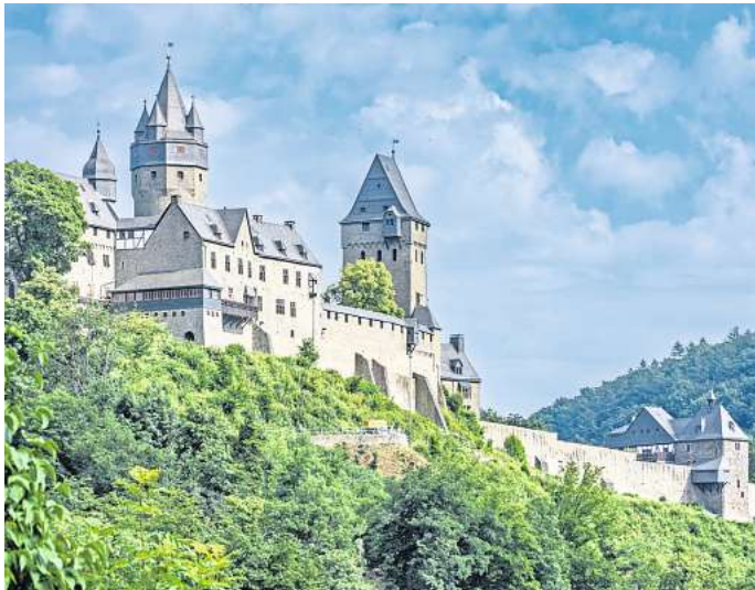
In schönster Lage präsentiert sich die Burg Altena. Im Erlebnisaufzug der Burg erfahren Besuchende spannende Fakten.

Wer die Schönheit des Biggesees von oben betrachten will, muss nach Attendorn auf den Skywalk. In 90 Metern Höhe thront die Aussichtsplattform Biggblick über dem Stausee und