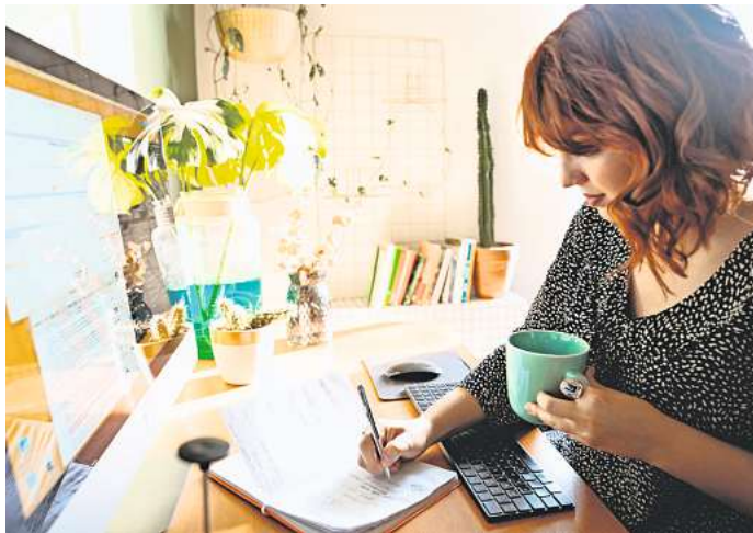
Laut einer Umfrage wird sich der Homeoffice-Trend in den nächsten beiden Jahren weiter verstärken.