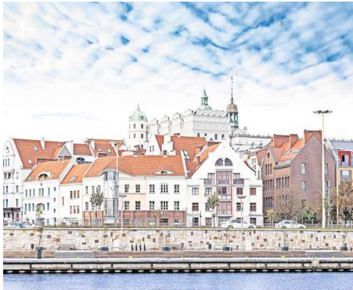
Die alte Hansestadt Stettin in Polen ist noch ein echter Geheimtipp.

Innerhalb weniger Minuten gelangst du fußläufig in das Zentrum der alten Hansedame. Im Herzen der Stadt solltest du dir auch eine Unterkunft suchen, um die folgenden Sehenswürdigkeiten ganz bequem und un-