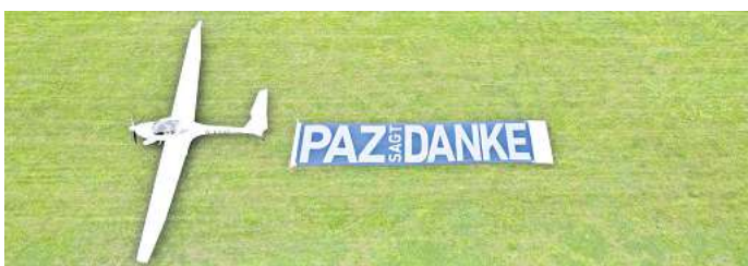
Ein Motorsegler ist am heutigen Samstag mit einem PAZ-Banner unterwegs.

Unter allen Teilnehmern verlosen wir zehn 30-minütige Flüge mit dem Motorsegelflugzeug. Startpunkt ist der Flugplatz des Segelflugvereins „Uhlenflug“ auf der Glindbruchkippe bei Telgte.