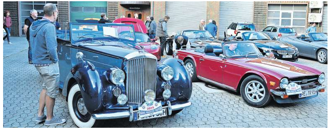
Roadster-Treffen: Auch ein Bentley Parkward Cabrio Baujahr 1949 stand schon auf dem Härke-Hof.