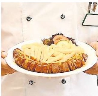
Eine "Currywurst" aus Soja? Greifen Sie gelegentlich auf Fleischersatzprodukte zurück?

Peine. Das Thema vegane Gerichte ohne zusätzliche Angebote mit Fleisch in einem Restaurant wurde gerade bei Volkswagen diskutiert. VW führt in seiner Kantine im Markenhochhaus in Wolfsburg wieder Fleisch und Fisch ein. Genau diese Speisen hatte man vor zwei Jahren zunächst von der Speisekarte dieses einen Betriebsrestaurants gestrichen, um nur noch vegetarische Gerichte anzubieten. Ab sofort können Mitarbeiterinnen und Mitarbeiter auch wieder die beliebte Currywurst bestellen. Das erneute Angebot von Fisch- und Fleischspeisen im Betriebsrestaurant im Markenhochhaus ist ein Ergebnis der Gastroumfrage. Dort hatten die Mitarbeitenden den entsprechenden Wunsch geäußert. Dafür hatte die Volkswagen Service Factory im Zeitraum vom 23. Januar bis 20. Februar 2023 eine umfangreiche Mitarbeiterumfrage durchgeführt. „Damit ist es weiterhin eine individuelle Entscheidung und bleibt jeder und jedem selbst überlassen, ob Fleisch oder