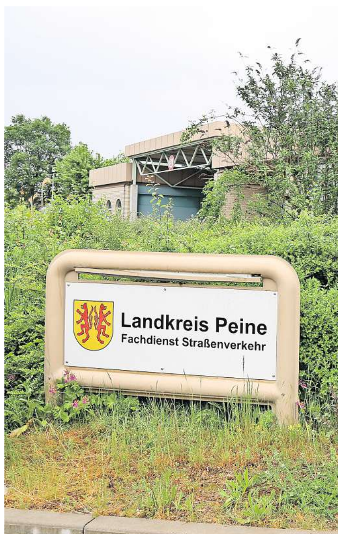
In Peine werden Kraftfahrzeuge beim Fachdienst Straßenverkehr an der Werner-Nordmeyer-Straße zugelassen.

hören beziehungsweise auf Männer zugelassen sind, denn wer im Brief eingetragen ist, muss nicht immer am Steuer sitzen. Nach der Verwaltungssprache mit den Wurzeln in den 50er Jahren wird immer noch zwischen dem „Haushaltsgesamtvorstand“ und den „Haushaltsangehörigen“ unterschieden – und wenn die einen Führerschein haben, sind die sicher auch Autnutzende. Präziser geht es aber nicht, denn eine Zulassung auf Familie Meier gibt es ja nicht. Noch nicht.