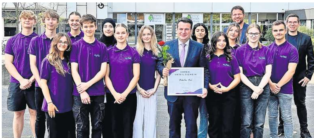
Der Bundestagsabgeordnete Hubertus Heil mit der Schülerfirma „My Bold“.

Mit dem Prototyp hat die Firma, bestehend aus Schülerinnen und Schülern des 11. Jahrgangs, den niedersächsischen Landeswettbewerb der Junior-Programme des Instituts der Deutschen Wirtschaft gewonnen. „Ich bin begeistert von der Firma und dem Produkt. Ich unterstütze das sehr gern und bin mir sicher, dass durch das Engagement der Mitarbeiterinnen und Mitarbeiter sowie durch die Begleitung der Lehrkräfte das Produkt