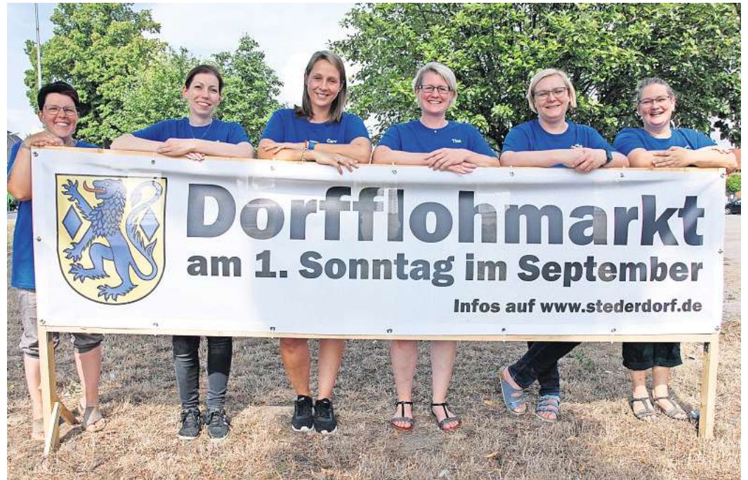
Die Organisatorinnen freuen sich schon auf viele Besucher.