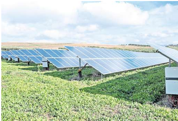
Das neue "Solarpaket" soll zum Jahreswechsel in Kraft treten, muss aber noch den Bundestag passieren.

was ich nun wirklich nicht verstehe. Aber kann ich wahrscheinlich auch nicht, weil ich ja offenbar zu alt dafür bin. Am Nachbartisch schaute ein kleiner Gast im Hochstühlen begeistert und gebannt einer leicht bekleideten Dame im Musikvideo zu, die einer anderen leicht bekleideten Dame einen Stuhl über dem Kopf zerdepperte, während die Mutter des Kleinen aufs Handy schaute und Joachim Witt vom Goldenen Reiter sang. In diesem Tohuwabohu war ich völlig überfordert, als mich die Bedienung fragte, ob ich noch etwas trinken wolle. Ich bestellte „Verdamp lang her“ von BAP und fragte, ob sie „Diese Drombuschs“ auf Video hätten. Hatte sie nicht. Matthias Brodowy