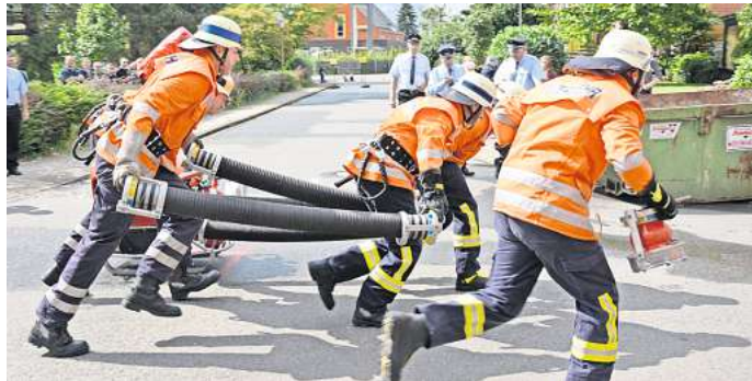
37 Feuerwehrgruppen und -staffeln nehmen am regionalen Landesvorentscheid der Feuerwehren teil.