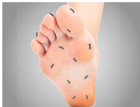
Kribbelnden Füße infolge von Nervenschmerzen?

Mehr als 23 Millionen Deutsche klagen heutzutage über chronische Schmerzen. Besonders häufig sind Nacken- oder Rückenschmerzen, die sogar bis in die Beine ausstrahlen können. Andere haben Schmerzen in Beinen oder Füßen, die von Missempfindungen wie Brennen, Kribbeln oder Taubheitsgefühlen begleitet werden können. Wieder andere kämpfen mit mysteriösen muskelkaterartigen Schmerzen am ganzen Körper. Und auch wenn es so scheint, als würden die Betroffenen unter völlig verschiedenen Beschwerdebildern leiden, so steckt doch meist derselbe Auslöser dahinter: geschädigte oder gereizte Nerven!