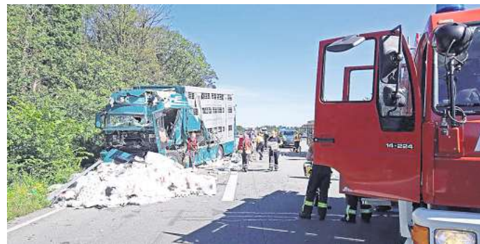
Bei einem Unfall auf der A2 krachten zwei Lastwagen zusammen.

Im Laufe des Nachmittags konnte die Sperrung in Fahrtrichtung Berlin wieder aufgehoben werden.