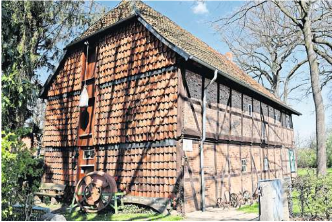
Kann besichtigt werden: Der Zehntspeicher in Edemissen.