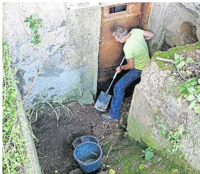
Gadenstedt: Ein Bunker für Fledermäuse am Gradeberg.