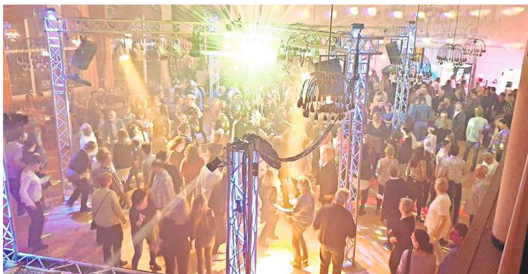
Bei der „La Salle“-Revival-Party im Jahr 2019 feierten Hunderte ausgelassen in der Schützengilde.

Die Diskothek „La Salle“ in Edemissen war in den 1970er-, 1980er- und 1990er-Jahren ein angesagter Treffpunkt vieler