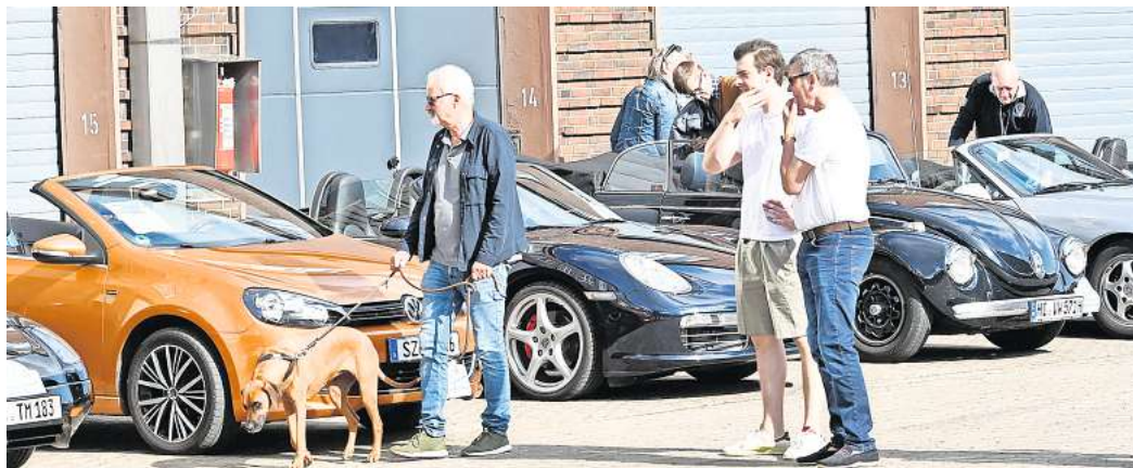
Härke-Roadster-Treffen: Die schönen Autos zogen die Zuschauer magisch an.

Die sichtlich gut aufgelegten Teilnehmer präsentierten den Fans ihre Roadster von den verschiedenen Herstellern und Altersklassen. Vom auf Hochglanz