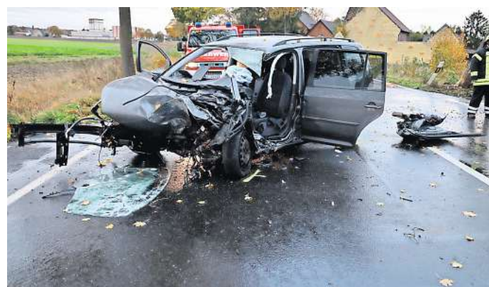
Das Auto wurde bei dem Zusammenstoß mit einem Straßenbaum komplett zerstört.

Die Ermittlungen zum Unfallhergang dauern an. Nach ersten Erkenntnissen der Polizei war der 18-Jährige mit seinem VW