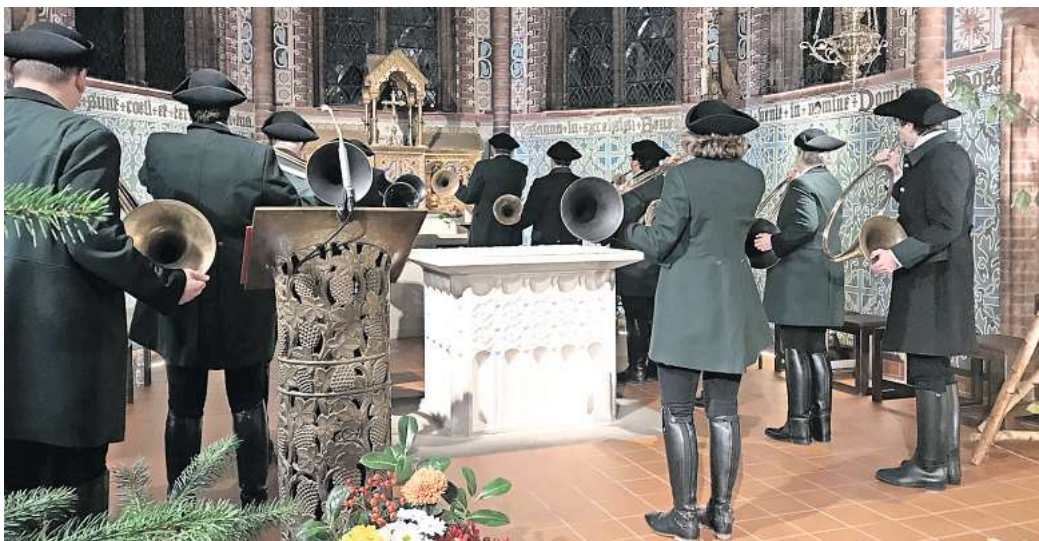
Die Jagdfanfane bläst ihre Stücke für den vollen Klang mit dem Rücken zum Publikum.

Seit fast 30 Jahren lassen die Peiner Jäger den viele Jahrhunderte alten Brauch wieder aufleben und danken in einer Art jagdlichem Erntedankfest ihrem Schutzpatron, dem Heiligen Hubertus. Sein Gedenktag ist