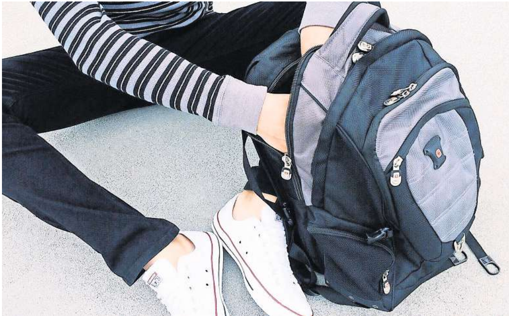
2019 fehlte jedes zehnte Kind im Kreis Peine mindestens einen Tag unentschuldigt im Unterricht.

Fünf Prozent der Schülerinnen und Schüler im Bundesgebiet versäumten aufgrund von geringer familiärer Unterstützung, Perspektivlosigkeit, Beziehungsscheitern und mangelndem Kompetenzerleben gewohnheitsmäßig die Schule. Häufig steckten individuelle, familiäre und schulische Probleme hinter dem 'Schwänzen'. Der Begriff sei jedoch veraltet: „Wir sprechen von Schulabsentismus, der sowohl passiv als auch aktiv sein kann“, sagt Anton. Gründe