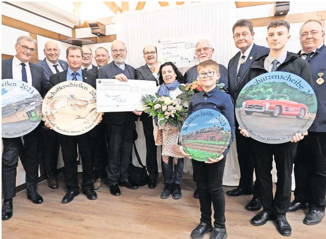
Die Geehrten des Schafferschießens mit den Bürgerschaftern sowie den Spendenempfängern.