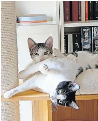
Geschwister: Poppy und Khaleesi suchen ein neues Zuhause.

Die Samtpfoten möchten zu liebevollen Besitzern – Alle Tiere sind kastriert, geimpft und gechipt