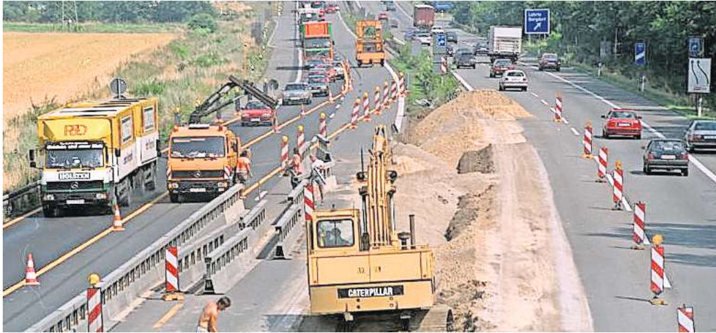
In den 1990er-Jahren wurde die A2 auf drei Fahrspuren ausgebaut. Das Bild zeigt die Baustelle in Höhe der Anschlussstelle Lehrte.

In den 1990er-Jahren wurden im Zuge der „Verkehrsprojekte Deutsche Einheit“ groß angelegte Bauprojekte für Verkehrsverbindungen zwischen Ost- und Westdeutschland geplant. Ein Teil davon war der sechsstreifige Ausbau der A2 zwischen Lehrte und Helmstedt. Dieser Ausbau wurde 1996 begonnen und Anfang der 2000er-Jahre fertigge-