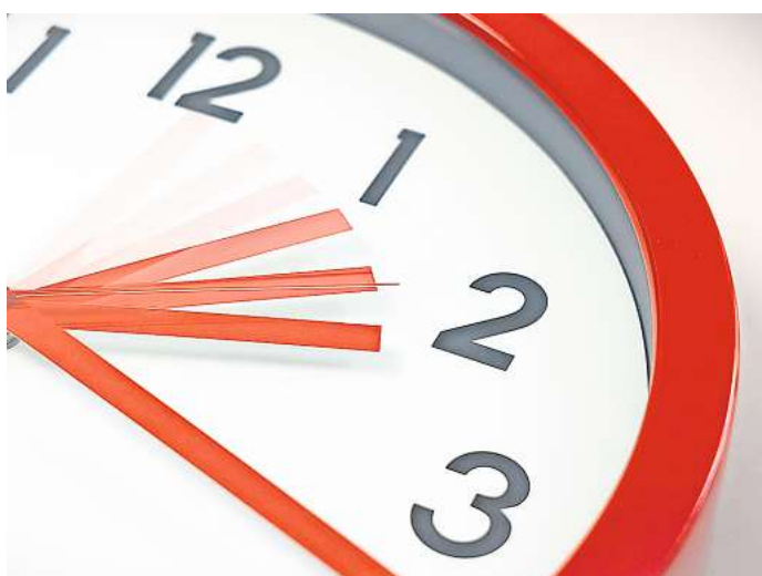
Mal eben eine Stunde dranhängen – oder auch zwei oder drei: Der Überstunden-Berg ist enorm.

und Gaststätten leisteten die Beschäftigten im vergangenen Jahr im Landkreis Peine rund 10.000 Überstunden. 4.000 davon ohne Bezahlung – quasi für umsonst“, so das Pestel-Institut. Die Wissenschaftler haben bei ihrer Untersuchung aktuelle Mikrozensusdaten ausgewertet. Basis der Überstunden-Berechnung