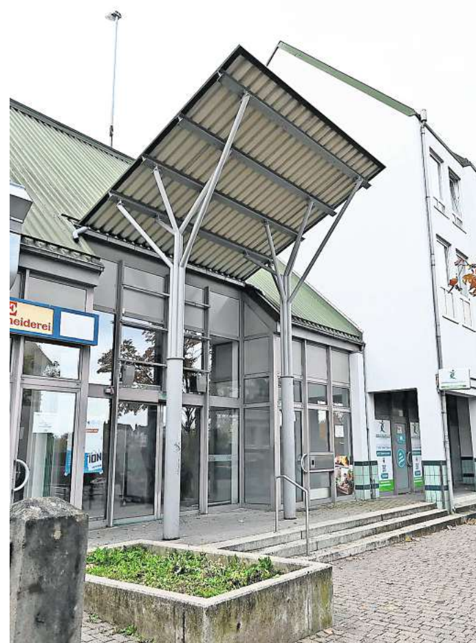
Der Leerstand füllt sich: In das ehemalige Edeka-Center in der Peiner Südstadt zieht unter anderem der Discounter „Tedi“ ein.