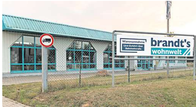
„Brandt's Wohnwelt“ in Broistedt: Die Staatsanwaltschaft ermittelt jetzt und prüft den Anfangsverdacht der Insolvenzverschleppung.

Rechtlich gelte es für die geprellten Kunden nun, Ansprüche auf Erfüllung des Vertrags beziehungsweise aus einer Sachmängelgewährleistung gerichtlich geltend zu machen und durchzuset-