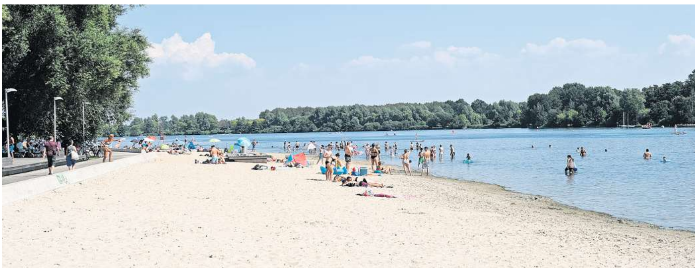
Entspannung am Strand: Mitarbeitende einer Klinik in Hannover erhalten ab Januar 15 Tage mehr Urlaub.

Wir würden gerne von Ihnen wissen, wie Sie das Programm der Klinik finden. Machen 45 Urlaubstage einen Arbeitgeber für Sie attraktiver? Oder ist Ih-