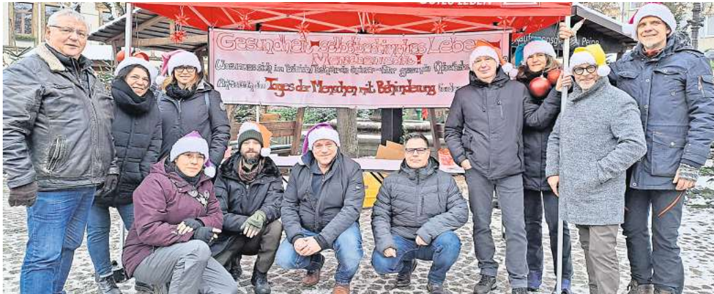
Peiner Marktplatz: Der Arbeitskreis der Schwerbehindertenvertretung der IG Metall Salzgitter-Peine startete dort eine Aktion.