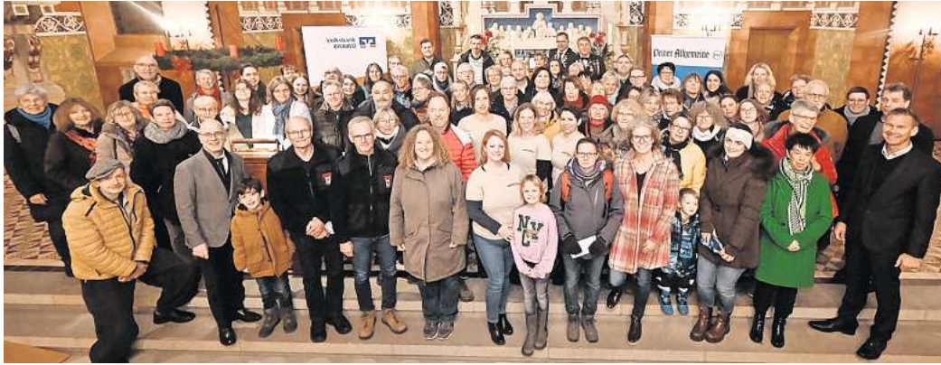
Preisverleihung in der St.-Jakobi-Kirche: 60 Hilfsorganisationen, Initiativen, Vereine, Verbände und Institutionen haben sich bei „Gemeinsam helfen“ beworben – Teilnehmerrekord.

Platz zwei und 1.500 Euro sicherte sich der Tier- und Ökogarten in Vöhrum mit dem Projekt „Mantrailing“, bei dem Kinder lernen, wie man Hunde trainiert, bestimmte Dinge oder auch Personen zu finden. Ebenfalls erstmals dabei und aus dem Stand auf Platz drei schaffte es das Projekt „Foodsaving“ aus