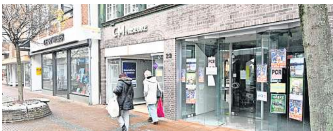
In der Peiner Fußgängerzone gibt es aktuell zahlreiche Leerstände.