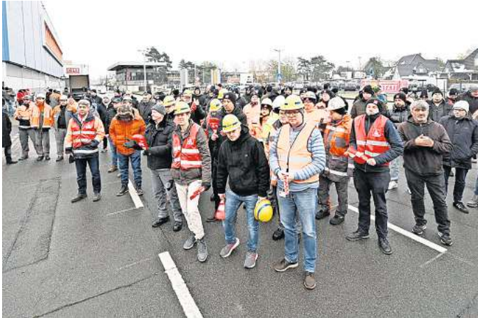
Diese Stahlarbeiter protestierten bei Peiner Träger.

Stahlarbeiter fordern 8,5 Prozent mehr Lohn und 32-Stunden-Woche – Folgt weiterer Streik?