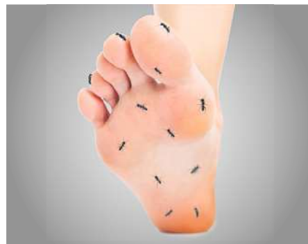
Kribbelnde Füße infolge von Nervenschmerzen?