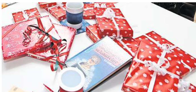
Wie viel Geld geben Sie dieses Jahr pro Kind für Weihnachtsgeschenke aus?

Peine. In zwei Wochen ist Weihnachten. Das Fest der Liebe und der Familie kommt mit großen Schritten schnell näher. Was ursprünglich mit Licht, Freude und Hoffnung verbunden war, wird immer mehr zum Fest der Konsumflut. Die Innenstädte sind in diesen Tagen voller Menschen, die auf der Suche nach dem passenden Geschenk die Geschäfte stürmen. Auch die Online-Shops melden von Jahr zu Jahr immer neue Rekordzahlen beim Verkauf. Weihnachten ist für die meisten Händler die Zeit, wo der höchste Umsatz gemacht wird. Während sich viele ältere Menschen in erster Linie über das Zusammensein mit der Familie und ein gutes Essen freuen, leuchten die Augen der