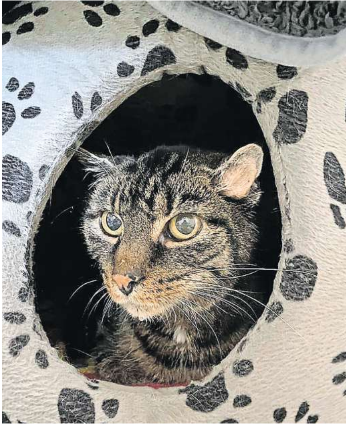
Katze Ty Lee ist derzeit im Tierheim Peine.

Wer Interesse daran hat, Ty Lee oder andere liebenswerte Tiere kennenzulernen, kann sich unter Telefon (0 51 71) 5 25 58 bei dem Tierheim des Tierschutzvereins Peine an der Fritz-Stegen-Allee melden. Die Telefonzeiten sind mittwochs, donnerstags und freitags von