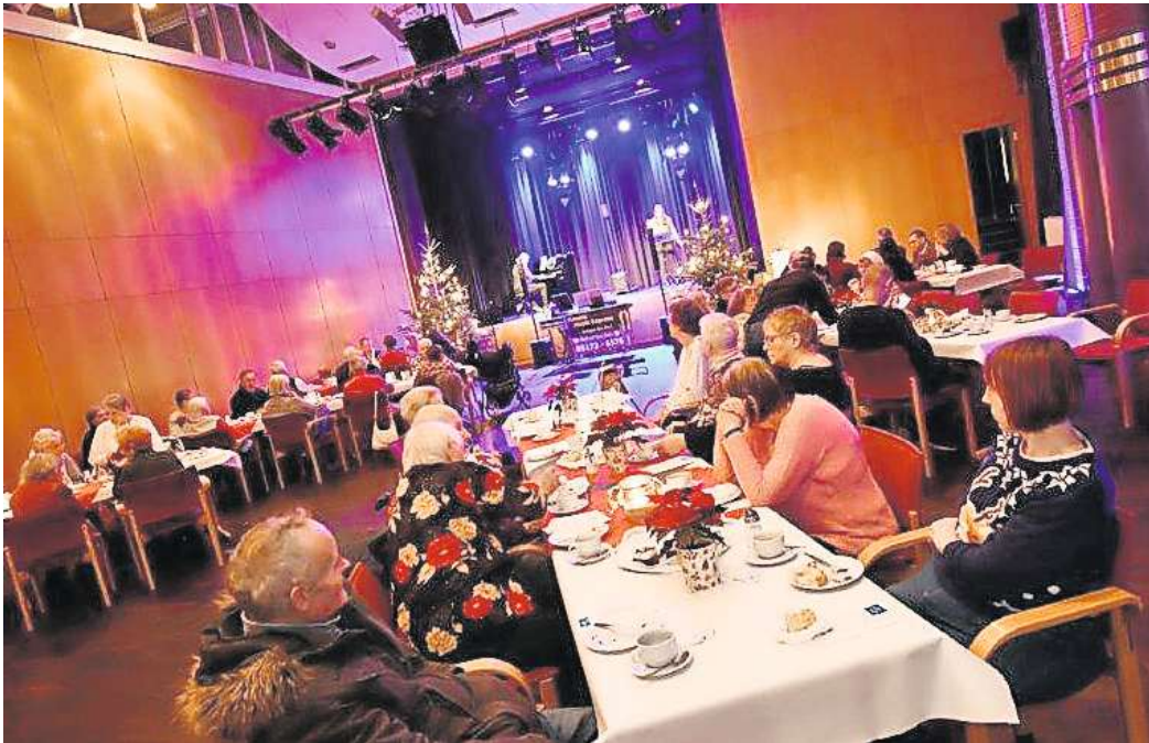
Die Heiligabend-Feier startet wieder im Forum Peine.

Anmeldungen für die Heiligabend-Feier sind bis zum 15. Dezember möglich