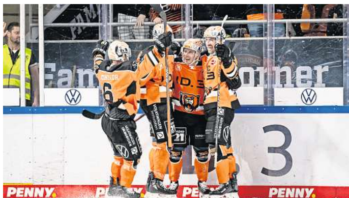
Für das Spiel der Grizzlys gegen den ERC Ingolstadt können Hallo-Leser 3x2 Eintrittskarten gewinnen.

In der vergangenen DEL-Saison gab es vier Aufeinandertreffen zwischen den Grizzlys Wolfsburg und dem ERC Ingolstadt. Dabei konnte jedes Team seine beiden Heimspiele gewinnen. Den deutlichsten Sieg hatten die Eishockey-Cracks aus Wolfsburg in ihrem ersten Heimspiel kurz nach Weihnachten 2022 eingefahren. 9:1 hieß es damals am 28. Dezember 2022. In dieser Saison haben beide Mannschaften auch schon zweimal gegeneinander