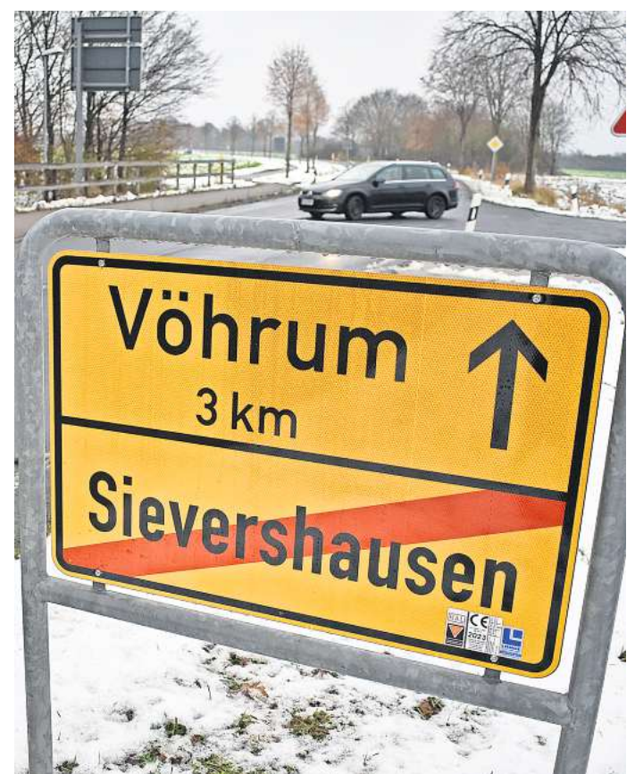
Auf offener Straße ausgesetzt: Autoinsassen sollen einen Hund aus dem Fahrzeug geworfen haben.

Veranstalter: Reisepartner Fuhrmann Mundstock international GmbH, Kurze Wanne 1, 38159 Vechelde-Wedtlenstedt Es gelten die AGB des Reiseveranstalters.