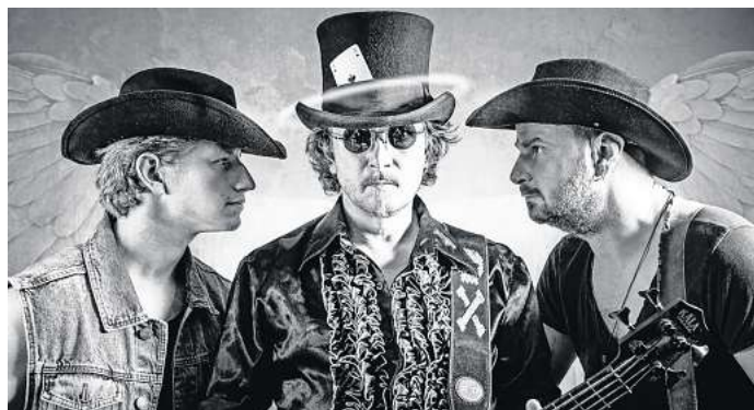
Kommt in die Kniki: Das Trio Mandowar stellt sich am 13. Januar in Salzgitter-Bad vor.