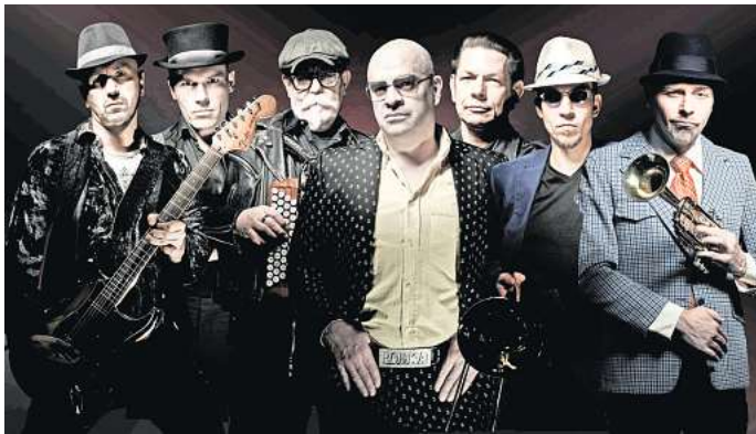
Verspricht eine "Achterbahnfahrt durch die Stile und Grooves": Die Band Polkaholix tritt in der Kulturscheune auf.