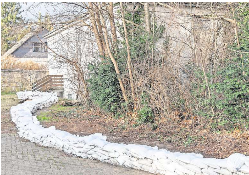
Von Wasser nichts mehr zu sehen: Die Feuerwehr sicherte das Avacon-Trafohaus in Ringelheim rundum mit Sandsäcken.

Wer dann die Tüten mit den insgesamt rund 20 bis 30 Tonnen Sand wegräumt, soll in der kommenden Woche geklärt werden. „Wir sind ja für die Gefahrenabwehr zuständig“, sagt Torsten Preuß. Jedenfalls lassen sich die Säcke nicht lagern, weil der nasse Sand darin schimmelt. Sie waren