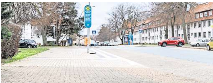
Messerattacke in Lebenstedt: Das Opfer schleppte sich noch bis in die Swindonstraße, brach dort dann zusammen. FOTO: SZ-PA/RK

Salzgitter. Diese Bluttat überschattet die vielen fröhlichen Momente in der Neujahrsnacht in Salzgitter. In Lebenstedt im Stadtweg hat ein Unbekannter im Kreis von Gleichgesinnten gegen 1.20 Uhr mit einem Messer auf einen 43-jährigen Mann eingestochen. Die Polizei hofft auf Hinweise, um die Angreifer zu fassen. Zeugen hatten die Rettungskräfte alarmiert, die zu dem stark blutenden Mann eilten, der sich in der Swindonstraße im Nahbereich der Kurt-Schumacher-Straße befand. Er war ansprechbar und konnte gegenüber der Polizei „erste wichtige Informationen zum Sachverhalt“ äußern. Vor der Tat hatte der Mann im Stadtweg offenbar eine Gruppe von mehreren Personen angesprochen und auf ein von ihnen verursachtes Fehlverhalten aufmerksam gemacht. Mitten in dem Gespräch zog einer der Beteiligten ein Messer hervor und stach ohne Vorwarnung mehrfach auf das Opfer ein. Der 43-jährige Salzgitteraner wurde erheblich verletzt, schleppte sich