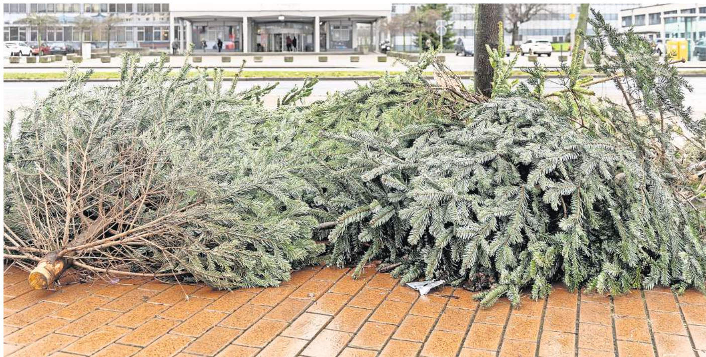
Viel zu früh: In Lebenstedt lagen schon am 2. Januar die ersten Weihnachtsbäume auf der Straße