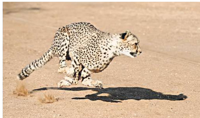
Geparde sind nur noch selten in freier Wildbahn anzutreffen.

Je nachdem, in welchem Alter und Entwicklungsstadium die Kleinen gefangen wurden, können sie nach einiger Zeit entwe-