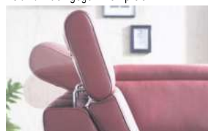
Kopfteilverstellung gegen Mehrpreis