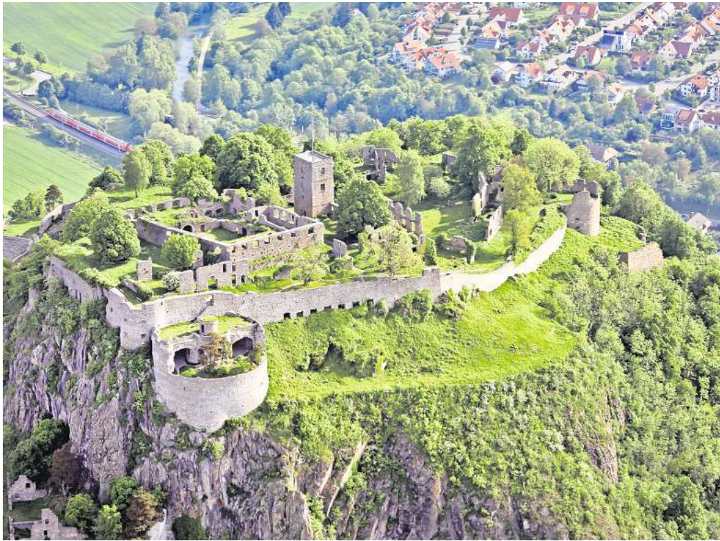
Die Burgruine Hohentwiel lockt jedes Jahr Zehntausende Besuchende an.

Die Burg galt durch ihre strategisch gute Lage auf dem Gipfel des fast 700 Meter hohen Hohentwiel lange Zeit als uneinnehm-