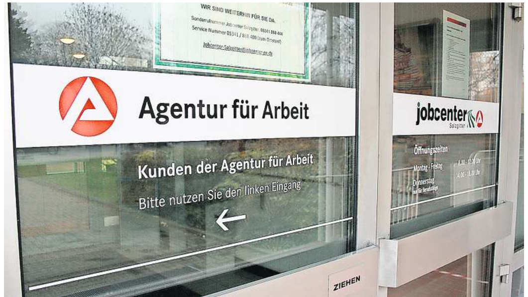
5.063 waren gemeldet: Die Arbeitslosenquote in Salzgitter lag im Dezember bei 9,4 Prozent.

Die Zahl der Arbeitslosen lag im Jahresdurchschnitt 2023 bei 20.974. Das ist eine Steigerung zum vorherigen Jahr um 1.640 oder 8,5 Prozent. Die größte Veränderung zeigt sich bei den Ausländern. Dort ist die Zahl um 1.193 oder 18,5 Prozent gestiegen. Damit haben die Ausländer einen Anteil von 36,4 Prozent an allen Arbeitslosen. Zurückzuführen ist dies vorrangig auf den Zugang geflüchteter Menschen aus der Ukraine. Kerstin Kuechler-Kakoschke: „In den kommenden Jahren wird auch wei-