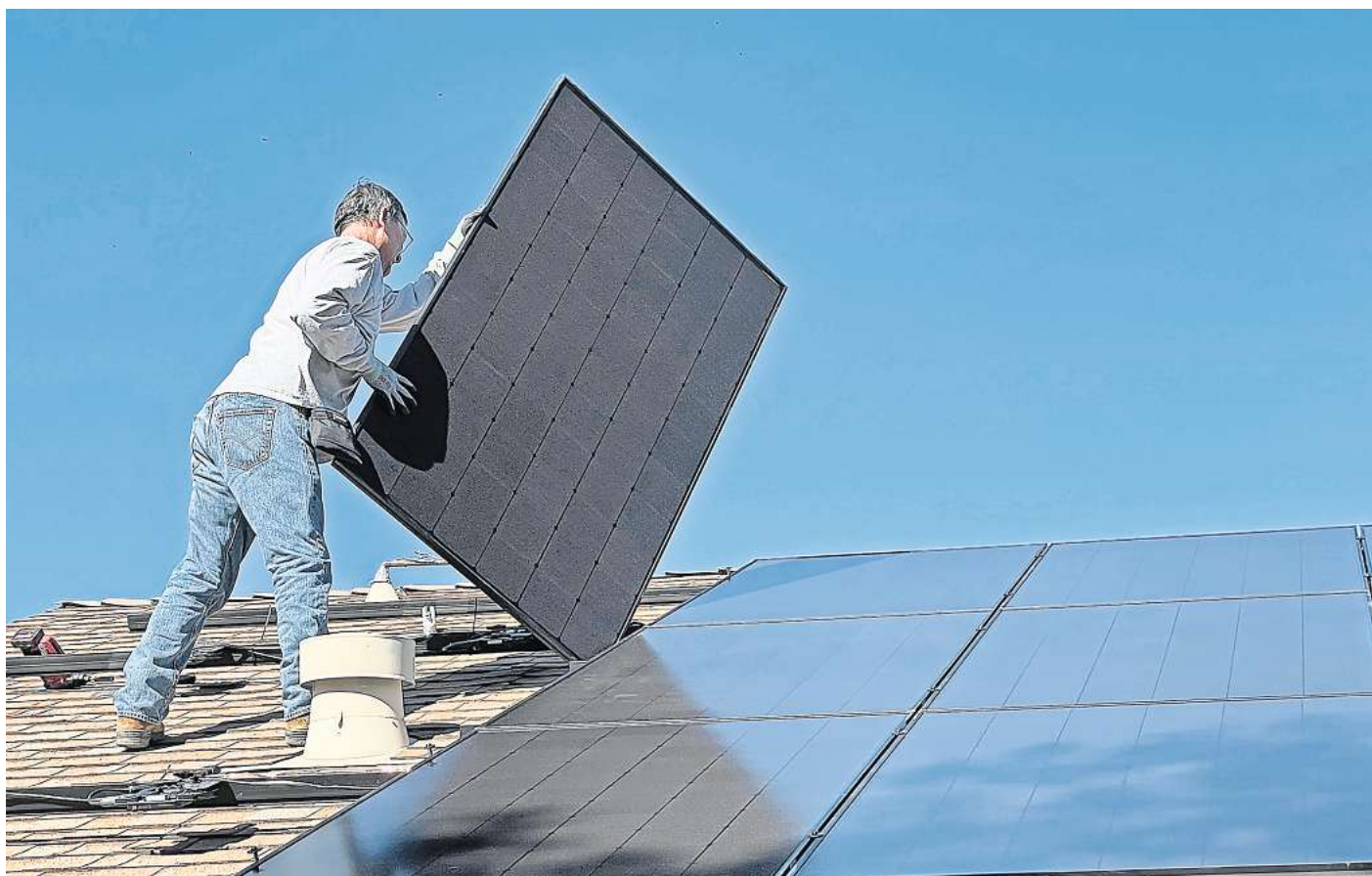
Robert Habeck will deutsche Solarhersteller mit einer Art „Resilienzbonus“ gegenüber der China-Konkurrenz stärken.

Das „Solarpaket I“, mit dem die Bundesregierung den Ausbau der Kapazitäten für Sonnenstrom beschleunigen will, hätte ursprünglich bereits zum