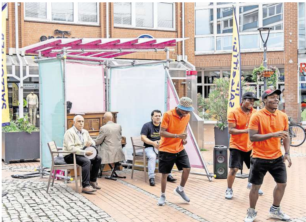
Das neue Klavier im Einsatz: Der Verein Heimat Salzgitter nutzt das Pop-Up-Modul vor der Stadtpassage für eine Showeinlage.

Mit den Pop-Up-Modulen wollen die Stadt und die WIS neue Anreize schaffen, die Innenstädte zu besuchen. Die Module sollen die Aufenthaltsquali-