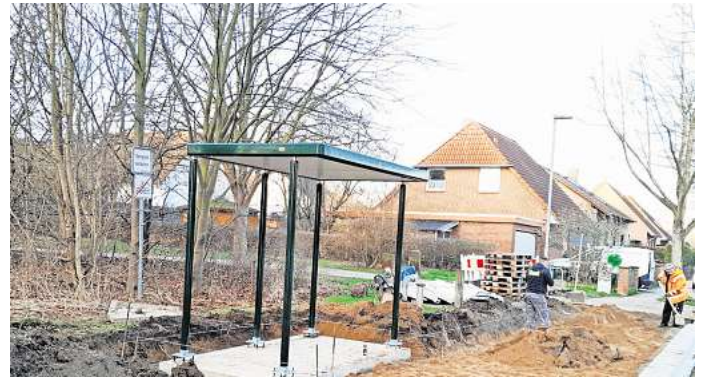
Die Arbeiten laufen: Die Gemeinde Lengede setzt sich dafür ein, dass die Bushaltestellen im Gemeindegebiet barrierefrei ausgebaut werden.

Die Haltestellen „Vallstedter Weg“ und „Eichenweg“ in Lengede sowie die Haltestellen „Siedlung“ und „Gewerbepark“ in Broistedt werden barrierefrei ausgebaut und so den Bedürfnissen der Nutzer angepasst. Die Baukosten betragen etwa 540.000 Euro und werden mit Zuschüssen in Höhe von