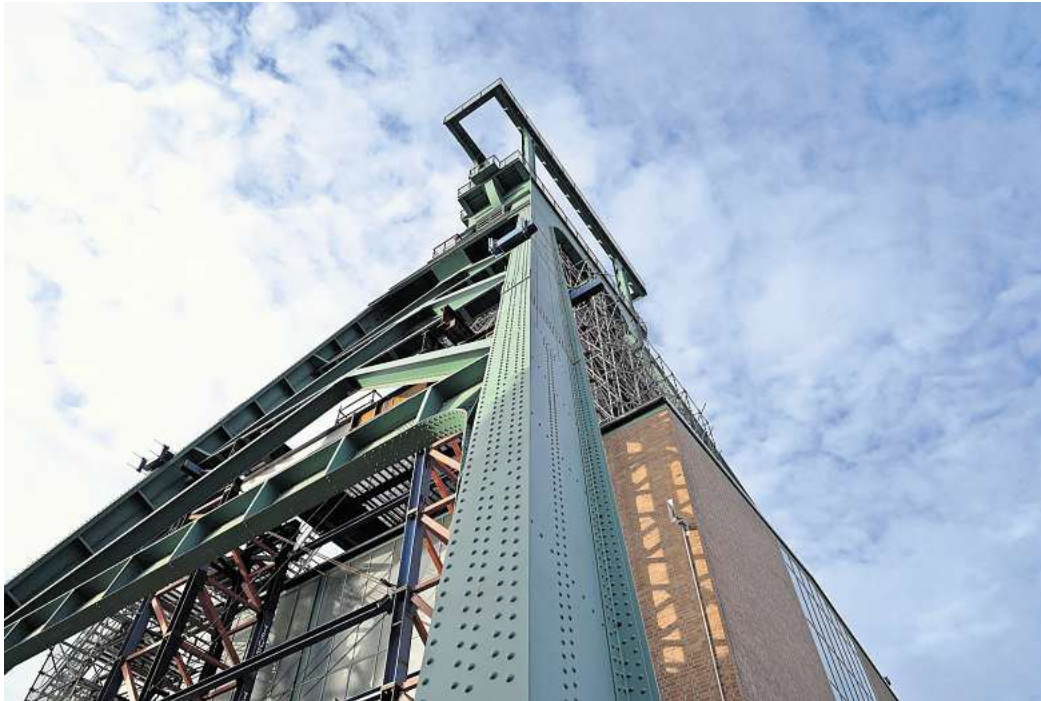
Der Förderturm aus der Froschperspektive: Am 25. Juni können sich Interessierte über das Außenge- lände am Schacht Konrad führen lassen.

Nach einem langwierigen Ge- nehmigungsverfahren ist seit 2002 der Umbau zum Endlager für schwach- und mittlerradioak- tive Abfälle genehmigt. Der wird allerdings nicht nur von der Stadt und den benachbarten Kommunen abgelehnt, sondern vor allem von den Menschen vor Ort und zahlreichen Institutionen. Derzeit liegt ein Antrag des NABU und des BUND dem Um- weltministerium vor, die Plan- feststellung aufzuheben und damit den mehrere Milliarden Euro teuren Ausbau einzustellen, weil dieser die heutzutage üblichen technischen Ansprüche nicht er- fülle. Eine endgültige Entschei-