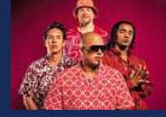
CULCHA CANDELA FINALE PARTY Samstag, 13. Juli