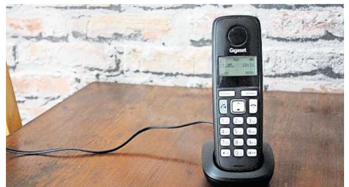
Aufgepasst, wenn das Telefon klingelt: Die Polizei in Salzgitter warnt vor betrügerischen Schockanrufen.

„Es entstand ein Schaden in einer niedrigen fünfstelligen Höhe“, teilt die Polizei mit. Sie wiederholt eindringlich ihre Warnhinweise. „Bitte händigen Sie niemals Schmuck, Geld und andere hochwertige Dinge an Fremde aus“, heißt es in einer Mitteilung. „Wenn Sie einen sol- chen Schockanruf erhalten, sprechen Sie immer unverzüg- lich mit Personen Ihres Vertrau- ens oder mit der örtlichen Poli- zei. Die Polizei wird Sie niemals telefonisch kontaktieren, um eine solche Schocknachricht zu übermitteln.“