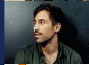
MAX GIESINGER SOMMERTOUR 2024 Samstag, 06. Juli