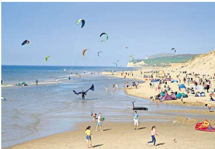
Die Opalküste bietet Traumstrände und tolle Wassersportbedingungen. Und das ist nicht alles.

Beeindruckend ist auch eine Wanderung in der etwa 60 Kilometer entfernten Naturlandschaft beim Cap Blanc Nez. Zwischen den 134 Meter hohen Steilklippen, die sich hier dem Ärmelkanal entgegenstemmen,