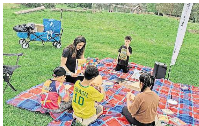
Neues Angebot: Die EFB liest den Kindern auf den Spielplätzen vor.