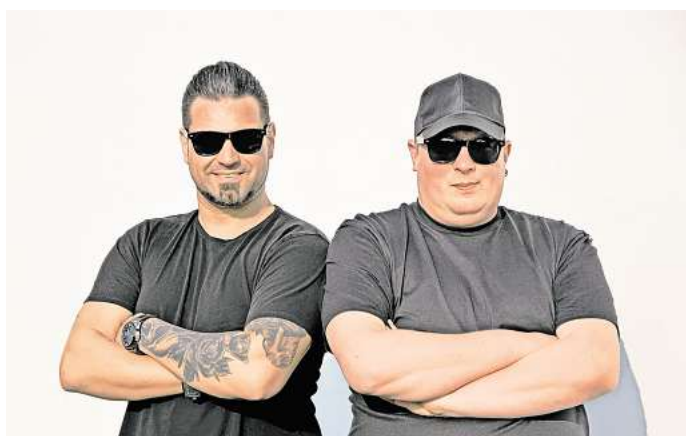
Sorgen am Samstag für einen stimmungsvollen Ausklang: Das DJ-Duo „Die Ben'z“ legt abends beim Sommerfest der Firma w.r. scholz in Broistedt auf.

Der Besuch lohnt sich vor allem für diejenigen, die gerade renovieren, sanieren oder sonst irgendwas im Haus oder Garten zu tun haben. Die Firma scholz öffnet an beiden Tagen ihre Tore. Zu sehen gibt es alles vom Mähroboter bis zum Sichtschutzzaun, es gibt ein Stuhl-Test-Center und auch der Tür-Hersteller Hörmann ist vor Ort. Wer etwas findet, kann gleich Nägel mit Köp-