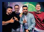
AFTER-WORK-PARTY DJ ALLSTARS Donnerstag, 04. Juli