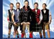
KÖNIGLICH BAYRISCHES VOLLGAS ORCHESTER "SOMMER WIES'N" Dienstag, 09. Juli