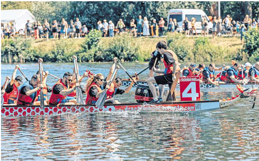
Paddeln um den Pokal: Am 9. Juni steht auf dem Salzgittersee das nächste Drachenbootrennen an.

„Fünf Boote pro Rennen und Teams, die alles im Kampf gegen die Zeit, sich selbst und die Konkurrenz geben – das wird ein wahres Spektakel für alle Zuschauer, Fans und Akti-