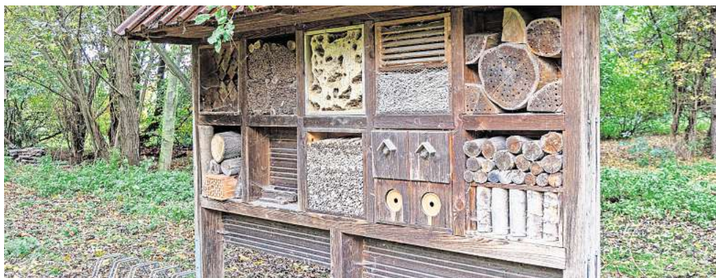
Übernachten möglich: Die Biologische Station des NABU beherbergt das Wildnis-Seminar der Volkshochschule.

Der Kurs findet auf dem abgeschlossenen Gelände der Biologischen Station des NABU statt und ist auch für Familien geeignet. Die Teilnehmenden sollten wettergerechte Kleidung und Schuhe tragen, eigene Verpflegung sowie Teller, Becher und