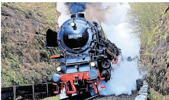
Nostalgische Fahrt: Die Dampflokomotive-Gemeinschaft 41 096 bietet eine historische Tour nach Osnabrück an.

Auf die Passagiere wartet ein buntes Programm rund um den Piesberg mit Pendelfahrten, historischem Eisenbahnbetrieb am Zechenbahnhof, Draisinen- oder Lokfahrten. Ein nostalgischer Tag rund um das Thema historische Eisenbahn vergangener Tage. Alternativ gibt es eine Stadtrundfahrt im Doppeldeckerbus durch Osnabrück.