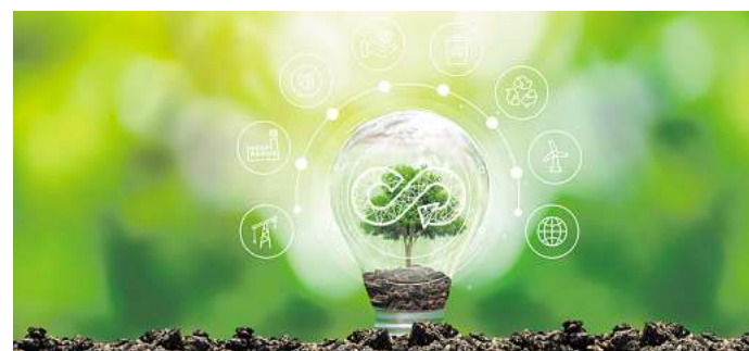
Ein Symbolbild für die Circular Economy: Die Ostfalia wird in unterschiedlichen Projektbereichen mitarbeiten.

Auch die Ostfalia Hochschule zählt zu den geförderten wissenschaftlichen Einrichtungen und ist mit 387.000 Euro beteiligt. „In der Strategie der Ostfalia sind die Digitalisierung und Nachhaltigkeit als Kernthemen in Forschung und Lehre verankert. Beides sind auch die zentralen Aspekte des Zukunftslabors Circular Economy“, sagt Ostfalia-Professor Gert Bicker, von der Fakultät Informatik. Die Ostfalia wird schwerpunktmäßig in den