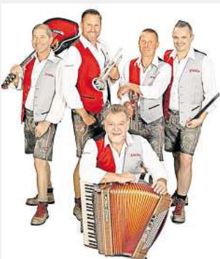
Verspricht ein „unvergessliches Erlebnis“: Die Band Kzwoa.

der „Unterhaltungsprofis im Trend der Zeit“ gilt als ein Erfolgsgeheimnis der Formation. Der Eintritt zu der Veranstaltung ist frei.