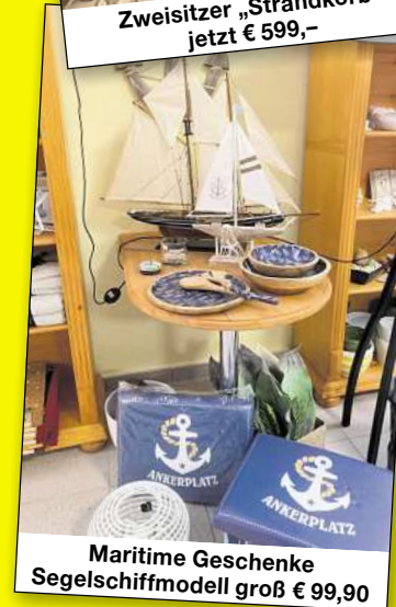
Maritime Geschenke Segelschiffmodell groß € 99,90