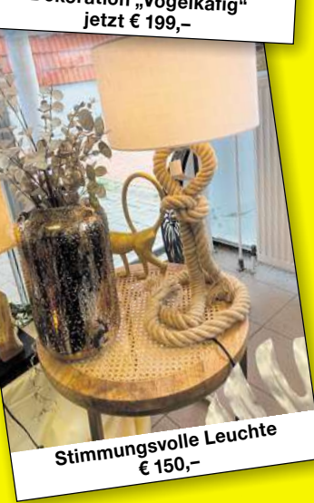
Stimmungsvolle Leuchte € 150,-