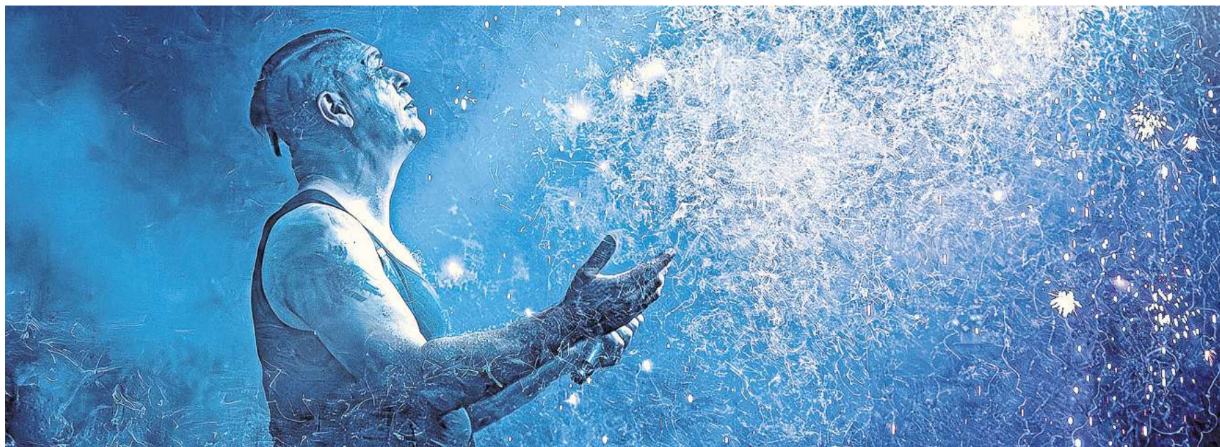
Sänger und Frontmann Heli Reißweber von „Stahlzeit“ im Konzert.