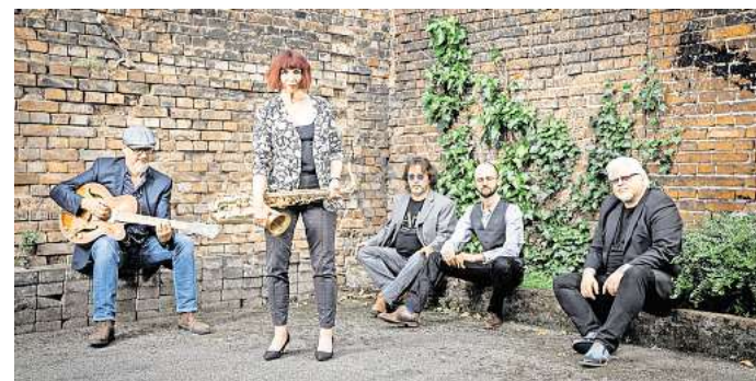
Die Formation Blue Terrace will am heutigen Samstag mit außergewöhnlichen Blues-Rhythmen begeistern.

Bei widrigen Witterungsverhältnissen findet der Auftritt im benachbarten Schafstall statt. Eintrittskarten gibt es online beim Kartenportal Reservix. Direkte Links zum Kartenportal und Informationen zu weiteren Veranstaltungen des Kultursommers findet man auf der Internetseite www.kultursommer-salzgitter.de .