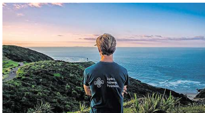
Junge Menschen haben über den Flexiblen Freiwilligendienst die Möglichkeit, fremde Länder und Kulturen kennenzulernen.