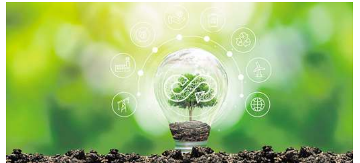
Ein Symbolbild für die Circular Economy: Die Ostfalia wird in unterschiedlichen Projektbereichen mitarbeiten.

Auch die Ostfalia Hochschule zählt zu den geförderten wissenschaftlichen Einrichtungen und ist mit 387.000 Euro beteiligt. „In der Strategie der Ostfalia sind die Digitalisierung und Nachhaltigkeit als Kernthemen in Forschung und Lehre verankert. Beides sind auch die zentralen Aspekte des Zukunftslabors Circular Economy“, sagt Ostfalia-Professor Gert Bicker, von der Fakultät Informatik. Die Ostfalia wird schwerpunktmäßig in den