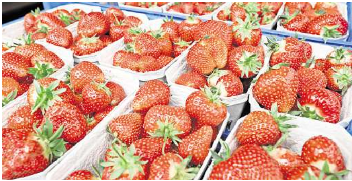
Erdbeeren auf einem Wochenmarkt: Der Ökolandbau in Niedersachsen wächst weiter.

„Die wieder steigende Nachfrage nach Biolebensmitteln bietet langfristig eine stabile Zukunftsperspektive“, sagt Niedersachsens Landwirtschaftsministerin Miriam Staudte (Grüne).