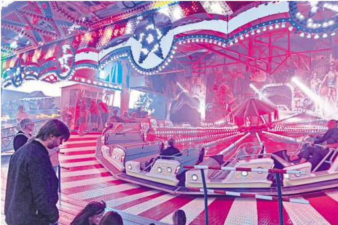
Moderner Spaß in der historischen Wasserburg: Die Fahrgeschäfte dürften wieder viele Gäste anlocken.

Am Sonntag um 10 Uhr beginnt der Stadtschützenfest, der in diesem Jahr in Gebhardshagen ausgerichtet wird. Um 13.30 Uhr versammeln sich die Gruppen