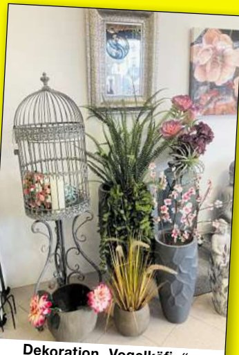
Dekoration „Vogelkäfig“ jetzt € 199,-