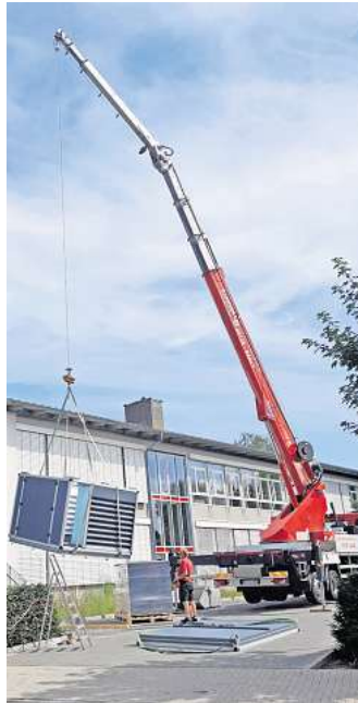
Zur energetischen Heizungssanierung erhält die Grundschule Lengede eine Wärmepumpe.

In den Schulen erfolgt die Wärme- und Stromversorgung bisher mittels Gasbrennwertkessel und Blockheizkraftwerk (BHKWs). Die verbauten Gasthermen sind 30 Jahre (Grundschule Lengede), 20 Jahre