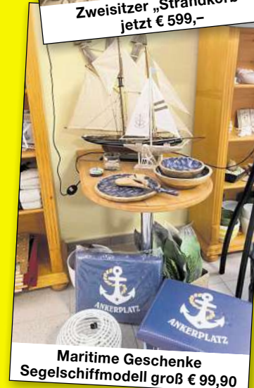
Maritime Geschenke Segelschiffmodell groß € 99,90