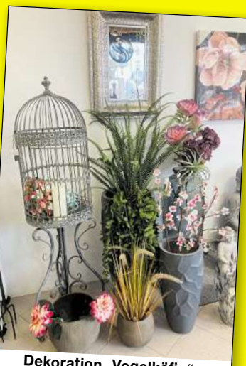
Dekoration „Vogelkäfig“ jetzt € 199,-