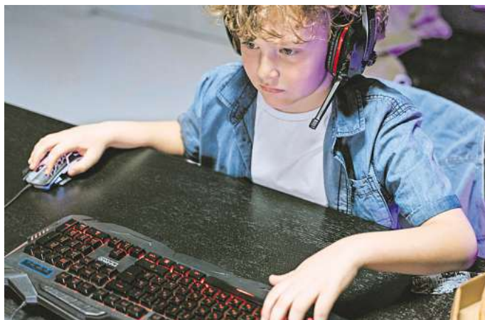
Ist es schon Kinderarbeit, wenn Kinder ihre Freizeit mit der Kreation von Videospielinhalten verbringen und damit potenziell Geld verdienen?

Roblox stellt den Kindern und Jugendlichen alle Tools kostenlos zur Verfügung, allen voran die