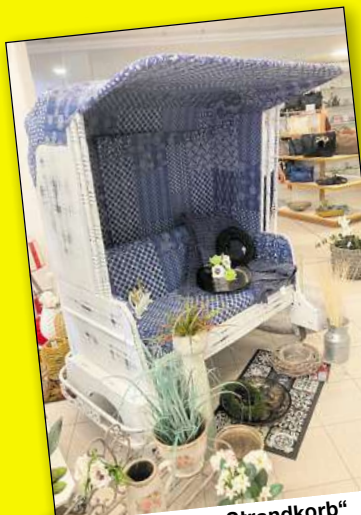
Zweisitzer „Strandkorb“ jetzt € 599,-