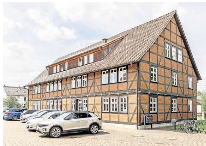
Stätte der Fortbildung: Die Stadt lädt Lehrkräfte zu vier kostenlosen Seminaren ins Medienzentrum ein.