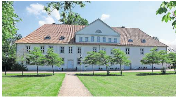
Rund um das Kniestedter Herrenhaus in Salzgitter-Bad starten die Kunst-Tage statt.

„Fineliner - Tierzeichnungen leicht gemacht“: Im Vordergrund dieses Kurses steht, dass sich die Teilnehmenden einfach und mit Freude an das Thema Tierzeichnung heranwagen. Bei der Umsetzung gibt es professionelle Unterstützung. Die Gruppe tastet sich an das Zeichnen mit dem Fineliner auf spielerische Art heran. Anhand von Fotos lernen die Teilnehmenden, mit dem Fineliner Tiere abzuzeichnen und ihnen einen eigenen Charakter zu geben.