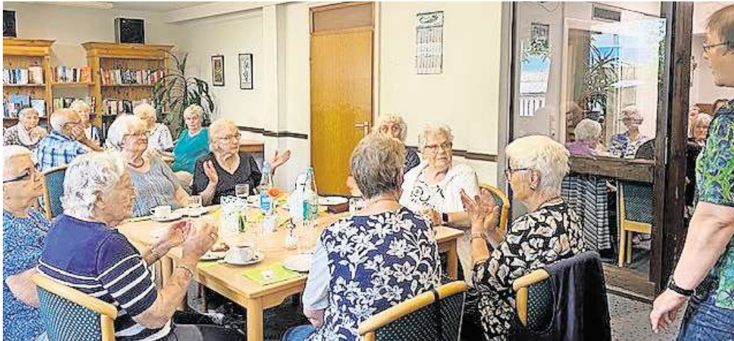
Die Seniorinnen und Senioren haben Spaß an den gemeinsamen Aktionen.

Insbesondere alleinlebende Seniorinnen und Senioren nutzen den rege besuchten Seniorentreff in Lebenstedt, um in Gesellschaft „gemeinsam statt einsam“ eine gute Zeit zu haben.