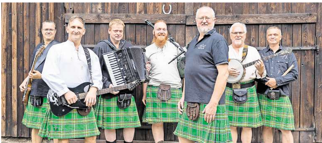
The Keltic Summer wollen im Biergarten in Cramme mit tollen Tönen begeistern.

Cramme. Am 10. August werden „The Keltics“ wieder im Biergarten „Zum Schwankenden Ritter“ in Cramme auftreten und den Keltic Summer feiern. Dabei wollen die sieben Musiker mit ihrer langjährigen Bühnenerfahrung und positiven Lebenseinstellung den Irish-Folk-Rock völlig neu definieren. „Ihre mitreißende Bühnenshow und der beißende Humor von Frontmann Thys Bouma machen jeden Auftritt zu einem unvergesslichen Erlebnis“, heißt es in der Ankündigung. Seit ihrem Erfolg beim Wacken Open Air 2010 haben „The Keltics“ die Welt bereist und dabei Tausende von Menschen begeistert. Ihr neuntes Album „9“ aus dem Jahr 2022, bestehend aus ausschließlich eigenen Stücken, wird bei dem Auftritt in Cramme ebenfalls live zu