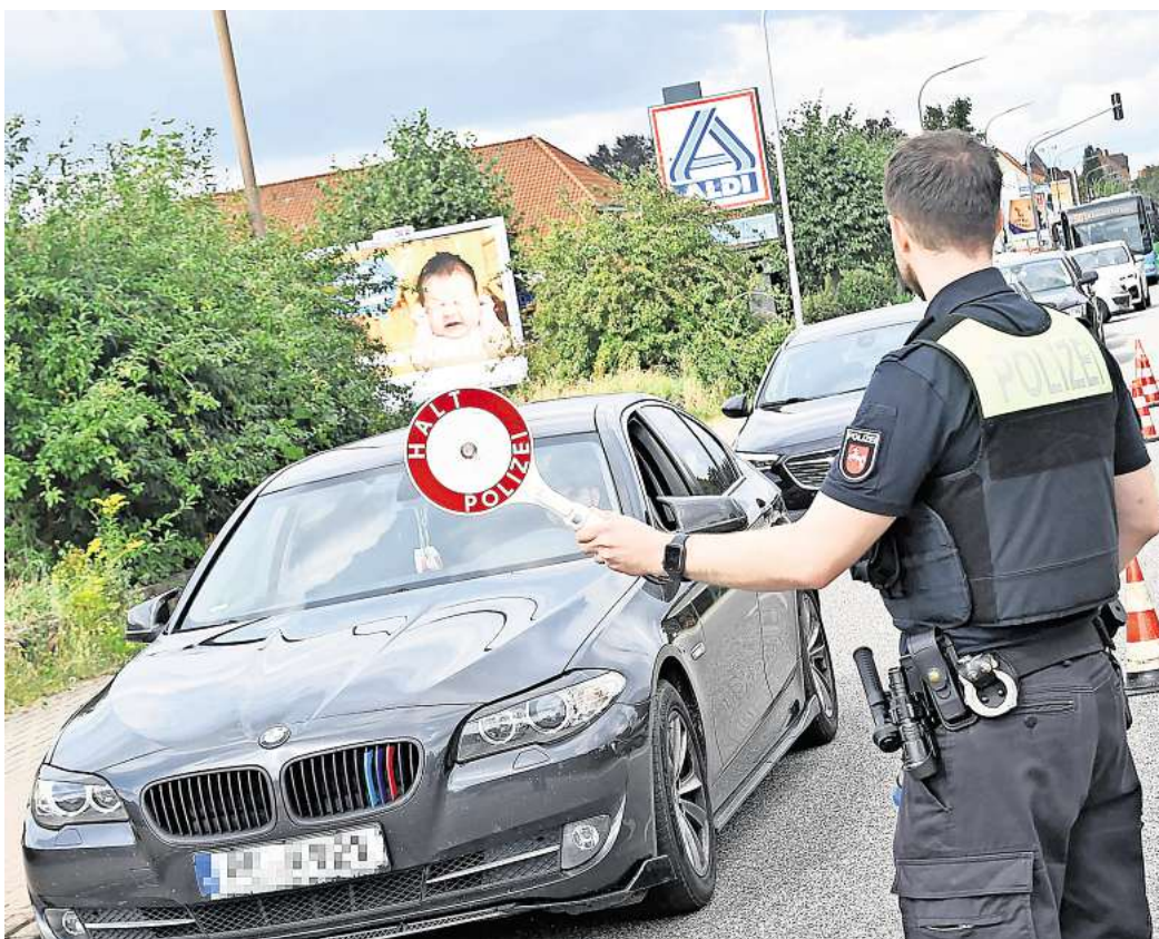
Bei allgemeinen Verkehrskontrollen müssen Autofahrende nicht jeder Aufforderung von Polizeibeamtinnen und -beamten nachkommen, manchen allerdings schon.

Während der Verkehrskontrolle kann die Polizei verlangen,