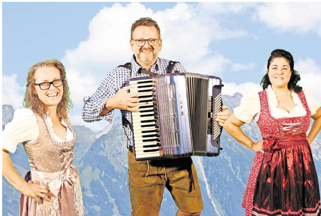
Das Trio Dick & Durstig wird das Fest am Donnerstag einläuten.