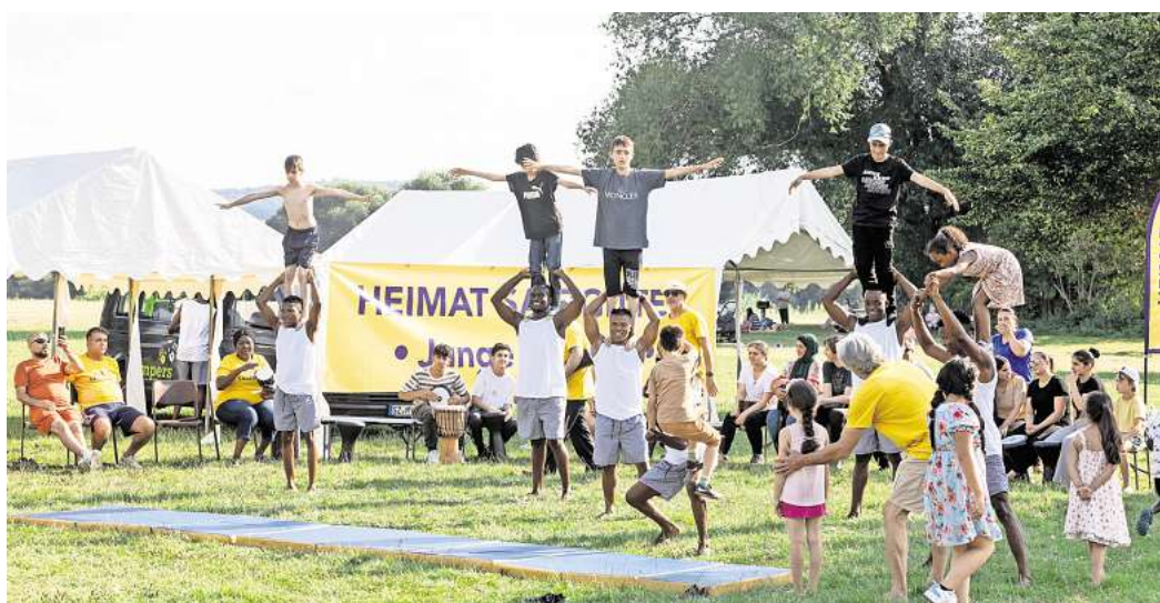
In den Workshops konnten die Kinder experimentieren und ihre Fähigkeiten individuell ausleben.