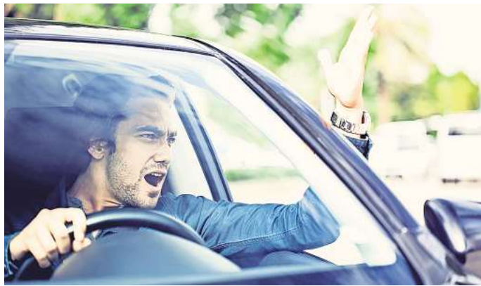
Läuft es im Straßenverkehr nicht so wie gewünscht, liegen den Menschen am Steuer oft die Nerven blank.

Um den Stressfaktoren im Straßenverkehr zu begegnen, sei ein erster wichtiger Schritt die Selbstbeobachtung. „Indem man das eigene Verhalten bewusst reflektiert, lassen sich überzogene Reaktionen erkennen und abmildern“, sagt