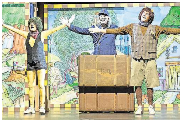
Eine Szene aus dem Kindermusical „Oh wie schön ist Panama“.

Karten für das Kindermusical gibt es online bei den Kartenportalen Reservix und Eventim. Auf der Internetseite www.kultursommer-salzgitter.de findet man direkte Links zu den Kartenportalen und Informationen zu allen anderen Veranstaltungen des Kultursommers Salzgitter.