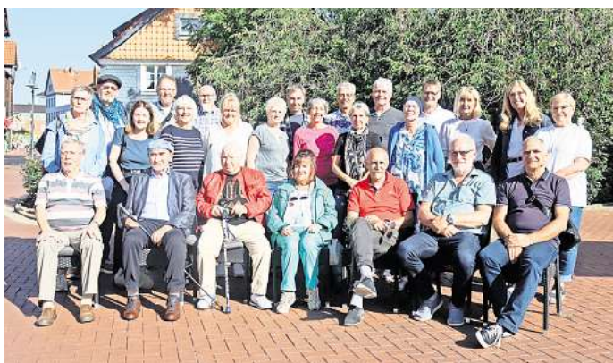
Ein Foto zu Erinnerung: 50 Jahre nach der Schulentlassung trafen sich die Ehemaligen in Salzgitter-Bad.

Nach einer Kaffeetafel bei Bennos Feiner Kost folgte eine