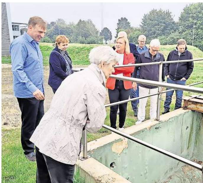
Viel zu entdecken: Salzgitters Bundestagsabgeordnete Dunja Kreiser sieht sich mit ein paar Interessierten das Klärwerk-Nord an.

Herstellerverantwortung besonders wichtig. „Damit führen wir erstmals ein, dass die Hersteller nach dem Verursacherprinzip sich an den Reinigungskosten des Wassers beteiligen. Ein angenehmer Nebeneffekt der Einführung einer vierten Reinigungsstufe wird die Abwasserwiederverwendung sein, wovon im ersten Schritt besonders die Landwirtschaft profitieren wird.“