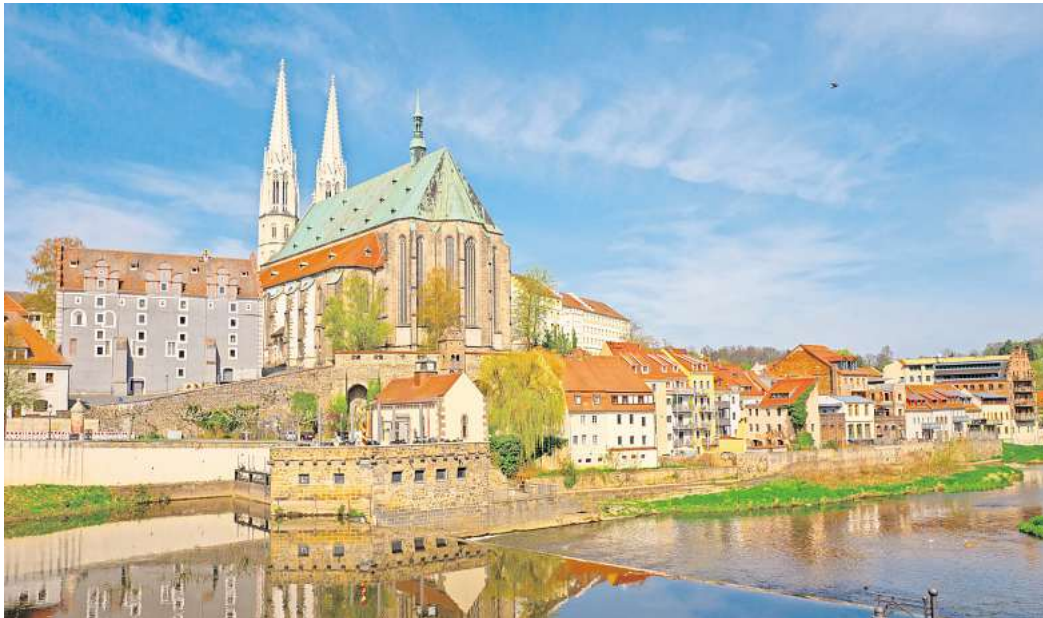
Die Peterskirche ist das Wahrzeichen von Görlitz.

Der Hoover Dam ist eine Talsperre und befindet sich etwa 45 Kilometer südöstlich von Las Vegas entfernt. Die mächtige Mauer wurde bereits in den Dreißigern errichtet und staut den Colorado River zum Lake Mead auf. Von dort wird das Wasser kontrolliert an Arizona,