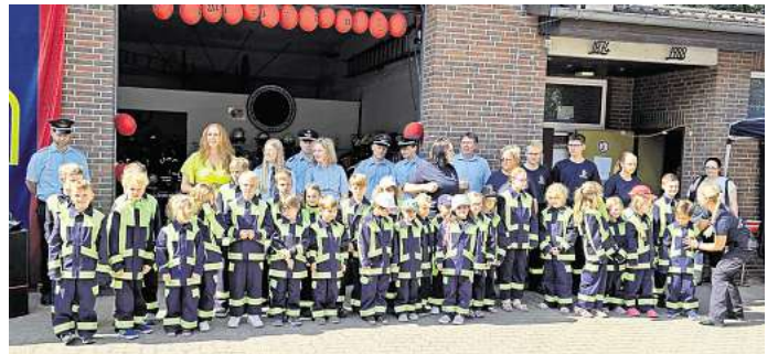
Die Feuerfuchse sind neu am Start: Die Kinderfeuerwehr steht in voller Montur vor dem Feuerwehrgerätehaus in Woltwiesche.