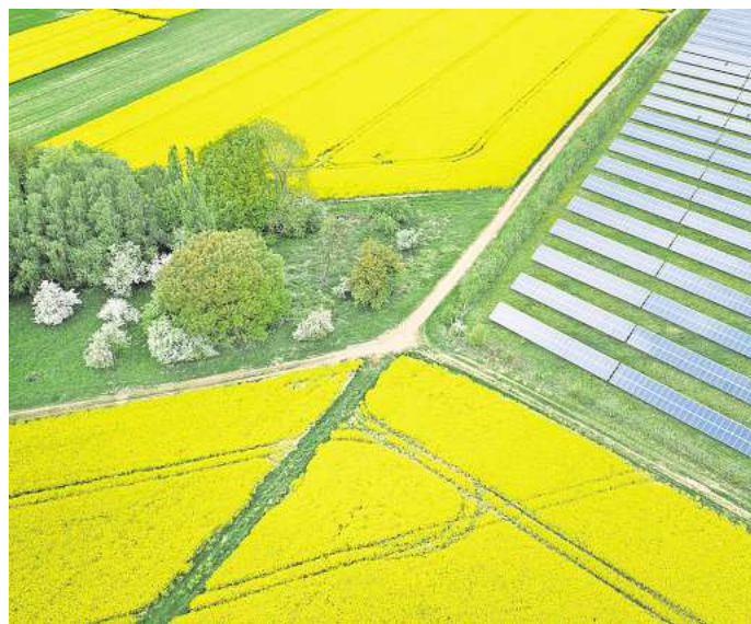
Sonnenstrom für Salzgitter: So könnten die Solarfelder später aussehen, die derzeit in Mecklenburg-Vorpommern geplant sind.