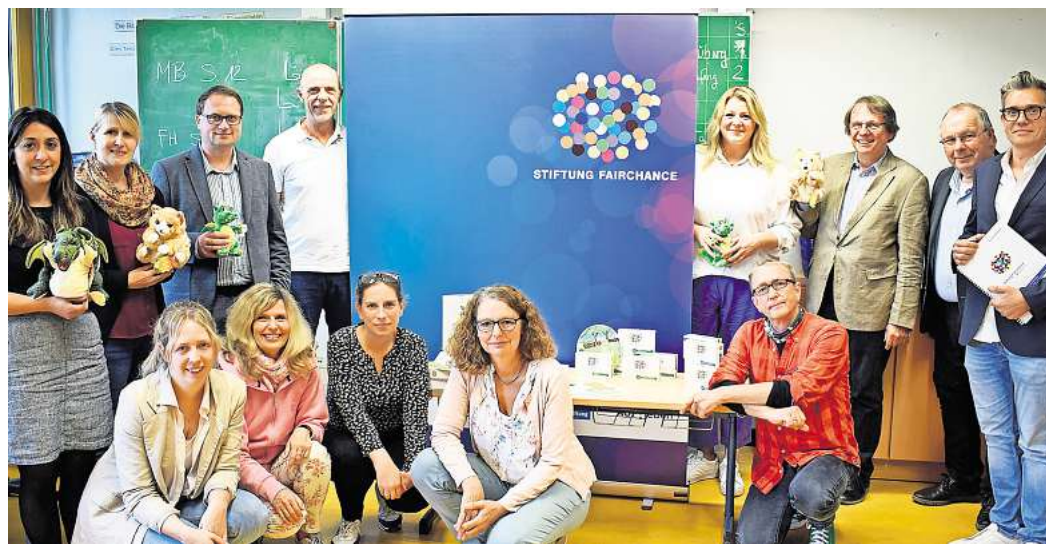
Das MITsprache-Programm kommt nach Salzgitter: Die Beteiligten aus allen beteiligten Institutionen trafen sich zum offiziellen Auftakt in der Kranichdammsschule.

Die Trauerfeier findet am 10.10.2024 um 14.00 Uhr statt, Friedhofskapelle SZ, Peiner Straße 86. Von Blumenspenden und schwarzer Kleidung bitten wir abzusehen.