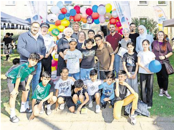
Ein bunter Nachmittag: Die Diakonie-Integrationseinrichtung START.Punkt! und die TAG feiern mit vielen Familien den Weltkindertag im Quartier an der Berliner Straße.

Die Diakonie-Einrichtung START.Punkt! feiert mit Familien aus dem Quartier den Weltkindertag