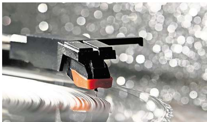
Ein für viele längst vergessenes Utensil: Petra Wisse hat einen Plattenspieler fotografiert. Zu sehen ist das Bild im Kniestedter Herrenhaus.

Die Arbeitsgemeinschaft „Bildwerk“ stellt bis Ende des Jahres bei der VHS in Salzgitter-Bad aus