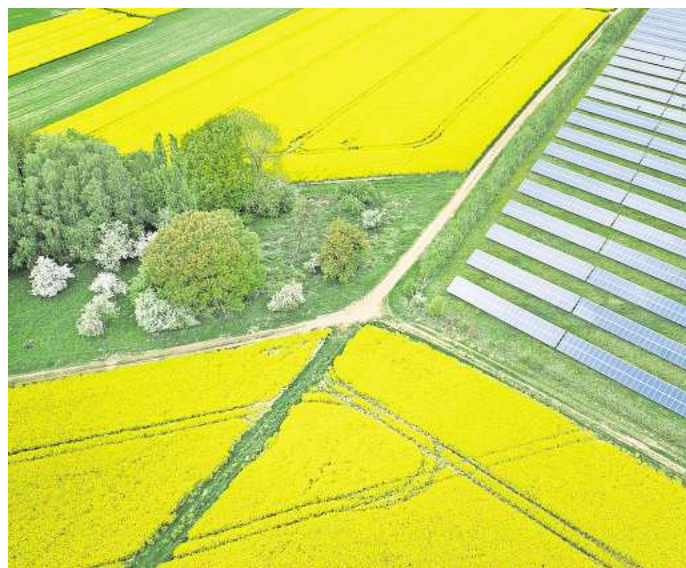
Sonnenstrom für Salzgitter: So könnten die Solarfelder später aussehen, die derzeit in Mecklenburg-Vorpommern geplant sind.