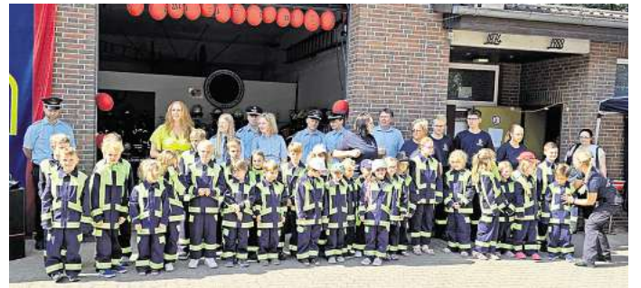
Die Feuerfuchse sind neu am Start: Die Kinderfeuerwehr steht in voller Montur vor dem Feuerwehrgerätehaus in Woltwiesche.