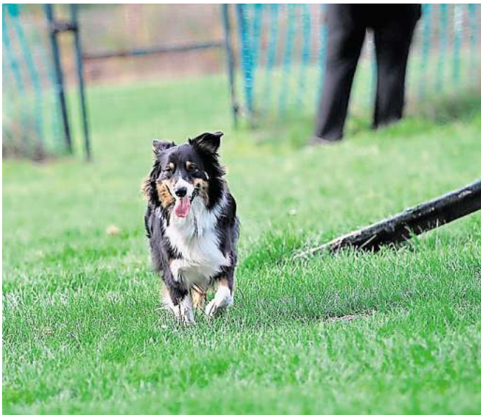
Ob klein oder groß: Beim Hunderennen können Vierbeiner unterschiedlichster Größe antreten.

Beim Hunderennen geht es nicht um die Wurst, sondern um die Medaille