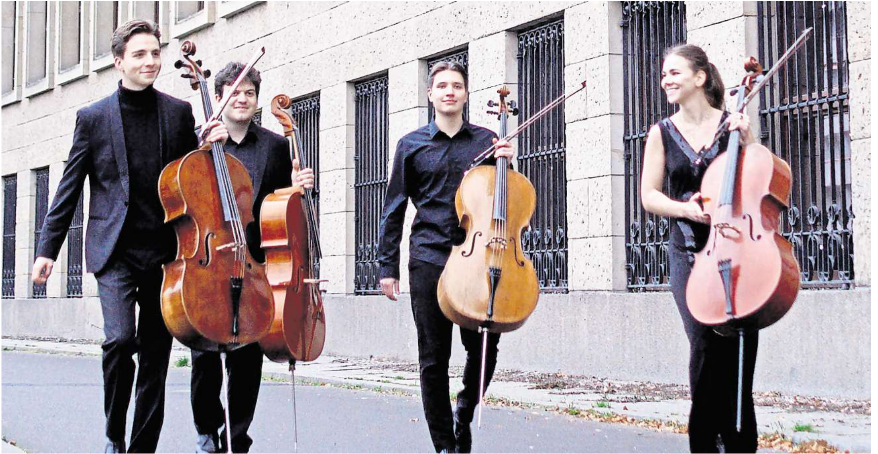
Spielt in Salzgitter-Bad: Das „2Cities Celloquartett“ nimmt sein Publikum mit auf eine musikalische Entdeckungstour.

Das „2Cities Celloquartett“ gastiert am 20. Oktober in der Heiligen Dreifaltigkeit