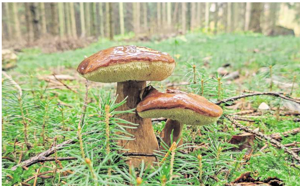
Bei der Marone sieht die Hutunterseite aus wie ein Schwamm - ein deutliches Erkennungszeichen auch für Anfängerinnen und Anfänger in Sachen Pilzsammeln.