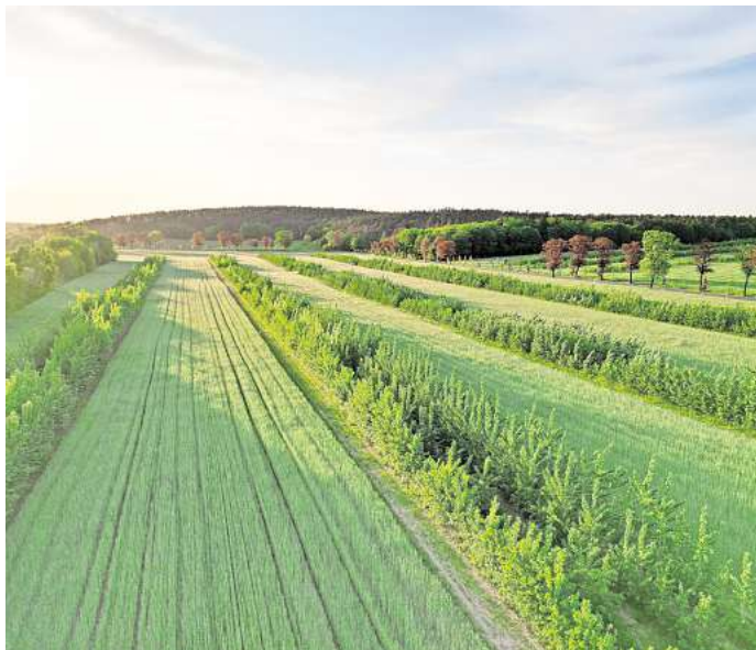
In dem Projekt sollen die Effekte der Kombination von Grünland- und Ackerflächen mit Gehölzen untersucht werden.

Untersucht werden sollen Auswirkungen auf Pflanzenbau, Ökonomie und Biodiversität