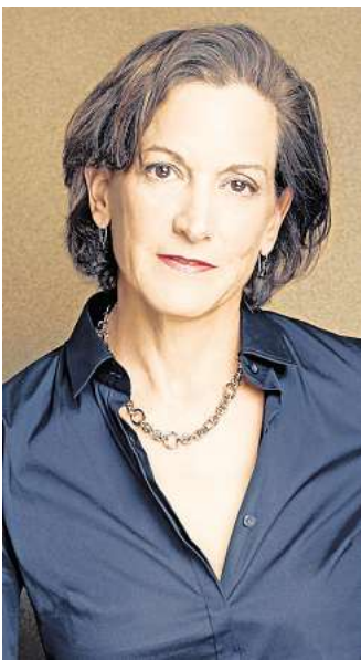
Zu Gast im Online-Programm der VHS Salzgitter: Anne Applebaum ist die Friedenspreisträgerin 2024.

Zitat aus der Friedenspreisurkunde des Deutschen Buchhandels für die US-amerikanische Historikerin, Autorin und Journalistin: „Historiographische Erkenntnisse mit wacher