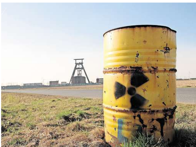
Schacht-Konrad-Gegner gehen jetzt gerichtlich gegen das geplante Atommülllager vor.