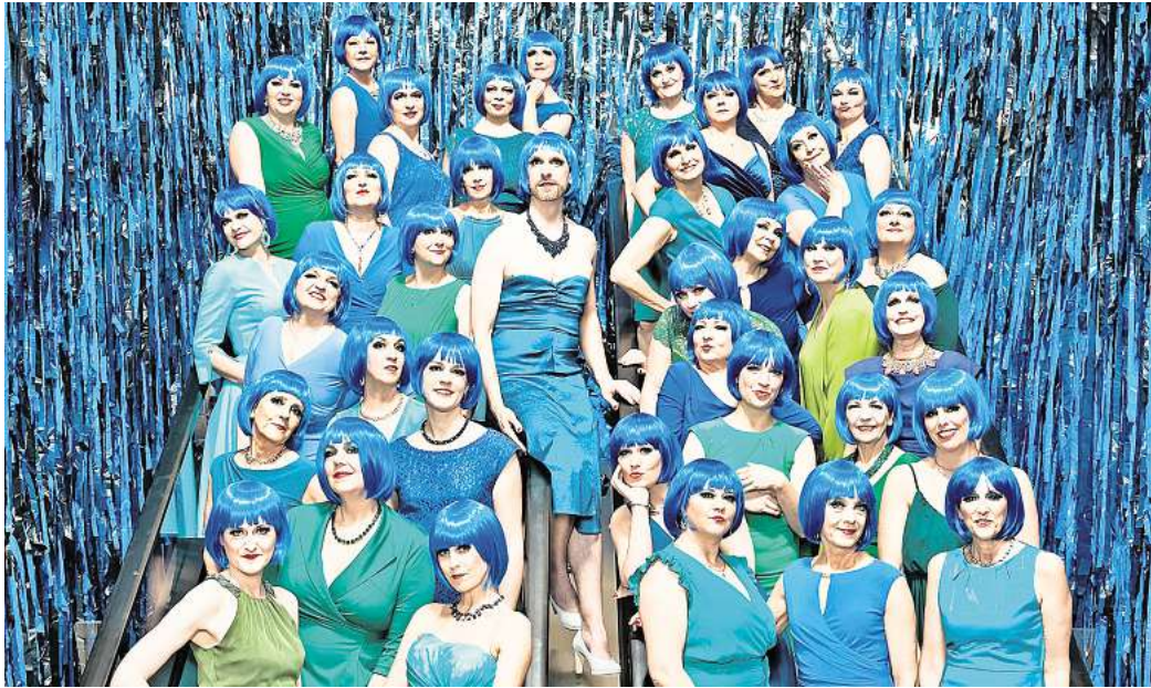
Die Folge einer Schnaps-idee: Der Damenlikörchor aus Hamburg besteht seit 25 Jahren und gastiert am 19. Oktober in Salzgitter.

Die „30 hinreißenden Damen singen wie die Engel und treffen (fast) immer den richtigen Ton“, heißt es in der Vorschau. Sie sind unterwegs, um zu feiern: das Leben, die Liebe und den schönen Klang. Sie haben sich nicht nur als „singendes Bühnenbild“ einen Namen gemacht, sie haben auch sonst einiges zu bieten: Mehr als tausend Jahre Krisen- und Beziehungserfahrung, einen überdurchschnittlichen Konsum an durchsichtigen Getränken, knallroten Lippenstiften, hochhackigen Schuhen, figurformender Unterwäsche und künstlichen