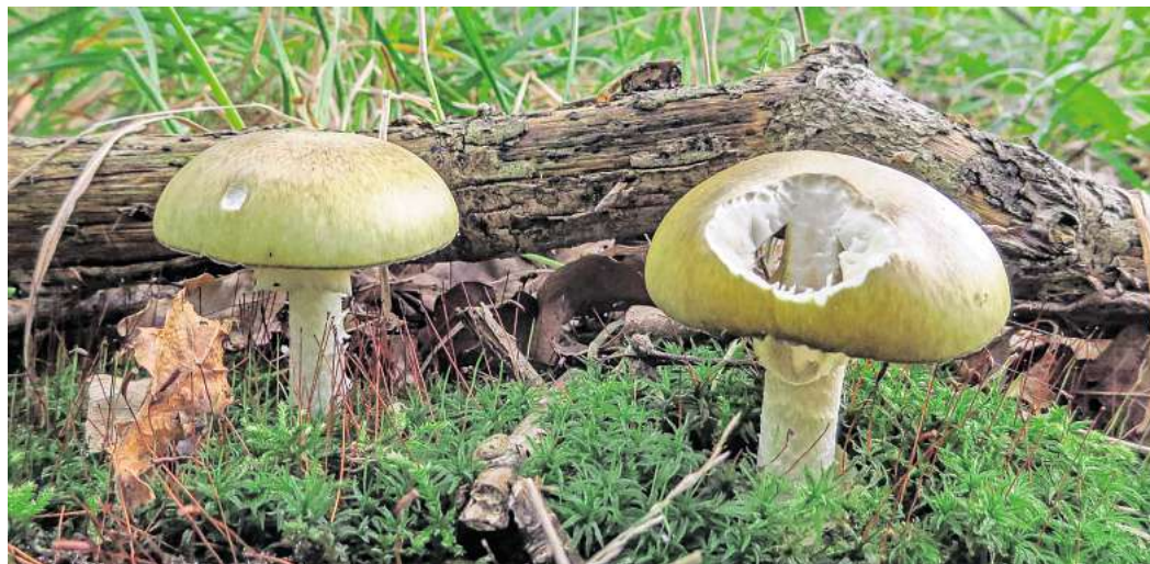
Selbst der hochgiftige Knollenblätterpilz stellt bei Hautkontakt keine Gefahr dar.

Wenn doch mal Vergiftungssymptome wie Übelkeit, Erbrechen, Herzrasen oder erschwertes Atmen verspürt werden, gilt es zunächst Ruhe zu bewahren. „Die Angst ist meist größer als die tatsächliche Gefahr. Trotzdem sollte auf eine Selbstdiagnose und Behandlungsversuche mit Hausmitteln verzichtet werden. Es gilt in jedem Fall Kontakt zu einem Arzt oder einer Giftnotrufzentrale aufzunehmen. Die Kontaktdaten sind auf der Website der DGfM zu finden, genauso wie Verhaltensregeln und weitere Sofortmaßnahmen.“ Für Niedersachsen ist der Giftnotruf unter der Notfallnummer 05 51 - 19 240 zu erreichen.