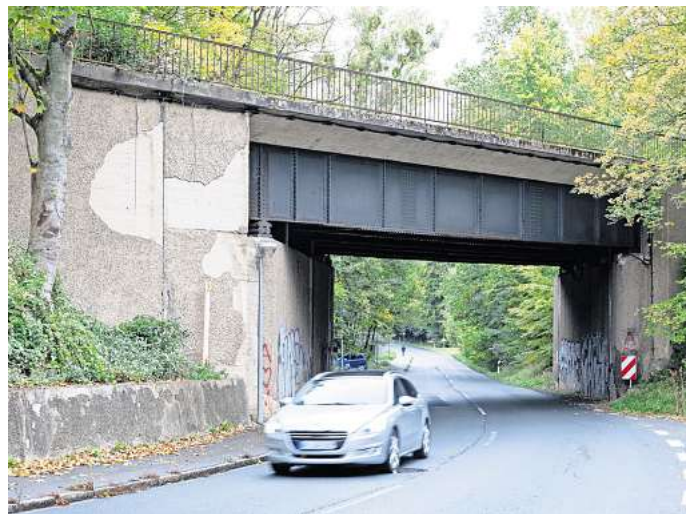
Abriss: Ab kommenden Montag gehört die Brücke zwischen Gustedt und Gebhardshagen der Vergangenheit an.

wiese genutzt. In den Achtzigern fand auf der Strecke die letzte Fahrt statt. Im Anschluss nutzte die Deutsche Gesellschaft zum Bau und Betrieb von Endlagern für Abfallstoffe mbH (DBE) die Strecke bis 2008, um insgesamt 1,6 Millionen Tonnen Abraum, also Erde und Gestein aus dem Tagebau, aus der Schachanlage Konrad in den Tagebau Haverlahwiese zu bringen. 2011 startete die VPS nach umfassenden Vorarbeiten und behördlichen Verfahren schließlich mit dem Rückbau der Grubenanschlussbahn und der öffentlichen Strecke. Jetzt folgt in einem weiteren Schritt der Brückenabriss.