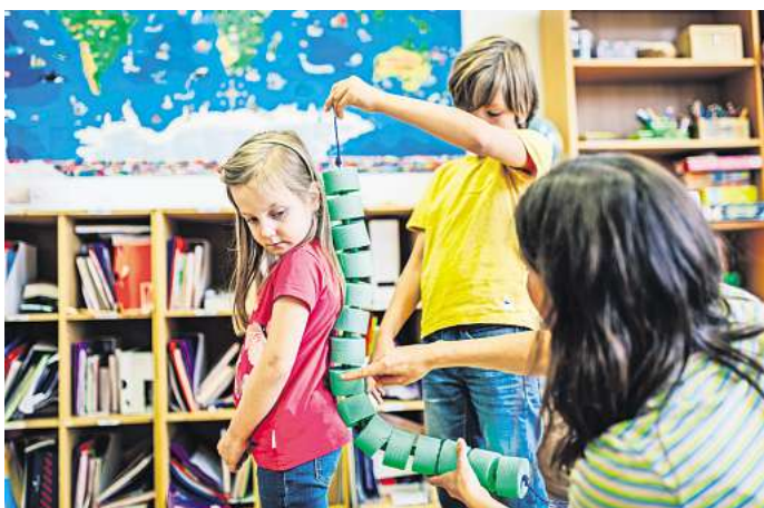
Der Workshop bietet pädagogischen Fach- und Lehrkräften Anregungen, um Kindern die Funktionsweise des Körpers vorzustellen.

In der Fortbildung „Forschen rund um den Körper“ erhalten die Fach- und Lehrkräfte die Gelegenheit, zu entdecken und zu erforschen, was die Menschen von außen über ihren Körper erfahren und auf welche Art das Innere begreifbar gemacht werden kann. Um eine Vorstellung über den inneren Aufbau und die Funktionen des menschlichen Körpers zu entwickeln, helfen