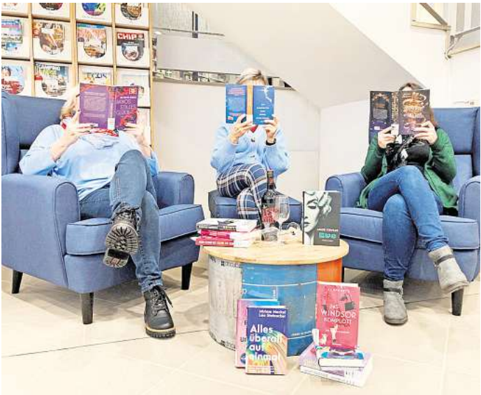
Stecken ihre Nase gerne in Bücher: Die Mitglieder aus dem Team der Stadtbibliothek stellen in der Reihe „Literarisches und Kulinarisches“ einige Neuerscheinungen vor.

Wie stets wird es eine Liste mit den besprochenen und weiteren besonderen Titeln geben. Alle vorgestellten Bücher befinden sich im Bestand der Stadtbibliothek Salzgitter und können entliehen beziehungsweise vorbe-stellt werden. Die Veranstaltung wird kulinarisch unterstützt von der Bibliotheksgesellschaft Salz-gitter, die traditionell für ein