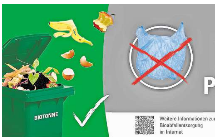
Schluss mit Beuteln und Tüten: Nur Biomüll darf in die grünen Tonnen.

In den Biobehältern werden überwiegend Küchen- und Gartenabfälle wie Obst- und Gemüsereste, Speisereste, Rasen- und Strauchschnitt sowie Blumen entsorgt. „Insbesondere Plastiktüten gehören nicht in den Bioabfall“, heißt es aus dem Rathaus. Plastiktüten und auch Biobeutel,