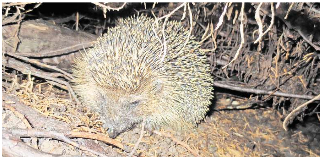
Igel brauchen einen Unterschlupf: Die Naturschutzbehörde appelliert an die Menschen, Laub und Gehölze auf einen Haufen zusammen zu kehren und liegen zu lassen.

Wer Igeln helfen will, sollte Gärten und Anlagen darüber hinaus möglichst das ganze Jahr naturnah gestalten und pflegen. Hinweise und Tipps zum Umgang und auch zur Überwinterung von Igel sind bei der unteren Naturschutzbehörde unter den Telefonnummern (05341) 839-3421 oder 839-3695 erhältlich. Gut zu wissen: Alle Igel mit einem Körpergewicht von mindestens 500 Gramm sind fit genug, den Winter selbstständig zu überstehen. Außer einem geeigneten Unterschlupf benötigen sie keine weitere Hilfe.