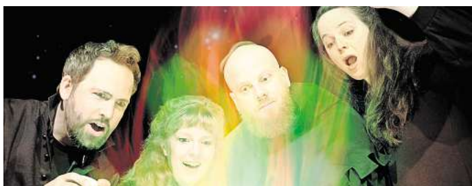
Eine zauberhafte Geschichte: Das "Theater ex libris" bringt den "satanarchäologischen Wunschkunsch" mit in die Kniki.

Das Live-Hörspiel ist etwas für alle Kinder ab zehn Jahren. Karten gibt es im Vorverkauf für zwölf 12 Euro (Abendkasse 15) beim Literaturbüro der Stadt Salzgitter unter Tel. (05341) 839-3752 oder per E-Mail an literaturbuero@stadt.salzgitter.de