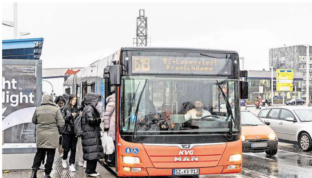
Der Busverkehr ist kostspielig: Salzgitter und die benachbarten Kommunen sollen ab 2026 zehn Millionen Euro zusätzlich bezahlen.