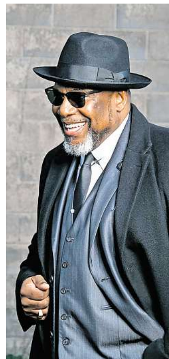
Stammgast in Salzgitter: Big Daddy Wilson ist am 30. November in der Kniki zu hören.

Urban Grooves. Tickets gibt es im Vorverkauf für 25,40 Euro unter www.reservix.de , an der Abendkasse kosten sie 30 Euro.