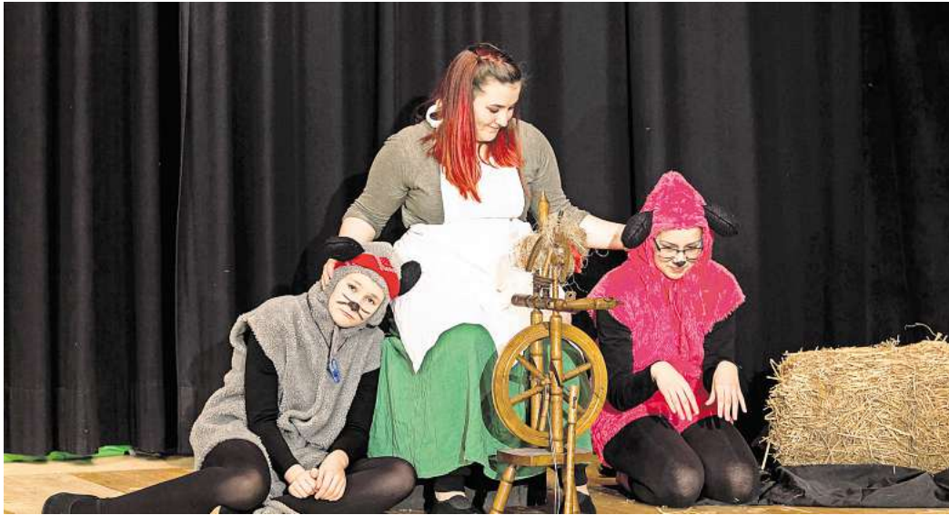
Zwei Auftritte im Advent: Die Märchenbühne des Gymnasiums SZ-Bad bei den Proben für "Rumpelstilzchen"

Mit schönen Kostümen und einem pfiffigen Bühnenbild sollen die jungen Gäste in die Märchenwelt entführt werden und Anteil nehmen an dem Geschick der armen Müllerstochter Goldi. Sie spinnt mit Rumpelstilzchens Hilfe Stroh zu Gold, rettet damit ihren Vater aus der Gefangen-