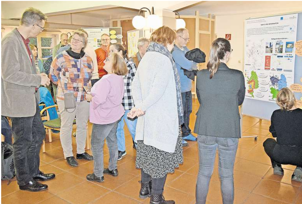
Viele Gespräche und volle Pinnwände: Die Bürgerinnen und Bürger hatten viele Ideen für den Öffentlichen Nahverkehr.

Dafür hat das Ingenieurbüro stadtraum bereits einen Ak-