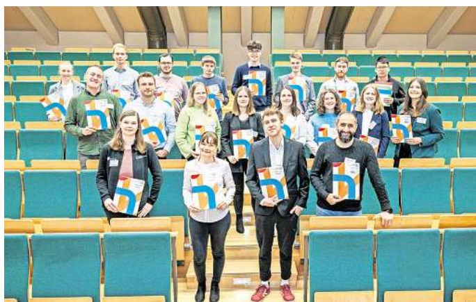
Freude bei den Empfängern und Empfängerinnen: Gruppenfoto in der Ostfalia beim Matching-Abend zur Vergabe des Deutschlandstipendiums.

dium werden begabte und ein-satzfreudigen Studenten und Studentinnen gefördert. Das