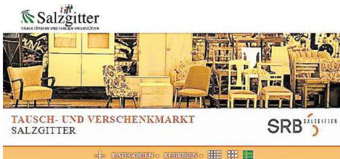
Ob Möbel, Arbeitsschuhe oder Laubbläser: Im Tausch- und Verschenkemarkt des SRB im Internet findet sich vieles.

Der Tausch- und Verschenkemarkt auf der Internetseite www.verschenkmarkt-salzgitter.de ist eine „schöne und auch nachhaltige Alternative zum Neukauf“, schreibt der Städtische Regiebetrieb Salzgitter