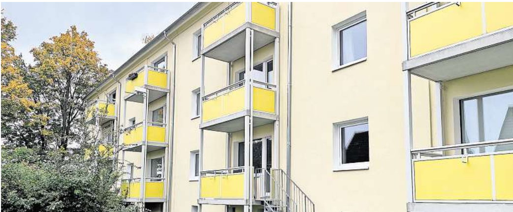
Die Arbeiten sind abgeschlossen: Letzte Gerüstteile liegen vor den Häusern am Ischenberg in Hallendorf, dahinter sind die neuen Balkone zu sehen.

1,8 Millionen davon in die Häuser am IIschenberg im südlichen