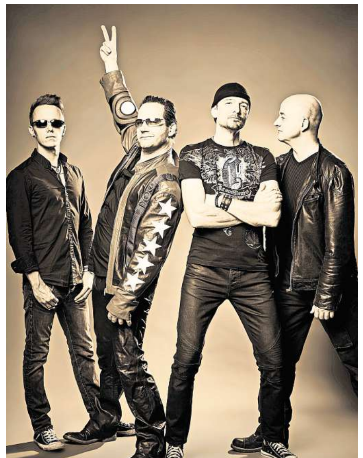
Bringen U2 in die Kulturscheune: Die Band "Achtung, Baby" gastiert am 7. Dezember in Lebenstedt.

der Ansage. Alle Anrufe, die am 23. und 24. November 2024 eingehen, nehmen teil. Die Gewinner werden telefonisch benachrichtigt. Der Anruf kostet 50 Cent aus dem Festnetz. Mobilfunktarife können abweichen.