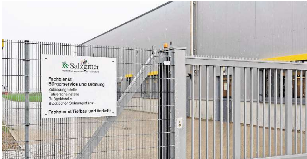
Software-Arbeiten stehen an: Die Stadt muss die Zulassungsstelle ab dem 27. November für eine Woche schließen.

Um den Zeitraum möglichst gering zu halten, werden die Software-Arbeiten sowohl am Samstag als auch am Sonntag fortgesetzt, heißt es weiter. Wer einen Notfall hat, könne sich in dieser Zeit an die Telefonnummer (05341) 839-3000 wenden. Die Zulassungsstelle weist darauf hin, „dass Außerbetriebsetzungen grundsätzlich von allen Zulassungsstellen unabhängig vom Wohnsitz des Halters