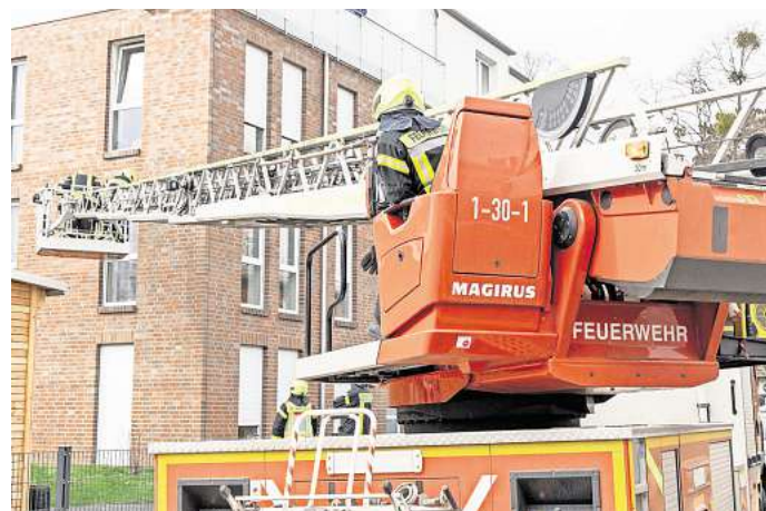
Einsatz im Posthof: Salzgitters Feuerwehr bekommt zusätzlich eine neue Drehleiter, allerdings dauert die Lieferung ein bis zwei Jahre.

Die Bedarfszuweisungen haben eine Gesamthöhe von insgesamt rund 22,8 Millionen Euro. Damit werden notwendige kommunale Investitionen für abwehrende Brandschutzmaßnahmen wie die Beschaffung von Feuerwehrfahrzeugen oder Baumaßnahmen an Feuerwehrgebäuden gefördert. Durch diese Form der Bedarfszuweisung werden einzelne kommunale Maßnahmen und Projekte in einer Höhe von maximal 1,5 Millionen Euro unterstützt.