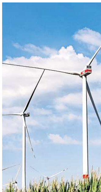
Ein Bild nach dem Aufbau im Spätsommer: Die neuen Windräder in Lesse und Barbecke laufen nun im Vollbetrieb.

In Lesse in Salzgitter wurden elf alte Windenergieanlagen (Gesamtleistung 19,8 MW) durch acht neue Turbinen mit einer Gesamtleistung von 44,7 MW ersetzt. In Barbecke im benachbarten Landkreis Peine wurden sechs Altanlagen (Gesamtleistung 10,8 MW) abgebaut, dort stehen nun drei moderne Windräder mit einer Gesamtleistung von 17,1 MW.