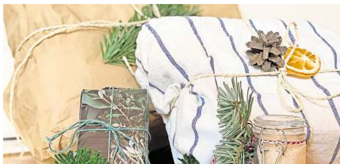
Ein Geschirrtuch tut es auch: Der NABU in Salzgitter rät zu nachhaltigen Verpackungen.

„Tüten, Folien, Geschenkblätter und Co. sorgen jedes Jahr für Berge an Geschenkverpackungen unter dem Weihnachtsbaum, die letztendlich im Müll landen“, so der NABU. Dabei könnten die Menschen gerade beim Einpacken der Geschenke kreativ sein und mit nachhaltigen Verpackungen unnötiger Abfall sparen. „Die goldene Regel dabei: Nutzen, was ohnehin schon da ist und auf wiederverwendbare Materialien zurückgreifen.“