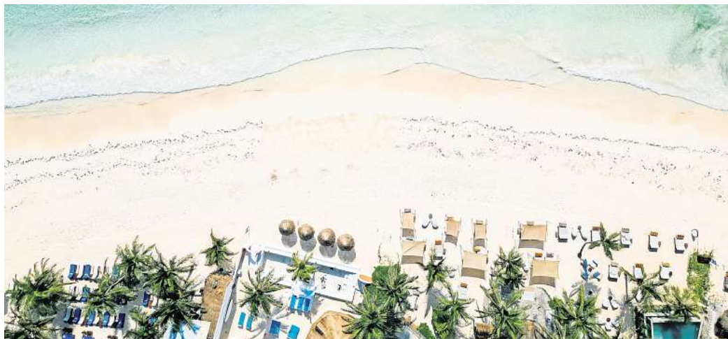
Der weißeste Strand der Welt befindet sich laut dem Ranking in Mexiko.

Der Tulum Beach ist laut der Analyse von CV Villas der weißeste Strand der Welt. Dieses weiße Wunder findest du an der Karibikküste Mexikos, angrenzend an die Küstenstadt Tulum auf der Halbinsel Yucatán. Hier trifft schneeweißer Pudersand auf kristallklares Meerwasser – ein echtes Postkartenmotiv. Ab-