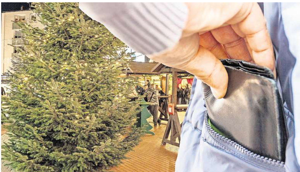
Ein kurzer Griff: Die Polizei rät dazu, Geldbörsen in der Jacke zu verstauen und nicht leicht zugänglich in der Hosentasche.

Um die Bürgerinnen und Bürger zu sensibilisieren, ist die Wolfenbütteler Polizei wieder in der Innenstadt und auf dem Weihnachtsmarkt aktiv. Die Präventionsarbeit soll aufklären und bestenfalls vor Diebstahl und Trickbetrug schützen. Häufig werden Mobiltelefon oder Geldbörse in der Gesäßtasche verstaut. Jedoch können dort Taschendiebe die Sachen leicht und unbemerkt entfernen. Gerade wenn größeres Gedränge vor-