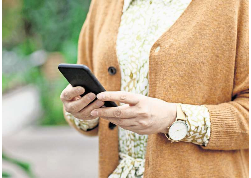
KI-Oma "Daisy" soll Internetkrimelle abwimmeln.

Doch der Betrugsschutz geht längst weiter: Auf seiner diesjährigen Produktkonferenz stellte Google eine neue Scam-Erkennung für Telefonate vor, die dieser Tage als Beta-Version ausgerollt