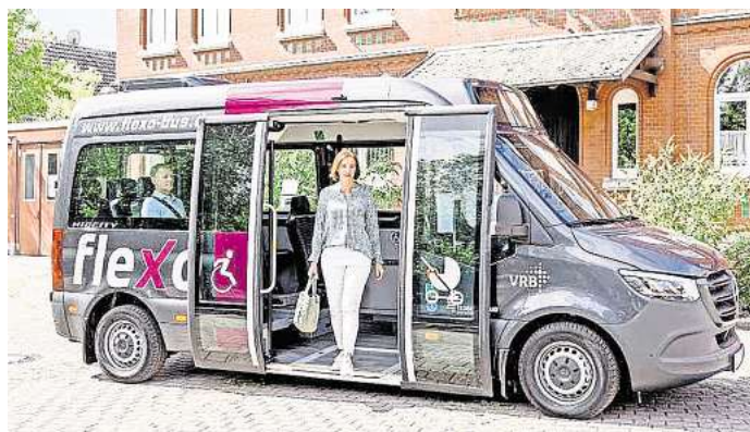
Neustart in Baddeckenstedt: Ab August 2025 sind die flexo-Busse wieder im Einsatz.

folgt für den Zeitraum vom 10. August 2025 bis 31. Dezember 2031.