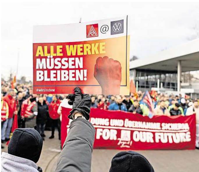
Alle VW-Werke müssen bleiben: Das Bild stammt vom Warnstreikauftakt am 2. Dezember, an der Forderung des IG Metall und der Beschäftigten hat sich nichts geändert.

In den Verhandlungen in der Volkswagen Arena, östlich vom Wolfsburger VW-Werk gelegen,