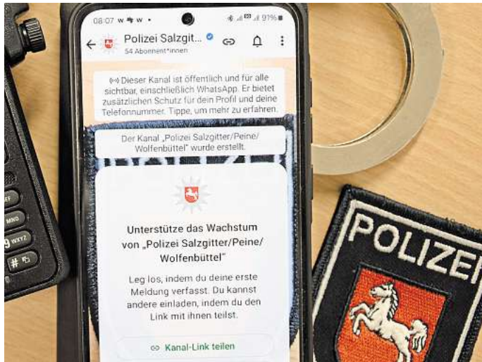
Ganz nach dran an den Bürgerinnen und Bürgern: Die Polizei Salzgitter/Peine/Wolfenbüttel betreibt jetzt einen WhatsApp-Kanal.

Nicht nur Privatpersonen, sondern auch Unternehmen und Organisationen können über dieses Medium angesprochen werden. Das Konzept sieht vor, dass die Polizei zu den folgenden Themen Inhalte einstellt: relevante Pressemeldungen der täglichen Lage und zu besonderen Einsätzen, Veranstaltungshinweise, Fahndungen,