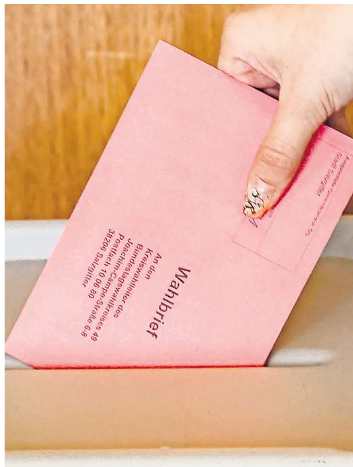
Stimmabgabe vor Ort: Die Stadt Salzgitter öffnet am 10. Februar ihre Briefwahlbüros in Lebenstedt und in SZ-Bad.

Das Briefwahlbüro ist per E-Mail briefwahlbuero@stadt.salzgitter.de zu erreichen.