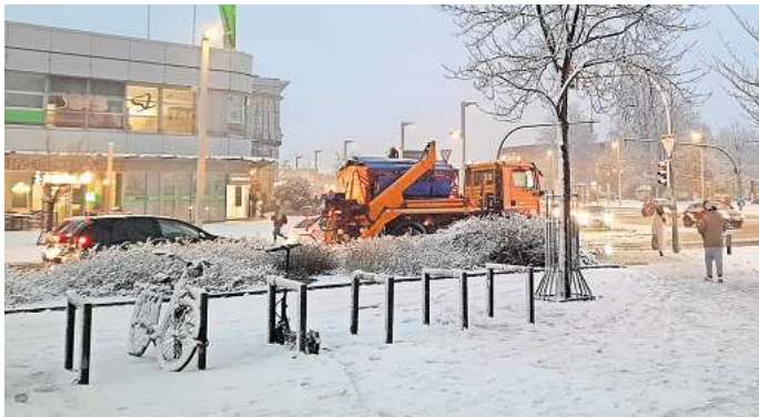
Schneefall ohne Ende: Der SRB bemühte sich, am Donnerstag alle Hauptstraßen frei zu halten - wie hier in Lebenstedt am BraWo-Carree.

Bedingt durch das Winterwetter kam es am Nachmittag und Abend auch zu einigen Einsätzen der Berufsfeuerwehr. Auf der Nord-Süd-Straße sowie auf