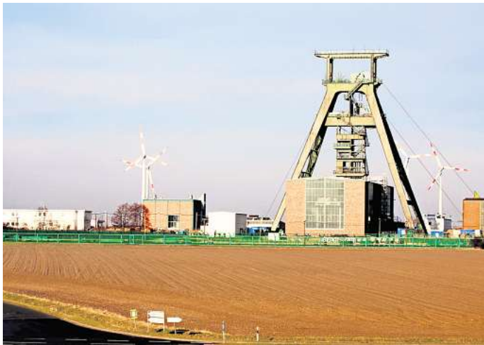
Ein Fall für das Oberverwaltungsgericht: BUND und NABU gehen weiter gegen Schacht KONRAD als Atomendlager vor.

Sie finden es falsch und gefährlich, sich wie „das Niedersächsische Umweltministerium und die Betreiberin auf die Sicherheitsanforderungen von 1983 zu berufen. „Für alle ande-