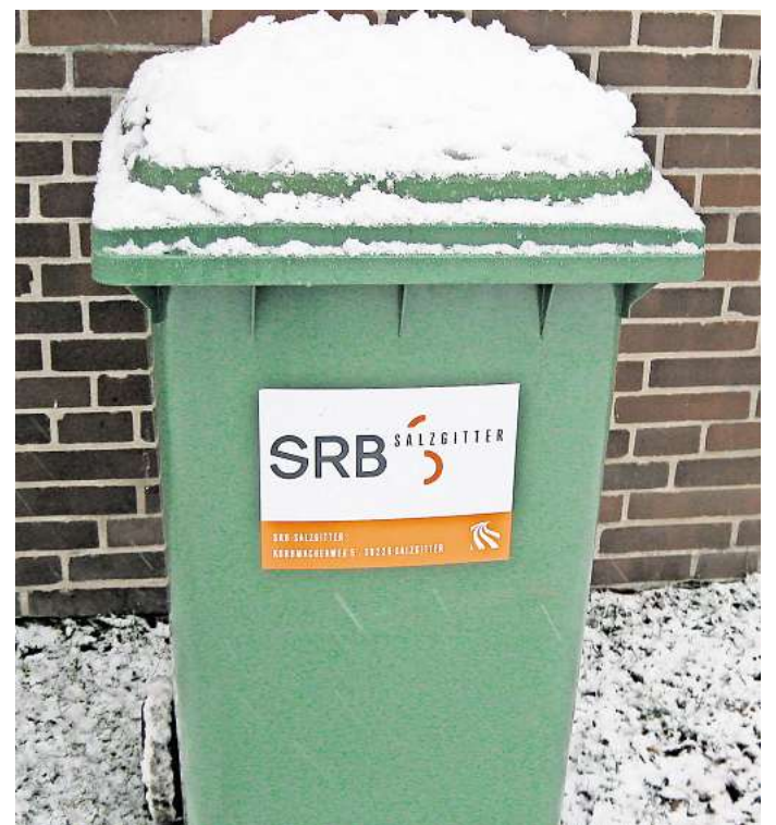
Ein weißer Deckel für die grüne Tonne: Das eisige Wetter erschwert dem SRB das Leeren der Behälter.

Der SRB bittet zu bedenken, dass auch die Mitarbeitenden der Müllabfuhr nur begrenzte Möglichkeiten zur Leerung der Biotonnen haben und diese auch immer im Interesse der Bürgerinnen und Bürger ausschöpfen. Fragen beantwortet die SRB-Abfallberatung unter Telefon (05341) 839-3741.