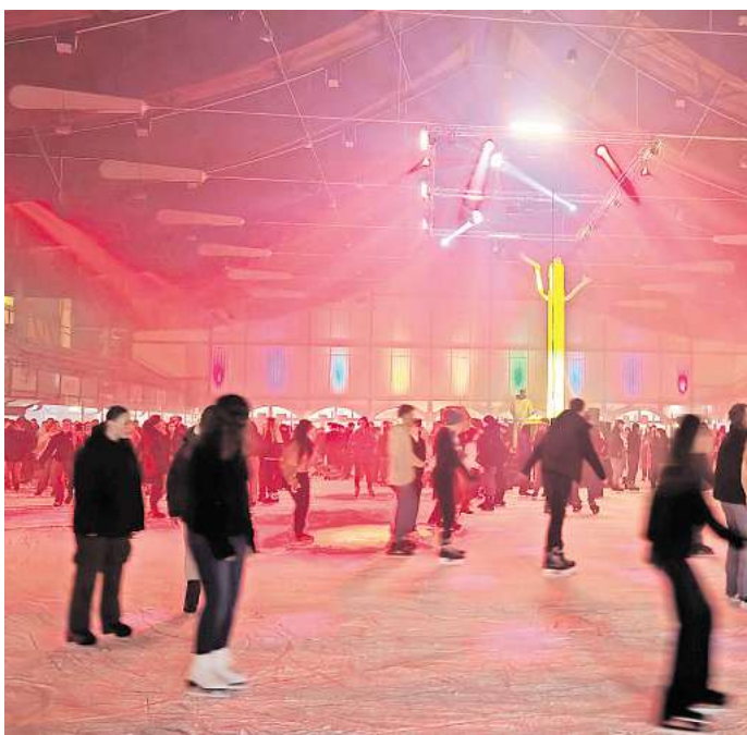
Hochbetrieb im Stadion: Am 24. Januar steigt die nächste Retro-Eis-Party in Salzgitter.

Hinzu kommt eine Bühne mitten auf der Eisfläche, auf der DJ Dominic Grains steht und für die Musik sorgt. Er will „mit den besten Beats der 80er, 90er und 2000er die Eisfläche in eine riesige Tanzfläche verwandeln“ und