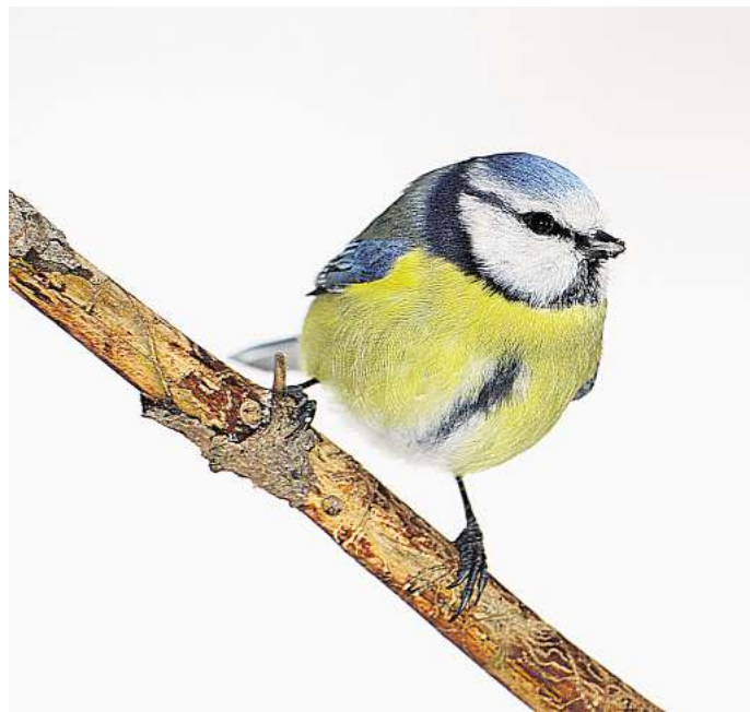
Auf Platz drei: Bei der "Stunde der Wintervögel" wurden Blaumeisen aber etwas seltener gesichtet als im Vorjahr.

Nach ersten Einschätzungen zeigt sich in Südost-Niedersachsen das gleiche Ranking wie im Landes- und Bundesgebiet: Die Kohlmeise folgt mit einem Minus von derzeit 9 Prozent auf Platz zwei, die Blaumeise erhält die Bronzemedaille mit einem Minus von 7 Prozent. Auf den Plätzen 4 und 5 folgen Amsel und Feldsperling, dies allerdings mit sehr starken Rückgängen. Die verheerende Seuche, die durch das Usutu-Virus im vergangenen