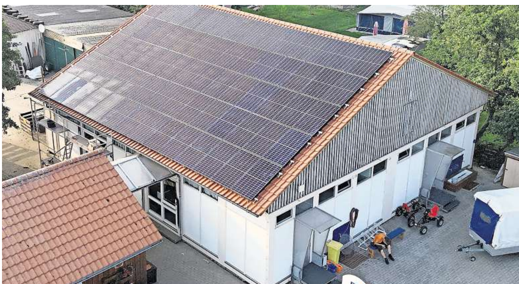
Die Solaranlage ist fertig: Das Jugendcamp Neuwerk wird jetzt mit sauberer Energie betrieben.

Die Vorsitzende und die Elektrofirma Kniebel ermittelten einen Bedarf an leistungsoptimierten Modulen und eine Speicherleistung von erzielten 26 kWh pro Jahr. Doch eine ent-