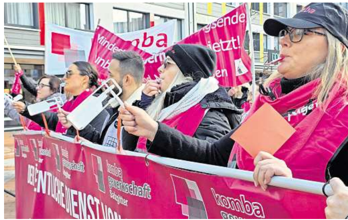
Fordern mehr Gehalt und Freizeitausgleich: Mitglieder der Gewerkschaft laufen mit Trillerpfeifen durch Salzgitter.

Die komba Gewerkschaft Salzgitter verurteilt die „unfaire und verschleppende Verhandlungstaktik“ der Arbeitgeberseite. „Wir geben jeden Tag unser Bestes für die Menschen in dieser Stadt – in Kitas, Schulen, der Feuerwehr und in vielen weite-