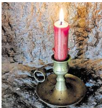
Alles rund um die Kerze: Für Erwachsene gibt es im Museum in Salder am 15. März einen Workshop.

Salzgitter. Im Städtischen Museum Schloss Salder läuft noch bis Sonntag, 11. Mai, ist die Mitmachausstellung „Wer rennt,