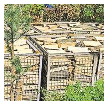
Jede Menge Kaminholz: Die Rotarier versteigern 16 Schüttraummeter für den guten Zweck.

sprache mit den Käufern innerhalb der folgenden zwei Wochen und wird innerhalb des Stadtgebiets Wolfenbüttel frei Bordsteinkante angeboten. Der Erlös ist unter anderem für die Jugendarbeit in den Wolfenbütteler Sportvereinen gedacht insbesondere zur Unterstützung von Kindern und Jugendlichen aus sozial benachteiligten Familien. Außerdem ist unter dem Stichwort „Gewaltprävention“ eine finanzielle Unterstützung für das Frauenhaus und einen Verein gegen sexuellen Missbrauch geplant.