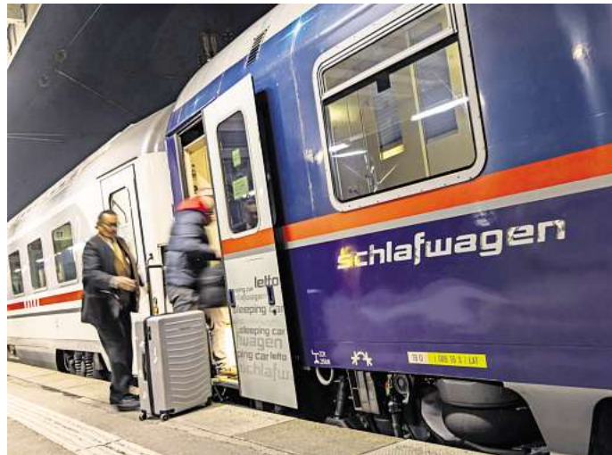
Im Schlaf ans Ziel kommen: Das ist möglich im Nachtzug.

Allerdings sind die Betten oben aufgrund der Dachwölbung manchmal ein Stückchen kürzer. Zudem ist die Kletterpartie in das obere Bett etwas umständlich, gerade nachts. Im Sommer kommt die Hitze hinzu: Oben ist die Luft am wärmsten.