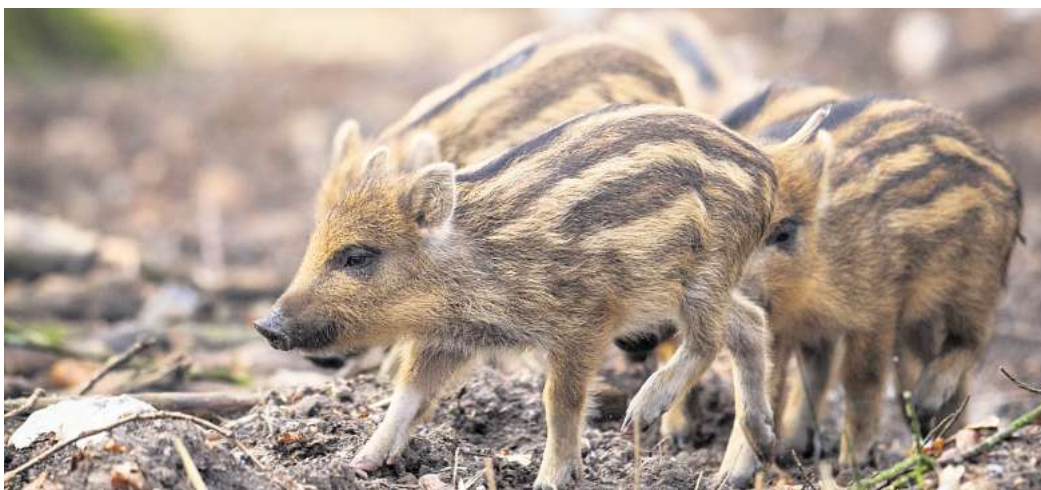
Süß anzusehen, aber Vorsicht ist angebracht: Wildschweinemütter verteidigen ihren Nachwuchs vehement.

Kaninchen oder Fuchs bringen ihre Jungen in einer Höhle zur Welt – taub und blind. Feldhase, Stockente oder Rehkitz hingegen werden mit voll entwickelten Sinnen geboren und verbringen die meiste Zeit allein in Wiesen und Feldern. Sie setzen auf die Strategie „Ducken und Tarnen“, eine Art Lebensversicherung vor Fressfeinden. Aus falsch verstandener Tierliebe landen allerdings immer mehr gesunde Jungtiere in Auffangstationen und werden zu Waisen. Der Deutsche Jagdverband (DJV) erläutert Überlebensstrategien heimischer Wildtiere und