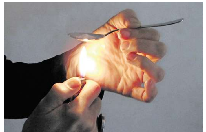
Heroinkonsum ist eine der häufigsten Todesursachen: Die Zahl der Drogentoten steigt jedes Jahr.

man mit Kindern, Enkeln, Partnern oder Freunden dazu ins Gespräch? Bei welchen Drogen ist schon das erste Mal gefährlich? Ab wann droht Abhängigkeit? Wie kann ein Entzug gelingen? Ein Expertenteam des BIOG steht am Montag, 24. März, von 14 bis 16 Uhr Rede und Antwort. Es ist unter der Telefonnummer (0221) 892031 zu erreichen.