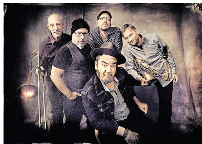
Spielen „Louisiana Hoodoo Blues“: Pugsley-Buzzard gastiert mit seiner Band am 21. März in der Kniki.

Karten gibt es im Vorverkauf für 21 Euro (inklusive Gebühr) unter www.reservix.de (Abendkasse 24 Euro).