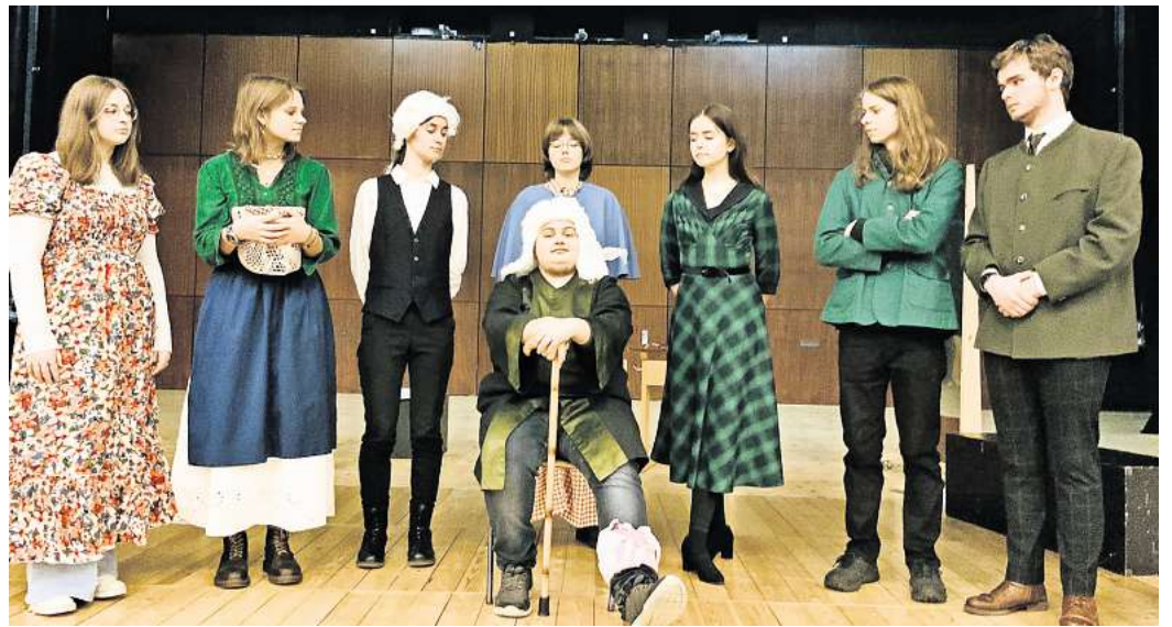
Proben für den 1. und 2. April: Die Oberstufen-Theater-AG des Gymnasiums Salzgitter-Bad zeigt den Klassiker „Der zerbrochene Krug“.

Kann er die Gerichtsrätin mit Rheinwein abfüllen? Wird er wegen grob fehlerhafter Amtsführung abgesetzt? Was wird aus den Verlobten? Und was weiß der ehrgeizige Schreiber Licht?