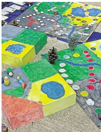
Ein Spiel selbst gestalten: Das ist ein Thema beim talentCAMPus der Volkshochschule in den Osterferien.

Salzgitters Volkshochschule hat für den talentCAMPus in den Osterferien noch Plätze frei