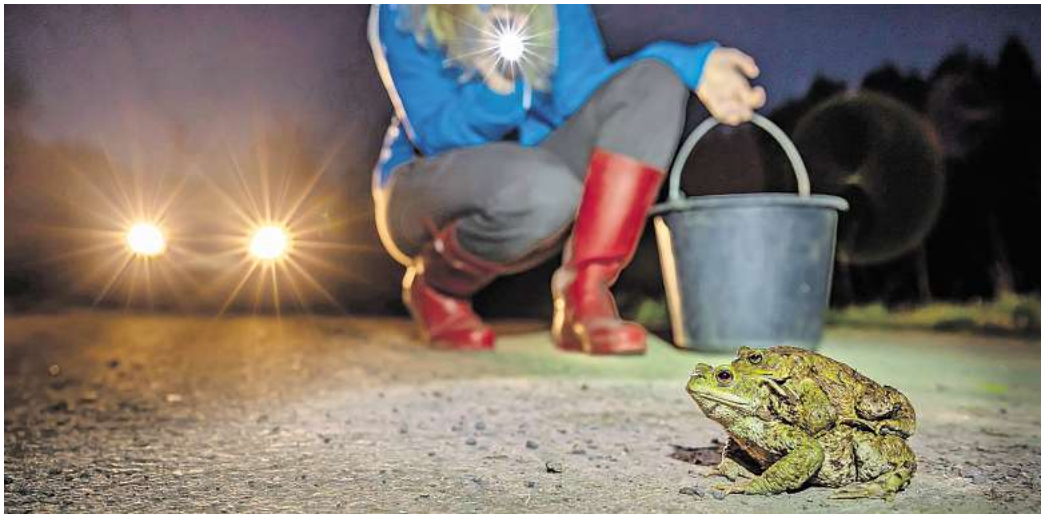
Sie sind auf den Straßen in der Region unterwegs: Seit den ersten warmen Tagen gingen die Kröten wieder auf Wanderschaft.

„Deswegen ist es wichtig, vor allem nachts und in der Dämmerung vorsichtig zu fahren. In Bereichen mit Amphibien-Hinweisschildern sollte möglichst Schritt-