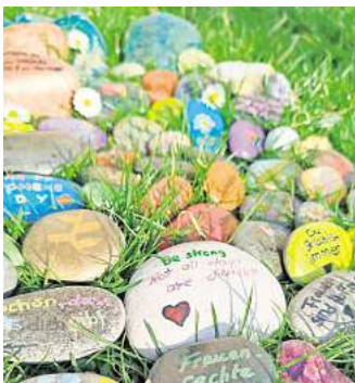
Bemalte Steine: Vor dem Startpunkt im Martin-Luther-Viertel finden sich Botschaften für Frauen.

Aktion vor der Diakonie-Begegnungsstätte Startpunkt zum Internationalen Frauentag