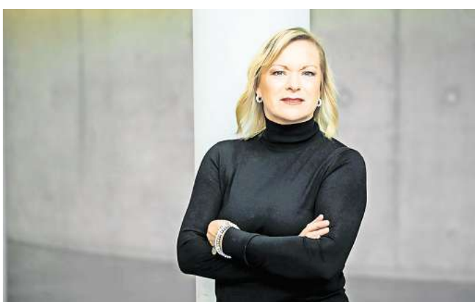
Setzt sich ein für das Ehrenamt: Salzgitters SPD-Bundestagsabgeordnete Dunja Kreiser lobt den Einsatz für die Gemeinschaft.

Die SPD-Bundestagsabgeordnete Dunja Kreiser, stellvertretende innenpolitische Sprecherin und Berichterstatterin für das Ehrenamt im Katastrophenschutz, ruft zur Unterstützung auf: „Ehrenamtliche sind das