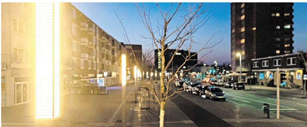
Das Licht geht aus: Für eine Stunde schaltet die Stadt Salzgitter die Lampen ab in der Innenstadt.

Tausende Städte werden ihre bekanntesten Bauwerke in Dunkelheit hüllen. Aber auch Unternehmen machen mit. In diesem Jahr aktiv dabei sind in Salzgitter unter anderem die WEVG und die MAN Nutzfahrzeuge Truck & Bus SE. Die Stadt nimmt mit dem Rathaus Lebenstedt, dem Kleinen Rathaus in Salzgitter-Bad, dem Gesundheitsamt und der Volkshochschule in Lebenstedt und in Salzgitter-Bad teil. Ebenfalls dabei ist die von der Bäder, Sport- und Freizeit GmbH betriebene Eissporthalle. Die Stadtverwaltung schaltet einen Teil der In-