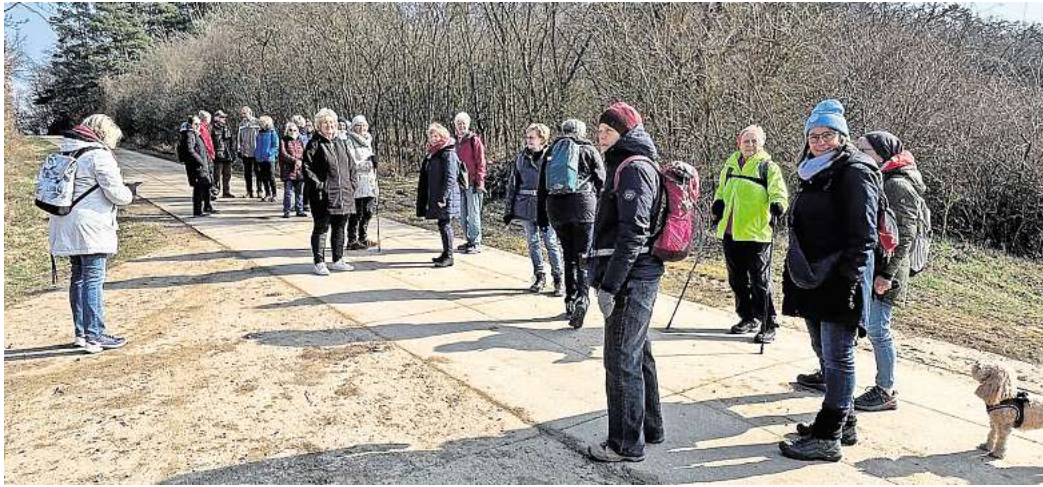
Start in Börnecke: Die Kneipp-Freunde Salzgitter-Bad sind 2025 an einigen Sonntag in der Region unterwegs.

Am 1. Mai heißt das Ziel Hoppenstedt und dort der Bismackturn Osterwieck. Es folgt am 25.