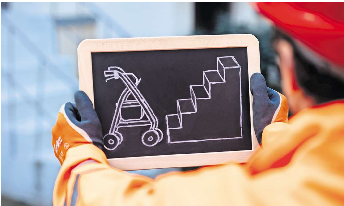
Wenn Rollator auf Treppe trifft: In Salzgitter fehlen viele seniorengerechte Wohnungen, schreibt das Pestel-Institut.