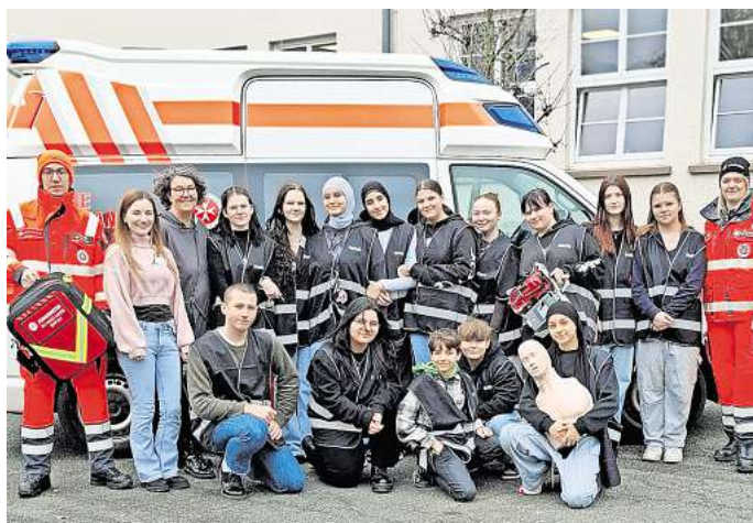
Arbeiten zusammen: Die Sanitäterinnen und Sanitäter der Dr.-Klaus-Schmidt-Hauptschule umringt von Vertreterinnen ihrer Schule und Ehrenamtlichen der Johanniter.

Auf der Suche nach Schulungsmaterial wendete sie sich an die Johanniter und bekam