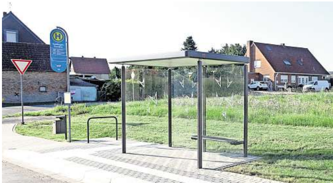
Das ist das Ziel: Jede Bushaltestelle in der Region sollte barrierefrei sein.