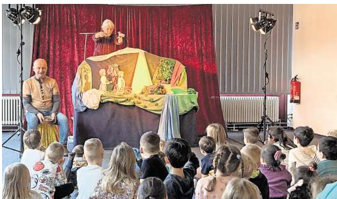
Wortstarkes Theater: Die Kindergartenkinder hatten Spaß mit der Märchenbühne beim Abschluss des Projektes in der Stadtbibliothek am Fredenberg.

Nachdem die Mädchen und Jungen zuvor an einem Tag ein