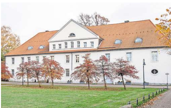
Hilft gegen den Stress und seine Folgen: Die VHS bietet im Herrenhaus in Salzgitter-Bad im Mai ein Mentaltraining zur Gesundheitsprävention an.

Die Teilnehmenden beschäftigen sich unter anderem mit