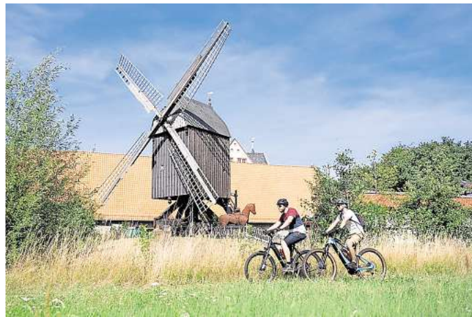
Kilometer sammeln für Salzgitter: Das „Stadtradeln“ 2025 startet am 15. Juni.

Prämiert werden außer dem fahrradaktivsten Ortschaftsteam auch das fahrradaktivste Jobteam (Firma, Verwaltung, Behörde, Berufsbildende Schule,