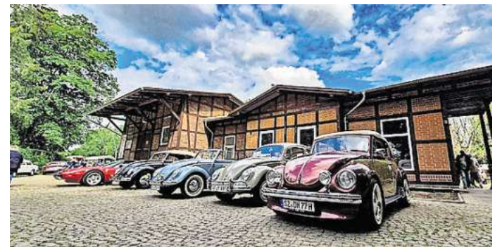
Schmucke Autos am Museumsbahnhof: Die Dampflok-Gemeinschaft lädt zum Oldtimertreffen ein.

In diesem Jahr ergänzt ein offizieller Termin das Treffen. Die „Wiedereröffnung“ des restaurierten Fahrkartenschalters im neuen Wartesaal durch Bürgermeister Alf Hesse und Vertreter des LEADER-Westharz Förderprogramms steht an. Durch Mittel aus diesem Fördertopf war es dem Verein in den vergangenen beiden Jahren möglich, grundlegende Sanierungen an der Gebäudesubstanz des Bahnhofs vorzunehmen.