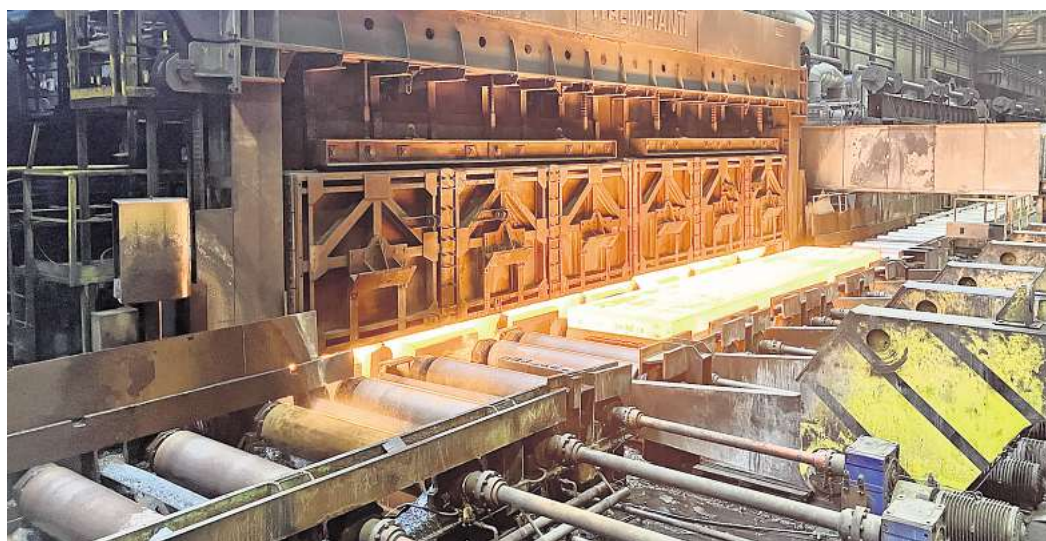
Zentrales Element bei der Stahlherstellung: In den Hubbalkenöfen in der Warmbreitbandstraße werden Brammen auf bis zu 1.300 Grad Celsius erhitzt.

jekt wird aufgrund der hohen Energieeffizienz durch die KfW gefördert. Wie hoch die Ausgabe und der Zuschuss genau sind, darüber hüllt sich der Konzern in Schweigen. Der Anschluss der Montage und Inbetriebnahme des neuen Hubbalkenofens ist für das Jahr 2028 vorgesehen.