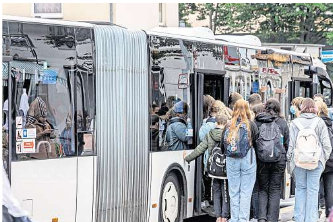
Monatsticket verlängert: Für 30 Euro können die Schülerinnen und Schüler im Gebiet des Regionalverbands mit Bus und Bahn fahren.

Diese 30-Euro-Karte sollte nach der Pilotphase durch ein landesweit gültiges Schülerticket ersetzt werden – davon ausgehend, dass dieses kommt wie im Koalitionsvertrag zwischen SPD und BÜNDNIS 90/DIE GRÜNEN für die 19. Wahlperiode des Niedersächsischen Landtages (2022-2027) vereinbart. Das stünde dann allen Schülerinnen und Schülern, Azubis und Freiwilligendienstleistenden für 29 Euro pro Monat zu. Die Einführung lässt auf sich warten.