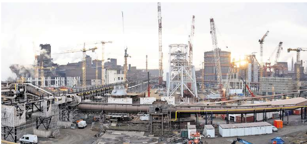
Kräne bevölkern das Stahlwerk: Die Salzgitter AG hat im ersten Quartal in einem schwierigen Umfeld einen kleinen Gewinn erzielt. Sie muss sparen und gleichzeitig investieren.

„Wir bestätigen unsere Jahresprognose“, schreibt der Konzern, der für 2025 einen Umsatz zwischen 9,5 und zehn Milliarden Euro erwartet. Das Vorsteuerergebnis sollen sich demnach irgendwo zwischen 100 Millionen Euro Verlust und 100 Millionen Gewinn einpendeln. Zudem wird eine „leicht über dem Vorjahresniveau liegende Rendite auf das eingesetzte Kapital“ angekündigt. Im ersten Quartal lieferten der Geschäftsbereich