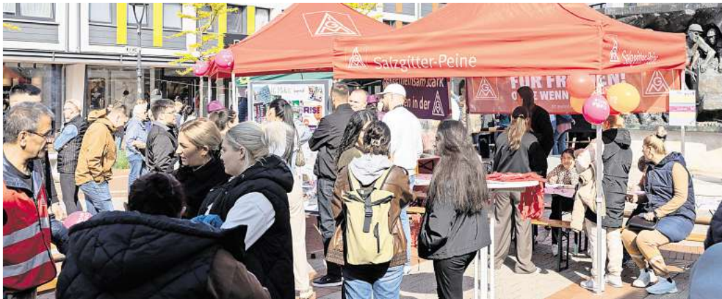
80 Jahre Frieden: Verschiedene Institutionen feiern den Tag der Befreiung in der Lebenstedter Innenstadt.

Von 16 bis 18 Uhr versammelten sich rund 500 Besucher und Besucherinnen rund um das Stadtmonument. An mehr als zehn Ständen präsentierten sich zivilgesellschaftliche Gruppen, kirchliche Initiativen, Gewerkschaften und politische Parteien mit Informations- und Mitmachangeboten. Das Programm bot unter anderem eine kreative Bastelstation, eine Fotoausstellung, einen virtuel-