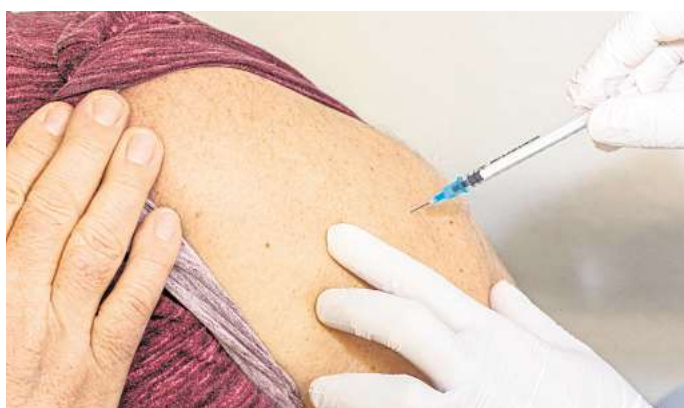
Impfen hilft: Salzgitter hatte laut AOK im Winter weitaus weniger Grippefälle als andere Kommunen.

Die Diagnosehäufigkeit war in den 45 Kreisen und kreisfreien Städten sehr unterschiedlich. Über den gesamten Zeitraum hatten die Stadt Salzgitter und