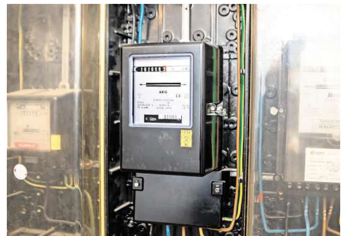
Tipps der WEVG: Wer umzieht, sollt bei Ein- und Auszug den Zählerstand dokumentieren und an den Stromversorger weiterleiten.

www.wevg.com weiterführende Informationen bereit. Bei Fragen ist der Kundenservice per E-Mail an kundenservice@wevg.com oder persönlich in den Kundencentern erreichbar.