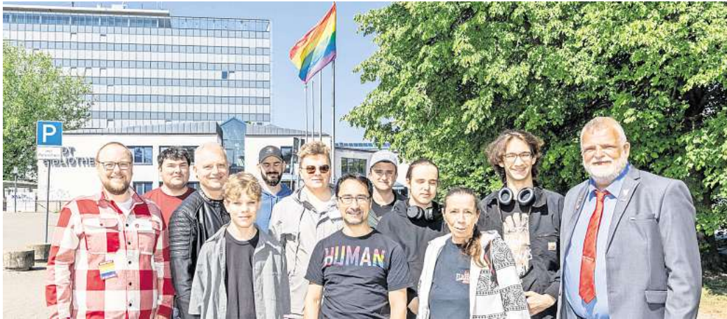
Freuen sich über die Regenbogenfahne vor dem Rathaus: Besucher und Besucherinnen am Internationalen Tag gegen Homo-, Bi-, Inter- und Transphobie in Salzgitter.