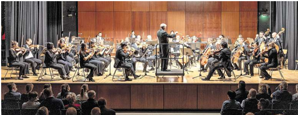
Bedankte sich mit zwei Zugaben für den Applaus: Das Göttinger Symphonieorchester spielt „Last Night of the Proms“ in der Aula.