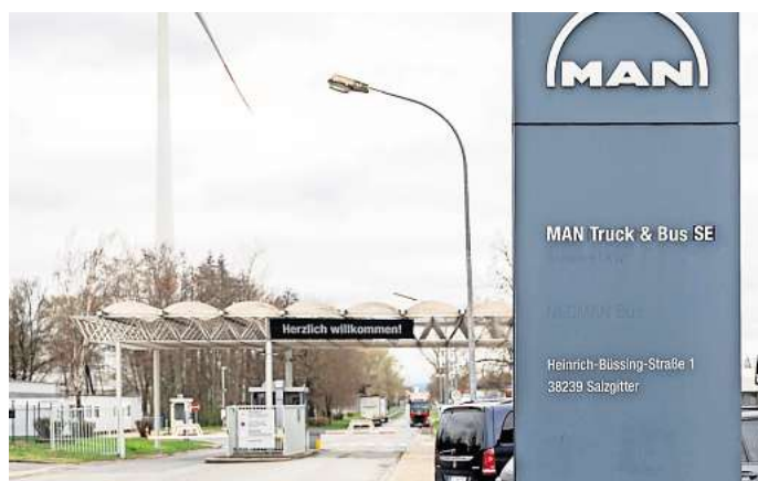
Mehr Platz für die E-Mobilität: MAN hat in Salzgitter eine neue Halle eingeweiht.