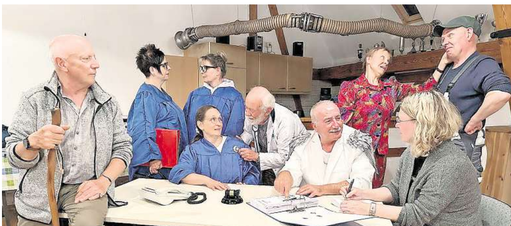
Die Proben laufen: Mitte Juni zeigt die Burgdorfer Bühne ihre neue Theaterkomödie.

Die Gäste können sich auf einen „himmlisch-höllischen Theaterabend“ freuen, heißt es in der Ankündigung. In der Komödie landet Malermeister Wilhelm Holme unverhofft im Jenseits – und muss sich dort mit einer Flut an bürokratischem Irrsinn herumschlagen. Ein untermotivierter Erzengel wirbt für das Himmelreich, während der Teufel am Rande eines Burn-