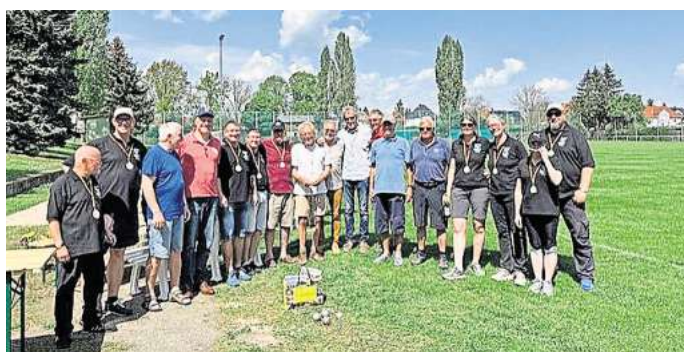
Premiere in Gotha: Eine Boulemannschaft der Kleinkunsthöhne beteiligen sich erstmals an dem Turnier.

Die Salzgitteraner hatten sich gleich zu Beginn mit den SV Eintracht Teams gemischt, um nach eigenen Worten dadurch „dem Leistungs- und Spaßfaktor ausgeglichen Rechnung zu tragen“.