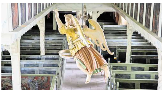
"Lass die Kirche im Dorf": Mit der Bedeutung St. Martins für Groß Elbe beschäftigen sich eine Ausstellung und ein Vortrag am 14. Juni.

Der gesamte Innenraum einschließlich der Emporen, des Gestühls und der Altar wurde bis 2002 weitestgehend wieder in seinen Zustand von damals versetzt. Heutzutage blicken die Besuche-