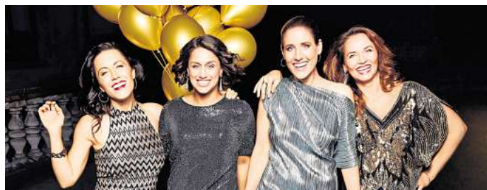
Konzert im Mühlengarten: Les Brunettes feiern am 25. Juli das 15-jährige Bestehen ihrer Gruppe beim Kultursommer in Salder.

Der Kultursommer Salzgitter legt nächsten Mittwoch im Mühlengarten in Salder los