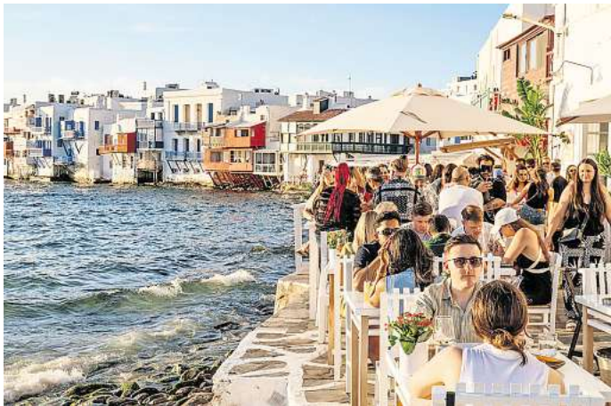
Der Massentourismus hat Mykonos fest im Griff.

117 Übernachtungen pro Kopf – in der südlichen Ägäis in Griechenland ist der Tourismus so intensiv wie in keiner anderen EU-Region. Das hat das Statistische Bundesamt jetzt unter Berufung auf Daten von Eurostat, dem Statistikamt der Europäischen Union, mitgeteilt. Die beliebte Ferienregion mit Inseln wie Santorin, Mykonos und Rhodos steht exemplarisch für eine Entwicklung, die vielerorts in Europa spürbar ist: Einheimische geraten angesichts des Mas-