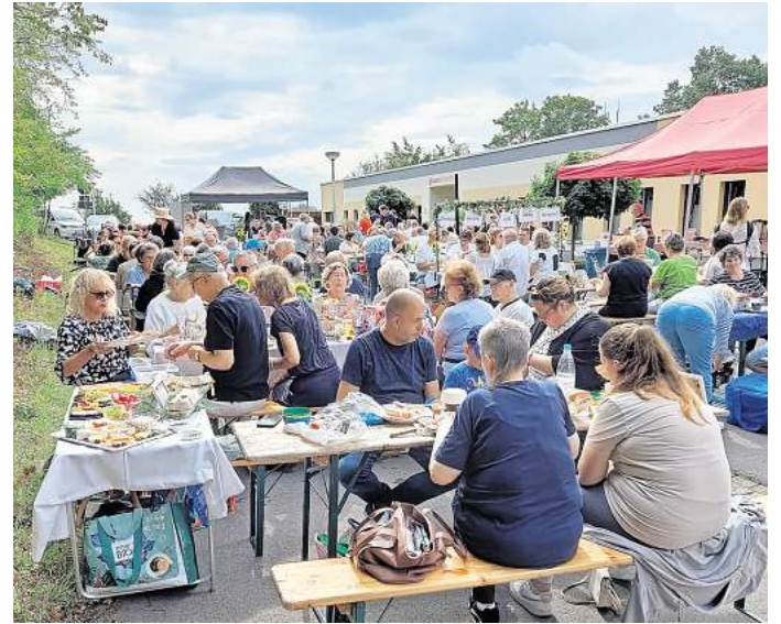
Frühstücken auf der Straße: Das Hospiz in Salzgitter-Bad hofft wieder auf viele volle Bänke und Tische wie beim Bürger Brunch 2024.