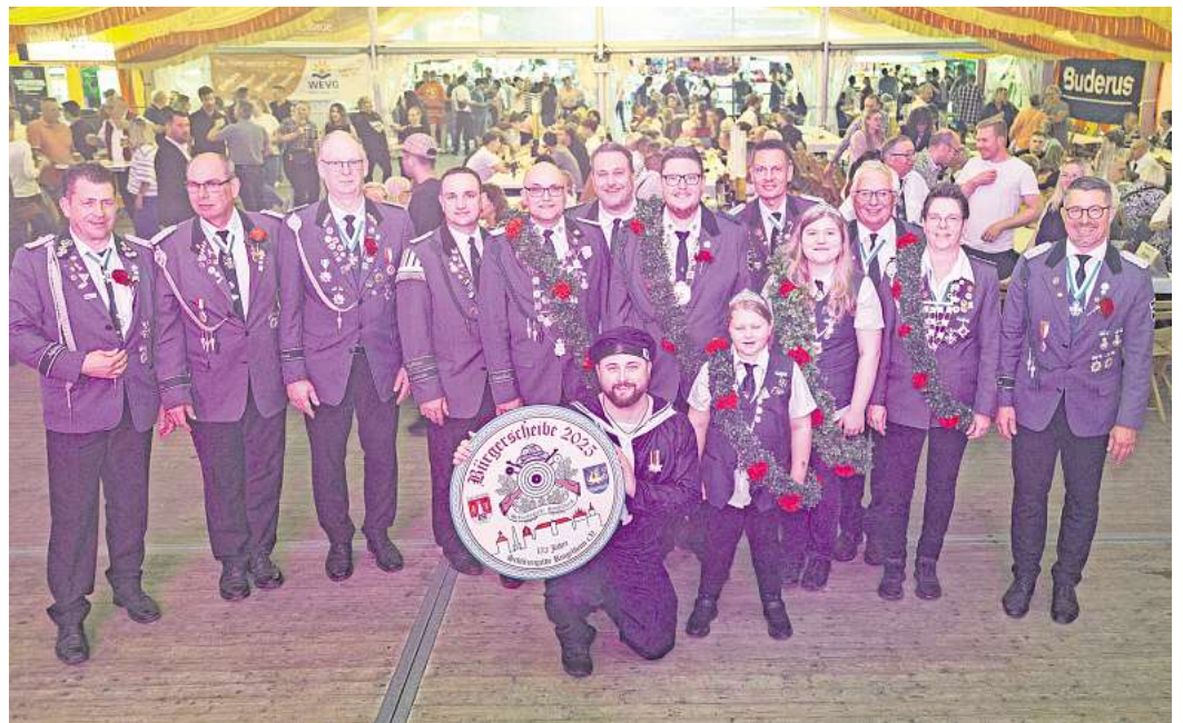
Traditioneller Höhepunkt: Im Zelt versammeln sich die Würdenträger des diesjährigen Ringelheimer Schützenfestes.