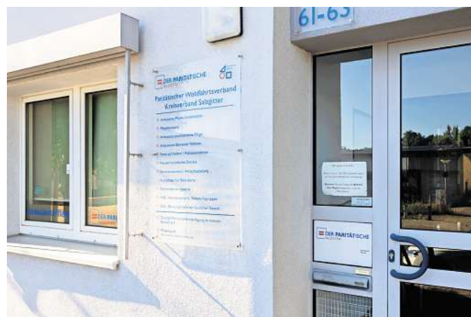
Treffpunkt für die neue Parkinson-Gruppe: Der Paritätische in Lebenstedt lädt Angehörige und Betroffene ein.