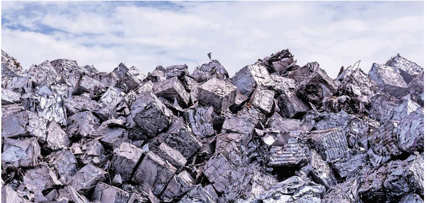
Aus Schrott wird Stahl: Die Salzgitter AG und Volvo Cars starten 2026 eine Kreislauf-Partnerschaft.