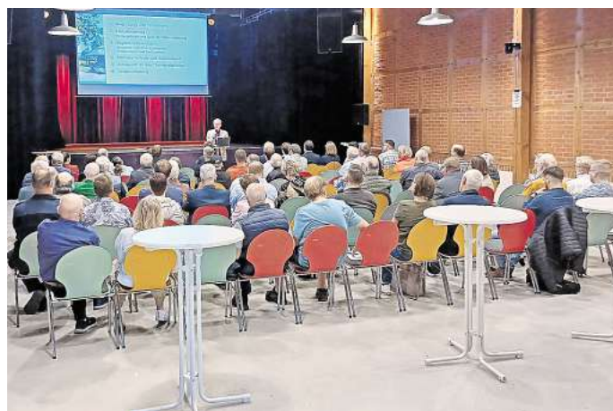
Termin in der Kulturscheune: Bürgerinnen und Bürger informieren sich über die Kommunale Wärmeplanung.

Die in der Wärmeplanung festgelegten Ziele und Maßnahmen dienen als Handlungsgrundlage für die langfristige Umstrukturierung der Wärmeversorgung im Stadtgebiet. Das von der Stadt beauftragte Büro d-fine stellte erste Ergebnisse der Bestands- und Potenzialanalyse zu Wärmebedarf, Wärmenachfrage und Wärmeversorgung vor. Als Beispiel diente ein Steckbrief für Lebenstedt.