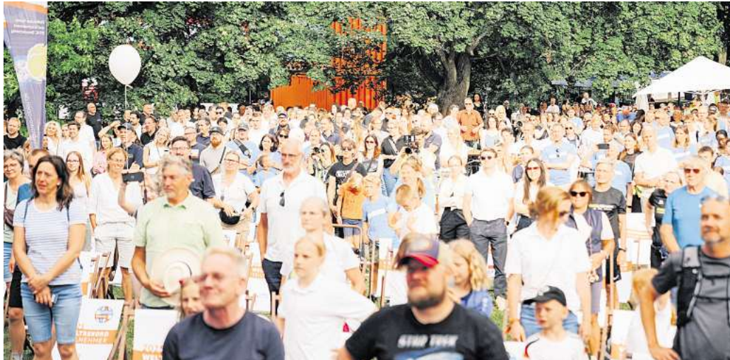
Unterwegs für die gute Sache: Mehr als 10.000 Teilnehmende und Gäste verwandelten den Braunschweiger Bürgerpark in eine riesige Charity-Arena.

Mit dem walk4help 2025 wurde das 20-jährigen Bestehens der United Kids Foundations, dem Kindernetzwerk der BRAWO GROUP, begangen. Bereits der erste walk4help 2019 hatte Geschichte geschrieben, die damals 52.482 zurückgelegten Charity-Kilometern waren Weltrekord, der weiterhin Bestand hat. Dieses Mal kamen insgesamt 49.846 Kilometer zusammen. „Das Hauptziel, nämlich Bewusstsein für planetare Gesundheit zu schaffen sowie für eine gesunde Zukunft der Kinder und Jugendlichen und diese bestmöglich mit einer großen Fördersumme zu unterstützen, wurde dafür mehr als erreicht“, so Jürgen Brinkmann, Vorstandsvorsitzender der Volksbank BRAWO / BRAWO GROUP und Initiator von United Kids Foundations und dem walk4help. Er nannte