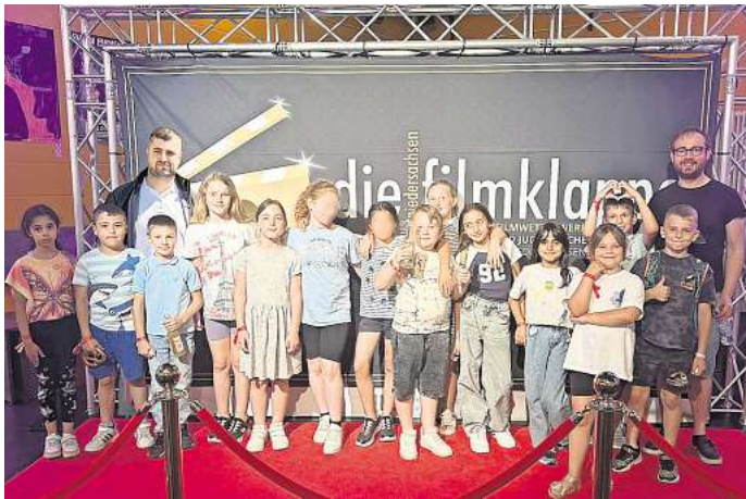
Siegerehrung in Hannover: Der Hort der AWO Kindertagesstätte am See gewann Platz eins bei der Niedersachsen-Filmklappe.

Der Film überzeugte die Jury mit einer fantasievollen Geschichte über Streit, Freundschaft und Versöhnung – liebevoll inszeniert, kreativ erzählt und von den Kindern selbst geplant, gespielt und umgesetzt. Bereits im Frühjahr hatte das Team die regionale Filmklappe Braunschweig gewonnen und sich damit für den landesweiten Wettbewerb qualifiziert. Die Jury lobte den Beitrag als „amüsant, berührend und hoffnungs-