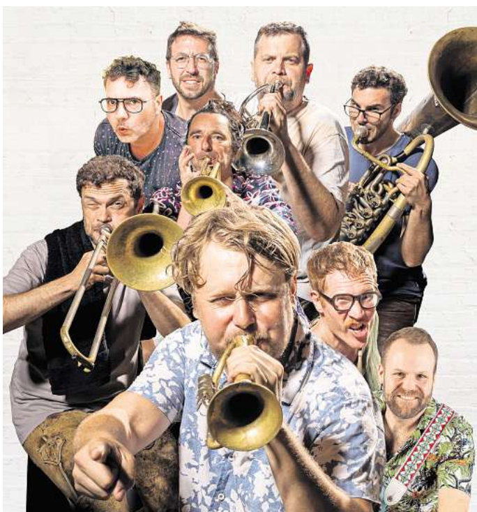
Eröffnet das zweite Wochenende mit einer Polka Party: Die Band LaBrassBanda aus Bayern spielt am 7. August im Schlosshof.

Weiter geht es am Donnerstag, 7. August, um 20 Uhr „LaBrassBanda“. Die innovativen Band Baus ayern begeistert mit einer einzigartigen Mischung aus Brass, Pop, Techno und Ska. Für „LaBrassBanda Polka Party“ haben sich die Musiker mit dem Rapper Roger Reklus zusammengetan, um eine spannende Fusion aus bayerischer Musik und modernem Hip-Hop zu kreieren. Als