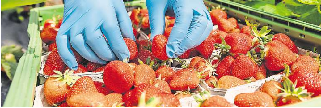
Süß und lecker: Die Arbeit, die hinter der Erdbeerernte steckt, ist allerdings hart, sagt die Agrar-Gewerkschaft IG BAU Braunschweig-Goslar. Sie fordert faire Löhne und anständige Unterkünfte.