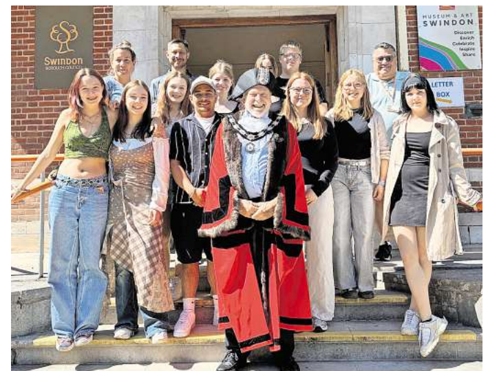
Besucher aus Salzgitter: Die Gruppe zu Gast in der Partnerstadt Swindon beim Swindon Borough Council