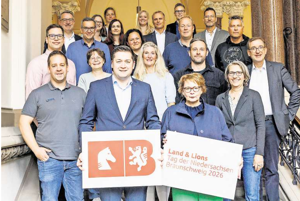
Der Tag der Niedersachsen 2026 kommt: So sieht der Programmbeirat aus, vorne mit den Schildern stehen Braunschweigs Oberbürgermeister Dr. Thorsten Kornblum und Innenministerin Daniela Behrens.

Bei der 39. Auflage des Tags der Niedersachsen verwandelt sich Braunschweig in eine Festtagsmeile, die sich weitläufig über mehrere Plätze und Straßenzüge in der Innenstadt und darüber hinaus erstreckt. Auf insgesamt zehn Themenmeilen und sieben Bühnen können sich die Gäste über Konzerte, Bühnenshows, Mitmachaktionen und kulinarische Angebote freuen. Im Fokus des Großereignisses stehen das Ehrenamt, die kulturelle Vielfalt und die regionalen Besonderheiten Niedersachsens – und die der Löwenstadt als Gastgeberin. Erwartet werden mehrere Hunderttausend Besucherinnen und Besucher aus Niedersachsen und den angrenzenden Bundesländern. In Kooperation mit der Stadt übernimmt das Stadtmarketing die Rolle der Veranstalterin für die Großveranstaltung.