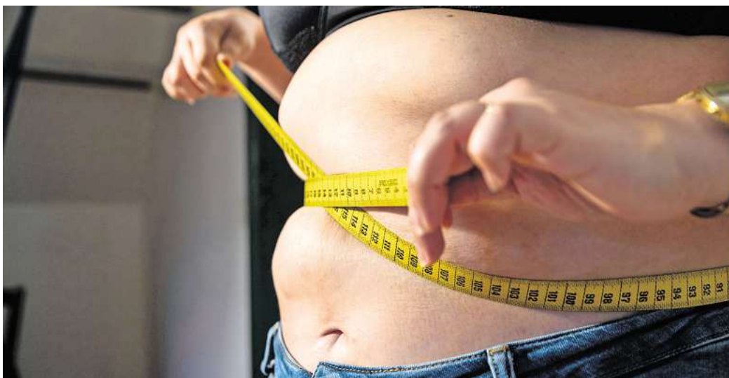
Viele Diäten versprechen schnelle Erfolge: Wer mehrere Kilos pro Woche abnimmt, verliert meist Wasser oder Muskelmasse statt Körperfett, und riskiert den Jo-Jo-Effekt

Die Ernährungsumstellung sollte am besten von Bewegung begleitet werden, denn dadurch verbraucht der Körper Energie. „Für den Einstieg empfiehlt sich zum Beispiel eine halbe Stunde Spazieren, die nach und nach verlängert oder durch Radfahren und Schwimmen ergänzt werden könnte“, so Ernährungsexpertin Ina Bockholt von der Stiftung Warentest. (DPA)