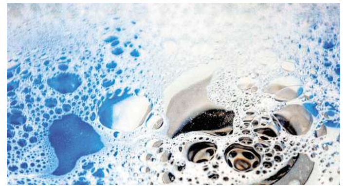
Hausmittel wie Natron, Essig und heißes Wasser helfen, leichte Verstopfungen im Abfluss zu beseitigen und sind eine umweltfreundliche Alternative zu chemischen Reinigern.

Gut zu wissen: Abflussverstopfungen beugt man am besten mit Abflusssieben vor. Sie verhindern, dass lange Haare oder Essensreste beim Spülen in die Abwasserleitungen gelangen. Die Verbrauchzentrale NRW rät zudem, einmal wöchentlich kochendes Wasser in die Abflüsse von Bad und Küche zu kippen. Dies hilft, Fett- und Seifenreste zu lösen und wegzuspülen. (DPA)