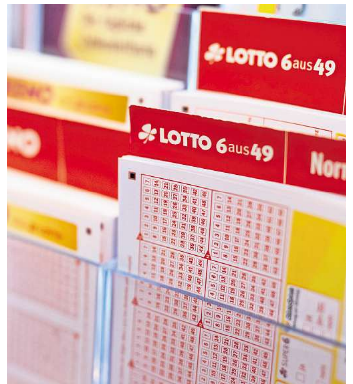
Im Lotto gewonnen? Dann muss der Gewinn nicht versteuert werden.

Und wer von dem Millionengewinn etwa eine Immobilie