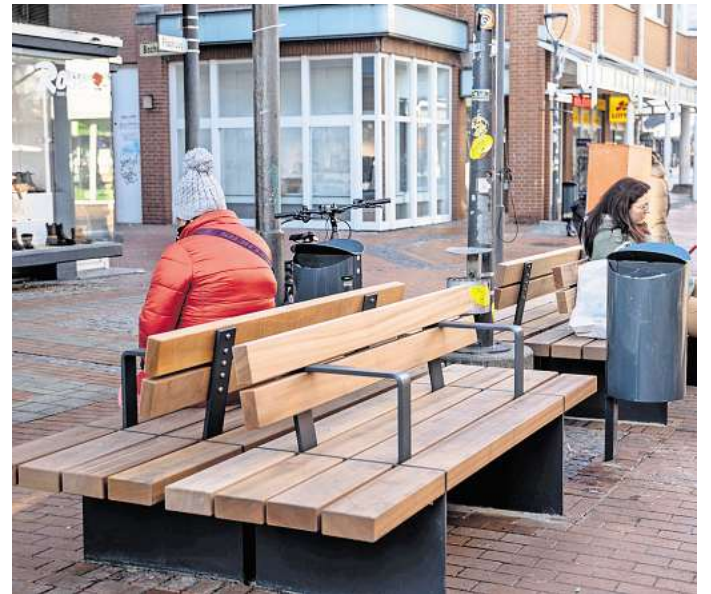
Eine Kombination aus Holz und grauen Stahlelementen: In Lebenstedt wurden die ersten neuen Sitzbänke und Mülleimer aufgestellt.

„Die Salzgitteranerinnen und Salzgitteraner profitieren aber nicht nur von der optischen Aufwertung des Mobiliars, sondern auch von der verbesserten Funktionalität: Um mobilitätseingeschränkten Menschen das Aufstehen und Hinsetzen zu erleichtern, werden Sitz- und Rundbänke