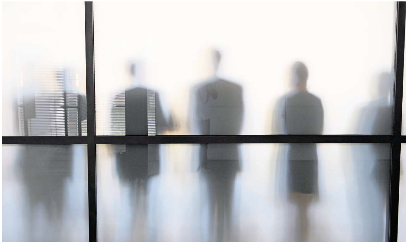
Kleine Notlügen im Job sind alltäglich: Oft geht es darum, sich selbst oder andere zu schützen.

Besonders Führungskräften kommt hier eine besondere Rolle zu. Dem Kommunikationsberater und Buch-Autor Branko Woischwill zufolge gilt: „Je größer die Verantwortung und je mehr Macht, desto weniger