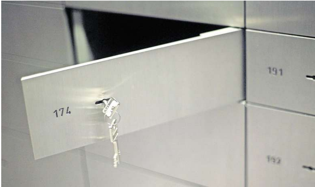
Die Versicherungssumme für Schließfachinhalte ist oft begrenzt: Ein Blick in die Vertragsunterlagen schafft Klarheit über den Schutzzumfang.