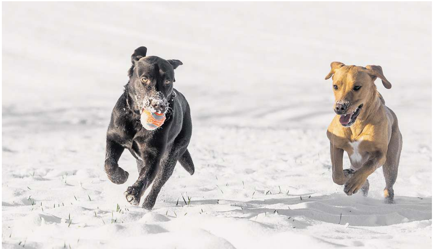
Ein erhöhter Energiebedarf sorgt dafür, dass viele Tiere im Winter mehr Futter benötigen: Hochwertige Proteine und Fette unterstützen die Gesundheit.

Der Zentralverband der Heimtierbranche (ZZF) empfiehlt zudem, im Winter die Ernährung etwas anzupassen. Hunde verbrauchen jetzt mehr Energie, um ihre Körpertemperatur aufrechtzuerhalten. Das Futter sollte daher reich an gut verdaulichen Proteinen und hochwertigen Fetten sein. Und: Auch an kalten Tagen brauchen