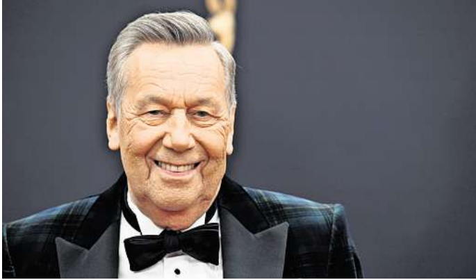
ARCHIV - Roland Kaiser kommt zur 77. Bambi-Verleihung in den Bavaria Filmstudios über den roten Teppich.