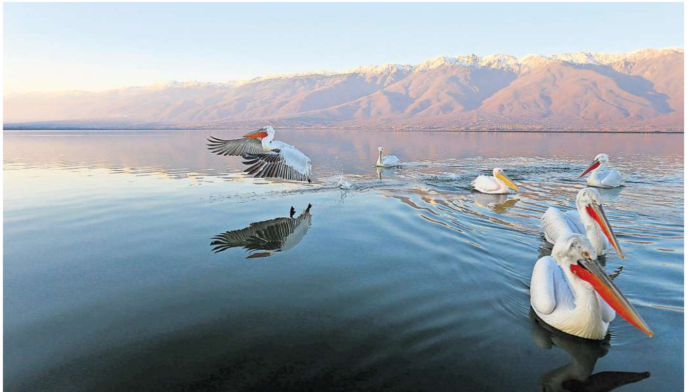
Der Kerkini-See in Griechenland ist ein Paradies für Naturfans.

Der See ist nicht nur vom Ufer aus zu erkunden, auch Kanufahrten sind möglich. Alternativ