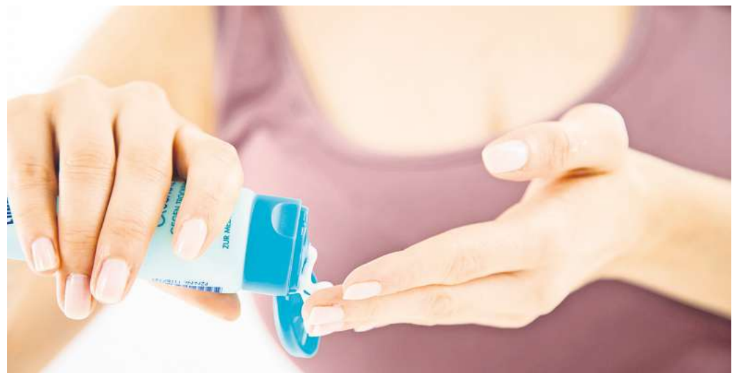
Kalte Winterluft draußen und trockene Heizungsluft drinnen belasten die Haut: Fettreiche Cremes schützen besonders gut vor dem Austrocknen.

Schließlich soll die Haut nicht zusätzlich gereizt werden. (DPA)