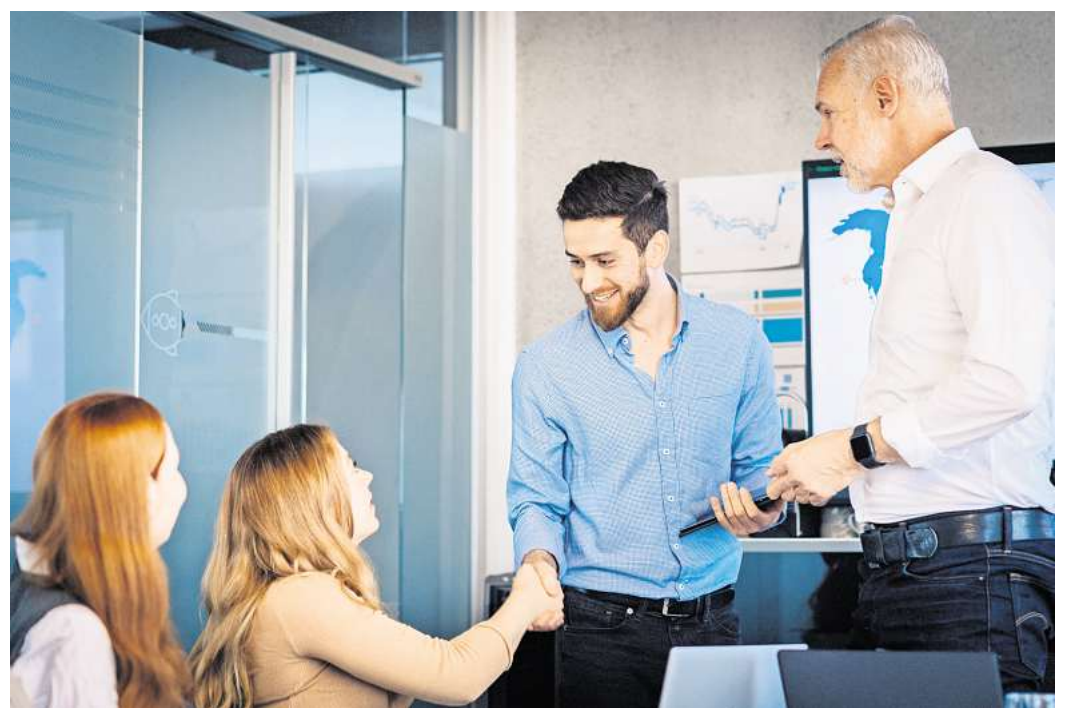
Neuer Job, neue Anforderungen: Weiterbildungen werden immer wichtiger.

Seien Sie grundsätzlich bereit für neue Wege - ob in einer anderen Branche oder einer neuen Rolle im alten Unternehmen. (DPA)