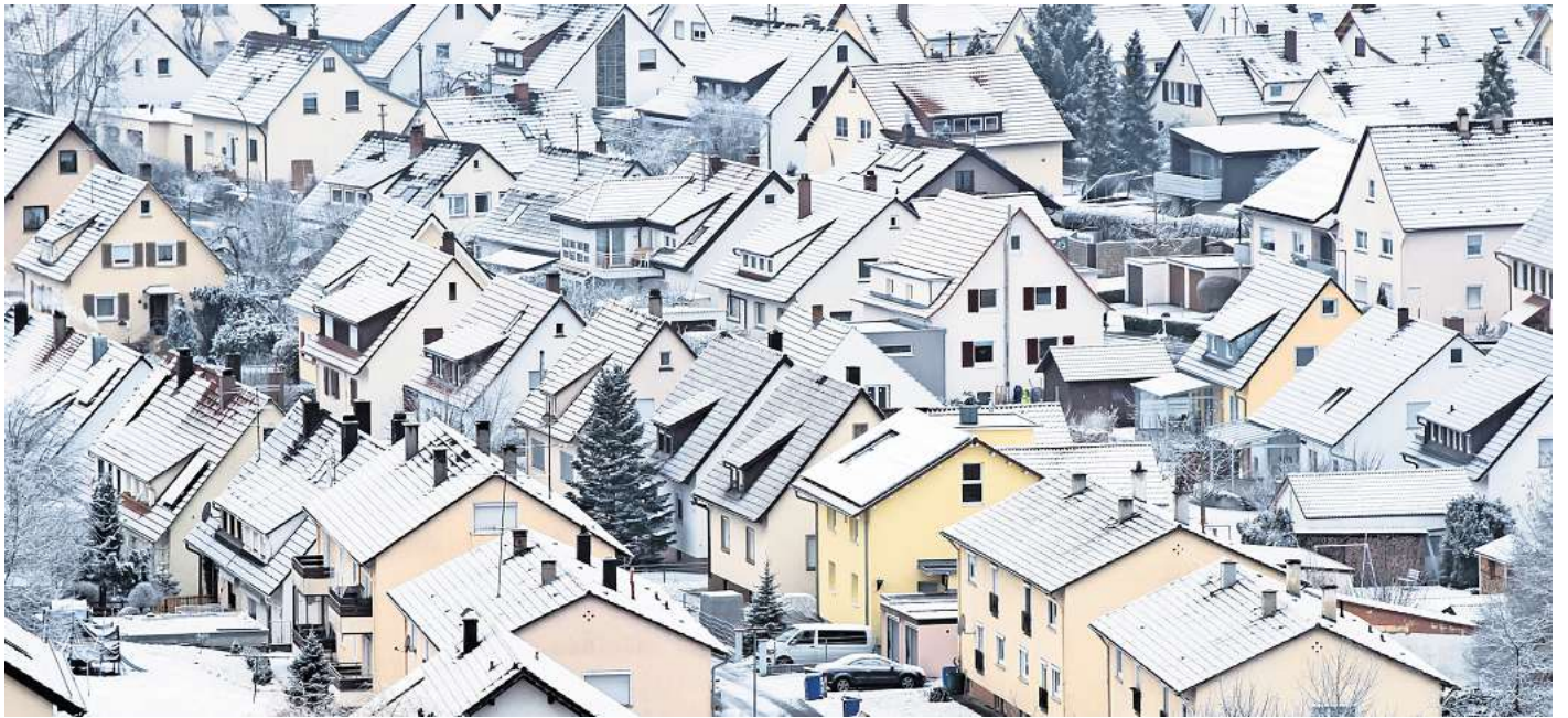
Winterliche Hauspflege schützt vor Schäden: Regelmäßiges Schneeräumen, Entfernen von Eiszapfen und das Sichern von Wasserleitungen beugen teuren Winterproblemen vor.

Damit sie keinen Schaden nehmen, sollten ungenutzte Lei-