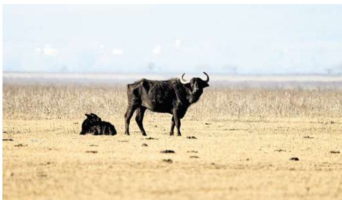
Die Wasserbüffel sind mittlerweile wieder zahlreich am Kerkini-See vertreten.

Der nächstgelegene Flughafen ist der Flughafen Thessaloniki (SKG), der etwa eine Stunde südlich des Kerkini-Sees liegt. Von dort aus kannst du die Region mit dem Auto oder Taxi erreichen. Für Abenteuerlustige, die Griechenland auf eigene Faust entdecken möchten, bietet sich die Fahrt mit dem Mietwagen an. Die gut ausgebauten Straßen und Autobahnen verbinden Thessaloniki mit vielen anderen Städten und Sehenswürdigkeiten in Makedonien.