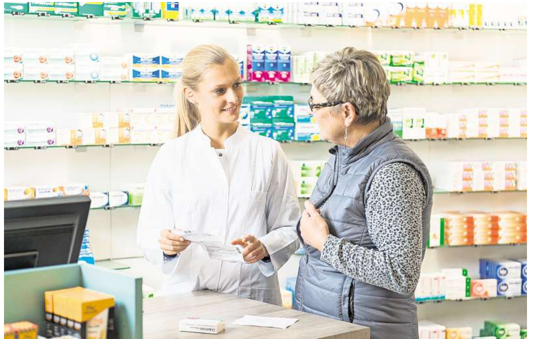
Zuzahlungsbefreiungen für medizinische Leistungen gelten immer nur für ein Kalenderjahr: Sie müssen jedes Jahr neu beantragt werden, auch wenn eine Befreiung in der Apotheke gespeichert war.

Übrigens: Zu Beginn des neuen Jahres bietet sich laut dem