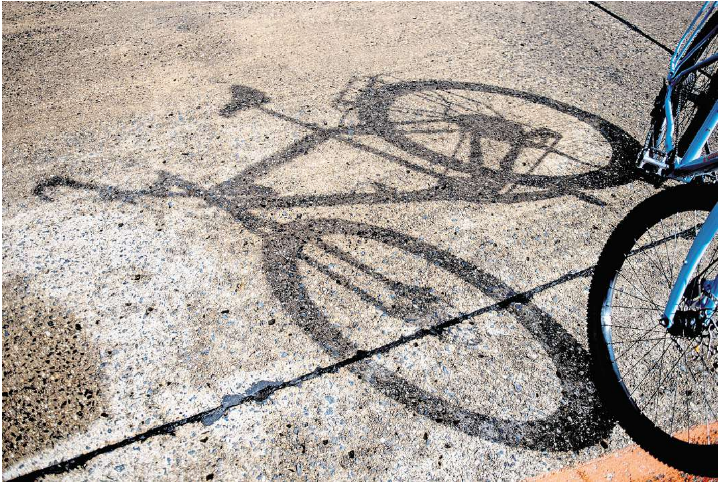
Obacht! Wer unaufmerksam mit dem Fahrrad fährt, riskiert einen Sturz.

Sie meinte, dass die Gestaltung des betreffenden Bereichs mit nahezu gleichfarbigem Pflaster von Fahrbahn und Gehweg gefährlich wäre. So hätten sich dort bereits zuvor Unfälle ereignet. Und später hätte