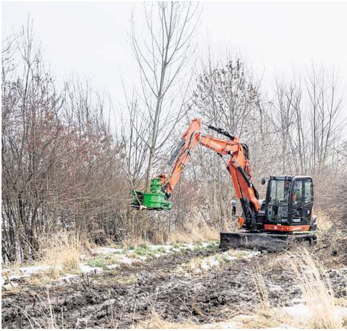
Einsatz an der Fuhse: Mit einem Bagger lässt die Gartenbaufirma die Gehölze entfernen.

Diese Förderung unterstützt Vorhaben, die einer gemeinnützigen und/oder im öffentlichen Interesse stehenden Investition zur Verbesserung des Umwelt- und Gewässerschutzes, dienen. Mit der Renaturierung werden Gewässer naturnah entwickelt. Dadurch verbessert sich der Zustand des Flusses, gleichzeitig wird die Vielfalt der Arten gefördert.