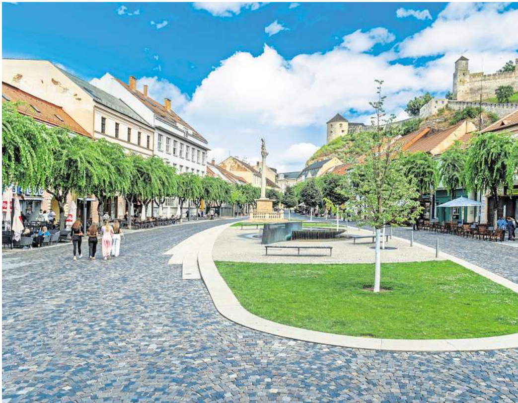
Das Herz der Altstadt ist der zentrale Platz Mierové námestie.

Neben dem Burgbesuch ist ein Bummel durch die Altstadt eins der schönsten Erlebnisse in Trenčín. Ein guter Startpunkt ist der Mestská-veža-Stadtturm, der das südliche Tor zur Altstadt