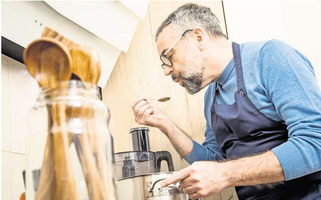
Etwas Einfaches, Schnelles mit wenigen Zutaten zu kochen, steigert die Motivation.

2. Um keine Ausreden zu haben, selbst frisch zu kochen, muss man vorbereitet sein.