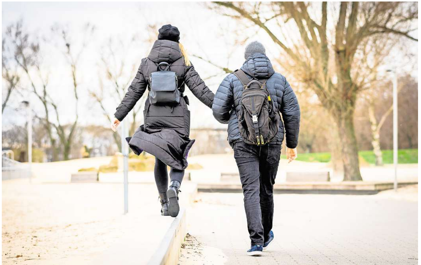
Spazieren gehen ist ein natürlicher Stimmungsaufheller – auch an trüben Tagen.