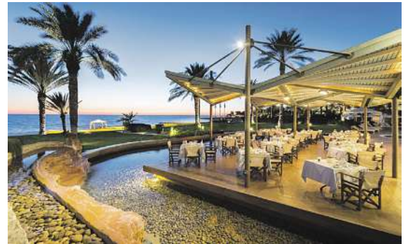
Traumhafte Hotels, wie hier das 4,5* Athena Beach auf Zypern, stehen in allen Zielen zur Auswahl.

Neben Madeira und Zypern geht es ab Braunschweig im Frühjahr/Sommer 2026 auch nach Rom, Barcelona, an die Amalfiküste, nach Ischia, Sizilien, Sardinien, Malta, auf die Liparischen Inseln und nach Chalkidiki. In allen Zielen herrschen zum Reisezeitraum hervorragende klimatische Bedingungen. Überall hat man die Wahl aus einem riesigen Hotelportfolio. Ausflüge und Erlebnisse sind auf Wunsch ebenfalls zubuchbar. Rom, Malta und Barcelona werden auch in den Osterferien angefliegen.