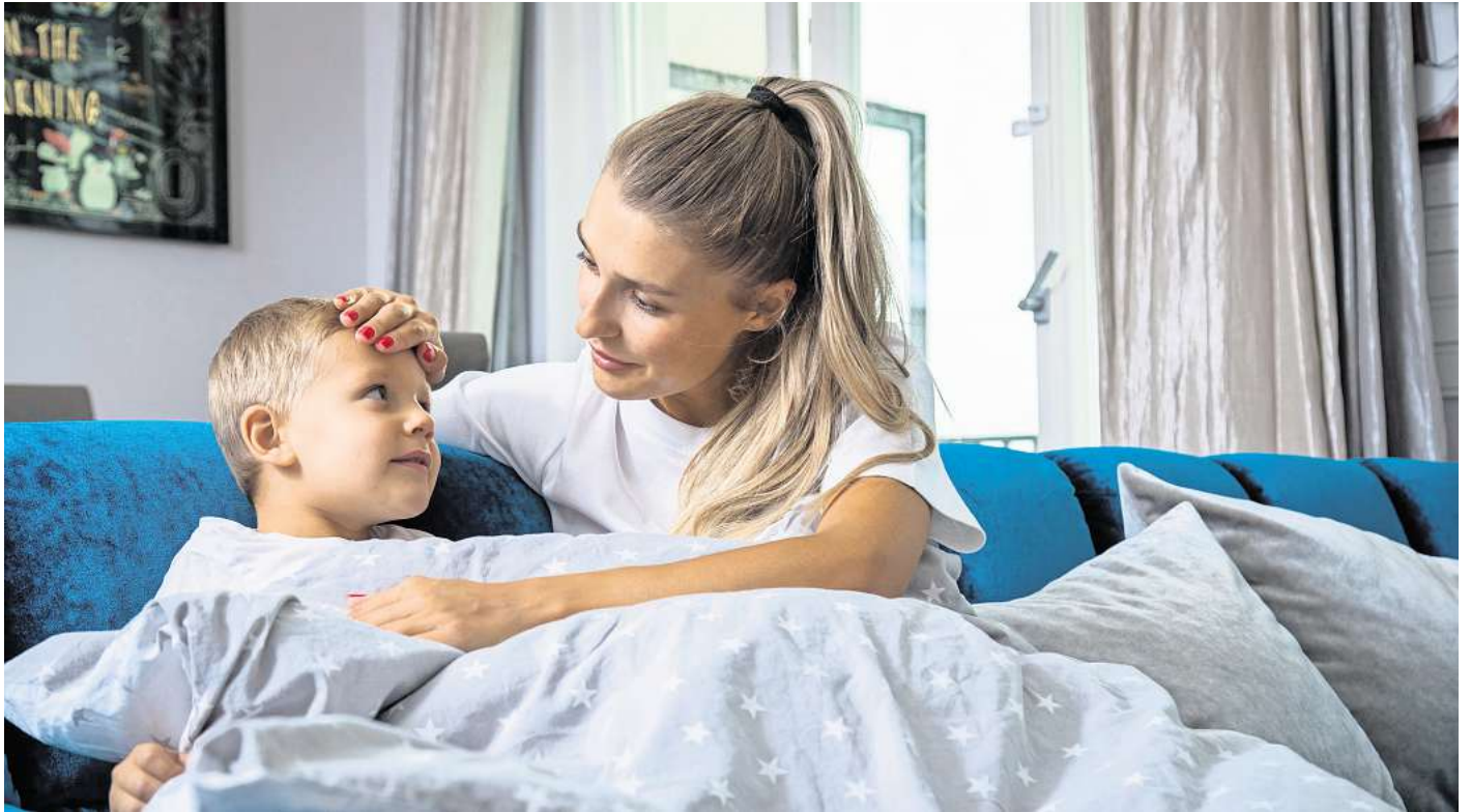
Echte Grippe oder nur grippaler Infekt? Für Eltern ist das oft nicht einfach herauszufinden.

Damit ansonsten gesunde Kinder bei einer Influenza wieder fit werden, genügen „Kinder- & Jugendärzte im Netz“ zufolge in der Regel einige Tage Bettruhe. Eltern können ihren Kindern bei Bedarf schmerzlindernde und fiebersenkende Mittel verabreichen, um das Allgemeinbefinden zu bessern - am besten in Rücksprache mit der