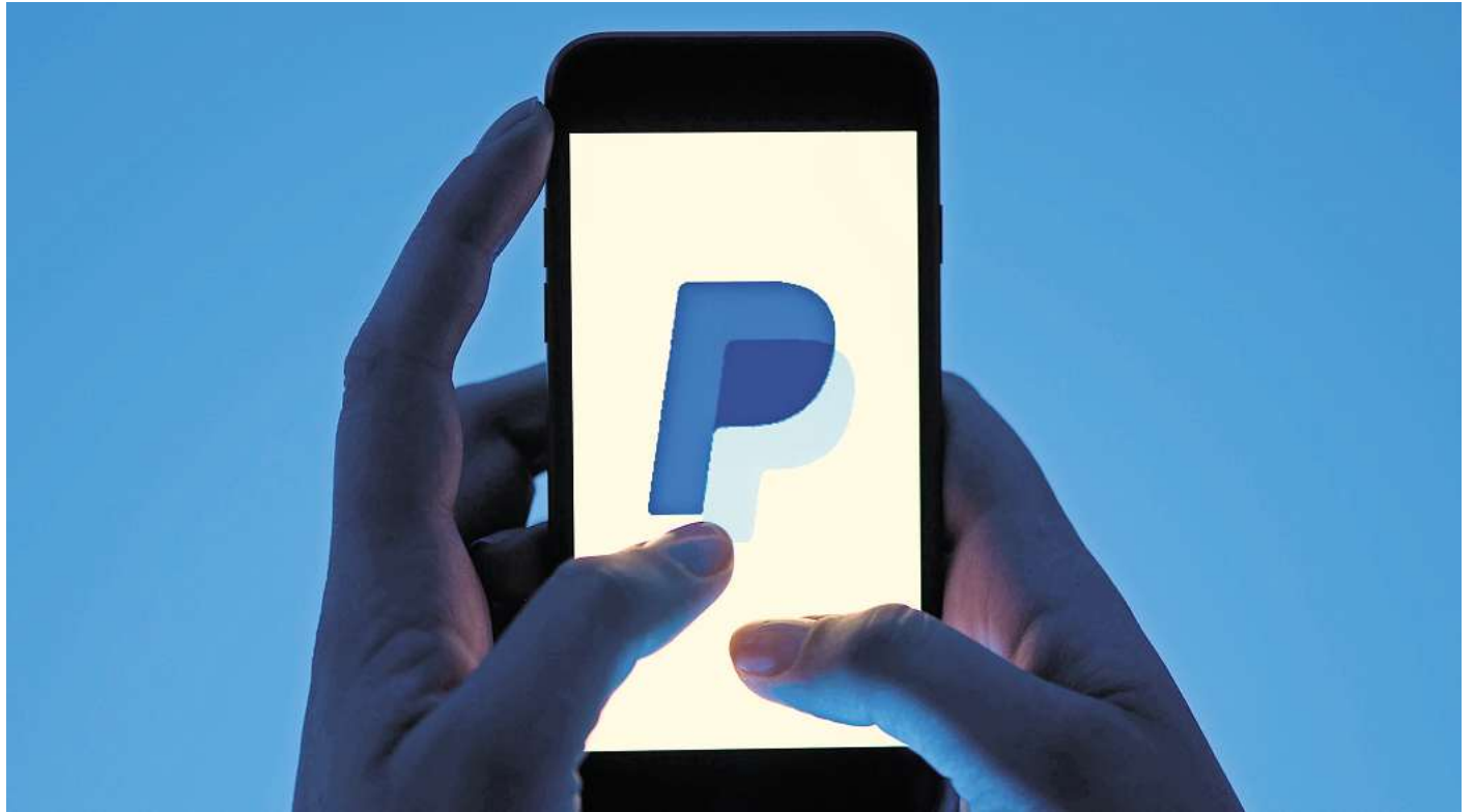
Wer mehr Privatsphäre möchte, sollte die Datenschutzeinstellungen seiner Zahlungsdienste regelmäßig überprüfen.

Achtung: Ein schwarz hinterlegter Schieber heißt ja, ein grau hinterlegter Schieber bedeutet nein. Nur wenn beide Regler grau sind, hat man den Unternehmen und seinen Partner das Werbe-Einverständnis komplett entzogen. (DPA)