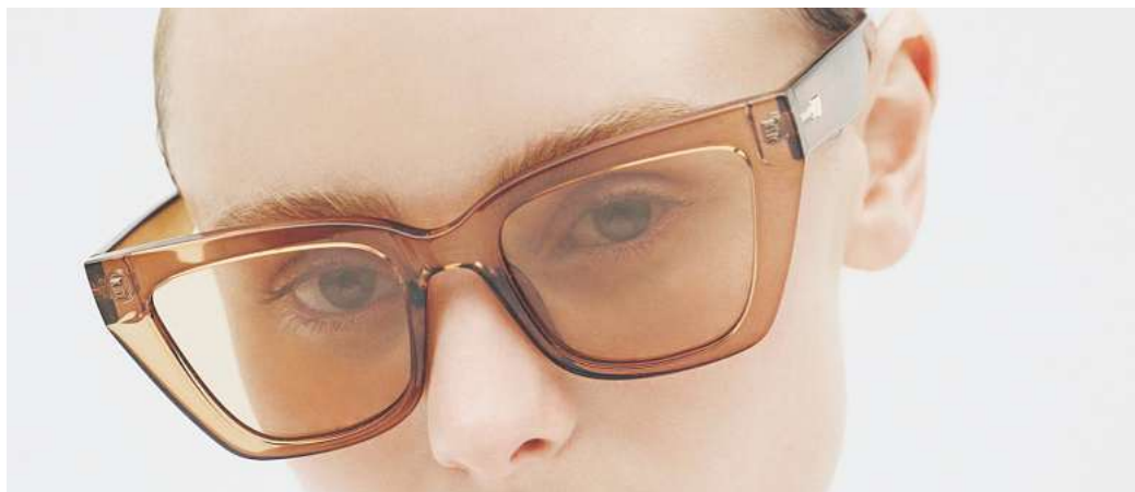
Jetzt im Trend: Brillengestelle, die Durchblicke erlauben. Hier zu sehen: Brille «Le Coeur» von Le Specs.

Und: Brillen mit plastischen Formen. Vor allem markante Oberlinien sind laut KGS zu sehen und Fassungen, bei denen