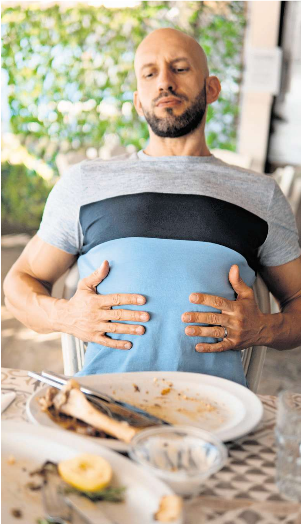
Etwa jeder Zweite erlebt regelmäßig eine lähmende Müdigkeit nach dem Essen.

Am weitverbreitetsten ist unter Fachleuten die Ansicht, dass die innere Uhr beim Mittagstief eine Rolle spielt. Demnach ist das „Suppenkoma“ ein natürliches Tief, das in der Mittagszeit auftritt – unabhängig davon, was man gegessen hat. Es könnte sogar ein bis heute be-