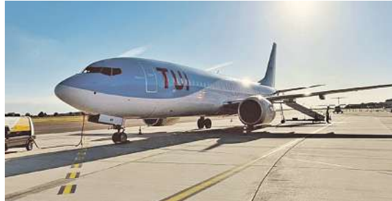
Fliegen ab Braunschweig - exklusiv bei momento by DER SCHMIDT

Die Nachfrage nach „Fliegen ab Braunschweig“ ist riesig. Schon ab € 599,- gibt es Angebote in die Sonne. Mit dem „Boutique VIP Erlebnis“ ab dem neuen Passagierterminal. Den Katalog, weitere Informationen und Buchungsmöglichkeit dieser exklusiven Angebote unter www.fliegen-ab-braunschweig.de , in den FIRST Reisebüro Schmidt und weiteren Reisebüros der Region oder unter der kostenfreien Buchungshotline T. 08 00 / 38 300 38 (Mo-Fr. 9 – 18, Sa. 9 – 13 Uhr).