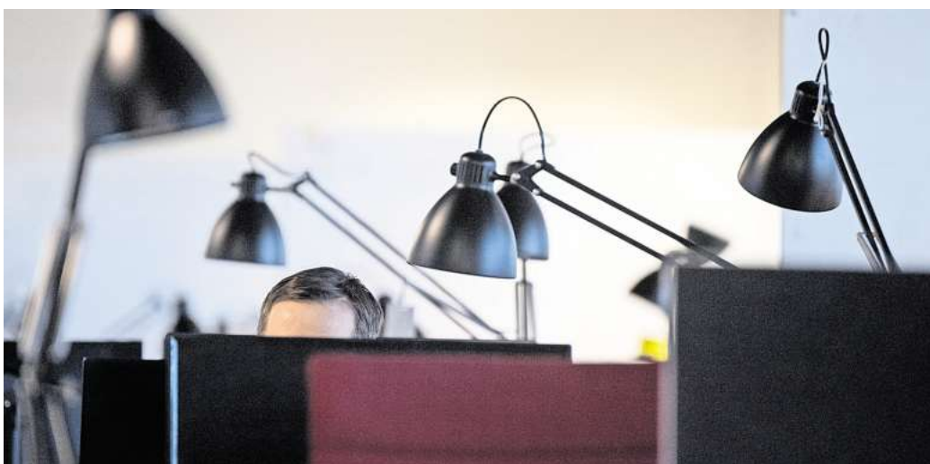
Bei überwiegend sitzender Tätigkeit sollte die Raumtemperatur bei 20 Grad Celsius liegen.