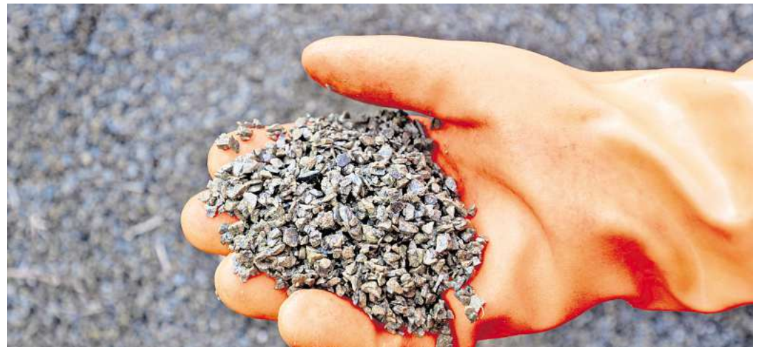
Granulat ist nur eine Option: Die Auswahl an Streumitteln ist groß, wenn man glatte Gehwege streuen will.

„Befindet sich in der Nähe ein Sägewerk oder eine Tischlerei, kann man dort nachfragen, ob etwa Hobellocken oder Sägespäne