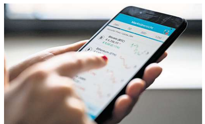
Wer in das hochspekulative Geschäft mit den digitalen Währungen einsteigen will, sollte wissen: Das ist nicht ohne Risiken.

Ist die Entscheidung für diese Anlageklasse gefallen, sollten Anlegerinnen und Anleger laut Finanztip darauf achten, Investitionen nicht über ihr herkömmliches Wertpapierdepot zu tätigen - auch wenn das zum Teil möglich wäre. Oft könnten Bitcoins nicht auf andere Wallets übertragen werden, womit Sie an den Anbieter gebunden wären. Teils wären auch die Kosten hoch und das Leistungsspektrum gering. Besser: auf