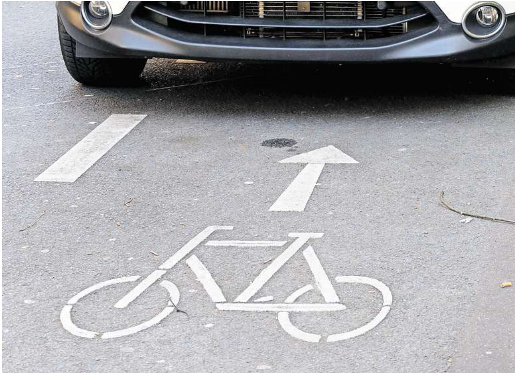
Verkehrswidrig geparkt: Wer beim Hochladen von Beweisfotos den Datenschutz verletzt, kann selbst belangt werden.

Das besagte Foto stand etwa einhalb Jahre auf der Platt-