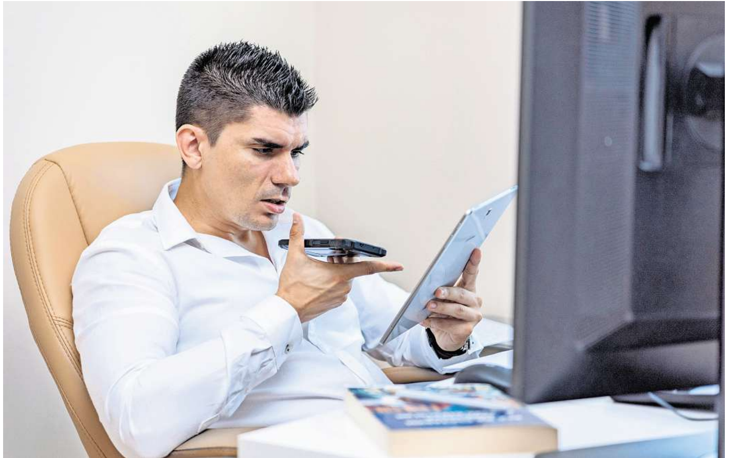
Wer viele Dinge auf einmal managen und wahrnehmen muss, überfordert sein Gehirn.