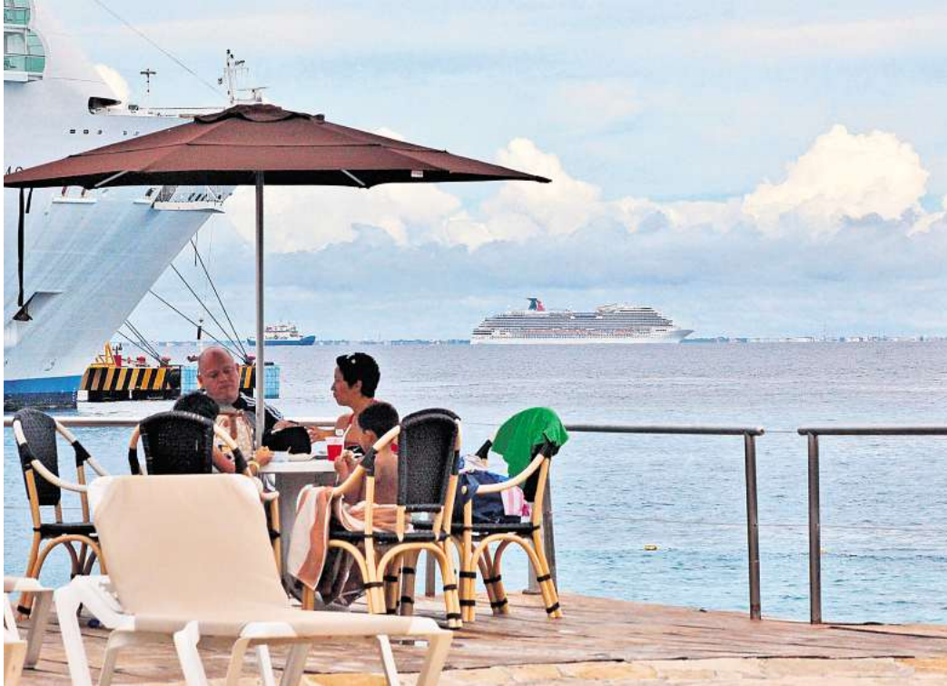
Kreuzfahrtpassagiere aufgepasst: Seit Januar 2026 sind Einfuhr und Verkauf von Vapes und E-Zigaretten in Mexiko verboten, auch für Touristen.