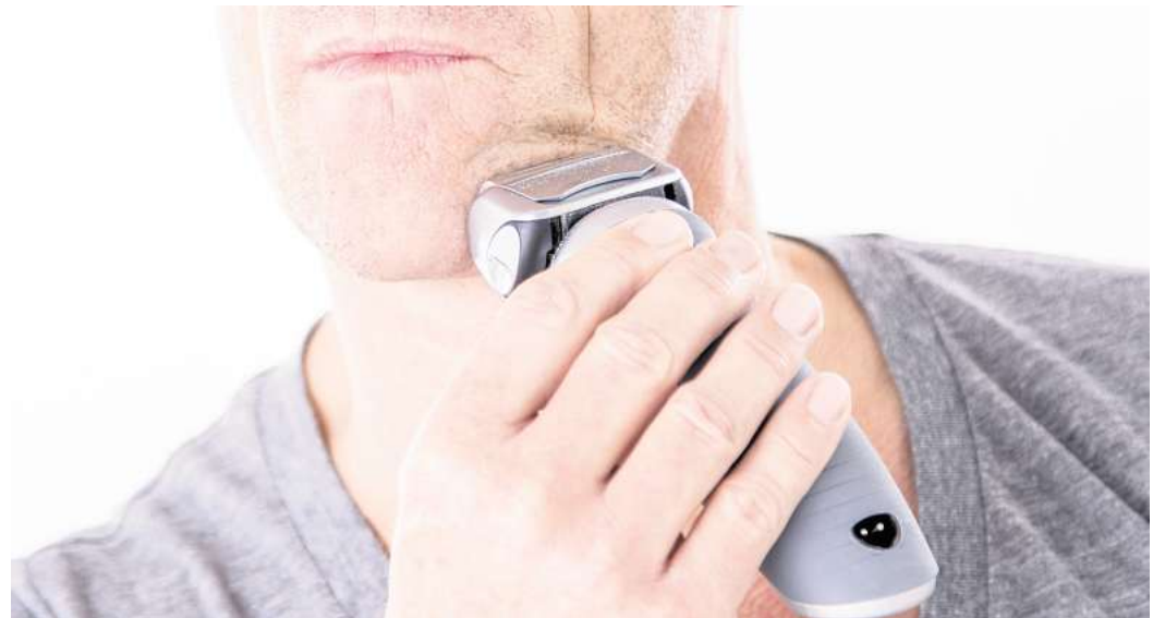
Verschiedene Rasierertypen bieten individuelle Lösungen: Ergonomische Griffe und sanfte Scherköpfe erhöhen den Komfort und beugen Hautirritationen vor.

Wer eine Vorauswahl getroffen hat, kann auf Details achten - etwa: