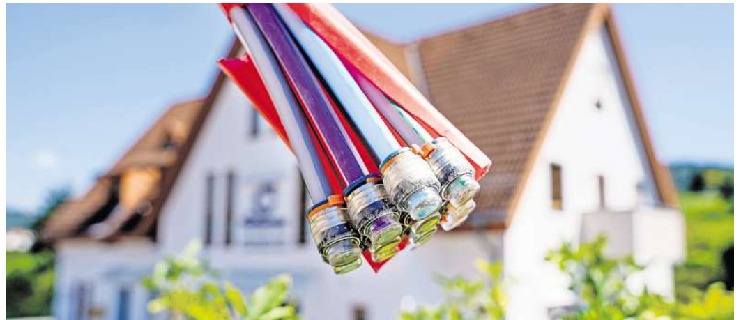
Sparpotential: Buchen Eigentümer beim ausbauenden Anbieter für Glasfaser einen Zweijahres-Vertrag dazu, bekommen sie den Anschluss in der Regel kostenlos.