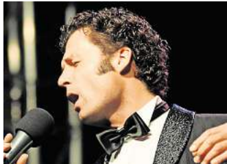
Text zum Bild

Karten gibt es im Vorverkauf für zehn Euro direkt in der Stadtbibliothek Lebenstedt und Salzgitter-Bad (Abendkasse zwölf Euro). Mehr Informationen unter Tel. (05341) 839-3434 oder per E-Mail an stadtbibliothek@stadt.salzgitter.de .