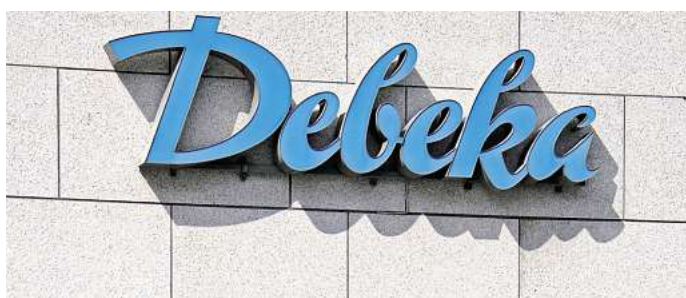
Vorzeitige Kündigungen von Lebens- und Rentenversicherungen können hohe Stornokosten verursachen: Die Debeka steht wegen intransparenter Abzüge in der Kritik.

Ein Risiko besteht nicht, Prozesskosten fallen für Angemeldete selbst im Falle einer juristischen Niederlage nicht an. Neben der Aussicht auf eine mögliche Rückzahlung hat der Anschluss an die Sammelklage noch einen weiteren Vorteil: Er hemmt die Verjährung der möglichen Ansprüche. Das kann laut den Verbraucherschützern auch für all jene wichtig sein, die eine Kündigung erst noch beabsichtigen. (DPA)