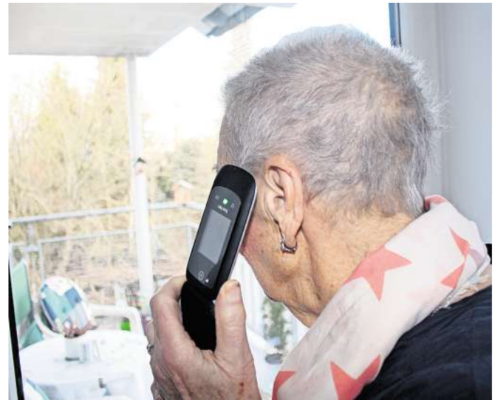
Vorsicht bei unbekanntem Anrufern: Die Polizei warnt vor Betrugs- maschen am Telefon.

Wer unberechtigte Abbuchungen feststellt, sollte umgehend die Bank zu informieren und unberechtigte Summen immer zurückbuchen lassen. Betroffene sollten das Abonnement immer schriftlich kündi-