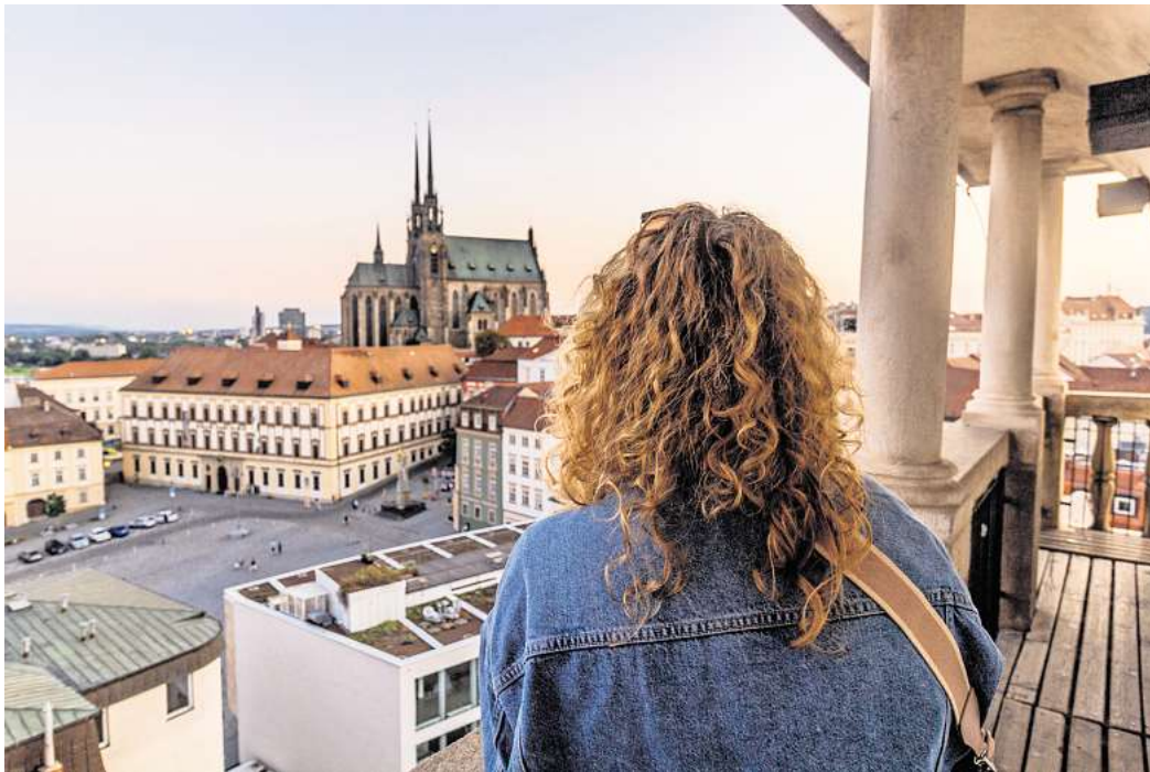
Vom Turm des Alten Rathauses aus hat man den besten Blick auf die Kathedrale St. Peter und Paul.

Um 11 Uhr läuten auch die Glocken von St. Peter und Paul. Die Kathedrale aus dem zwölften Jahrhundert, die als Wahrzeichen der Stadt gilt, wurde im Lauf der Zeit immer wieder umgebaut und bekam ihr neugotisches Aussehen erst im 19. Jahrhundert. Dass die Uhr schon vor Mittag schlägt, geht auf eine Begebenheit aus dem 17. Jahrhun-