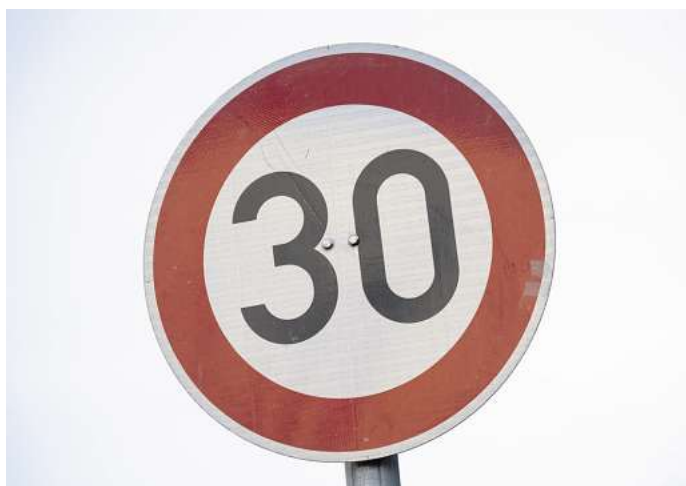
Zu schnell und geblitzt? Aber nicht immer ist Vorsatz im Spiel.

laubt. Zudem wurde das zugelassene Tempo dreimal ausgeschildert.