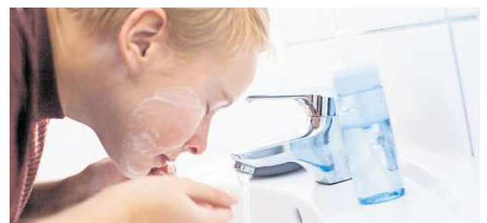
Die Haut zweimal am Tag mit sanften Produkten reinigen und pflegen.

Auch, was wir essen, kann eine Rolle spielen. Manch einer bemerkt an sich, dass sich Milchprodukte oder Zucker negativ auf das Hautbild auswirken. Auch deshalb ist es eine gute Idee, viel Gemüse, Obst und Vollkornprodukte in die Ernährung einzubauen. (DPA)