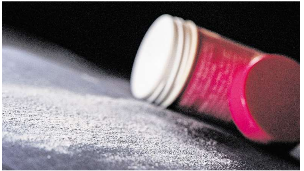
Wenn keine Zeit zum Haarewaschen bleibt: «Öko-Test» hat 26 Trockenshampoos untersucht.

Ein Trockenshampoo enthält Kaolin. Dabei handelt es sich um Tonerde, die von Natur aus mit Schwermetallen verunreinigt sein kann - und in diesem Fall auch war. So waren «Öko-Test» die Gehalte an Arsen und Nickel