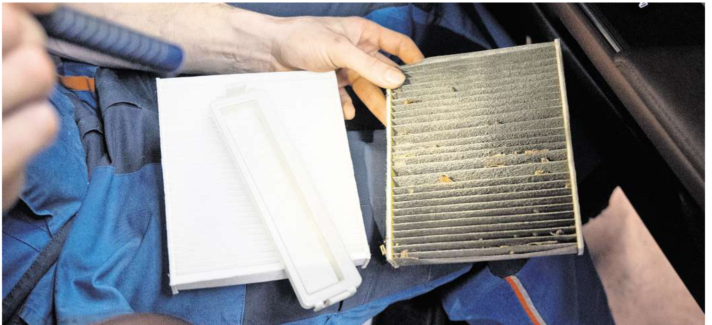
Regelmäßiger Wechsel empfohlen: Der Innenraumfilter sollte jährlich oder nach 15.000 bis 20.000 Kilometern ausgetauscht werden, idealerweise im Frühling.