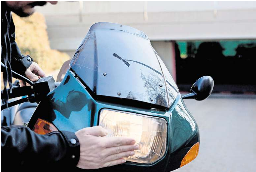
Saisonstart sicher angehen: Vor der ersten Ausfahrt im Frühjahr sollten Motorrad und Ausrüstung gründlich geprüft werden.

Motorradhelme müssen seit 2023 zudem eine neue Norm erfüllen (ECE 22.06). Auch wenn vorherige Helme nicht zwingend ersetzt werden müssen, lohnt laut GTÜ ein Wechsel, weil die neueren Helme einen besseren Schutz bieten. Generell sollte der Helm fest sitzen, ohne zu drücken, und sich beim Kopfschütteln kaum bewegen.