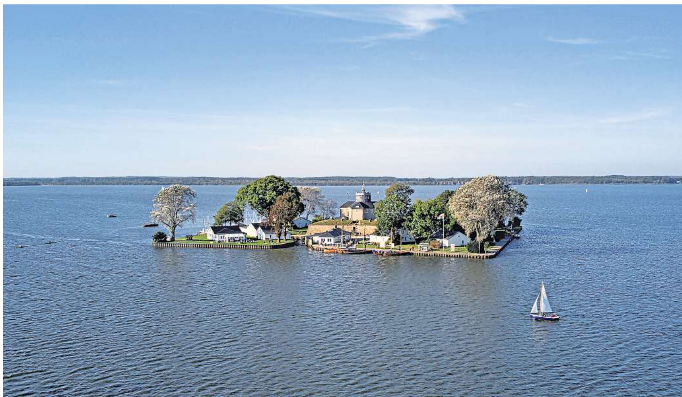
Die kleinste bewohnte Insel Deutschlands: Wilhelmstein ist eine künstliche Insel im Steinhuder Meer mit einer Fläche von 12.500 Quadratmetern in der Region Hannover.