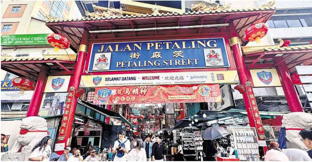
Eingang zum Herzstück von Chinatown: das Tor zur Petaling Street.