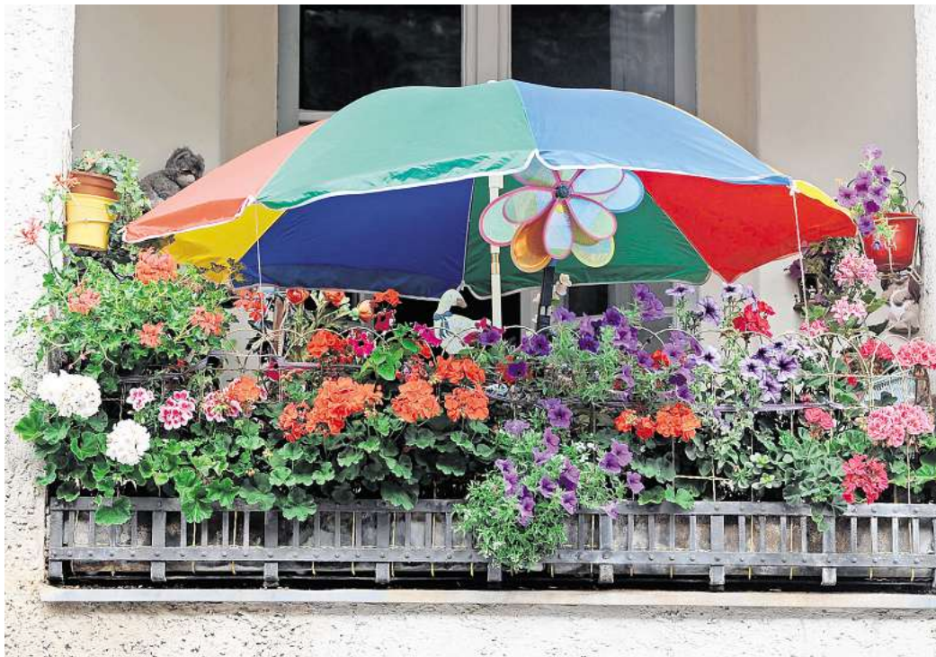
So schön bunt hier: In der Auswahl der Pflanzen sind Mieter nicht limitiert, solange sie Rücksicht auf die Nachbarn nehmen.

Nur wenn andere Hausbewohner durch die Pflanzen erheblich beeinträchtigt oder bauliche Vorgaben verletzt werden, kann Mie-