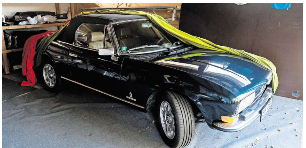
Eine für ein Auto genehmigte Garage ist kein reiner Lagerraum - ein Fahrzeug muss stets Platz finden können.

Eine Eigentümergemeinschaft dürfte bei Verstößen erst einmal die Unterlassung beantragen, und bei anhaltendem Fehlverhalten Ordnungsmittel verhängen. Der IVD weist auch hier auf ein Urteil hin, in dem Fall vom Amtsgericht Hamburg-St. Georg (Az.: 980a C 10/23 WEG). (dpa)