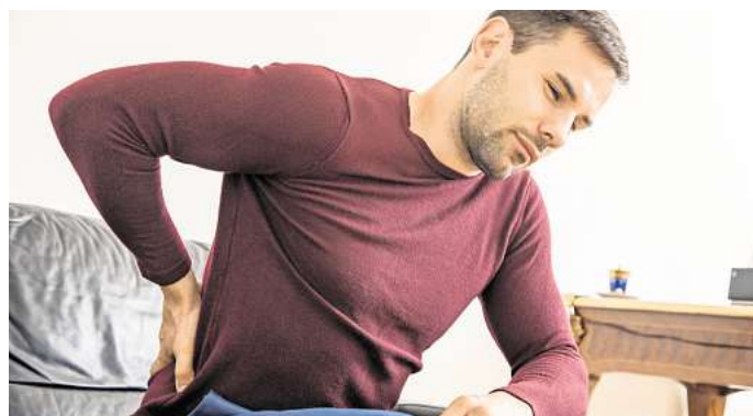
Bei Rückenschmerzen ist Schonen angesagt? Das ist ein Mythos.