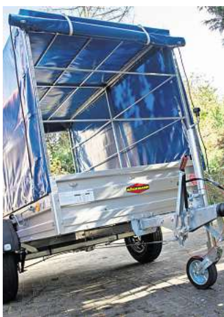
Welche Anhängelast ein E-Auto ziehen darf, steht im Fahrzeugschein.

Wenn grundsätzlich nachgerüstet werden darf, muss die Kupplung eine gültige Genehmigung haben und für den konkreten Fahrzeugtyp zugelassen sein. Der ACE rät zu einer professionellen Beratung und fachgerechten Montage.