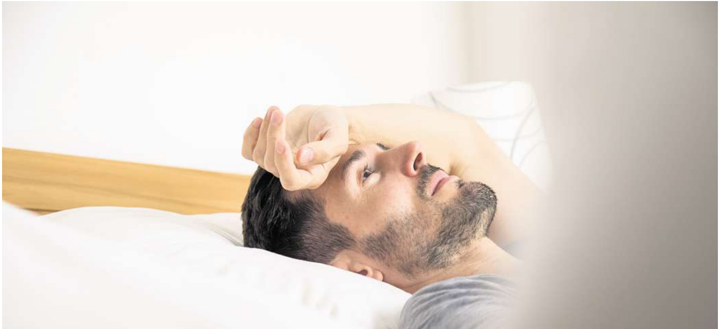
Frühjahrsmüdigkeit: Der Wechsel von Winter auf Frühling bringt hormonelle Umstellungen mit sich, die uns müde und schlapp machen können.

Das Phänomen Frühjahrsmüdigkeit ist wissenschaftlich allerdings umstritten. Laut einer aktuellen Studie aus der Schweiz, die im „Journal of Sleep Research“ veröffentlicht wurde, handelt es sich dabei um einen Mythos. Die Forschenden aus Basel konnten demnach keine empirischen Belege für die Erschöpfung zum Jahreszeiten-