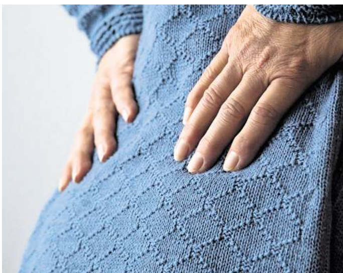
Rückenbeschwerden machten die Arbeit eigentlich von vornherein unmöglich - deshalb wollte die Krankenkasse nicht zahlen.

In dem konkreten Fall hatte eine Frau eine neue Tätigkeit als Produktionsmitarbeiterin aufgenommen. Dort musste sie überwiegend im Stehen und in gebückter Haltung arbeiten. Bereits nach rund zwei Wochen litt sie unter massiven Rückenbeschwerden, woraufhin ein Arzt ihr eine Arbeitsunfähigkeit bescheinigte. Das Arbeitsverhältnis wurde kurz darauf per Aufhebungsvertrag beendet.