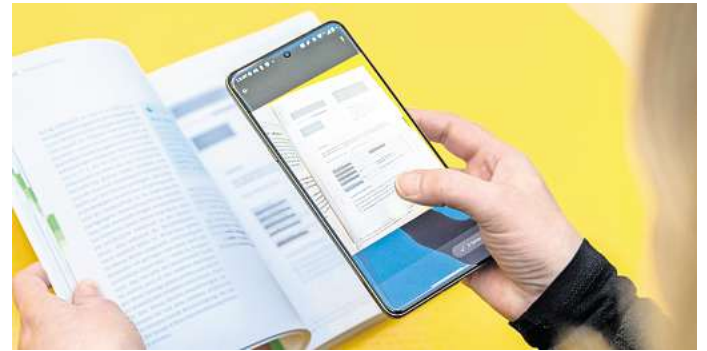
Einfach den gewünschten Bereich abfotografieren, dann übernimmt Fairsan automatisch Zuschchnitt und Bildoptimierung.

(Docuware). Alternativ lassen sich die Scans etwa an E-Mails anhängen. (dpa)