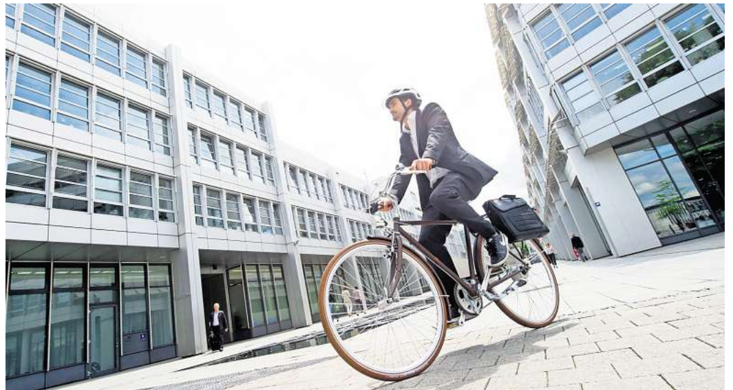
Leasing oder vom Arbeitgeber überlassenes Dienstrad? Aus steuerlicher Sicht macht das einen Unterschied.

Deutlich weiter verbreitet in Deutschland ist das Leasingmodell - zum Beispiel via Jobrad, Lease a Bike und Co. Hier leaset der Arbeitgeber das Rad, zahlt die monatliche Rate und überlässt es dann dem Arbeitnehmer. Dieser verzichtet im Gegenzug auf einen Teil seines Bruttogehalts - meist in Höhe der Leasingrate -, was sich netto in deutlich geringerem Maße auswirkt.