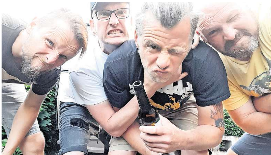
Kommt zum Festival nach Salzgitter-Bad: Das Metal-Quartett Acoustic Steel trat schon in Wacken auf.

folgenden Orten angeboten: am Dienstag, 31. März, um 10 Uhr am Seniorentreff Salzgitter-Bad, eine Woche später am 7. April um 10 Uhr am Pferdestall in Gebhardshagen und am Freitag, 24. April, um 10 Uhr am Seniorentreff Thiede. Anmeldungen sind per Mail unter spn@stadt.salzgitter.de oder unter Tel. (05341) 839-4105 möglich.