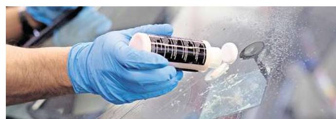
Knacks - ein Steinschlag im Glas muss nicht immer gleich den Austausch der ganzen Windschutzscheibe erfordern.

Lage und seiner Ausdehnung. So ist eine Reparatur den Angaben zufolge meist möglich,