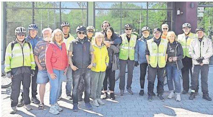
Sie sitzen leidenschaftlich gerne auf dem Fahrrad: Der ADFC bietet zum Start des Stadtradelns am Sonntag eine Tour an.

Salzgitter. Im Rahmen des Stadtradelns, zu dem die Stadt Salzgitter vom 24. Mai bis 13. Juni einlädt, bietet der ADFC mehrere Fahrradtouren an, um gemeinsam möglichst viele Kilometer zu sammeln. Den Auftakt bildet am Pfingstmontag, 25. Mai 2026, eine Fahrt zum Deutschen Mühlenfest nach Halchter. Treffpunkt und Start ist um 10.00 Uhr am Stadtbad in Lebenstedt, Zum Salzgittersee 25.