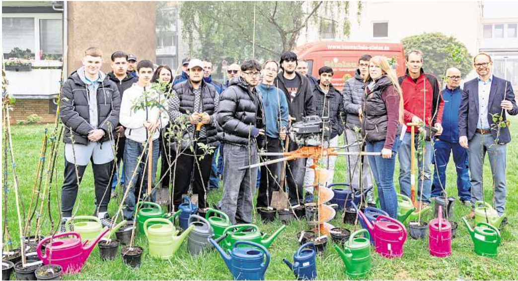
Einsatz mit Erdbohrer, Spaten und Gießkanne: Die Jugendlichen und Lehrkräfte aus der Ludwig-Erhard-Schule pflanzten die Bäume zusammen mit der Grünabteilung der TAG Wohnen.