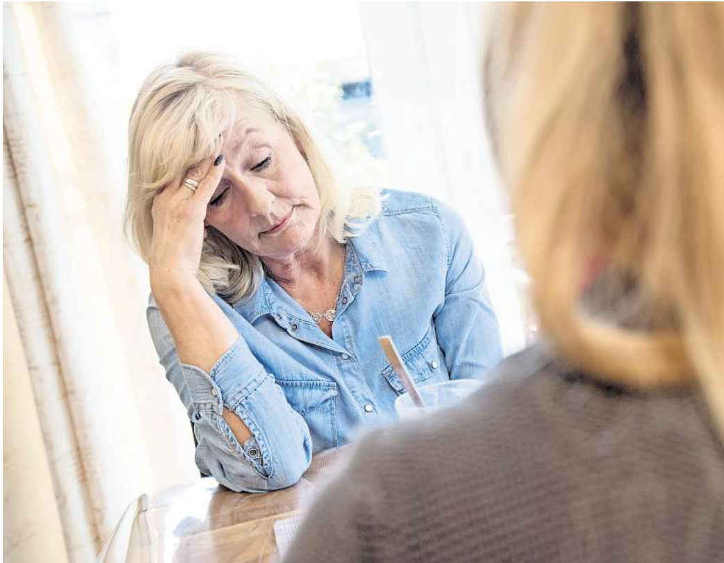
Ein Schlaganfall hinterlässt Folgen, von denen längst nicht alle sichtbar sind.