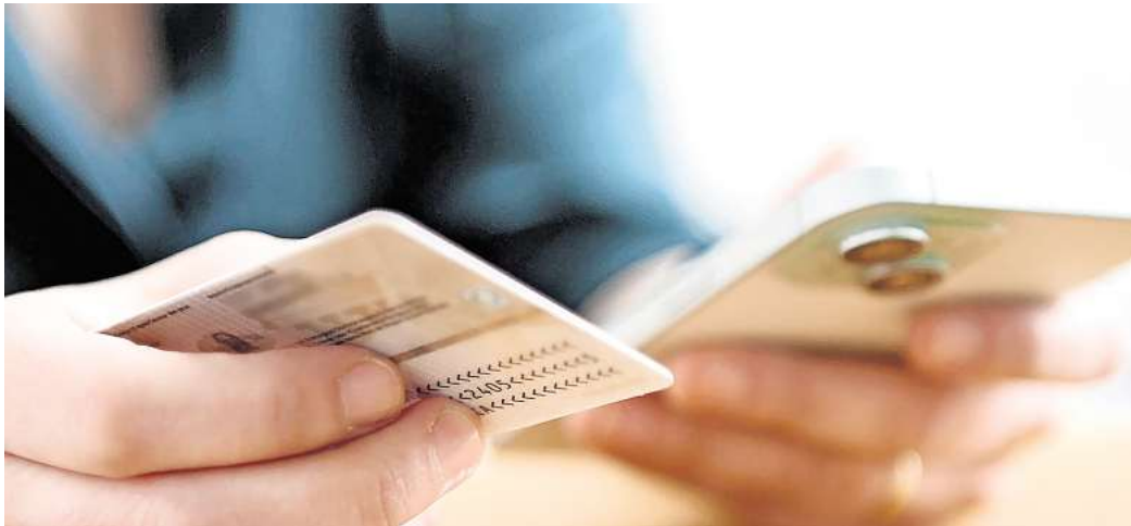
Ausweiskopien nur im Ausnahmefall: Kopien von Personalausweisen sollten bloß angefertigt werden, wenn es wirklich notwendig ist, um Missbrauch und Datenschutzrisiken zu vermeiden.

Stimmt der Ausweisinhaberin oder die Ausweisinhaberin zu, darf auch eine andere Person eine