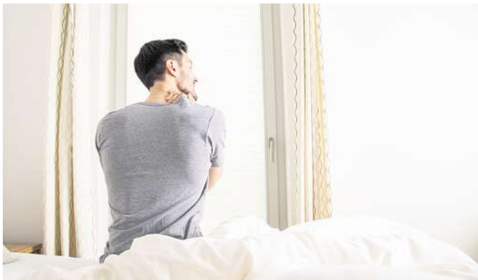
Klingt entspannt: Eine Massage bei Muskelkater? Was bei Verspannungen helfen kann, ist bei frischem Muskelkater eher weniger hilfreich.

Wenn es gemein in den Oberschenkeln zieht, kann man nur unter Schmerzen vom Klo aufstehen. Und bei Bauchmuskelkater machen weder Husten noch Lachen Freude. Was tun?