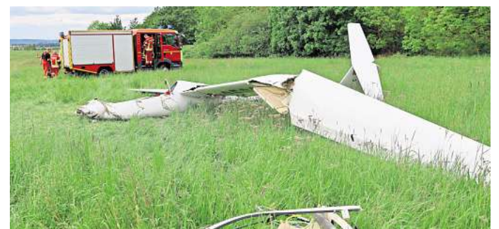
Nur noch Schrott: Beim Startvorgang stürzte ein Segelflugzeug am Schäferstuhl ab.

Salzgitter. Großeinsatz auf dem Flugplatz am Schäferstuhl in Salzgitter-Bad. Dort ist am vergangenen Sonntag am frühen Nachmittag ein Segelflieger abgestürzt. Hinter dem Steuer saß ein junger Mann, der laut Einsatzleiter Julian Naux bei dem Unglück lebensgefährlich verletzt wurde. Ersthelfer waren schnell vor Ort. Der Pilot war ansprechbar, musste aber von der Feuerwehr aus dem Wrack gehoben werden. Ein Hubschrauber flog ihn ins Krankenhaus. Seelsorger kümmerten sich um die Augenzeugen, die den Absturz beobachtet hatten. Die Polizei war vor Ort, ebenso wie die Bun-