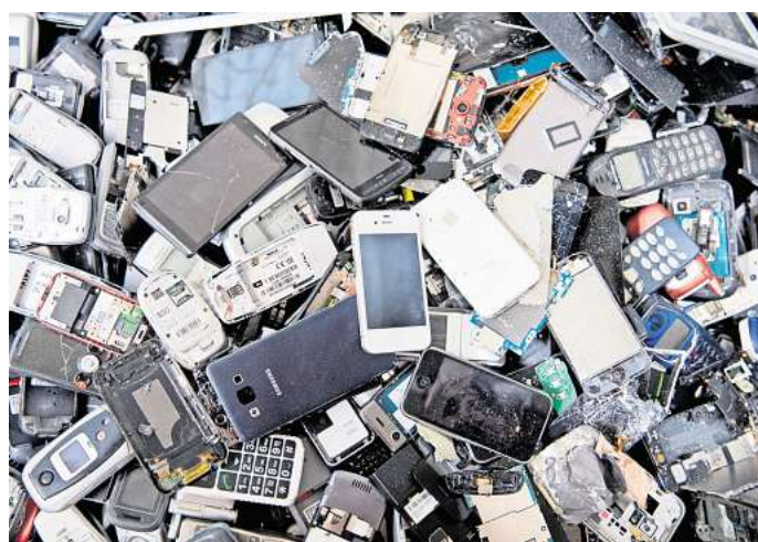
Lieber weg damit: Alte Smartphones, Telefone und andere Elektronikgeräte sollten nicht zu lange daheim lagern. Im Recycling sind sie besser aufgehoben.