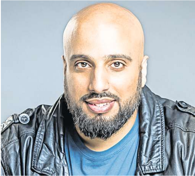
Ein TV-Star bei der Bunten Sole: Kabarettist Abdelkarim kommt in die Aula nach Salzgitter-Bad.