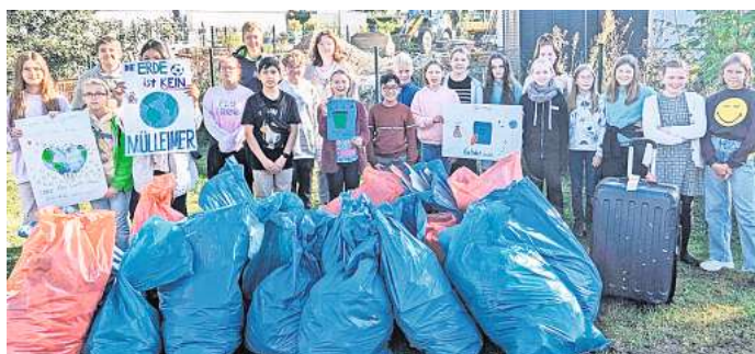
Präsentieren die Ausbeute: Die Schüler und Schülerinnen sammeln gut zwei Kubikmeter Müll.

Die Müllsammelaktion der IGS Lengede ist ein inspirierendes Beispiel für die Kraft der Gemeinschaft und die Bedeutung des Umweltschutzes. Das „negative Highlight“ der Aktion war ein kompletter Reisekoffer samt Namensschild, der achlos im Gebüsch entsorgt worden war. „Ich bin wirklich überrascht und begeistert, wie viel Müll die Schüle-