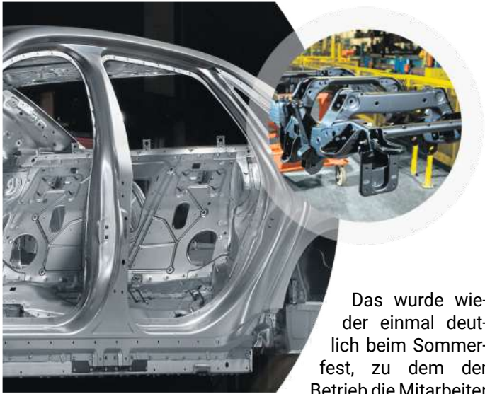
Weltweit mit an der Spitze: Bei MAGNA Salzgitter werden Fahrzeugstrukturteile für die großen Automobilhersteller produziert.

Bei der MAGNA International Stanztechnik werden jeden Tag viele Tonnen Stahl und Aluminium verarbeitet, da pfeift, klackt und schepert es an vielen Ecken, und doch steht bei aller Technik der Mensch im Mittelpunkt.