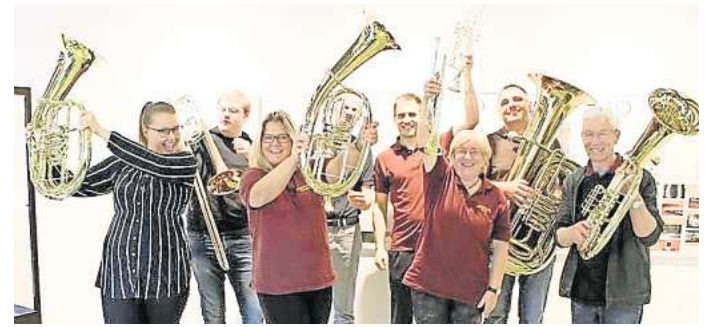
Tritt auf in der Schmiede: der Posaunenchor aus Gitter.

schiedlichen Aspekten gelebter, gedachter und interpretierter Zweisamkeit in Texten unter anderem von Jaroslav Hašek, Erich Kästner, Mascha Kaléko, Gotthold Ephraim Lessing, Karl Valentin. Für die musikalischen Zwischentöne sorgt an diesem Abend der Posaunen-Chor aus Gitter. Der Eintritt ist frei. Die Dorfgemeinschaft Gitter freut sich über eine freiwillige Hütspende.