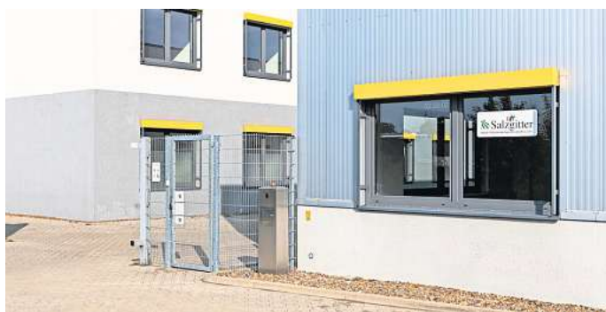
Neue Adresse: Die Stadt hat den Auto-Fachbereich mit der Kfz-Zulassungsstelle im ehemaligen Impfzentrum untergebracht.

„Vereinbarte Termine ab dem 4. Oktober behalten ihre Gültig-