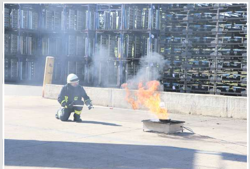
Heiße Vorführung: Feuerwehrleute löschen einen Fettbrand.