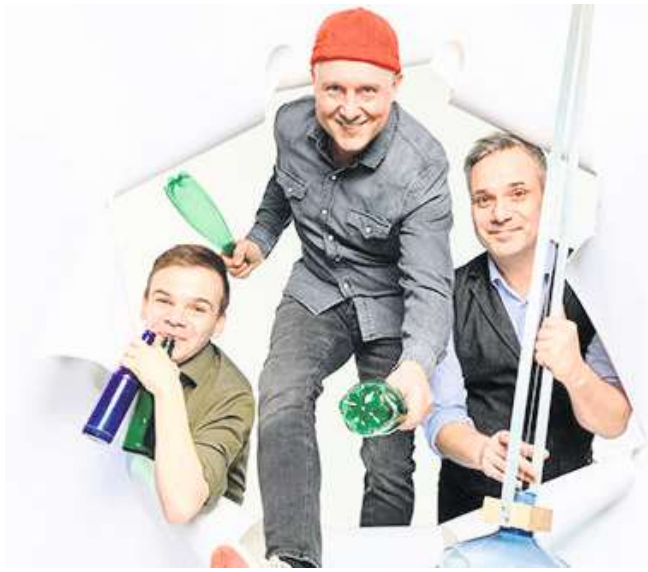
Lädt ein zur "Happy Hour": Das Trio GlasBlasSing tritt in der Knies-tedter Kirche auf.

BlasSing, Europas führende Pfandwerker, wie immer mit ihrem sperrigen Namen. Tickets gibt es für 18 Euro im Vorverkauf beim Rittersporn in Salzgitter-Bad oder bei Young Ticket Event in Lebenstedt, an der Abendkasse kosten sie 20 Euro.