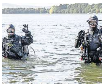
Einsatz am 3. Oktober: Taucher wollen am Dienstag den Salzgittersee nach Müll absuchen.

Diese jährliche Aktion, die es seit 2021 gibt, wird durch die Stadt Salzgitter und Unternehmen aus der Region unterstützt.