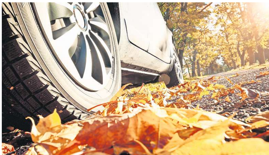
Wenn im Herbst die Fahrbahnen mit Feuchtigkeit und Laub rutschig werden, müssen Reifen, Wischerblätter und Beleuchtung top in Schuss sein.