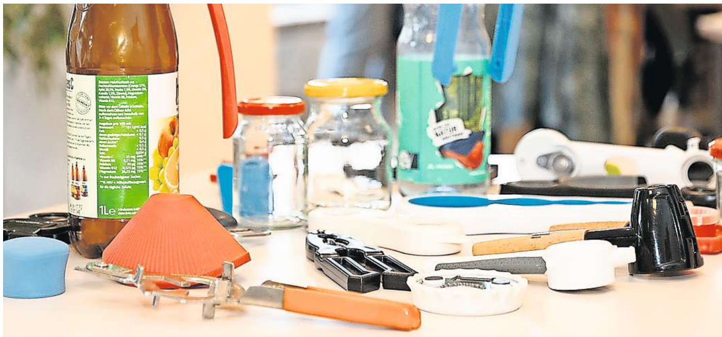
Helfer gegen Schraubverschlüsse: Senioren und Seniorinnen können die verschiedenen Geräte ausprobieren.