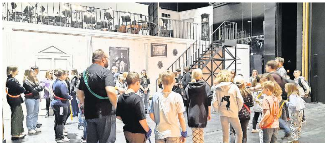
Ausflug mit der Evangelischen Jugend: Beim Theaterbesuch im Januar ist auch ein Blick hinter die Kulissen geplant.

Am 28. Oktober liegen bei der langen Spielenacht viele Brettspiele und Kartenspiele auf den Tischen. Die Ev. Jugend besitzt einen großen Vorrat an neuen