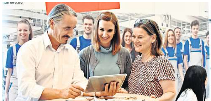
Beratung ist wichtig: Die Berufswahlmesse parentum richtet sich an Eltern und Jugendliche.

Neben den persönlichen Gesprächen bietet die parentum ein informatives Vortragsprogramm mit Tipps rund um The-