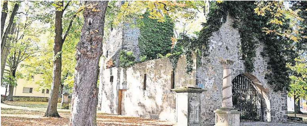
Startpunkt: Treffen für den Altstadtrundgang ist an der Vöppstedter Ruine.

Ortsheimatpfleger Holger Rogge ist mit Interessierten zwei Stunden unterwegs