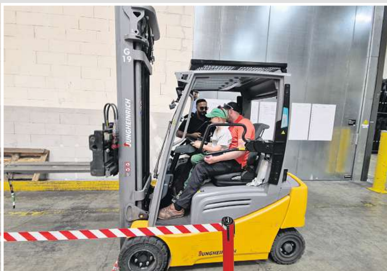
Tempo und Geschick: Viele Gäste beteiligen sich am Wettbewerb mit dem Gabelstapler.