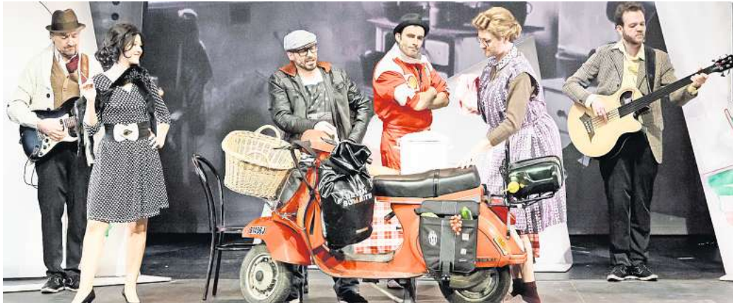
Von Italien nach Deutschland mit dem Roller unterwegs: Die Musical-Komödie „Azzurro“ ist am 7. Oktober in der Aula zu sehen.

Und worum geht es? Gloria, die nach Amerika ausgewanderte Jugendliebe von Rocky,