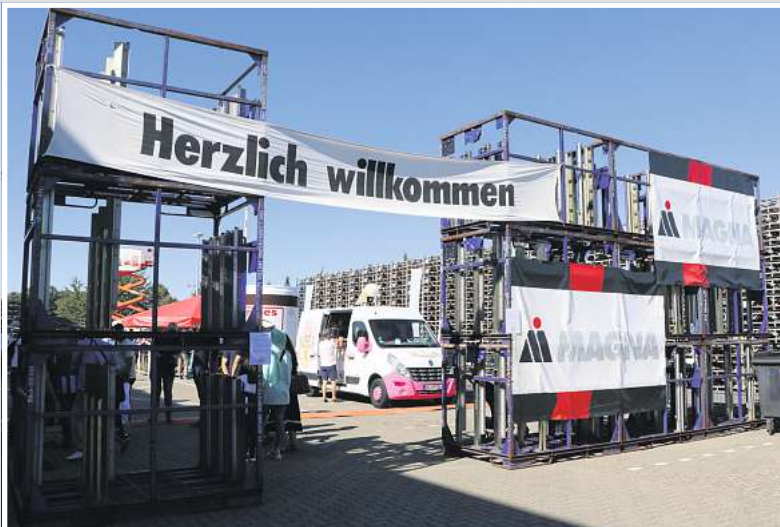
Herzlich willkommen: Die MAGNA-Stanztechnik begrüßt die Gäste zum Sommerfest.