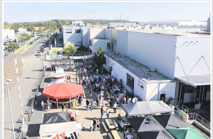
Großes Interesse: Viel Betrieb herrscht auf dem Gelände am Gesellensteig.