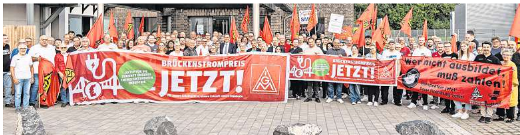
Botschaft: Die IG Metall fordert einen Brückenstrompreis für die energie-intensive Industrie.

Die Stromkosten sind zwar gesunken, liegen aber immer noch dreimal höher als im Jahr 2020. Dies stellt laut IG Metallein erhebliches Problem für energieintensive Herstellungsverfahren dar. „Die hohen Stromkosten gefährden die Wettbewerbsfähigkeit deutscher Unternehmen, was zum Verlust von Arbeitsplätzen führen könnte“, so die Sorge. Betriebe reduzierten ihre Produktion. Zudem fehlt das Geld für