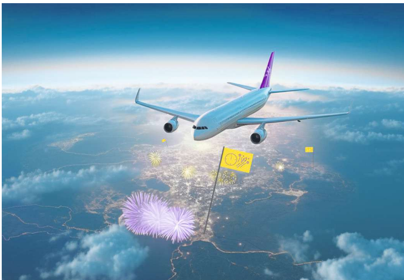
Rote Unterwäsche und brennende Puppen: Nicht nur in Deutschland, sondern auf der ganzen Welt gibt es zum Jahresende typische Traditionen.