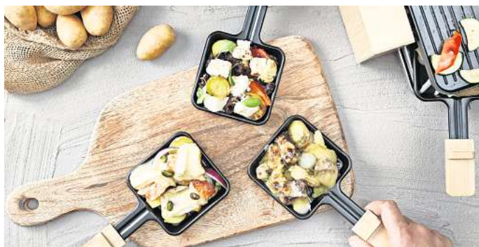
Raclette ist in der Silvesternacht ein beliebter Essens-Klassiker.

200 Gramm vorwiegend festkochende Kartoffeln vom Vortag in ca. 3 mm dicke Scheiben schneiden und mit 80 Gramm Pesto verde, 100 Gramm Maiskölbchen und 100 Gramm Silberzwiebeln zu dem Filet geben. Mit insgesamt 150 Gramm Raclette-Käse bedeckt ca. 3 Minuten im Raclette überbacken.