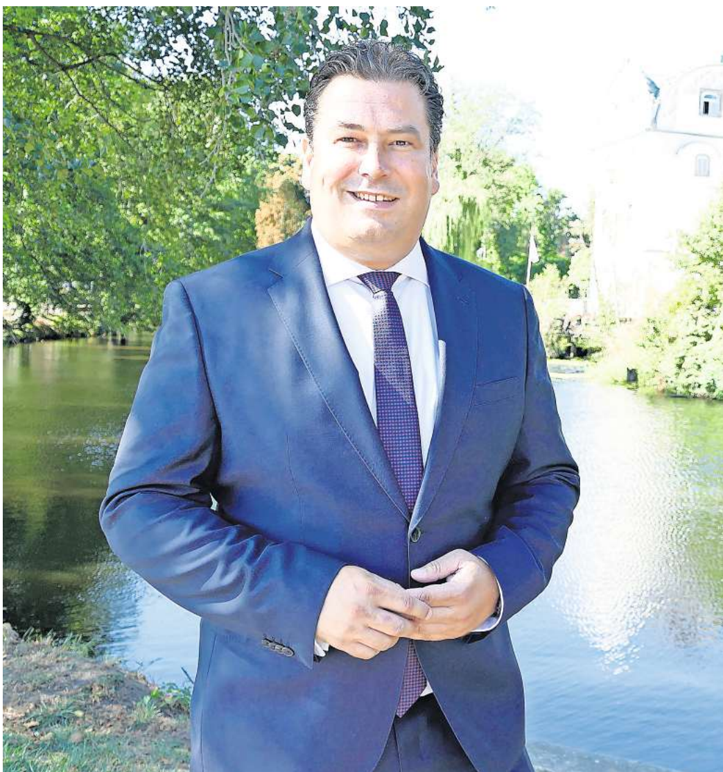
Landrat Tobias Heilmann.

Auch im Bereich der Schullandschaft konnten in diesem Jahr langwierige Baumaßnahmen beendet und neue Projekte begonnen werden. Die Sporthalle am Gymnasium Hankensbüttel wurde eingeweiht und für den Neubau der Förderschule Geistige Entwicklung in Meinersen und des Kompetenzzentrums und die Erweiterung an der Berufsbildenden Schulen I in Gifhorn wurde der Grundstein gelegt. Ein großer Meilenstein wurde zudem durch die Breitbandversorgung an Schulen erreicht. Dieser „jüngste“ Erfolg lag mir besonders am Herzen, da die Schulen beim Thema Digitalisierung nicht „hinten anstehen“ dürfen. In Zeiten von digitalem Lernen freue ich mich sehr, dass die Bildungseinrichtungen in unserem Kreisgebiet so zukunftsicher ausgestattet sind. Zu meinen persönlichen „Highlights“ aus der Kulturlandschaft zählen unter anderem das