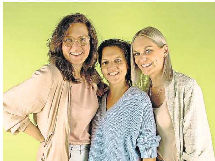
Die Gründer von „STRAYZ“.

Dieses Start-up hilft Streunern und Straßenkatzen