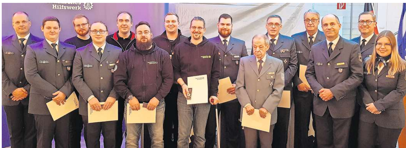
Ehrungen für verdiente Mitglieder der THW-Ortgruppe Gifhorn: Sogar das Ehrenzeichen in Gold wurde verliehen.

Kelpin habe in manchen Jahren bis zu 2.400 Stunden ehrenamtlich für das THW geleistet. Er war im Jahr 1994 in Goma (damals Zaire, heute Demokratische Republik Kongo) nach einer Flutkatastrophe im Einsatz, um Krankenhäuser in standzusetzen und Flüchtlings-