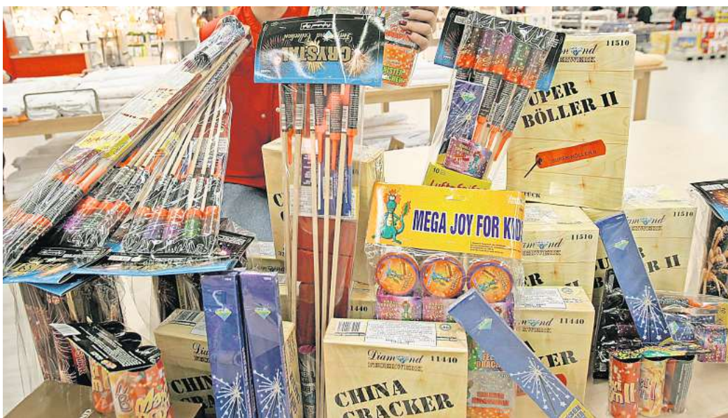
Kaufen Sie selbst Raketen und Böller zu Silvester?

Über dieses Thema wird Land auf, Land ab heiß diskutiert, sei es vor dem Hintergrund von Kriegen, im Zusammenhang mit Umwelt- und Tierschutz, aufgrund des allgemeinen Verletzungsrisikos oder wegen Ausschreitungen in deutschen Großstädten, die in den letzten Jahren stetig zunahmen.