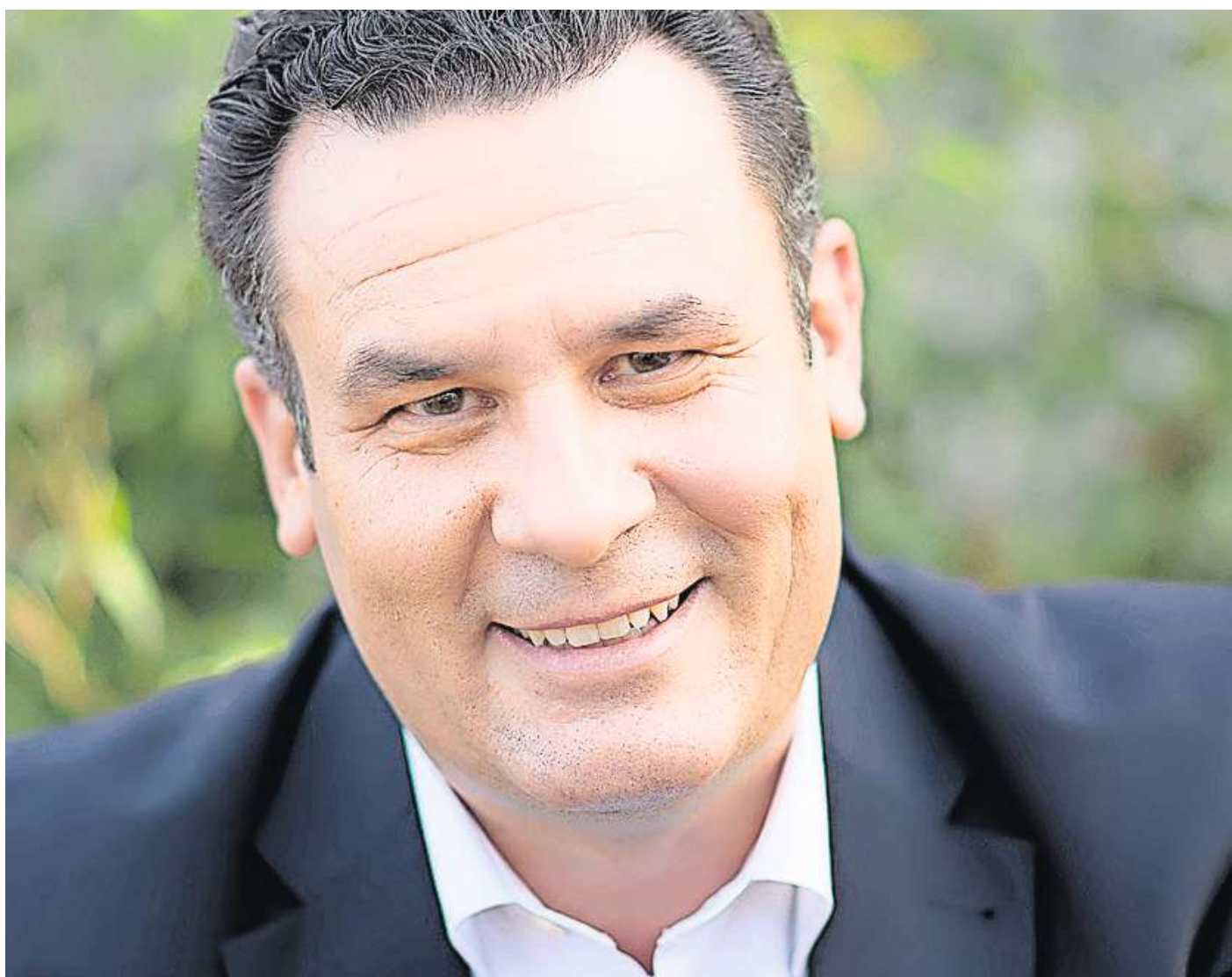
Bürgermeister Matthias Nerlich.

Viele Gifhornerinnen und Gifhorner sind in den vergangenen Monaten dem Aufruf der Stadt gefolgt und haben im Rahmen des Integrierten Stadtentwicklungskonzeptes (ISEK) Ideen und Wünsche für die Umgestaltung bestimmter Bereiche in unserer Stadt eingebracht. Dafür ein herzliches Dankeschön an alle, die sich daran beteiligt haben. Eines der größten Projekte im Rahmen des ISEK ist denn auch der Umbau der Fußgänger-