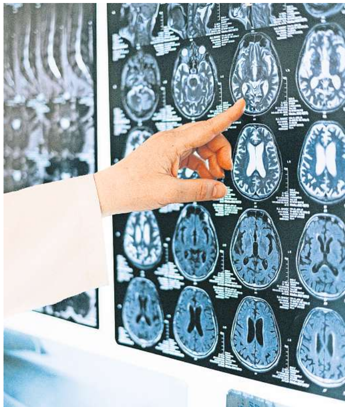
Was Neurotechnologie mit KI jetzt schon kann, ist beeindruckend und beängstigend zugleich.

nicht an Verbote von Neurotechnologien, sondern an Abwehrrechte der Bürger gegen den Missbrauch ihrer Hirndaten – durch Big-Tech-Konzerne, aber auch am Arbeitsplatz oder im Gesundheitswesen. Derweil macht die Verbindung von KI und Neurotechnologie atemberaubende Fortschritte.