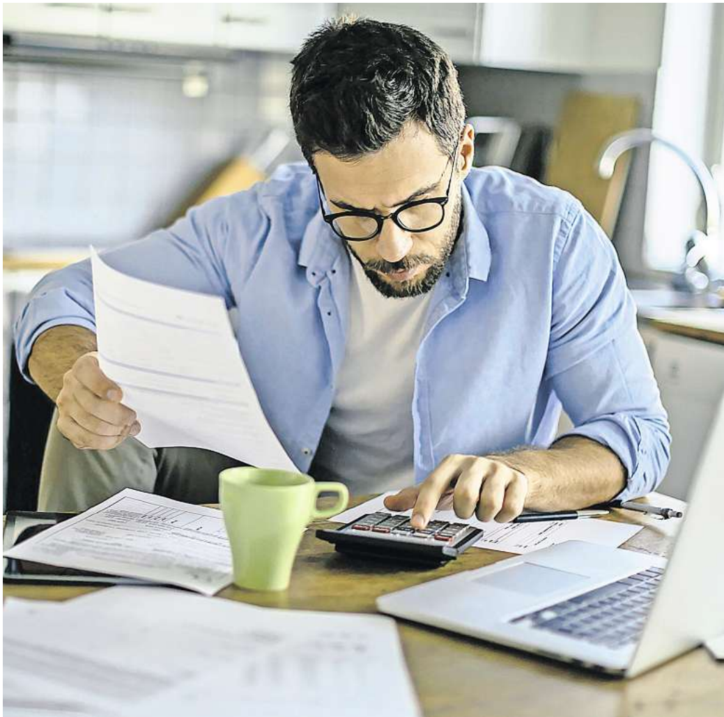
Im Laufe eines Lebens fallen viele Unterlagen an. Häufig ist es nicht nötig, sie dauerhaft aufzubewahren. Doch für manche gelten bestimmte Aufbewahrungsfristen.

In vielen Supermärkten und Drogerien besteht mittlerweile die Möglichkeit, einen digitalen Kassenbon beispielsweise per E-Mail oder über die App zu erhalten. Das spart nicht nur Papier und ist gut für die Umwelt, sondern vermeidet auch die Frage: Wohin mit dem Beleg? Aber egal ob Papier oder digital: „Für alle Dinge, die Kunden länger benutzen wollen oder die mehr als nur alltägliche Verbrauchsartikel sind, sollten sie die Quittungen, Kassenbons und Kaufverträge mindestens zwei Jahre aufbewahren“, so Brandl. „Denn der Gewährleistungsanspruch bei beweglichen Gegenständen gilt meist für diesen Zeitraum.“ Gewähren Händler freiwillig eine längere Garantiezeit, verlängert sich die Aufbewahrungsfrist dementsprechend. „Entsteht ein Mangel, müssen Käufer für die Reklamation den Erwerb beim