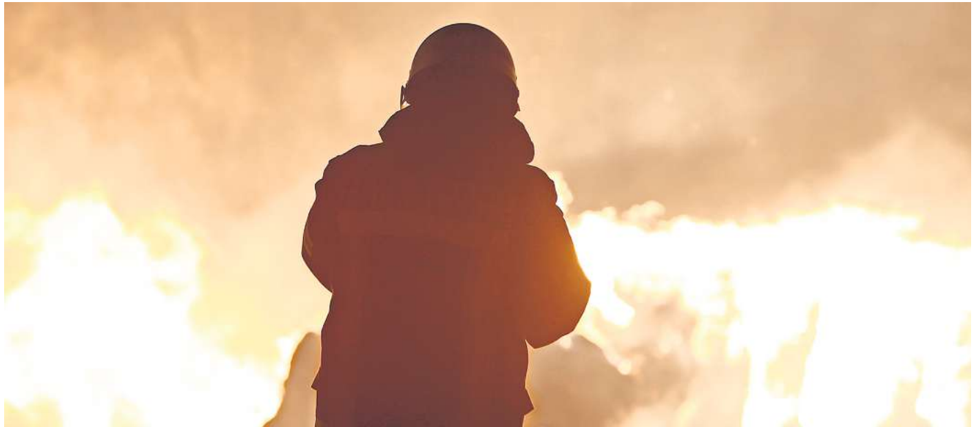
Offensichtliche und unsichtbare Gefahren: Im Qualm verbergen sich inzwischen fast immer Ultragifte, weshalb die Hygiene bei der Feuerwehr eine wichtige Rolle spielt.

Jedem Rußpartikel können heutzutage Dioxine, Fourane oder andere „Ultragifte“ anhaften, erläutert Küllmer. Weil überall inzwischen Kunststoff verbaut sei, verbleibe das bei einem Brand nicht. Jeder Rauch sei nicht gesund, selbst bei einem