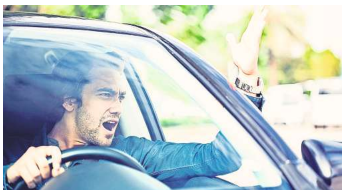
Wüste Beschimpfungen oder beleidigende Gesten können teuer werden: Das Zeigen des Mittelfingers kann zum Beispiel 4000 Euro kosten.

Auch wenn nicht konkret festgelegt ist, wie hoch die Strafen für bestimmte Schimpfwörter sind, existieren einige Gerichtsurteile,