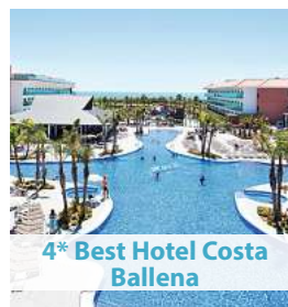
4* Best Hotel Costa Ballena