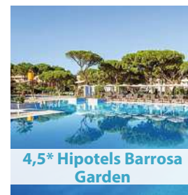
4,5* Hipotels Barrosa Garden