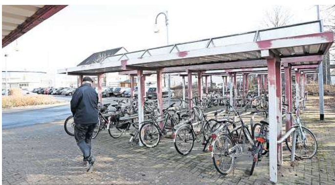
Stellplatz am Bahnhof Gifhorn-Süd: Mehr als die Hälfte der Fahrraddiebstähle ereignete sich im Stadtgebiet.

Genau gesagt waren es 44 aufgekklärte Fälle, was einer Quote von 16,48 Prozent entspricht. Diese sei höher als noch 2022, erklärt Polizeisprecher Christoph Nowak: Von 292 gemeldeten Fahrraddiebstahl-Fällen wurden seinerzeit lediglich 37 aufgeklärt – umgerechnet 12,67 Prozent.