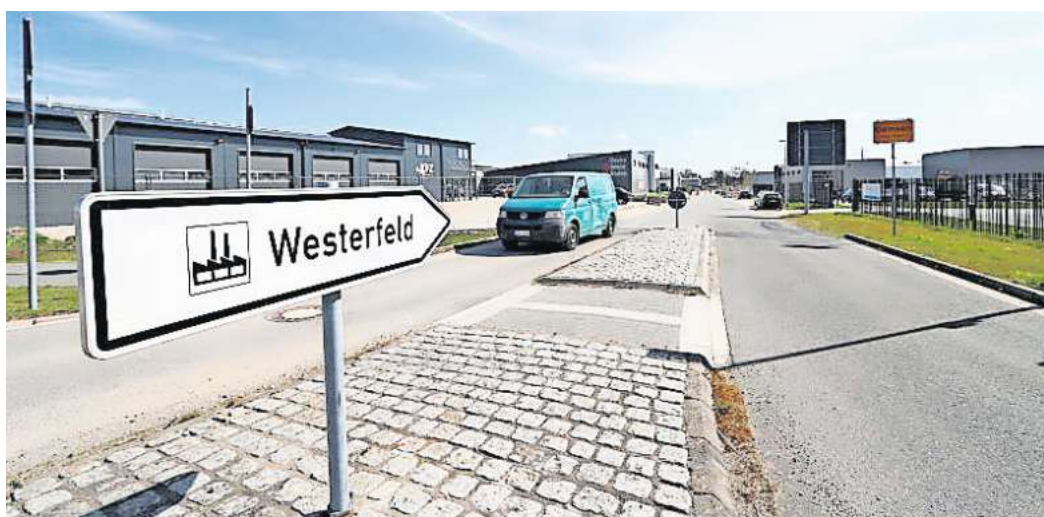
Gewerbegebiet Westerfeld in Gifhorn: Unternehmen im Kreisgebiet sollen künftig von der neuen Wirtschaftsförderungsgesellschaft des Landkreises profitieren.

In der Politik war das Vorhaben vor einem Jahr heftig umstritten. Gut eine Stunde lang wurde im Oktober 2023 im Kreistag teilweise ziemlich hitzig über den Gesellschaftervertrag diskutiert. Während dieser vor allem seitens der SPD Zu-