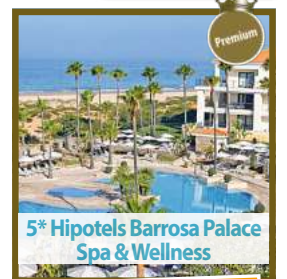
5* Hipotels Barrosa Palace Spa & Wellness

In den Herbstferien mit Kinderfestpreis ab € 599,-!