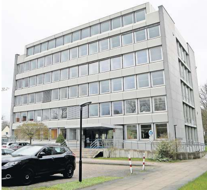
Land in Sicht? Ob 2024 der Durchbruch in Sachen Nachnutzung Behördenhaus Am Schlossgarten kommt, ist aktuell noch ungewiss.

Dass die Stadt Gifhorn durchaus Interesse hat, an dieser exponierten Lage die Gestaltungshöhe zu übernehmen, hatte sie bereits formuliert. Da es aber kein eindeutiges Signal des Landes gebe, hielt sich die Verwaltung im vergangenen Jahr mit einer konkreten Interessensbekundung, das Behördenhaus zu kaufen, zurück.