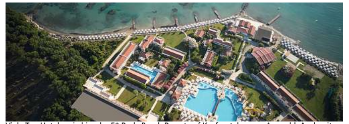
Viele Top Hotels, wie hier das 5* Roda Beach Resort auf Korfu, stehen zur Auswahl. Auch mit Kinderfestpreisen ab € 499,-.

In allen Zielen hat man die Auswahl zwischen einem großen und vielfältigen Hotelangebot. Egal ob Best-Preis oder Premium, Clubanlage oder Top-Lage. Von Frühstück bis All Inclusive. Bereits ab € 699,- inkl. Hotel und Transfer kann man ab Braunschweig starten. Kinderfestpreise sind bereits ab € 499,- und teilweise auch mit All Inclusive buchbar.