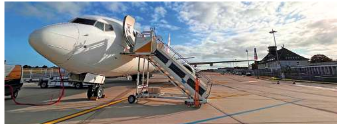
Fliegen ab Braunschweig ist wie Urlaub ab Haustür.

Den Katalog, weitere Informationen und Buchungsmöglichkeit dieser exklusiven Angebote finden Sie unter www.fliegen-ab-braunschweig.de , im FIRST Reisebüro Schmidt und weiteren Reisebüros oder unter der kostenfreien (aus dem dt. Festnetz) Buchungshotline T. 08 00 / 38 300 38 (Mo.-Fr. 9-18, Sa. 9-13 Uhr).