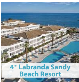
4* Labranda Sandy Beach Resort