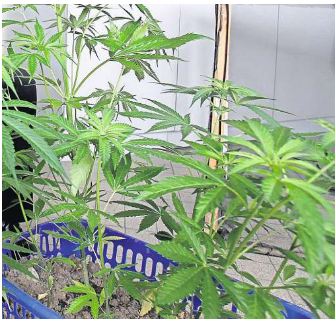
Cannabis: Seit dem 1. April sind bis zu drei solcher Pflanzen in der eigenen Wohnung erlaubt.

Es stellen sich aber immer noch viele Fragen, wie das Gesetz in der Praxis umgesetzt werden soll. Verboten ist das Kiffen unter anderem auf Spielplätzen, in Schulen, Sportstätten und jeweils in 100 Metern Luftlinie um den Eingangsbereich. Fußgängerzonen sind zwischen 7 und 20 Uhr ebenfalls kifffreie Zonen. Außerdem ist der Konsum verboten „in unmittelbarer Gegenwart von Personen, die das 18. Lebensjahr noch nicht vollendet haben“ – es stellt sich die Frage nach dem Aufwand für die Kontrollen. Zudem dürfen Cannabis-Clubs erst zum 1. Juli