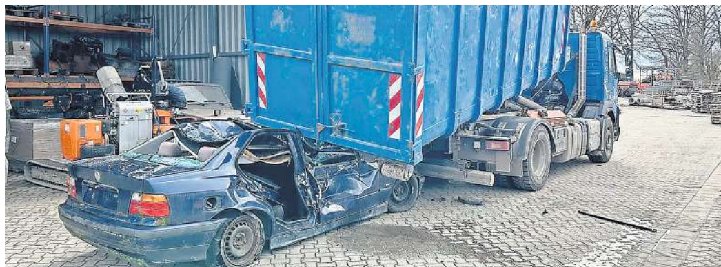
Schwerer Unfall als Übungsszenario: In Rethen trainierten Feuerwehrlaute aus Groß Schwülper und Bortfeld im Kreis Peine, Menschen aus einem unter einen Lastwagen geratenen Auto zu befreien.