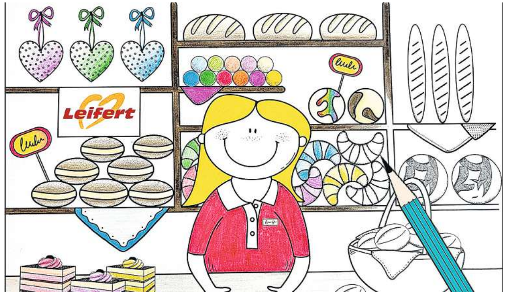
Ausmalen auch für den guten Zweck: „Leiferts Grundschulwettbewerb“ findet vom 8. bis zum 30. April statt.

Die Ausmalbilder zum Ausdrucken wurden bereits per E-Mail an alle Schulen verschickt. „Natürlich darf jeder Schüler nur ein Bild abgeben“, nennt Nils Leifert eine der Teilnahmebedingungen. Damit das Bild der jeweiligen Grundschule zugeordnet werden kann, muss auf der Rückseite jedes Kunstwerkes neben dem Vornamen des Kindes auch der Name der Schule stehen. „Aus Datenschutzgründen sollte allerdings der Nachname höchstens mit dem Anfangsbuchstaben abgekürzt vermerkt sein“, so Leifert, denn ein Teil der eingereichten Bilder soll „Im Leiferts“ im Steinweg ausgestellt und als lamierte Tablettunterlagen den dortigen Gästen präsentiert werden. „Die lamierten Werke können unsere Gäste oder auch die