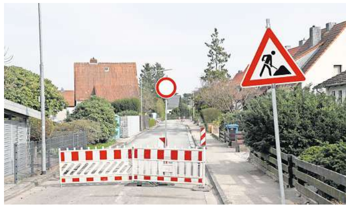
Die gesperrte Ringstraße im Freitagsmoor: Hier finden derzeit Bauarbeiten statt.

Mit dem Ausbau der Hamburger und Lüneburger Straße soll die Sicherheit der Verkehrsteilnehmer erhöht werden, insbesondere die der Radfahrer. Derzeit werde die Ausführungsplanung für den ersten Bauabschnitt zwischen Kreisel Bruno-Kuhn-Straße und dem Robinienweg erarbeitet. „Über die Einzelheiten des Ausbaus können wir deshalb