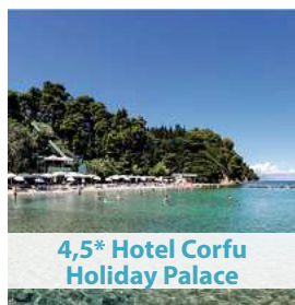
4,5* Hotel Corfu Holiday Palace