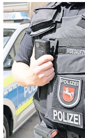
„Achtung Kontrolle“: Die Kabel-1-Doku zeigt bald den Alltag von Gifhorer Polizeibeamten.

Auch einen aktuellen Aufreger in der Innenstadt präsentierten Anders und Wolff dem TV-Team. Sie kontrollierten an der Hindenburgstraße die seit dem 23. Oktober verbotene Durchfahrt durch die Fußgängerzone. „Zum Nachmittag vier bis fünf Fahrzeuge in kürzester Zeit“, sagt Wolff. Wölk hat sogar