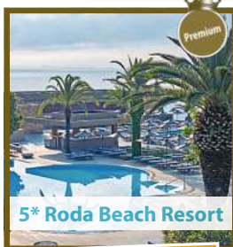
5* Roda Beach Resort

In den Herbstferien mit Kinderfestpreis ab € 499,-!