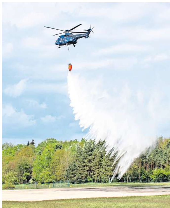
Brandbekämpfung aus der Luft: Die Fliegerstaffel Gifhorn übte nun das Löschchen mit „Super Puma“ und „Bambi Bucket“.

ausstattung wird neben dem Faltbehälter noch von acht Großflächen-Kreisregnern und 310 Meter Düsenschläuche zur flächenmäßigen Brandbekämpfung oder zum Aufbau einer Riegelstellung ergänzt. Weitere Beschaffungen sind zudem in Planung: „Die Vegetationsbrandbekämpfung soll sukzessive erweitert werden. Zum Sommer ist daher die Anschaffung eines weiteren Faltbehälters mit 15 Kubikmetern Fassungsvermögen geplant. Planerisch beschäftigt sich die Kreisfeuerwehr zudem mit weiteren zusätzlichen Ausstattungen, um die Gebietseinheiten effektiv und zielgerichtet unterstützen zu können“, so Dieckmann.