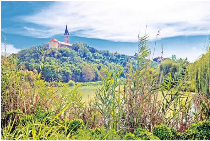
Blick auf Ilok am Ufer der Donau.

Osijek liegt an der Drau und ist die viertgrößte Stadt des Landes und die größte der Region Slawonien mit rund 76.000 Einwohnerinnen und Einwohnern. Die Universitätsstadt ist in mehrere Bereiche unterteilt: In die verwinkelte Altstadt, die auch Festung genannt wird, die Oberstadt im Westen mit Sehenswürdigkeiten und Einkaufsangeboten und die Unterstadt im Osten mit großen Sportanlagen.