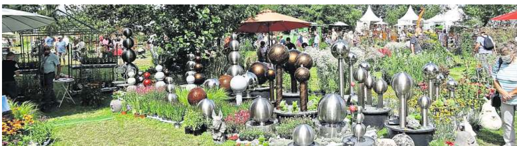
Wer seinen Garten verschönern möchte, kann sich Anfang Mai in Wienhausen auf der Gartenmesse „Blumen & Ambiente“ inspirieren lassen.

Die Besuchenden können durch verschiedene Gartenwelten schlendern, die von Garten-