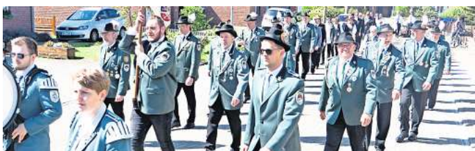
Der Festumzug ist ein Highlight des Schützenfestes.

15 Uhr: Eröffnung des Schützenfestes. Anschließend Umzug mit Kranzniederlegung am Ehrenmal und Anbringen der Königscheibe „Veteranenkönig“ 16.30 Uhr: Vorschießen „Schützenkönig“ 20.30 Uhr: Proklamation „Jugendkönig/in“ und „Jungschützenkönig/in“ 21 Uhr: Disco mit dem Xanadu Musik-Express