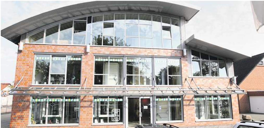
Am Gifhorer Hauptfirmensitz finden interessierte Bauherren und solche, die es werden wollen, auf zwei Etagen jede Menge Anregungen.