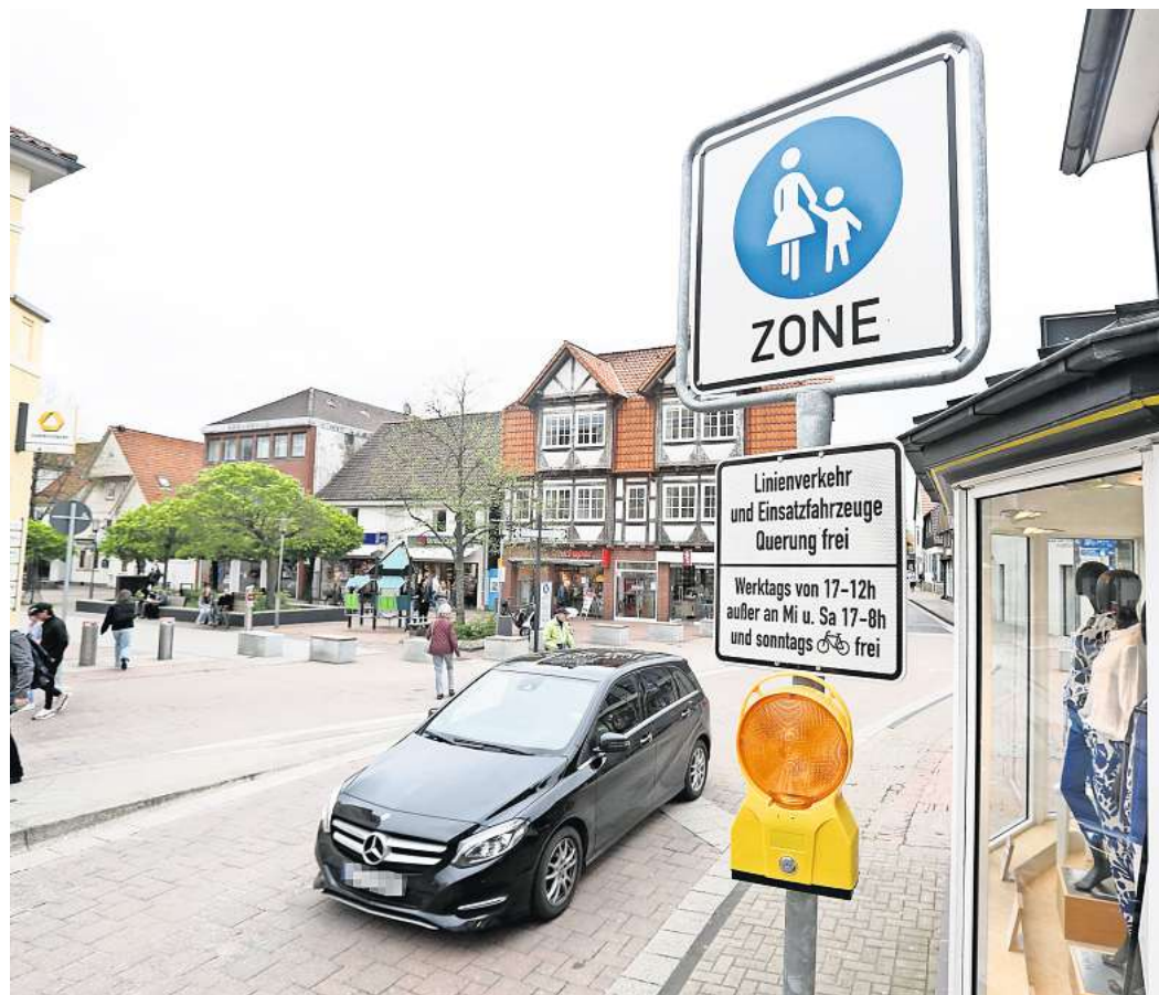
Seit sechs Monaten gesperrt: Der Verkehrsversuch läuft jetzt auf, Gifhorn ist gespannt, wie es weiter geht mit der Fußgängerzone und ihrer Querung.