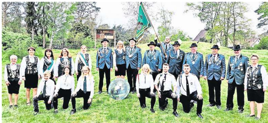
Die Schützenköniginnen und Schützenkönige 2023 sind schon voller Vorfreude aufs Schützenfest in diesem Jahr.