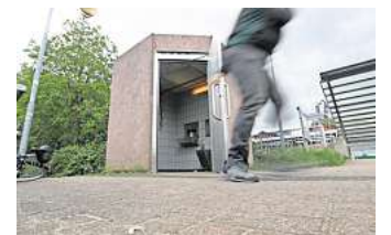
Die Toilette am Bahnhof Gifhorn (Süd) lädt nicht zum Verweilen ein.

Zugtoiletten spülen das Abwasser in einen Tank – und zwar durch enge Rohre. Fremdgegenstände können diese schnell verstopfen und zu aufwändigeren Reparaturen führen, so Märtens. Deshalb sollen keine Gegenstände oder Abfälle in der Toilette entsorgt werden.