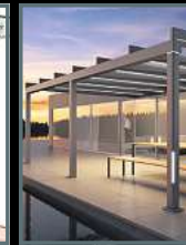
Terrassen- überdachungen Wintergärten Markisen