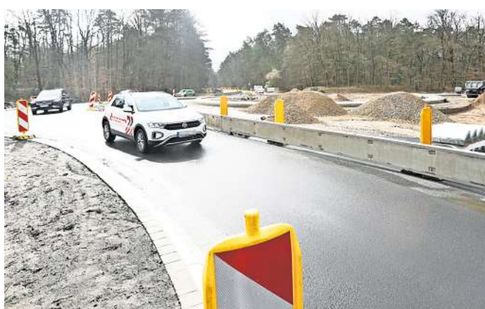
Großbaustelle seit vielen Monaten: Der neue Kreisverkehr auf der K 114 im Bereich Wolfsburger Straße soll Ende April auch in Fahrtrichtung Wolfsburg befahrbar sein.

Die Stadt Gifhorn krempelt die Kreuzung Wolfsburger Straße/Calberlaher Damm um: Diese bekommt eine Ampel, weil der Tangenten-Radweg über sie geführt wird, damit Radler nicht