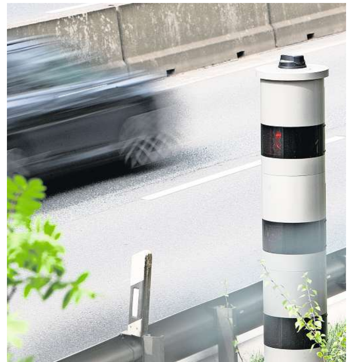
Starenkasten weg, Blitzersäule da: Auch an Gifhorns B 4-Westumgehung in Höhe Heidland hat der Landkreis umgerüstet.

Der Landkreis plant Riechert zufolge keine neuen festen Blitzer-Standorte einzurichten.