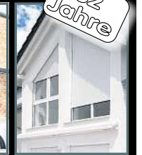
Fenster & Rollläden Schiebeanlagen Faltanlagen

V. Gloger Direktförderung ohne komplizierte Antragstellung auf alle Produkte mind. 22% FÖRDERUNG