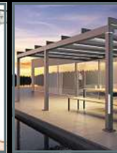
Terrassen- überdachungen Wintergärten Markisen