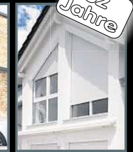
Fenster & Rollläden Schiebeanlagen Faltanlagen

V. Gloger Direktförderung ohne komplizierte Antragstellung auf alle Produkte mind. 20% FÖRDERUNG