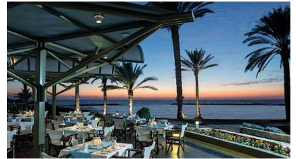
Viele Top Hotels, wie hier das 4,5* Hotel Pioneer, stehen zur Auswahl.

Der Herbst wird für Urlaubsreisen immer beliebter. Die Temperaturen sind angenehm warm und