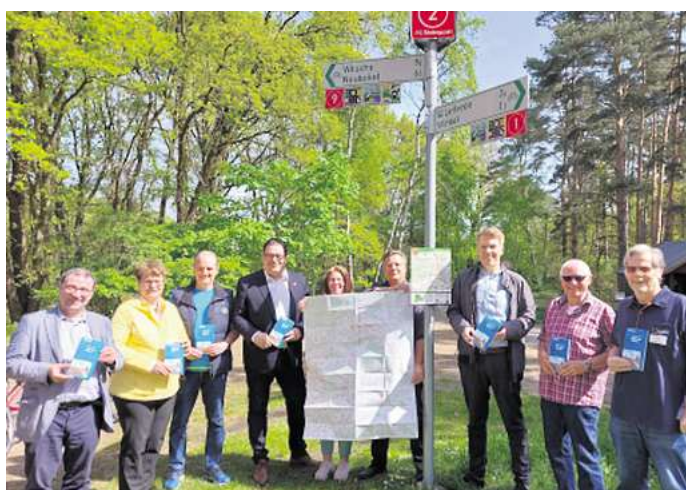
Damit Radfahren künftig noch schöner wird: Es gibt eine neue Radwanderkarte mit Knotenpunktsystem für das Kreisgebiet Gifhorn.