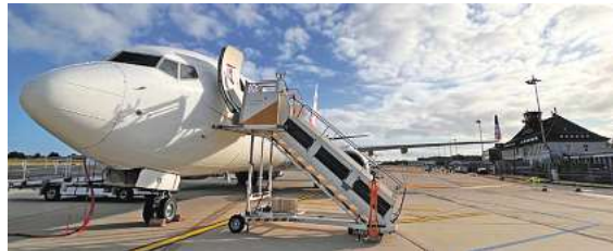
Fliegen ab Braunschweig: Urlaub fast ab Haustür

Den Katalog, weitere Informationen und Buchungsmöglichkeit dieser exklusiven Angebote unter www.fliegen-ab-braunschweig.de , in vielen Reisebüros oder unter der kostenfreien (aus dem dt. Festnetz) Buchungshotline T. 08 00 / 38 300 38 (Mo-Fr. 9 – 18, Sa. 9 – 13 Uhr).