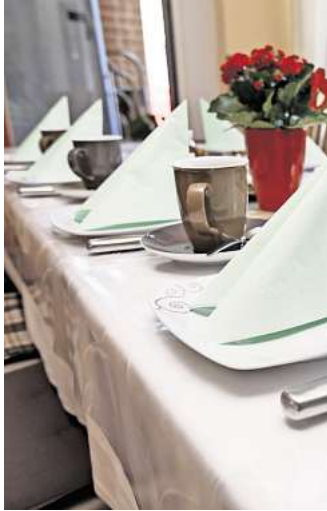
Umfrage: Wie viel würden Sie für eine Tasse Kaffee bezahlen?