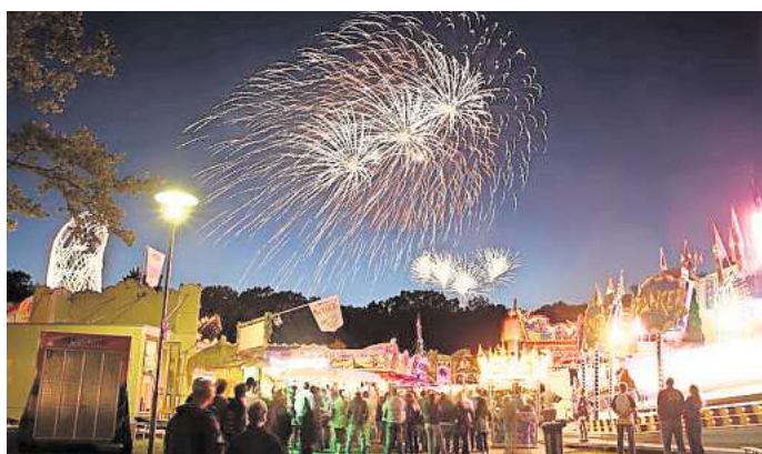
Feuerwerk zum Abschluss des Gifhorner Schützenfestes: Das wird es in diesem Jahr nicht geben.

Geplant sind hingegen vier Tage Spaß und Trubel auf dem Festplatz: Ob es auf dem Rummel etwas Neues gibt, kann die Stadt noch nicht offiziell verkünden. „Da sind unsere Lippen noch versiegelt“, laut Sprecher Frank