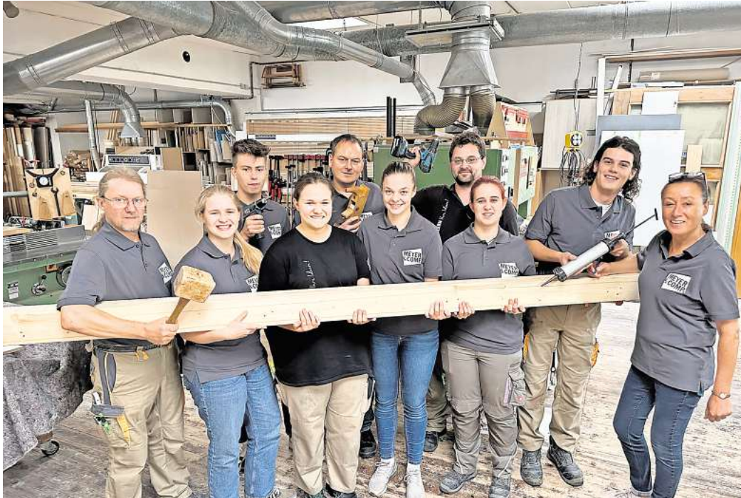
Frauen im Bauhandwerk: In der Tischlerei Meyer & Comp. in Velpke ist die Hälfte der Belegschaft weiblich.