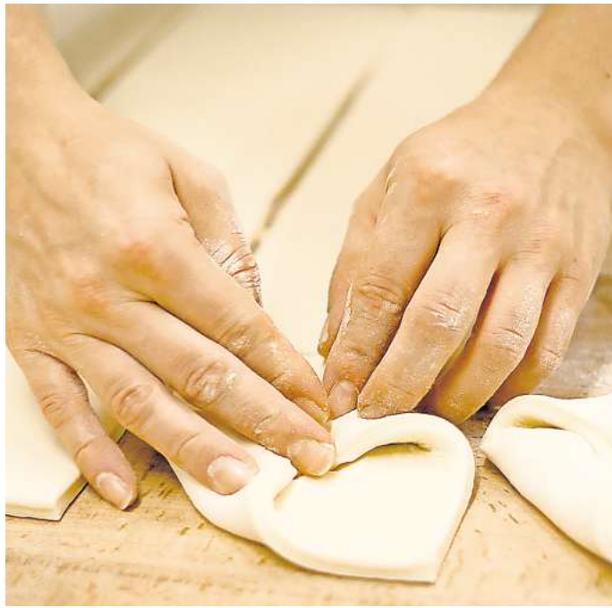
Backen lernen lohnt sich wieder: Bäckerei-Azubis bekommen künftig deutlich mehr Geld für ihre Arbeit.

Für die „Azubi-Tarife“ gelte nämlich eine Allgemeinverbindlichkeit. Dafür habe sich die Gewerkschaft NGG zusammen mit dem Zentralverband des Deutschen Bäckerhandwerks beim Bundesministerium eingesetzt. „Die Branche startet damit eine ‚Azubi-Offensive‘. Und das ist auch dringend notwendig. Denn nur so haben die Bäckereien im Kreis Gifhorn überhaupt die Chance, Nachwuchs zu bekom-