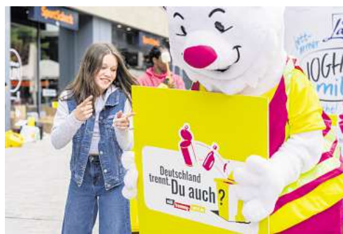
Bei der Aktion „Deutschland trennt. Du auch?“ zeigt auch der fröhliche Trenn-Bär, wie richtige Abfalltrennung funktioniert.

Als Trennbotschafterinnen und Trennbotschafter geben viele Abfallberaterinnen und Abfallberater der Aktion „Deutschland trennt. Du auch?“ in ihrer Stadt persönlich ein Gesicht – zum Beispiel auf Plakaten. Die Initiative „Mülltrennung wirkt“ begleitet die Aktionswochen außerdem mit einer bundesweiten Werbe- und Social-Media-Kampagne. So bekommen die Abfallberatungen prominente Unterstützung lokaler Influencer. Gesicht zeigen können auch die Bürgerinnen und Bürger selbst: Mit einem Selfie vor der XXL-Verpackung und dem Hashtag #wertrenntgewinnt können sie am bundesweiten Social-Media-Gewinnspiel von „Deutschland trennt. Du auch?“ teilnehmen und mit etwas Glück einen von vielen Preisen gewinnen.