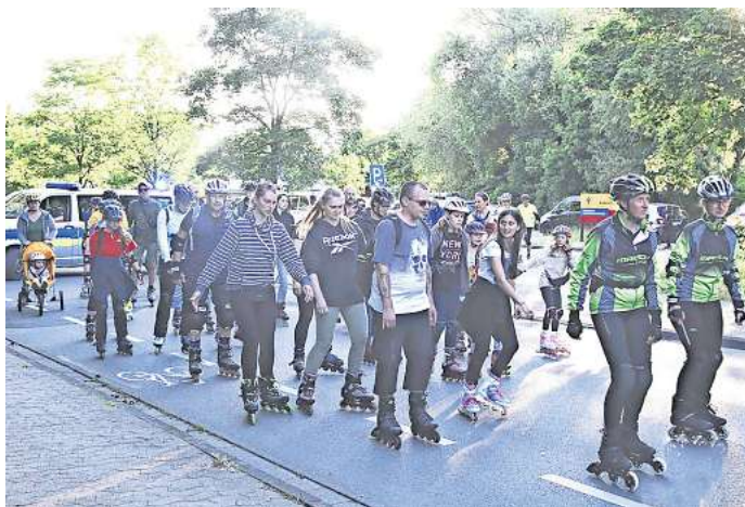
Rasanter Spaß für die ganze Familie: Stadt Gifhorn und MTV Gifhorn laden zur 28. Skate-Night quer durch die Stadt ein.