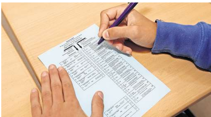
Am 9. Juni ist Europawahl: Wissen Sie schon, wen Sie wählen werden?

Wir würden in diesem Zusammenhang gerne von Ihnen wissen: Haben Sie sich schon entschieden, wen Sie am 9. Juni wählen werden? Oder sind Sie noch unentschieden und nutzen Entscheidungshilfen wie den Wahl-O-Mat? Machen Sie mit bei unserer Umfrage und sichern sich die Chance auf einen 50-Euro-Gutschein von Expert. Was Sie dafür tun müssen? Gehen Sie einfach auf unsere Umfrageseite und geben dort Ihre Stimme ab. Scannen