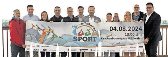
Freuen sich auf das bevorstehende Event Anfang August: Veranstalter und Sponsoren hoffen auf viele Aktive und viele Zuschauernde.

Weitere Infos zu „Sport am Tankumsee“ gibt es unter www.sport-am-tankumsee.de – hier sind auch die Anmeldungen bis 15. Juli möglich.