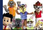
PAW PATROL UNITED KIDS FOUNDATIONS- FAMILIENTAG Sonntag, 07. Juli