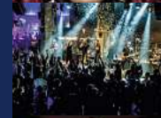
LADIES NIGHT GOODFELLAS Donnerstag, 11. Juli