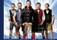
KÖNIGLICH BAYERISCHES VOLL-GAS ORCHESTER "SOMMER WIES'N" Dienstag, 09. Juli