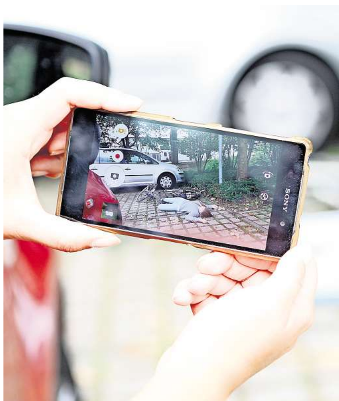
Schnell geknipst und hochgeladen: Schaulustige mit Smartphones werden zunehmend zu einem Problem.

Von Schaulustigen lassen sich Gifhorns Feuerwehrleute nicht irritieren, sagt Michel. Während des Einsatzes seien sie auf ihre Aufgaben fokussiert. Ärgerlich werde es, wenn später irgendwo im Internet unerwünschtes Bildmaterial auftauche.