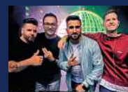
AFTER-WORK-PARTY DJ ALLSTARS Donnerstag, 04. Juli