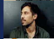
MAX GIESINGER SOMMERTOUR 2024 Samstag, 06. Juli