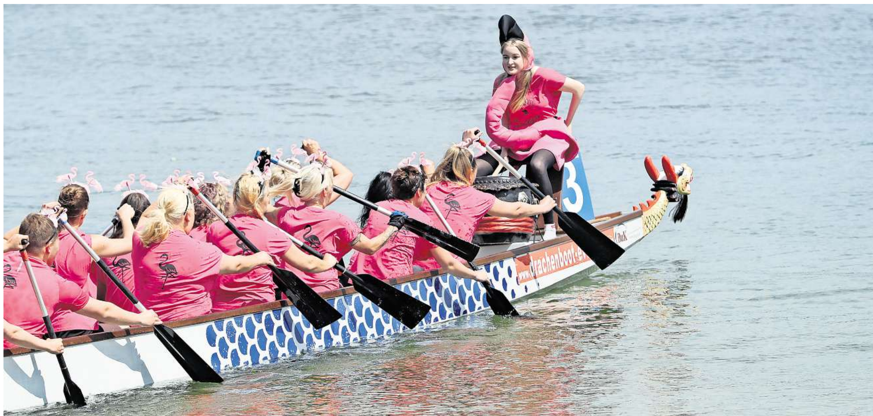
Die Drachenboot-Regatta ist zweifelsfrei das Highlight des Events „Sport am Tankumsee“, das in diesem Jahr am Sonntag, 4. August, steigt.