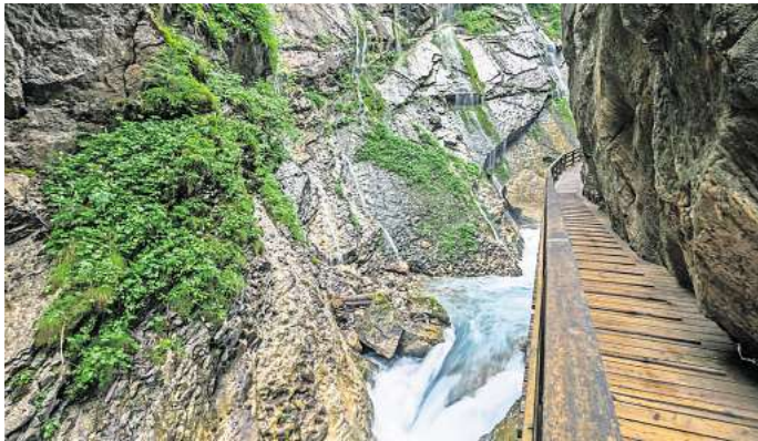
Die Wimbachklamm macht Naturgewalten hautnah erlebbar.

Die Wimbachklamm in Ramsau liegt im Nationalpark Berchtesgaden und versprüht wilde Romantik. Bereits 10.000 Jahre alt ist die beeindruckende Klamm. Wer die 200 Meter lange Schlucht passiert und Richtung Wimbachschloss wandert, absolviert eine insgesamt neun Kilometer lange Wanderung. Brücken und Stege ermöglichen von