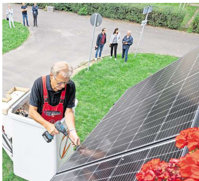
Montage-Arbeiten an einem Balkonkraftwerk.

„Durch die oben beschriebene neue gesetzliche Regelung im Zuge des Solarpakts ist dies künftig noch einfacher. So bedarf es künftig lediglich der Meldung/Registrierung im Marktstammdatenregister der