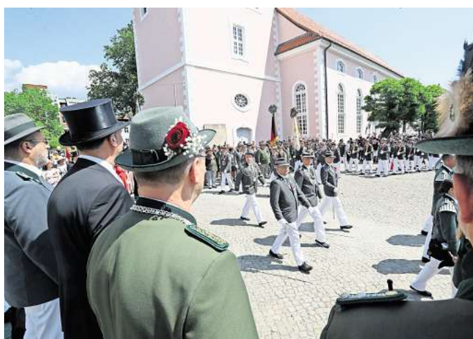
Einer der Höhepunkte des Gifhorer Schützenfestes ist der große Umzug der Gifhorer Schützen, Vereine und Verbände durch die Innenstadt.

Nach dem Antreten der Teilnehmer des großen Festumzuges – neben den Schützinnen und Schützen von USK und BSK sind auch zahlreiche Gifhorer Vereine und Verbände dabei – startet um 14 Uhr der große Festumzug durch die Stadt. Die Marschierenden freuen sich auf viele Zuschauer entlang der Route (Marktplatz, Marsch um die St.-Nicolai-Kirche, Konrad-Adenauer-Straße