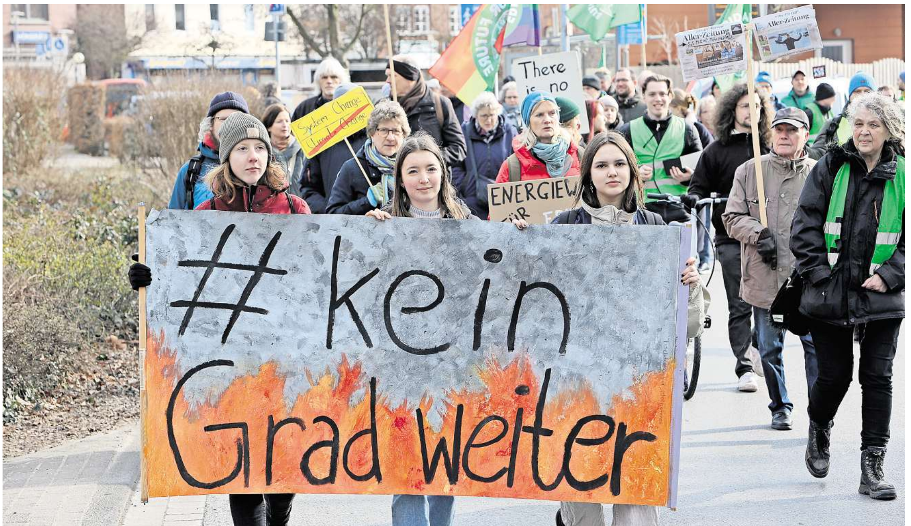
Viele Krisen: Laut Sinus-Jugendstudie bereiten Klimawandel, Kriege, Diskriminierungen und Rassismus jungen Leuten Sorgen.