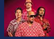
CULCHA CANDELA FINALE PARTY Samstag, 13. Juli