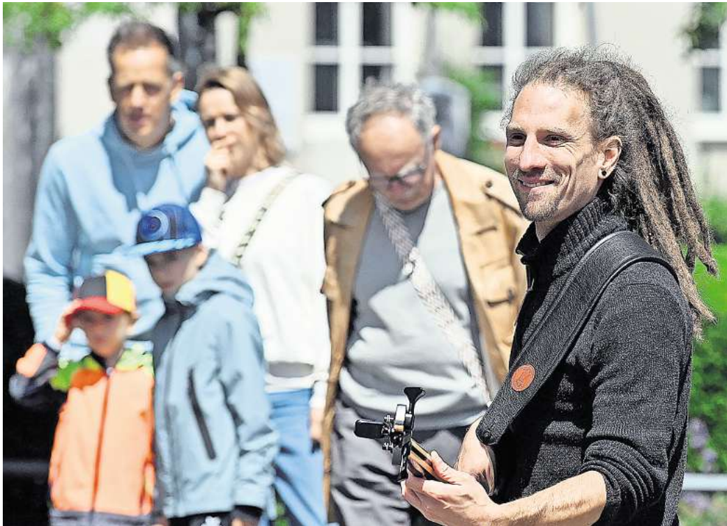
Bereits zum elften Mal rockte Gifhorns Straßenmusikfestival jetzt die Fußgängerzone.

Die Verschiebung tat dem Event aber keinen nennenswerten Abbruch, hatten doch unter