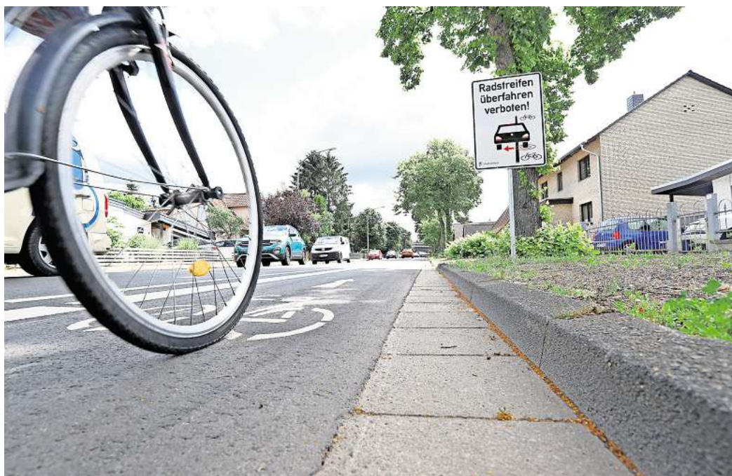
Radfahren auf der Fahrbahn: Beim Fahrradstreifen auf der Celler Straße dürfen Autofahrer die durchgezogene Linie nicht überqueren.