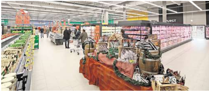
Steigende Preise bei Lebensmitteln: Sahra Wagenknecht sieht darin ein deutliches Versagen der Ampel-Regierung.

Wir würden gerne von Ihnen wissen: Wie stark sind Sie von den steigenden Lebensmittelpreisen betroffen? Nehmen Sie