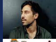
MAX GIESINGER SOMMERTOUR 2024 Samstag, 06. Juli