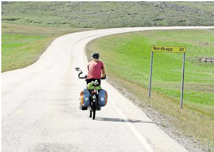
Aktivurlaub oder Strand-Erholung: Welcher Urlaubstyp sind Sie?

In der vergangenen Woche wollten wir von Ihnen wissen: Wie stark sind Sie von steigenden Le-