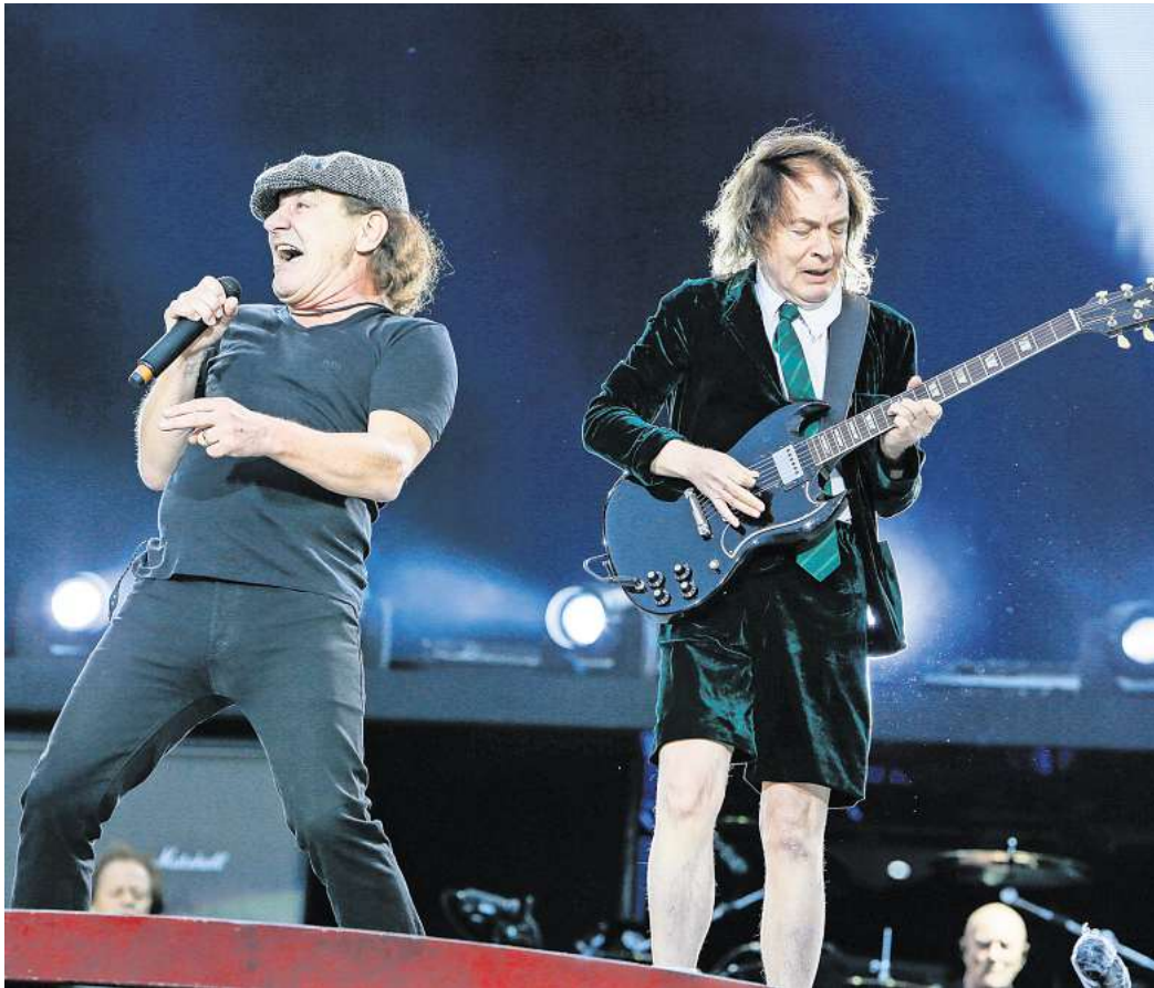
Vor neun Jahren: 2015 haben AC/DC ebenfalls auf dem Messegelände in Hannover gespielt. Hier rocken Brian Johnson (links) und Angus Young die Bühne.

So riesig die Euphorie war, so schnell folgte auch die große Enttäuschung: Der erste Termin am