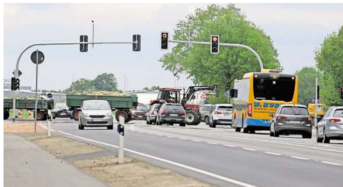
Sommer-Baustelle Tankumsee-Kreuzung: Hier entstehen an der Tangente noch zwei Bushaltestellen. Eine Vollsperrung wird dafür nicht nötig sein.

Noch keinen konkreten Termin gibt es für die etwa vierwöchige Erneuerung des Radwegs an der K7 zwischen Oerrel und der K5. Die Deckenerneuerung im Kreisels K45/K46 zwischen Leiferde und Volkse soll im Oktober starten und etwa zwei Wochen dauern. Ebenfalls ab Oktober baut der Landkreis zwischen Brome und der Landesgrenze entlang der K94 reinen Radweg.