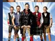
KÖNIGLICH BAYERISCHES VOLL- GAS ORCHESTER "SOMMER WIES'N" Dienstag, 09. Juli