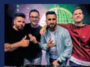
AFTER-WORK-PARTY DJ ALLSTARS Donnerstag, 04. Juli