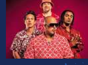
CULCHA CANDELA FINALE PARTY Samstag, 13. Juli