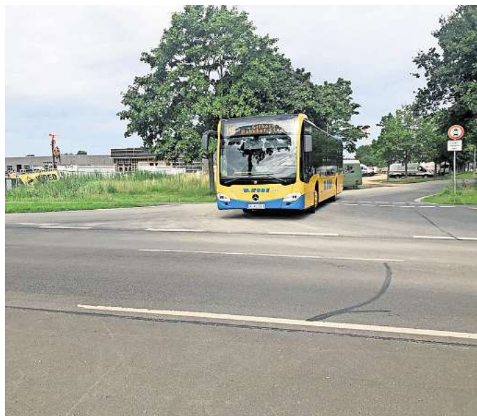
Nächste Baustelle unter Vollsperrung: An der L414 zwischen Meinersen/Ahnsen und Seershausen wird die Zufahrt zur künftigen Förderschule Geistige Entwicklung umgestaltet.