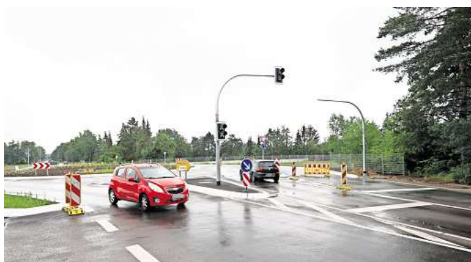
Darüber rätseln viele Gifhorer: Was soll die Ampel am neuen Kreisel der Tangente mit der Wolfsburger Straße?

Verkehr aus Wolfsburg kommend, der in die Wolfsburger Straße abbiegen will, wird Vorfahrt haben vor jenem Verkehr auf der Tangente, der aus Norden kommt. Eine Verkehrssimulation habe ergeben, dass sich zu Stoßzeiten lange Rückstaus bilden würden, weil der Verkehr aus Norden kommend warten müsste und nicht mehr abfließen würde, so Landkreis-Sprecherin Anja-Carina Riechert. Die Konsequenz: Warten bis sich eine Lücke im vorfahrberechtigten Kreisel-Verkehr bildet – und dann kämen nur einzelne Fahrzeuge durch. Laut Sprecherin Annette Siemer rechnet die Stadt Gifhorn damit,