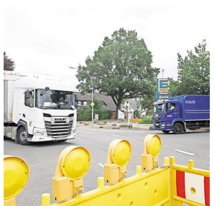
Westerbecks Kreuzung mal eben über das Einkaufszentrum umfahren? Das wird nicht klappen. Edeka teilt den Parkplatz, so dass er von Ringstraße und Dannenbütteler Weg aus erreichbar bleibt, aber keine Durchfahrt möglich ist.