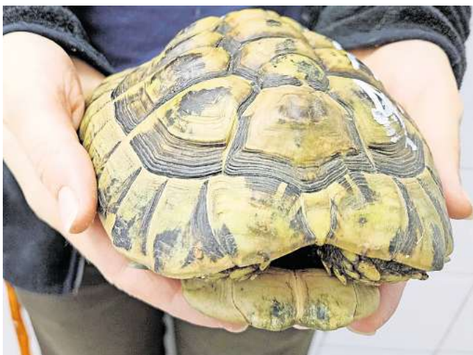
Eines der Fundtiere: Die Griechische Landschildkröte wurde in Hillerse aufgegriffen.

So wurde am Freitag, 21. Juni, in Hillerse auf der Rolfsbütteler Straße eine Griechische Landschildkröte aufgegriffen. Am Donnerstag, 20. Juni, wurde im Wasbütteler Sandweg eine Vierzehenschildkröte gefunden und am gleichen Tag wurden in einem Pappkarton, neben einer Mülltonne, zwei weitere Vierzehenschildkröten in Braunschweig, Siegfriedstraße, entdeckt.