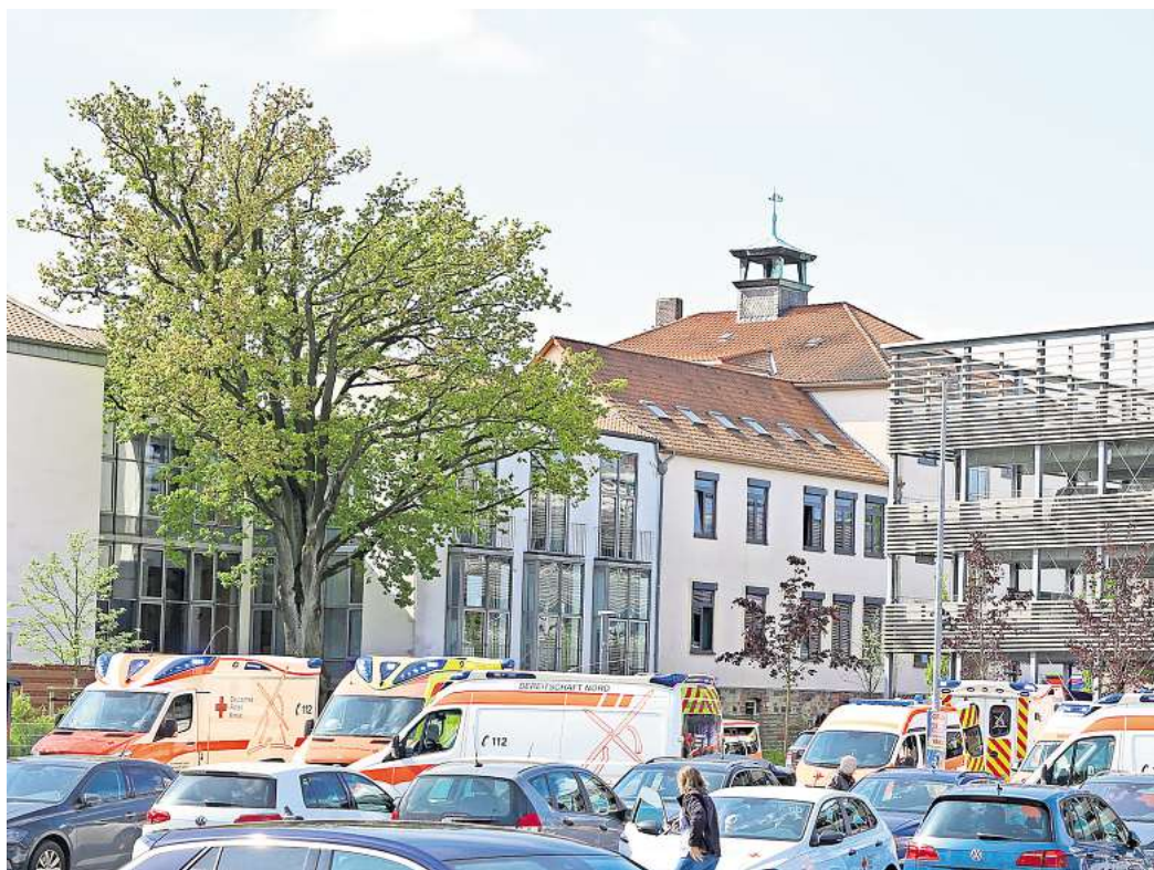
Großeinsatz am 22. April in Gifhorn: Nach einem Böller-Knall an der Freiherr-vom-Stein-Schule ermittelt die Staatsanwaltschaft inzwischen gegen drei Jugendliche.

Wie konnte ein Böller ein solches Aufkommen an verletzten Schülern verursachen? Auch da winkt Wotschke ab. Ihr liegen demnach noch keine genauen Erkenntnisse vor, um was für einen Sprengkörper es sich gehandelt hat. Nach einer ersten Einschätzung eines von der AZ befragten Experten aus dem Kreis Gifhorn dürfte es sich entweder um „Marke Eigenbau“, einen unsachgemäß verwendeten Profi-Feuerwerkskörper höherer Klasse oder einen in Deutschland nicht zugelassenen Böller aus dem Ausland gehandelt haben.