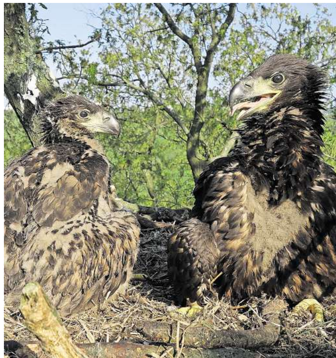
Junge Seeadler im Horst: So ein Exemplar des streng geschützten Wappentieres Deutschlands starb jetzt in Folge der Fällung eines Horstbaums bei Pollhöfen. Das Entsetzen unter Tierfreunden ist groß.