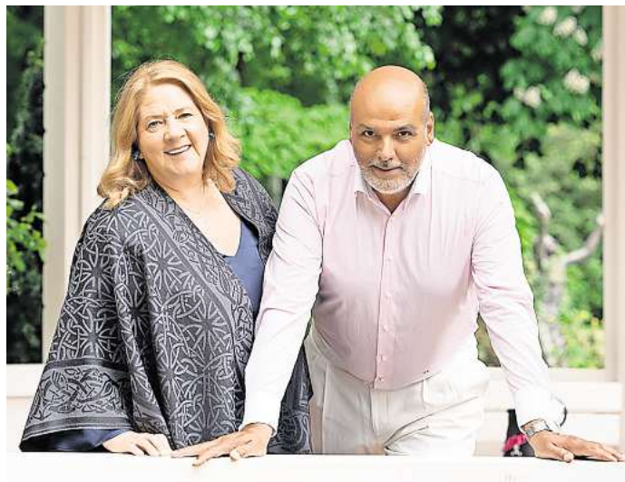
„Glaub an dich“: Kathy Kelly und Jay Alexander machen im Rahmen ihrer Deutschlandtournee auch Station in Gifhorn.

Die Tickets für dieses Konzert-Highlight sind ab sofort erhältlich, und zwar online unter www.eventim.de oder www.reservix.de sowie an allen bekannten Vorverkaufsstellen.