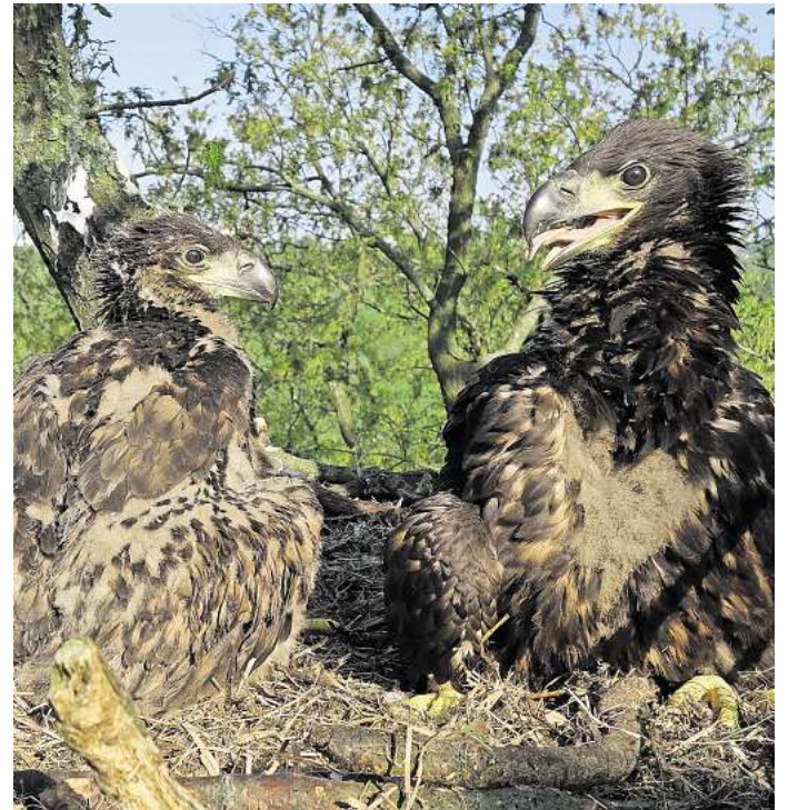
Junge Seeadler im Horst: So ein Exemplar des streng geschützten Wappentieres Deutschlands starb jetzt in Folge der Fällung eines Horstbaums bei Pollhöfen. Das Entsetzen unter Tierfreunden ist groß.