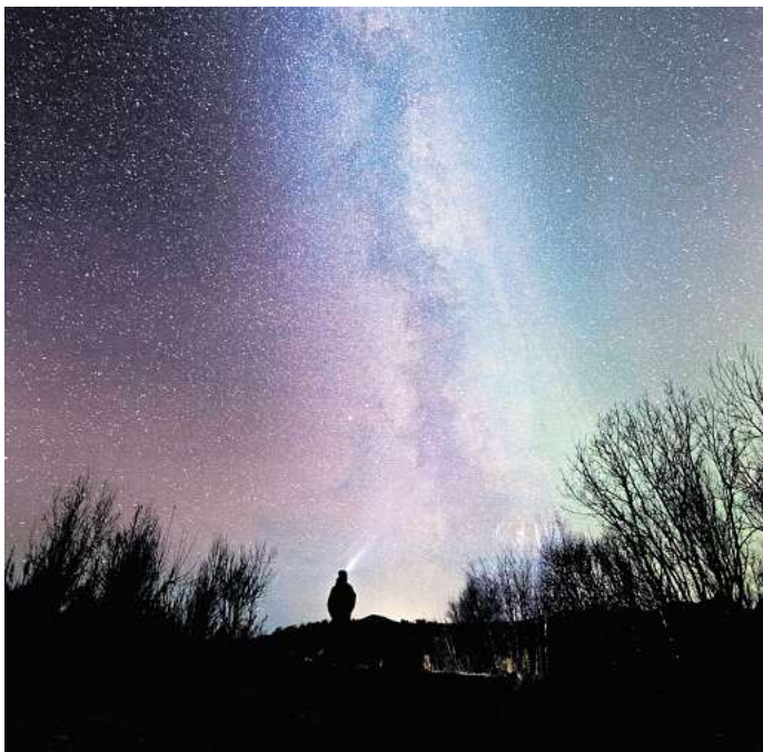
Existiert außerirdisches Leben? Diese Frage beschäftigt die Menschen schon seit Jahrtausenden.

Schon, aber wir haben nicht richtig geguckt. Die Leute glauben,