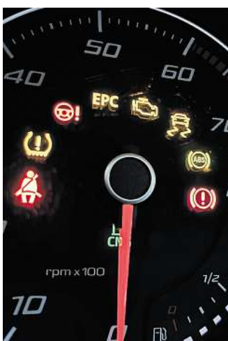
Warnleuchten im Tachometer: Viele Assistenzsysteme sind für Neuwagen in der EU nun Pflicht.

Die Systeme können mit Fehlalarmen für Irritationen sorgen, wenn zum Beispiel Verkehrsschilder nicht oder falsch erkannt wurden. Im Gefahrenfall ist die Technik dagegen schlichtweg schneller als der Mensch. Eine vom Auto eingeleitete Notbremsung im Stadtverkehr oder die Warnung vor einem Wagen im toten Winkel beim Spurwechsel hat sicher schon einige Fahrer vor einem