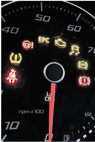
Warnleuchten im Tachometer: Viele Assistenzsysteme sind für Neuwagen in der EU nun Pflicht.

Die Systeme können mit Fehlalarmen für Irritationen sorgen, wenn zum Beispiel Verkehrsschilder nicht oder falsch erkannt wurden. Im Gefahrenfall ist die Technik dagegen schlichtweg schneller als der Mensch. Eine vom Auto eingeleitete Notbremsung im Stadtverkehr oder die Warnung vor einem Wagen im toten Winkel beim Spurwechsel hat sicher schon einige Fahrer vor einem