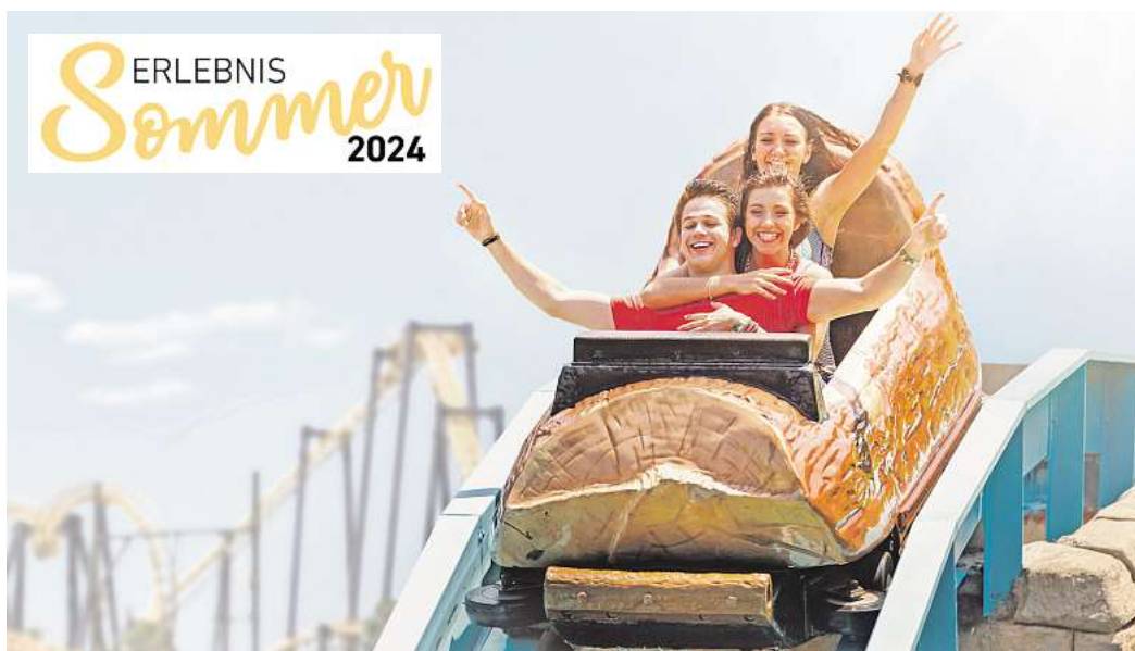
Das Abenteuer ruft, günstige Ticketpreise locken: Der „Erlebnissommer 2024“ bietet erneut jede Menge Freizeitspaß für wenig Geld.

Die Tickets sind (nur solange der Vorrat reicht) online unter www.erlebnissommer-tickets.de erhältlich.