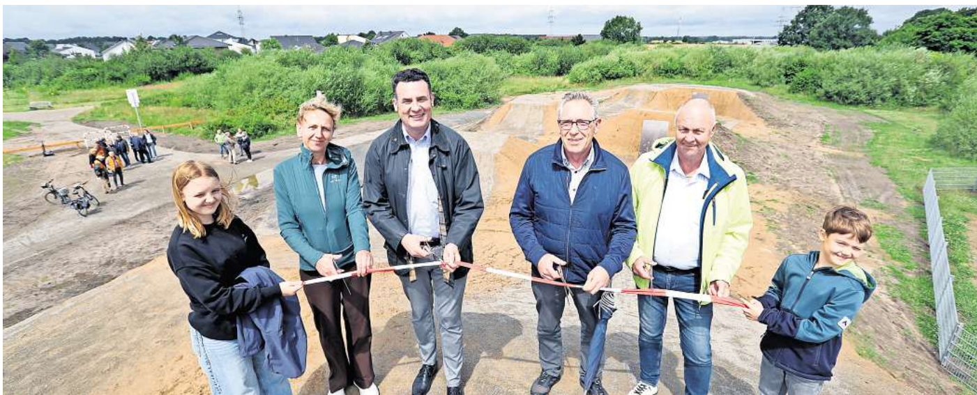
Verspricht jede Menge Action für wagemutige Zweiradfahrer: Gifhorns neuer Dirt Bike Park in Gamsen ist eröffnet.

Wer nur zuschauen möchte: In Kürze sollen an dem Gelände zwei Bänke entstehen. Nerlich freut sich über das neue Angebot für Jugendliche, „das vielleicht ja auch Nutzer aus der Region anlockt“.