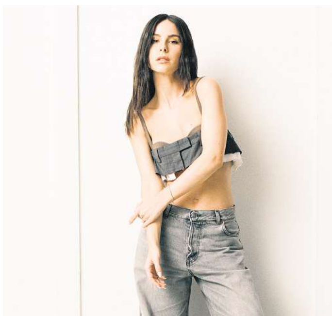
Seien Sie dabei: Lena tritt am 20. Juli in der Autostadt auf. Die AZ/WAZ verlost für das Konzert ein Ticketpaket mit zwei Eintrittskarten.

Die AZ/WAZ verlost einmal zwei Tickets für das Konzert und der glückliche Gewinner oder die glückliche Gewinnerin erlebt gemeinsam mit einer Begleitperson die unbändige Freude und Leidenschaft, die diese Ausnahmekünstlerin auszeichnet, live und hautnah! Was Sie dafür tun müssen? Über den abgedruckten QR-Code beziehungsweise über die Internetadresse aktion.waz-online.de/angebot/lena gelangen Sie direkt auf die Online-Gewinnspielseite, wo Sie Ihre Kontaktdaten hinterlassen können. Mit ein bisschen Glück wird Ihr Name gezogen.